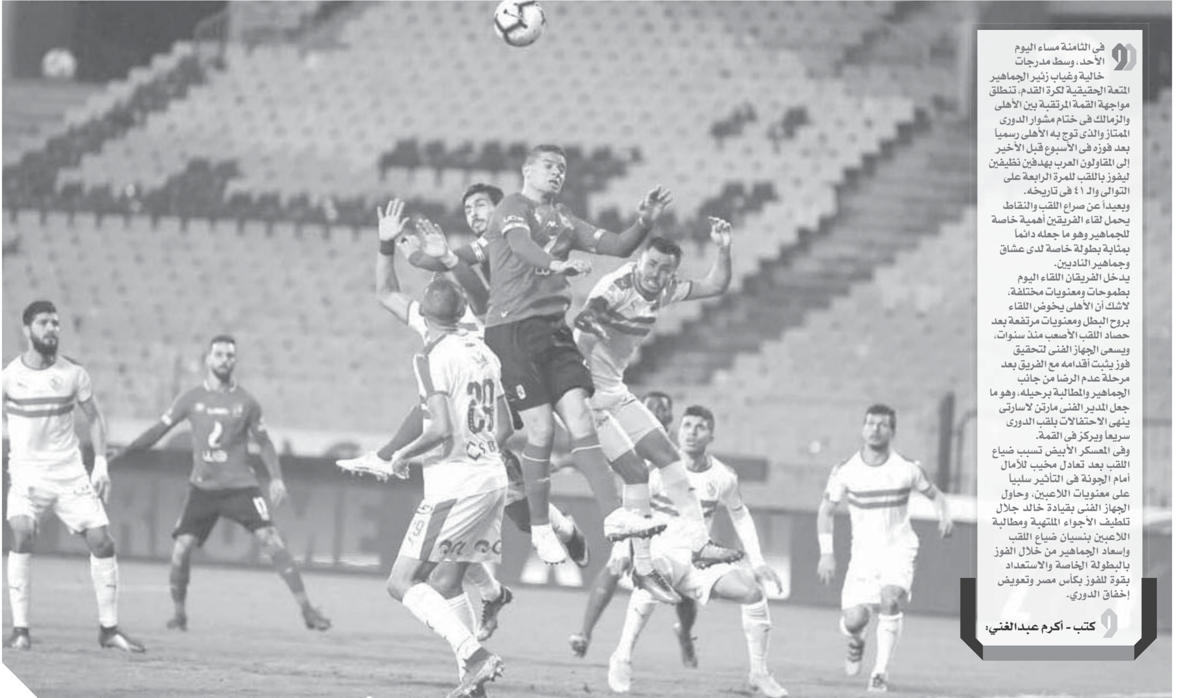
الليلة صراع خاص بين الأهلي والزمالك في القمة ١١٨

في الثامنة مساء اليوم الأحد، وسط مدرجات خالية وغياب زئير الجماهير المنعة الحقيقية لكرة القدم، تنطلق مواجهة القمة المرتقبة بين الأهلي والزمالك في ختام مشوار الدوري الممتاز والذي توج به الأهلي رسمياً بعد فوزه في الأسبوع قبل الأخير إلى المقاتلون العرب بهدفين نظيفين ليغزوا باللقب للمرة الرابعة على التوالي والـ ٤١ في تاريخه. ويعيداً عن صراع اللقب والتقاط يحمل لقاء الفريقين أهمية خاصة للجماهير وهو ما جعله دائماً بمثابة بطولة خاصة لدى عشاق وجماهير النادييين. يدخل الفريقان اللقاء اليوم بطموحات ومعنويات مختلفة، لاشك أن الأهلي يخوض اللقاء بروح البطل ومعنويات مرتفعة بعد حصد اللقب الأصعب منذ سنوات، ويسعى الجهاز الفني لتحقيق فوز يثبت أقدامه مع الفريق بعد مرحلة عدم الرضا من جانب الجماهير والمطالبة برحيله، وهو ما جعل المدير الفني مارتن لاسارتى ينهى الاحتفالات بلقب الدوري سريعاً ويركز في القمة. وفي المسكر الأبيض تسبب ضياع اللقب بعد تعادل مخيب للأمال أمام الرجوة في التأخير سلباً على معنويات اللاعبين، وحاول الجهاز الفني بقيادة خالد جلال تلطيف الأجواء المتهتية ومطالبة اللاعبين بنسيان ضياع اللقب واسعاد الجماهير من خلال الفوز بالبطولة الخاصة والاستعداد بقوة للفوز بكأس مصر وتعويض إخفاق الدوري.