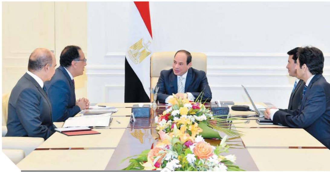
الرئيس خلال لقائه رئيس الوزراء ووزير الشباب

وأضاف المتحدث الرسمى أن وزير الشباب والرياضة عرض خلال الاجتماع تقريراً عن الجهود الجارية لتطوير المنظومة الكروية المصرية على جميع المستويات، ومستجدات تنفيذ مشروع رعاية الموهوبين فى كرة القدم، الذى يهدف لانتقاء أفضل المواهب الكروية من جميع أنحاء مصر.