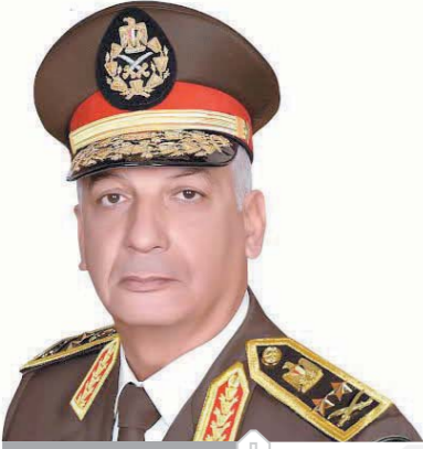
فريق أول محمد زكي

كتب: محمد صلاح وأبو زيد كمال وسامية فاروق: