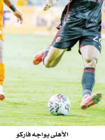
الأهلى يواجه فاركو