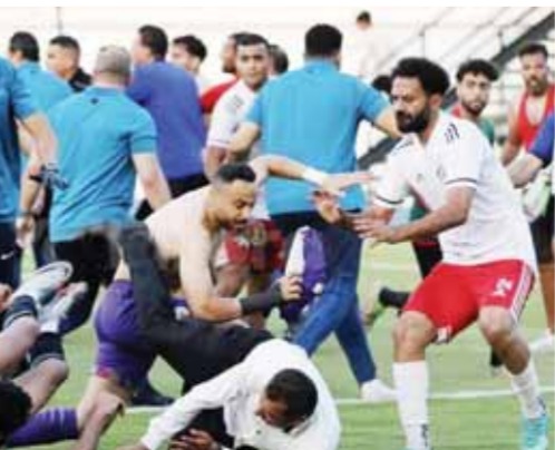
خنافة بالأيدي والأقدام بين لاعبي الفريقين

كثبت - سارة جاب الله: شهد ملعب استاد المكس بالإسكندرية يوم الأربعاء الماضي حرب شوارع عقب نهاية مباراة سبورتنج وحرس الحدود في الدورة الرباعية المؤهلة للدوري الممتاز. وتأهل فريق حرس الحدود إلى الدوري الممتاز بعدما حقق الفوز على سبورتنج بهدفين مقابل هدف، واحتل الصدارة برصيد ١٢ نقطة، فيما تجرد رسيد سبورتنج عند النقطة الثامنة، ولم يغب حرس الحدود طويلا عن دوري الأضواء الشهرية، حيث تواجد في برصيد الماضي ٢٠٢٢-٢٣ الذي احتل فيه المركز الأخير برصيد ٢٥ نقطة، ليشارك في دوري المحترفين في موسم ٢٠٢٣-٢٤.