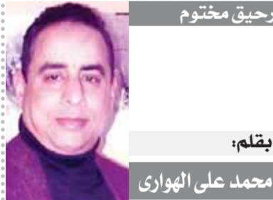
بقلم: محمد على الهواري

وتعاني مؤسسات التعليم العام في معظم البلدان الأفريقية من أزمات مستمرة بسبب شح التمويل الحكومي والبيئة الاقتصادية السيئة التي يعيشها المعلمون في معظم بلدان أفريقيا. وبسبب ضعف الأنفاق الحكومية يعاني الطلاب في معظم البلدان الأفريقية من نقص الكتاب المدرسي والمعلم. وهذا لا يحدث عن التعليم في مصر لأن الظروف التي تعيشها مصر أفضل بكثير من الدول الأفريقية من جميع النواحي، ولكنني أردت من تسليط الضوء على أزمة التعليم في أفريقيا كنوع من التمهيد لما أتى يتحدث به. إن دور مصر الريادي نحو الأشقاء الأفارقة لا ينكسر سوى جاحد.. فأهزاه الشريف منارة العلوم الإسلامية في بصمات واضحة على مر العصور في تعليم الشناوي الأفريقي من جميع الدول الأفريقية المسلمة أصول الدين الإسلامي ليعودوا إلى بلدانهم الأصلية محملين بأفكاره التنويرية من ساحة الإسلام. لذلك أقتصر على الحكومة المصرية افتتاح جامعة كبيرة في الأقصر أو أسوان تسمى الجامعة الأفريقية، تستضيف طلاب من جميع الدول الأفريقية.. وتشمل الجامعة كليات الطب والجراحة وطب الأسنان والعلاج الطبيعي والصيدلة والصيدلة الكليتيكية والهندسة بكافة تخصصاتها والحاسبات والمعلومات والذكاء الاصطناعي والتجارة والحقوق والفنون الجميلة، وبعد الدراسة التي تعتبر منحة من الدولة المصرية لتعليم أبناء البلدان الأفريقية على أراضيها ليعودوا مسلحين بالمعلم الحديث وقيادة بلدانهم نحو المستقبل الواعد.