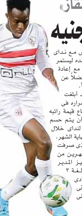
حرس الحدود وسبورتنج

يقرع دراكولا تل أبيب جيلوب الحرب الشاملة ضد حزب الله ويهدد بتدمير بيروت الجميلة على غرار ما حدث في غزة الصامدة، وهو ما دفع دول عربية وحتى عربية لإجراء عملياتها على وجه السرعة استجابة لمعلومات استخباراتية مؤشورة بأنها ليست مناقشات عابرة والأمز جد خطير وثمة مؤشرات لا تخفيها حقا جيسميا إذ بداية المرحلة الثالثة من العدوان وفقا لخطة C، أو ما يسمى بعملية قصف العشب وهي تتركز على إعادة التوضيع التكتيكي ونقل الوحدات القتالية الإسرائيلية من غزة إلى الحدود مع لبنان وهو ما استدعى إنهاء العمليات العسكرية في رفح بعدما وصلت إلى طريق مسدود يستدرف جيش الاحتلال الذي يواجه حرب عنصابات شرسية بالإضافة لتصريحات هتيرية على جميع المناسبات الاسباعية فدعت وزير الدفاع جالنت إلى الذهاب صوب واشنطن لطلب الدعم السياسي والعسكري لضمان تأمين المعدات والذخائر العسكرية لحرب قد تطول شهر أو سنوات، ربما يكون هذا كلامه الحرب في يد الحكومة المتطرفة لا بتناكيد كلمة الهابية ليست بعيدا إذ يظن الهواة من صفوف الأحزاب الصهيونية في رفح وسومرتيش اللذان لم يحارفا منذ حزب الله الثمة سائلة وستكون زهرة خامطة تستغرق أسابيع.