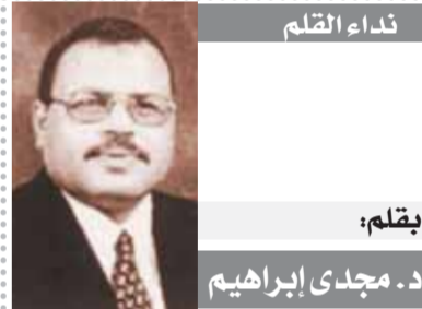
بقلم: د. مجدى إبراهيم