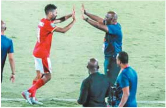
الأهلي يحتفل بعبور الترجي والتاهل لنهاى دورى الأبطال