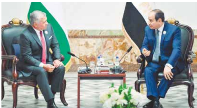
لقاء القمة بين السيسي وعبدالله