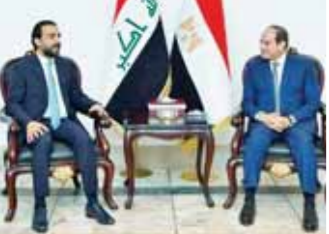
الرئيس عبدالفتاح السيسي لدى استقباله رئيس البرلمان العراقي

كتب - ناصر عبدالحميد: التقى الرئيس عبدالفتاح السيسي، أمس، في العاصمة العراقية بغداد، محمد الحليوس، رئيس مجلس النواب العراقي. وصرح السفير بسام راضي المتحدث الرسمي باسم رئاسة الجمهورية بأن الرئيس أكد قوة ومتانة العلاقات الثنائية التي تجمع مصر والعراق على مختلف المستويات وتقدير مصر حكومة وشعباً للعراق الشقيق ودوره المركزي في المنطقة المستند على تاريخ وحضارة عريقة ممتدة، وحرص مصر على مواصلة العمل على تعزيز وتطوير التعاون بين البلدين الشقيقين في جميع المجالات، خاصة على الصعيد البرلماني، أخذاً في الاعتبار ما يساهم به ذلك في تعزيز التواصل بين الجانبين على المستويين الرسمي والشعبي.