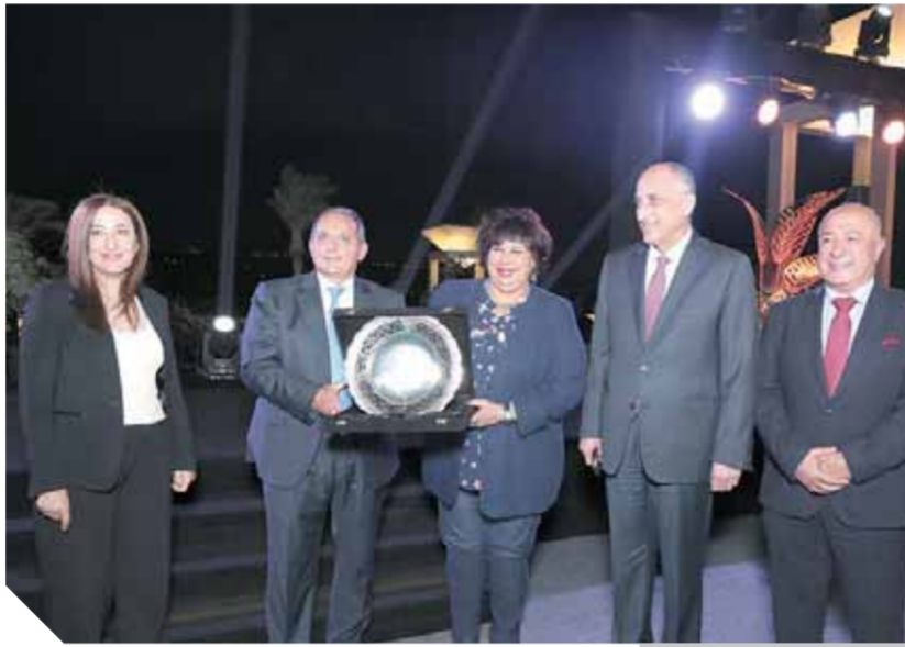
قيادات البنك الأهلي السابقة والحالية خلال الاحتفالية

مضيفاً أنه في المرحلة التالية سيقوم الفنانون الذين تم اختيارهم برسم البورتريهات وذلك استعداداً للإعلان عن الفائزين في أكتوبر القادم ثم إقامة معرض وكذلك تنفيذ كتالوج فني للأعمال الفائزة والمشاركة في المسابقة. وتم اختيار المتحف القومي للحضارة المصرية للاحتفال لما يرمز إليه من قيم ثقافية وتاريخية عظيمة تمثل حضارة مصر عبر آلاف السنين حتى الآن حيث تمثل هذه المبادرة استمرارية لهذه المسيرة الخالدة.