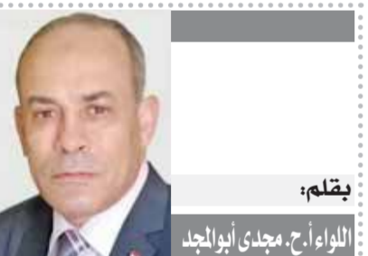
بقلم: اللواء أ.ح. مجدى أبو الجند