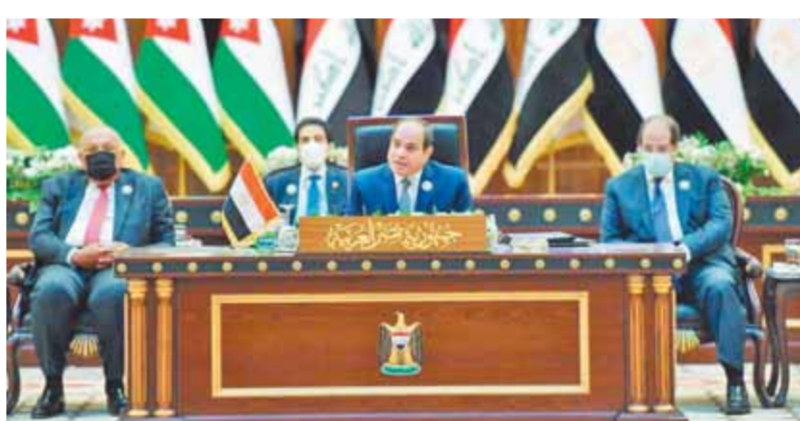
الرئيس خلال إلقاء كلمته فى القمة

القادمة إلى مرحلة التنمية المستدامة والرخاء لشعوبنا، فضلاً عن المساهمة في دعم العمل المشترك والعمل على صيانة الأمن القومى العربى، فمصر تسمى لخير المنطقة وشعوبها وتمتد دائماً جسور التعاون والإخاء لميحطها العربى». وأضاف: «من هذا المقام، فإننى أعيد التأكيد على قوة التعاون الثلاثى بين دولنا وما يحظى به هذا الأمر من أولوية متقدمة لدينا وما نوليه له من أهمية قصوى، ولذلك فإننا نسعى، وكلنا ثقة بأن هذا الأمر يشكل هدفاً مشتركاً لجميع، إلى تجسيد التعاون الثلاثى بيننا ووضع موضع التنفيذ على أرض الواقع من خلال الشروع فى تنفيذ حمزة المشروعات الاستراتيجية التي تم الاتفاق عليها، وذلك مع إدراكنا للظروف الراهنة المرتبطة بتشى جائحة كورونا وما صاحبها من إجراءات احترازية وتدابير اقتصادية». وأردف السيسى: «وتأكيداً على إيمان مصر بوجود التعاون والتكاتف بين بلداننا الشقيقة، التاريخية التي يحضنها العراق، والتي تاتي استكمالاً لما تحقق خلال قمتي القاهرة وعمان، نأمل أن تكون بحق تشديداً لمرحلة جديدة من الشراكة الاستراتيجية والتعاون الوثيق بين بلداننا سعيًا نحو الانطلاق خلال السنوات