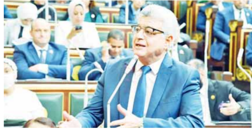
وهدان وأبازة يشيدان بجهود القوات المسلحة في نجاح ثورة ٣٠ يونيو