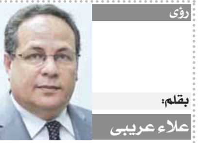
بقلم: علاء عربي