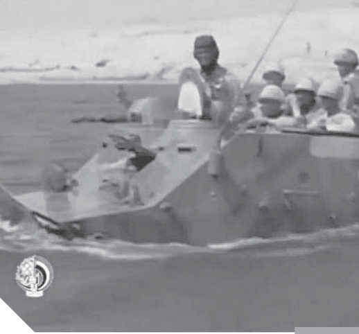
البحرية المصرية أدت دوراً بطولياً في حرب أكتوبر

وأشار اللواء أحمد، إلى أن جميع ضباط القوات المسلحة أقسموا بأنهم لن يتروكا سلاحهم حتى الموت وهى عقيدة لديهم، وأنهم وهيو حياتهم للوطن، ولولا الجيش لكانت مصر لقت نفس مصير الدول العربية الأخرى، كما أشار اللواء إلى أن الجيش المصرى بعد أن ذاق مرارة الهزيمة في ٦٧ وشعر بالانكسار، عزم على أن يقاتل في التدريبات ويواصل بالليل بالنهار حتى يسترد أرضه وكرامته.