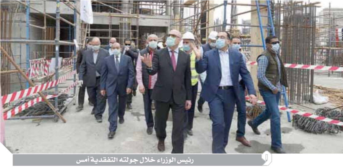
رئيس الوزراء خلال جولته التفقدية أمس

أكد الدكتور مصطفى مدبولي رئيس مجلس الوزراء أن الحكومة عازمة على المضي قدماً بخطة تعويض الضحايا الفترات الماضية بسبب تداقيات فيروس «كورونا» وما يقترن به من إجراءات احترازية وقائية، وأنه يتعين علينا جميعاً في كل مواقع العمل والإنتاج أن نواصل جهداً للأنهاء من تنفيذ جميع المشروعات القومية بأسرع وقت. جاء هذا خلال جولة تفقدية لرئيس الوزراء أمس لمتابعة عدد من المشروعات التي يتم تنفيذها حالياً في مناطق مختلفة بمحافظة القاهرة، ومنها مشروع إنشاء ١٣٤٤ عمارة سكنية بجوار ستاد السلام، وتوتلي تنفيذها وزارة الإسكان كبديل لسككين أهالي مناطق العشوائيات، وكلف رئيس الوزراء بسرعة الانتهاء من المشروع، الذي يعد علامة مميزة لجودة الحياة بالمنطقة.