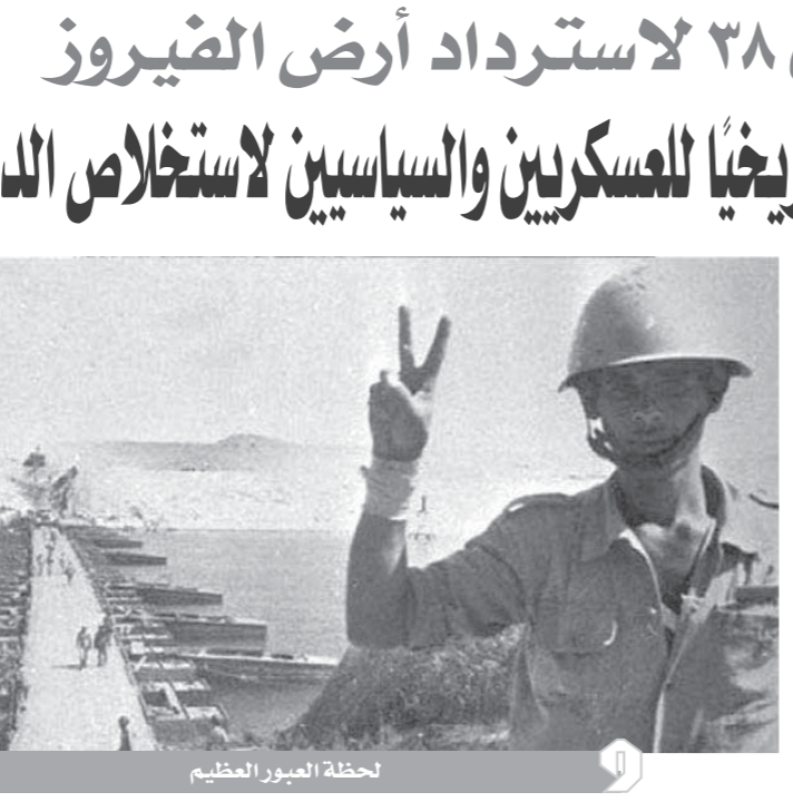
لحظة الصور العظيم

الشحنة، كان رجال حرس الحدود في الانتظار، واستولوا عليها كاملة، وتم عرضها بالجمعيات الاستهلاكية، والإعلان عن مشروع استراتيجى يعبى من ٢٢ إلى ٢٥ سبتمبر، وهو مكر فى خطة التدريب أكثر من مرة سنوياً، وفيه تتم الإجراءات كاملة من تحرك وفتح القوات، وقيامها برفع درجة الاستعداد التصوي للجيش، وإعلان حالة التأهب فى المطارات والقواعد الجوية، مما يضطر إسرائيل لرفع درجة استعداد قواتها، تحسباً لآى هجوم، ثم يعلن بعد ذلك أن كان مجرد تدريب روتينى، حتى جاء يوم ٦ أكتوبر، فظنت المخبرات الإسرائيلية أنه مجرد تدريب آخر، وطالب «الفبارى» بضرورة أن يعرف جيل الشباب كيف تحقق نصر أكتوبر المجيد على الجيش الإسرائيلي الذى لا يقهر، وطالب الأجيال من مختلف المراحل التعليمية الوعى السياسى والاستراتيجى بأهمية حرب أكتوبر التي تحققت باستشهاد خيرة أبناء الوطن من رجال القوات المسلحة. وصف نجاحات العملية الشاملة سيناء ٢٠١٨ وجاء في البيان الأول شكل أن القوات لطيب من الخدمة، وتعيينه بمستشفى الدمرداش ليكشف عن اكتشافه تلوث المستشفى بمرض التيتانوس ويجب على الفور إخلاؤه من المرضى لإجراء عمليات التطهير، وفي الصباح نُشرت الصحف الخبر معربة عن مخاوفها من أن يكون التلوث قد وصل إلى مستشفيات أخرى فصدر قرار من وزير الصحة والسكان بإجراء تفتيشات على بعض المستشفيات وإخلاء البعض الأخر. واستيراد مصادر بديلة للإضاءة، فى أثناء تقييد الإضاءة خلال الغارات قيام أحد مندوبين للتسويق مع مهرب قطع غيار سيارات لتهرب صفقة كبيرة من المصاييح مختلفة الأحجام ومجرود وصول