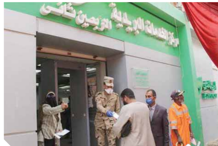
رجال القوات المسلحة يقومون بتوزيع الكمادات على المواطنين

كتبت محمد صلاح وإيوزيد كمال وسامية فاروق: تنفيذاً لتوجيهات الرئيس عبدالفتاح السيسي رئيس الجمهورية القائد الأعلى للقوات المسلحة بتكثيف جهود القوات المسلحة لصد انتشار فيروس «كورونا»، أصدرت القيادة العامة للقوات المسلحة أوامرها إلى هيئة الإمداد والتموين القوات المسلحة بتوسيع نطاق توزيع الماسكات الطبية الواقيه على المواطنين مجاناً بعدد من محافظات الجمهورية. حيث قامت عناصر القوات المسلحة بتوزيع الماسكات الطبية على محطة سكك حديد الجيزة على المواطنين القادمين والمتجهين من وإلى الصعيد، وحثهم على البعد عن التزاحم واتخاذ كافة إجراءات الوقاية والحماية الفردية. كما انتشرت عناصر القوات المسلحة بمحافظة السويس وقامت بتوزيع الماسكات الطبية على المواطنين المترددين على مواقف النقل الجماعى ومكاتب البريد، وفى الإسماعيلية تم توزيع الماسكات الطبية بمحطة قطارات الإسماعيلية وموقف النقل الجماعى وأنفق قناة السويس ومعدية نمره (6) للقادم والمتجه من وإلى سيناء، وفى محافظة بنى سويف تم التوزيع على المواطنين المترددين على محطة قطارات بنى سويف وموقف النقل الجماعى بالمحافظة. وحرصت القوات المسلحة على توزيع الماسكات الطبية على أعداد كبيرة من المواطنين بالأسكن التى يتردد عليها أعداد كبيرة، وعبر العديد من المواطنين عن سعادتهم وامتنانهم لما تقوم به القوات