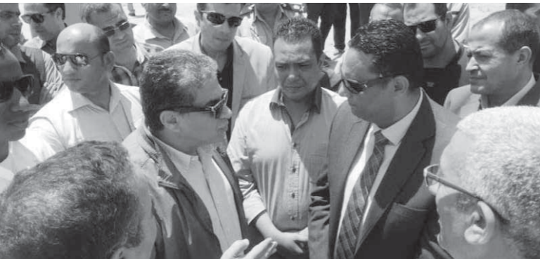
وزير البيئة أثناء جولته التفقدية

خلال 11 يوماً منذ بداية العمل حتى الآن بمعدل 900 تونة بما يعادل 6 آلاف طن في اليوم الواحد، منيراً إلى أنه تم فتح أكثر من نقطة تحميل لإنجاز رفع المخلفات من المقلب وفقاً للجدول الزمني المحدد. وأوضح السكرتير العام أن وزير التنمية المحلية خصص 6 ملايين جنيه لرفع كفاءة الطرق المؤدية من وإلى المقلب لتسهيل حركة عملية النقل.