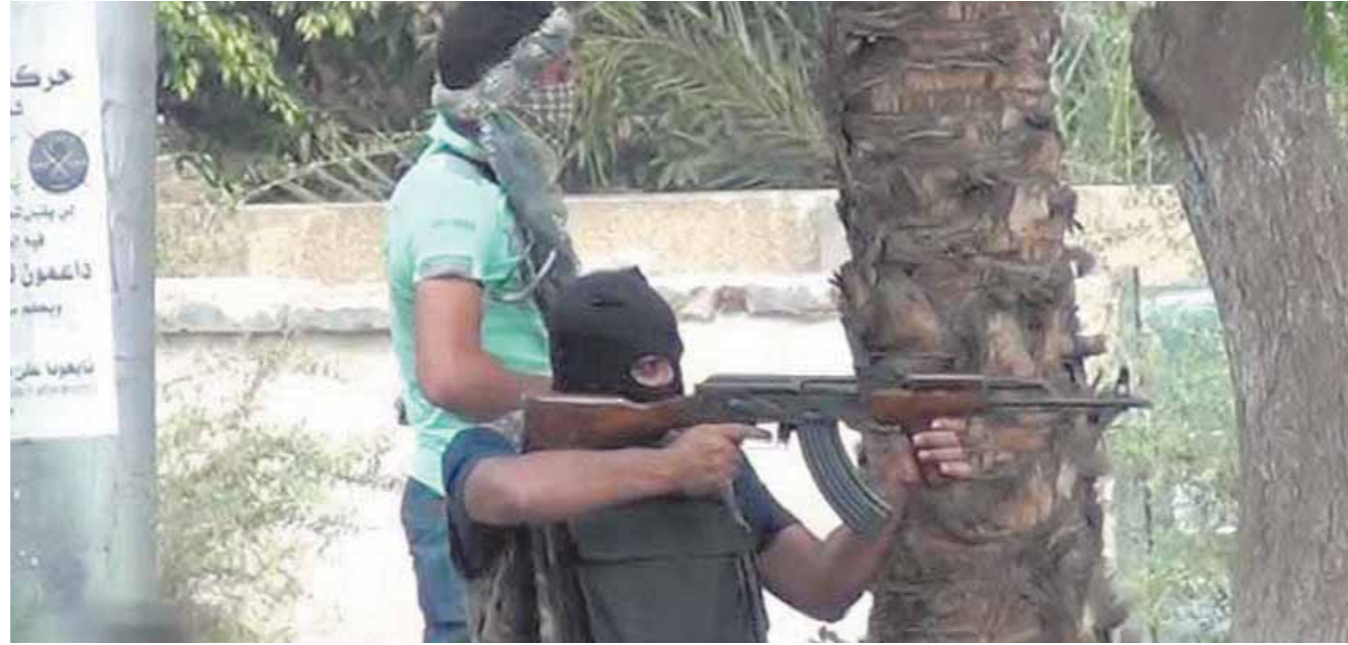
جرائم الاخوان مستمرة حتى الآن... صورة أرشيفية

وقالت المستشارة العلى سابقاً، إن دعوات المصالحة مع الإخوان جزء من دعوات مفرضة وجزء من السيناريو الذى ياك ضد مصر من جانب الغرب وأمريكا لإحيا قلب التنظيم الإرهابى الذى تم تدميره فى 30 يونيو على أيدي أبناء الشعب المصرى.