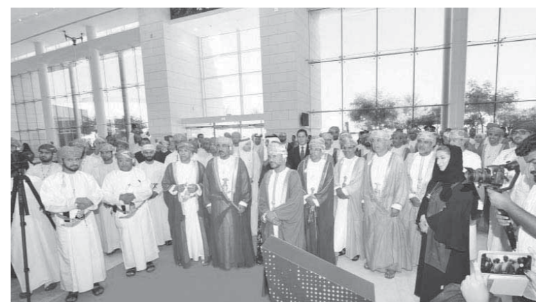
افتتاح معرض الاتصالات وتكنولوجيا المعلومات كومكس - ٢٠١٨

يستضيف مجلس الشورى في سلطنة عمان الدكتور عبدالنعم بن منصور الحسني وزير الإعلام خلال جلسته المجلس الاعتيادي يومى الأحد والاثنين 29 و 30 من أبريل مناقشة بيان وزارة الإعلام.