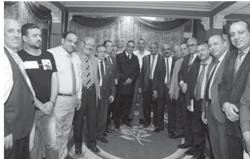
لجنة الوفد بالغربية