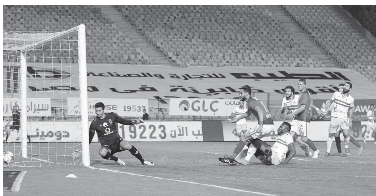
دفاع الاهلى المهزوز وراء الهزيمة