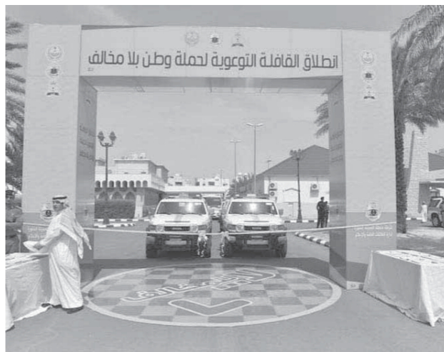
انطلاق قافلة التوعية المرورية بالسعودية

وأشاد الملك سلمان في برقية لوزير الداخلية بأداء الأجهزة الأمنية بوزارة الداخلية خلال الفترة من ١٥/١٠/١٤٣٨هـ حتى ٢٨/٨/١٤٣٩م مقارنة بنفس الفترة من العام الذي سبقه والتي تظهر تطوراً ملموساً في انخفاض نسب الجرائم ككل، حيث انخفضت جرائم القتل العمد بنسبة (٥, ٦%)، وانخفضت جرائم العرض، (٥, ١٤%)، وانخفضت جرائم السرقة بنسبة (٢%)، وانخفضت جرائم السطو المسلح بنسبة (٥, ١٠%)، وفي مجال الأمن والسلامة المرورية انخفضت أعداد التوقيف بنسبة (٧, ١٩%)، وانخفضت أعداد المصائب في الحوادث المرورية بنسبة (٩, ١٥%)، وفي مجال أمن الحدود ومكافحة تهريب المخدرات ارتفع مستوى الأداء في ضبط المهربين بنسبة (١٦, ٧%)، وفي ضبط المتسللين عبر الحدود بنسبة (٥٥, ٣%)، وفي ضبط المتهمين في قضايا المخدرات بانواعها بنسبة (٩٥, ٣٤%)، ومجال متابعة وضيء مخالفات أنظمة الإقامة والعمل وأمن الحدود أسفرت الإجراءات القائمة في الحملات الأمنية المشتركة