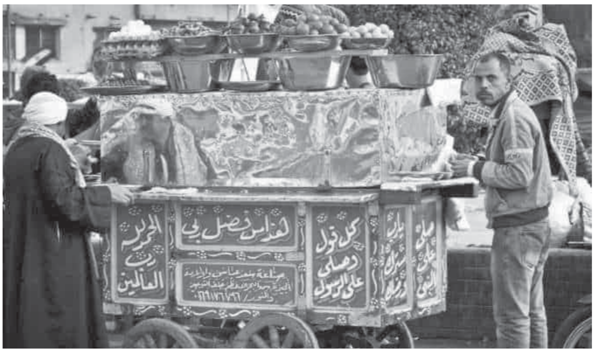
عربات الفول أصبحت سمة في الشارع المصري