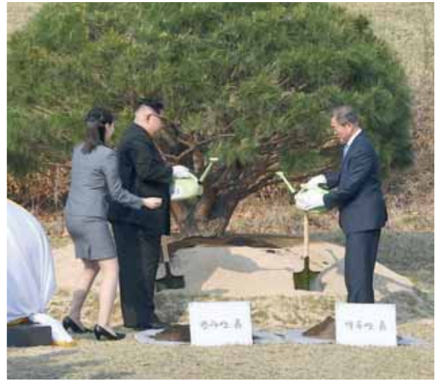
لقاء الزعيمين على الحدود

والسلام فى شبه الجزيرة الكورية وأفاق توحيد البلدين. وأكد رئيس كوريا الجنوبية مون جيه إن، وزعيم كوريا الشمالية كيم جونج أون، أنّ الهدف المشترك للبلدين هو تنفيذ عملية نزع الأسلحة النووية من شبه الجزيرة الكورية. وأصدر الزعيمان، بياناً مشتركاً أعلنتا فيه عن الوقت المتبادل لجميع الأعمال العدائية بين بلديهما، وبدء عهد جديد فى شبه الجزيرة الكورية. وأكد البيان، أن شبه الجزيرة الكورية لن تشهد حرباً بعد اليوم، وأشار إلى بدء عهد جديد للسلام. وقال البيان، إن الكوريتين تعترضان تحويل اتفاقية الهدنة لعام 1953 إلى معاهدة سلام، والبدء فى التفاوض مع الولايات المتحدة والصين بهذا الشأن. وأضاف أن الكوريتين ستعملان مع الولايات المتحدة على عقد قمة ثلاثية أو رباعية من أجل إحلال سلام ثابت. وأكد البيان، اتفاق الدولتين على التزامهما بالاتفاقيات حول عدم الاعتداء المتبادل، وعدم استخدام القوات المسلحة ضد بعضهما، كما اتفقتا على تقليص الأسلحة على مراحل من أجل تعزيز الثقة وخفض التوتر العسكرى. وتعهدت الكوريتان بنزع الأسلحة النووية من شبه الجزيرة الكورية بشكل كامل، ودعم الجهود الدولية الرامية لتحقيق هذا الهدف. كما اتفقت الدولتان على استئناف الحوار عن طريق الصليب الأحمر لتواصل العائلات المفرقة بين الجنوب والشمال، على أن يتم أول لقاء بين أفراد هذه العائلات فى 15 أغسطس المقبل.