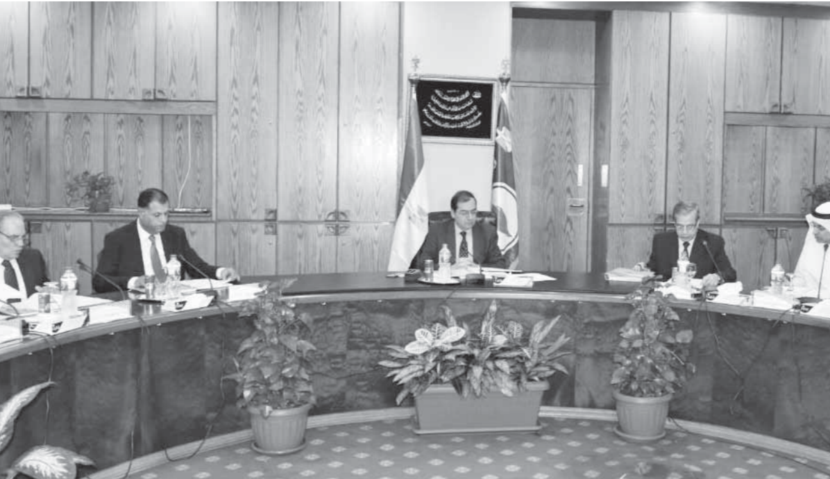
وزير البترول خلال اجتماع الجمعية العامة لشركة إمارات - مصر

الدولي والتسهيلات الخاصة بها باستثمارات أكثر من 50 مليون جنيه، حيث انعكس هذا المشروع إيجاباً على زيادة مستوى الربحية، كما يجري العمل مع مصر للبترول في تموين الطائرات في 12 مطاراً إقليمياً في ضوء الاتفاقية المبرمة بينهما، بالإضافة إلى تقديم خدمة تموين الطائرات بطار