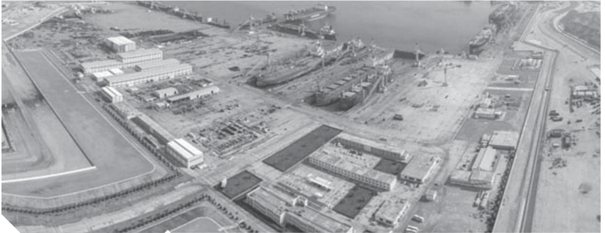
العمل في المنطقة الاقتصادية بالدقم متواصل على مدار الساعة ولم يتأخر