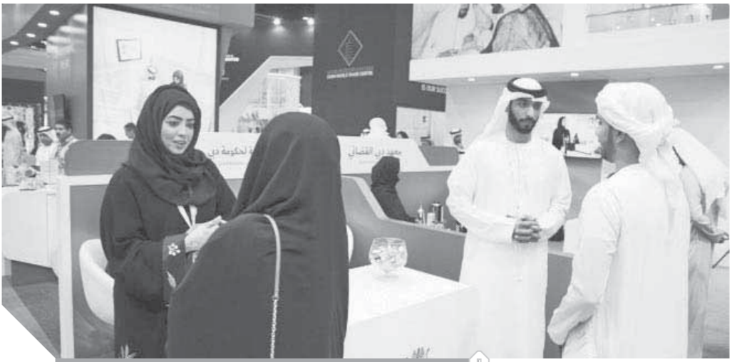
الإمارات سبقت الجميع بتطبيق الحكومة الإلكترونية

قرر المجلس التنفيذي لإمارة دبي تعميم تطبيق العمل عن بُعد في كل هيئات ودوائر ومؤسسات حكومية دبي بنسبة ١٠٠٪، اعتباراً من الأحد المقبل ٢٩ مارس الجاري. وبحسب القرار، فإن جميع الجهات الحكومية في إمارة دبي ستقوم برفع نسبة تطبيق العمل عن بُعد، لتصل إلى ١٠٠٪، اعتباراً من الأحد المقبل، مع الالتزام بالتعليمات الصادرة في التعاميم السابقة، بشأن العمل عن بُعد وضوابطه، بالإضافة إلى التركيز على تعزيز التحول الرقمي في تقديم الخدمات. وحسب القرار، أيضاً، يجب على الجهات الحكومية ضمان مستوى جودة الخدمات واستمراريتها، ومراعاة الوظائف التي يتحتم على شاغليها الوجود بمقر العمل، حيث يترك تقدير ذلك لمدير الجهة ذاتها.