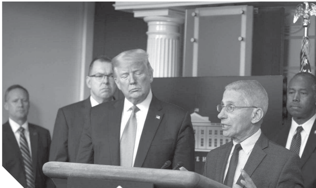
الحزن يخيم على ترامب

كتب: محمد ثروت: أصبحت الولايات المتحدة الأمريكية أكبر بؤرة لوباء «كورونا» في العالم، في ظل استمرار الفيروس المستجد في الانتشار، وحصد ضحاياه، وعلى الصعيد العالمي، ارتفع عدد المصابين بفيروس «كورونا» إلى أكثر من ٥١١ ألف شخص، في حين وصل عدد الوفيات إلى أكثر من ٢٤ ألفاً، في حين تعافى من المرض ما يزيد على ١٢٥ ألف شخص، وكشف إحصاء لجامعة «جون هوبكنز» أن المصابين بالوباء بلغ في ٨٥ ألفاً و٥٥٥ حالات في الولايات المتحدة، تليها الصين بأكثر من ٨١ ألفاً و٧٨٢، ثم إيطاليا بحوالي ٨١ ألف حالة.