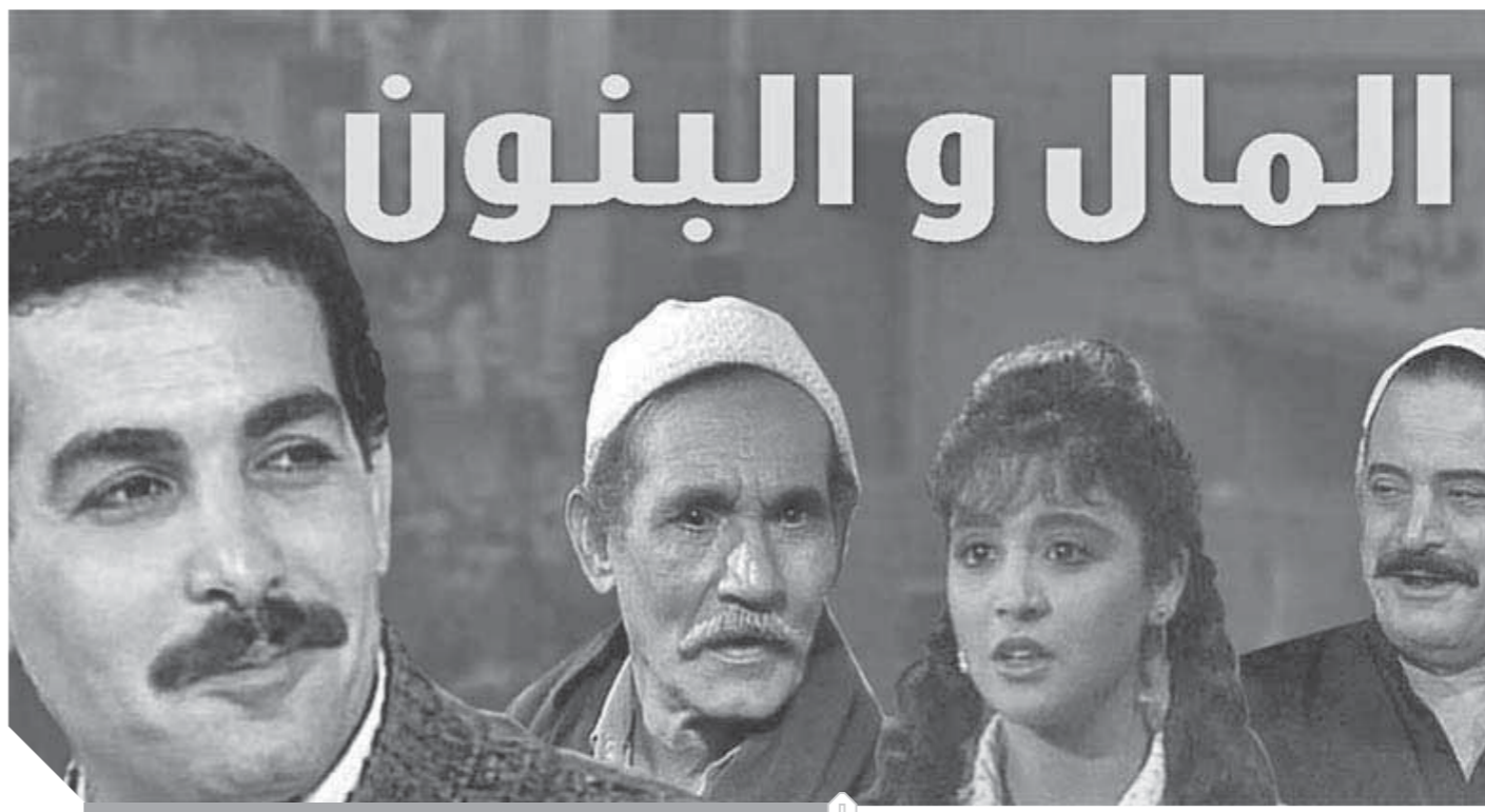
المال والبنون، رائعة من روائع الدراما التلفزيونية