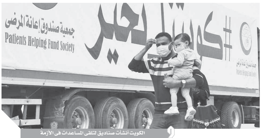
الكويت أنشأت صندوقاً لتلقي المساعدات في الأزمة

وذكر «المزم» أن إنشاء الصندوق المؤقت لدى الأمانة العامة لمجلس الوزراء جاء استناداً إلى قرار مجلس الوزراء في هذا الشأن، موضحاً أنه تم إنشاء موقع إلكتروني لتلقي المساهمات وسيتم الإعلان عن أسماء البنوك، وأعرب عن جزيل الشكر لرئيس وأعضاء السلطة التشريعية على تعاونهم الكبير في اقرار تعديلات مشروع القانون المتعلق بالاحتياطات الصحية للوقاية من الأمراض السارية بما يشمل عقوبات مغلفة وراعية تتناسب مع الأوضاع الصحية الحالية. وأضاف أن الجهد المبذول من أعضاء اللجان البرلمانية واستعمال رفق التقارير ذات الصلة جسد ما تفضل به رئيس مجلس الامة من أن الحكومة والبرلمان فريق واحد وفي خندق واحد لمواجهة الفيروس ومن ثم حماية المواطنين والمقيمين من أي آثار صحية في هذا الجانب. ودعا جميع المواطنين والمقيمين إلى الالتزام بتعليمات السلطات الصحية، مؤكداً أن فرض حظر التجول الجزئي لا يعني أن تكون الحياة طبيعية في الفترة الصباحية إذ «تطلب من الجميع الالتزام بالبقاء، بمنزلاتهم لتجنب نشر العدوى خاصة أن الحكومة قطعت شوطاً في مواجهة الفيروس إلا أن الطريق طويل علينا الالتزام بالتعليمات ذات الصلة».