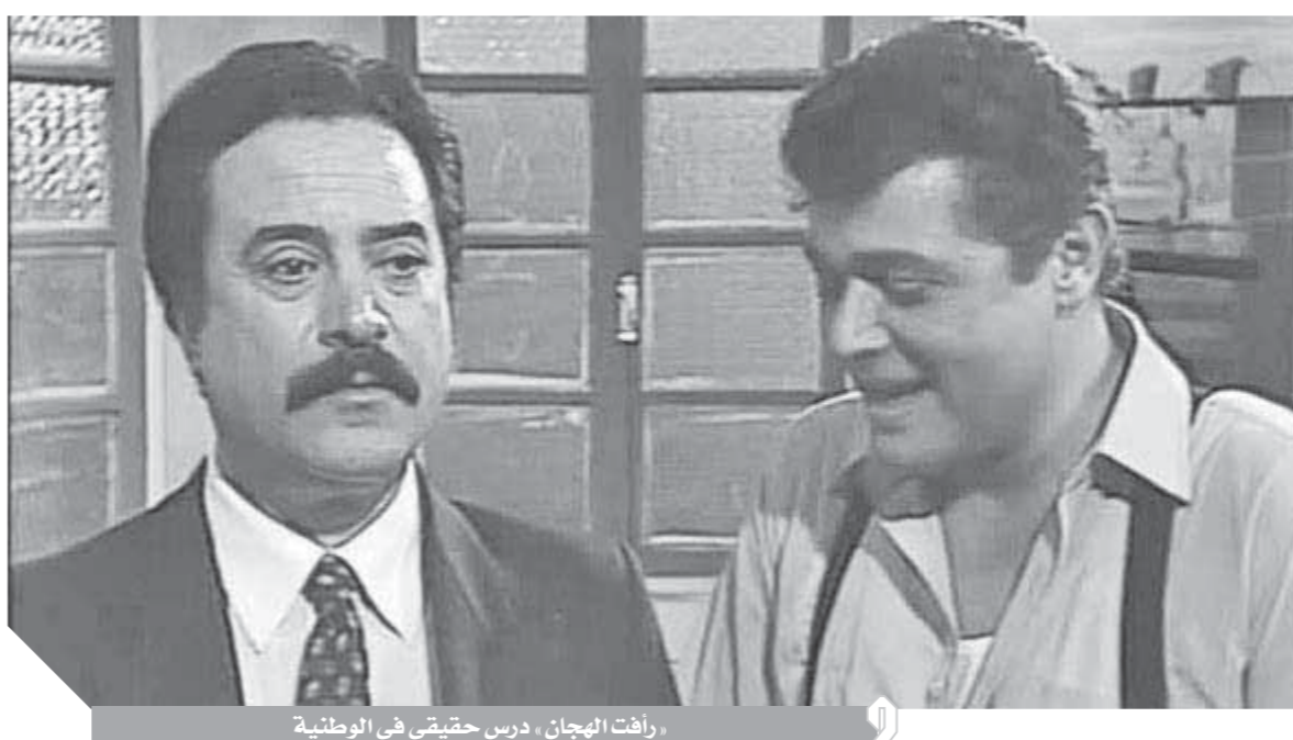
رافقت الهجان، درس حقيقي في الوطنية

«الشهد والدموع والحلمية والهجان والشوان» دروس في الوطنية