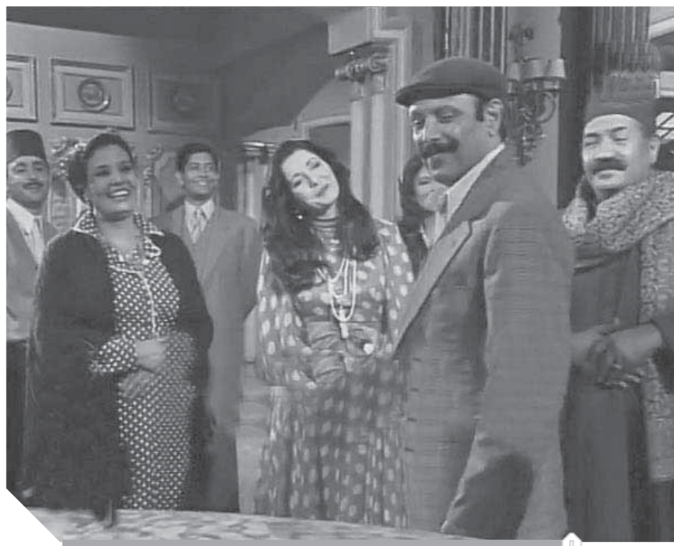
زَيْنُوبَا، مسلسل حظي بمتابعة كبيرة