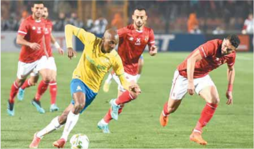
هزيمة الأهلي أمام صن داونز

وقال موسيماني: «أشعر بحالة حزينة شديدة، لم أزد الخسارة في هذه المباراة، لكنها أمور تحدث في كرة القدم، لا نستطيع لوم اللاعبين لكن أتبحث لنا فرص كثيرة للتسجيل ودائماً الخطورة علينا كانت بسبب المتردات»، وأكد موسيماني أن فريقه أصبح في موقف صعب بعد الخسارة أمام صن داونز، وأن عليه العمل من أجل تصحيح الأخطاء، وعدم القدرة على استغلال الفرص السائحة للتسجيل.