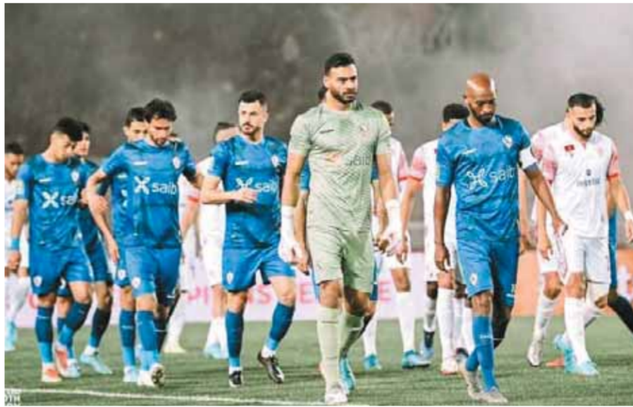
الزمالك خسر أمام الوداد وتأزم موقفه في التاهل