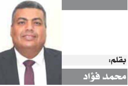
بقلم: محمد فؤاد