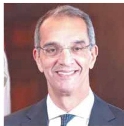
كتب- جهاد عبد المنعم:

تشارك مصر بوفد رفيع المستوى من وزارة الاتصالات وتكنولوجيا المعلومات برئاسة الدكتور عمرو طلعت، ووزير الاتصالات وتكنولوجيا المعلومات، في فعاليات المعرض والمؤتمر الدولي للهواتف المحمولة في برشلونة بإسبانيا التي تتخلل اليوم وتستمر حتى ٢ مارس، حيث يعد المؤتمر هو الحدث السنوي العالمي الأبرز لصناعات الهاتف المحمول والصناعات المتعلقات بها في العالم وتوظف الجمعية الدولية لشبكات الهاتف المحمول GSMa بمشاركة نحو ١٨٠٠ عارض من ١٨٣ دولة ويحضور صناع القرار والخبراء ومسؤولي المنظمات الدولية وكبرى الشركات العاملة في مجال الهاتف المحمول وأجهزته، والمتخصصين في التكنولوجيات ذات الصلة. ورواد صناعة الهاتف المحمول من مختلف أنحاء العالم. يعقد طلعت، على هامش مشاركته في المؤتمر