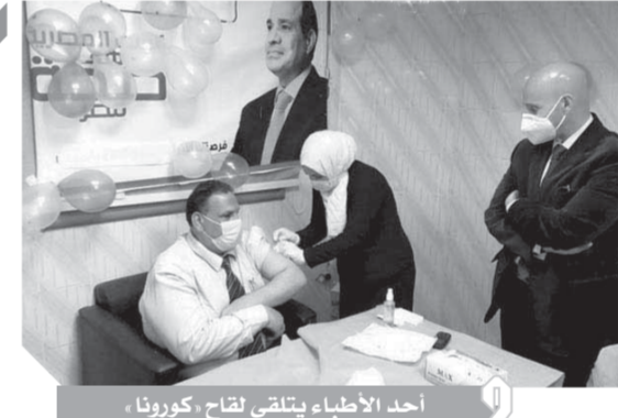
أحد الأطباء يلتقي لقاح كورونا