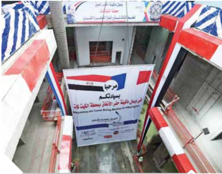
وصول ماكينة الحفر إلى «الكيت كات»