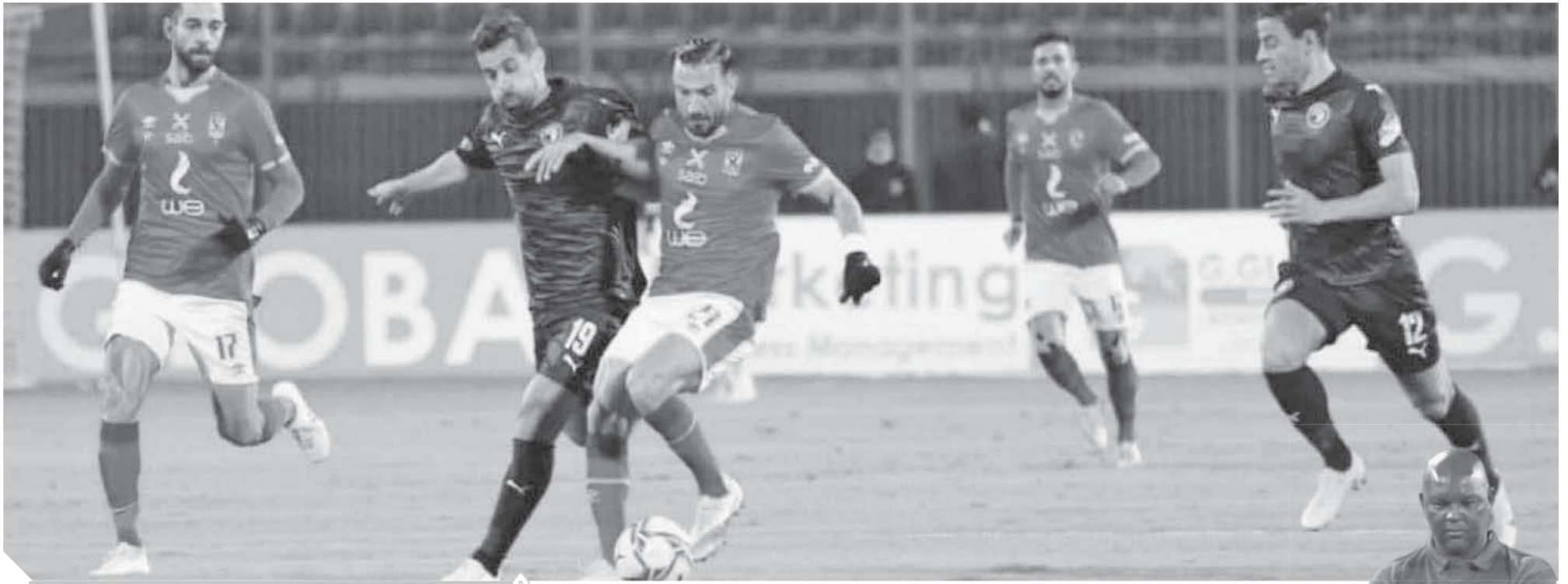
الأهلى عجز عن هز الشباك أمام بيراميدز