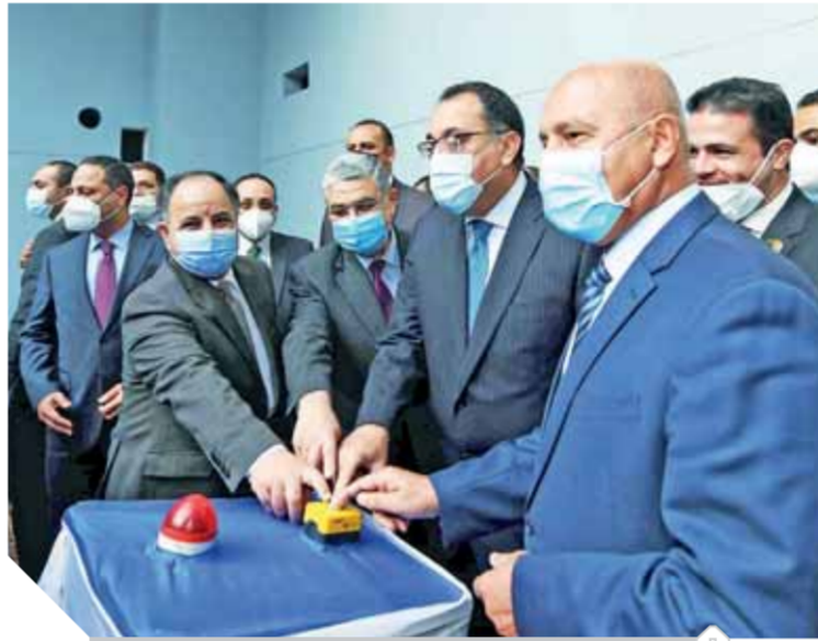
مديولى، والوزير، ومعبط، يضغطون زر خروج الحفار

أكد الدكتور مصطفى مديولى، خلال حضوره هذا الحدث أن الدولة تخطو خطى متسارعة من أجل النهوض بكافة القطاعات خاصة قطاع النقل الذى يوليه الرئيس عبدالفتاح السيسى، رئيس الجمهورية، اهتماماً خاصاً لتأثيره المباشر على حياة المواطن اليومية، ولدوره الحيوى فى التخفيف من حدة الازدحام والتلوث. وأشار إلى أن مترو الأنفاق يُعد أحد وسائل المواصلات النظيفه الذى يتم تنفيذ مشروعاته طبقاً لأحدث النظم التكنولوجية، بما يسهم فى تحسين مستوى الخدمة المقدمة للمواطن من خلاله، لافتاً إلى أنه يتم تنفيذ العديد من مشروعات النقل الجماعى لربط مختلف أنحاء الجمهورية، بما يخدم أهداف التنمية، ويساهم فى تيسير حركة المواطنين. وأوضح وزير النقل أن المرحلة الثالثة من الخط الثالث يبلغ طولها ١٧.٧ كم، وتشتمل على عدد (١٥) محطة، وأن نسبة الإنجاز الكلية لها بلغت ٤٩٪، وسيتم افتتاح الجزء الأول منها، الذى يصل من محطة «العتبة» حتى محطة «الكيت كات» بطول ٤ كم فى ديسمبر ٢٠٢١.