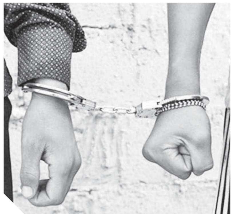
مجرمون سفاري يتعوق في قبضة الشرطة

وقال إنه حالها جار تعديل قانون الطفل ومن الممكن إضافة بعض المواد التي تشمل عقوبة مشددة للحد من هذه الظاهرة، ولكن بالطبع ستكون هذه العقوبة للأطفال من ١٥ إلى أقل من ١٨ عاماً، ولا تشمل من هم دون هذه السن، حيث ينص التعديل على أنه إذا ارتكب الطفل الذي تجاوز سنه خمس عشرة سنة، جريمة عقوبتها الإعدام أو السجن المؤبد