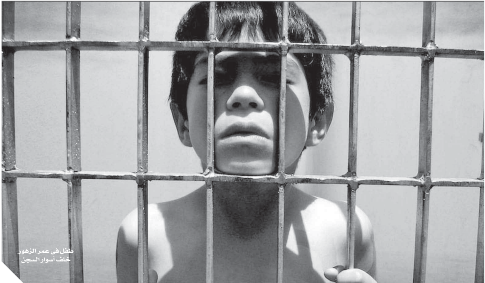
طفل في عمر الزهور خلف أسوار السجن

ونص قانون الطفل على أن يحكم على الطفل الذي ارتكب جريمة، ولم يتجاوز عمره ١٥ سنة ميلادية كاملة، بأحد التدابير الأتية: التوبيخ، الإلزام بالتدريب والتأهيل، الإلزام بواجبات معينة، الاختيار القضاة، العمل للمنفعة العامة، بما لا يضر صحة الطفل أو نفسيته، وتحدد اللائحة التنفيذية لهذا القانون أنواع هذا العمل وضوابطها، أو الإيداع في أحد المستشفيات المتخصصة أو الإيداع في