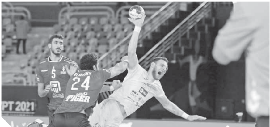
سلوفينيا قدمت مباراة جيدة امام مصر رغم ادعاءات التسمم

فیه سلوفينيا أن لاعبيها تناولوا طعاماً مسموماً، تناول فريق بيلاروسيا نفس البوفيه أيضاً، دون أى عواقب سلبية. وقال البيان: «بالنسبة للمباراة نفسها، فقد ادعت سلوفينيا أن تسعة لاعبين لعبوا رغم أنهم لم يكونوا على ما يرام ومع ذلك لا بد من الإشارة إلى أن الفريق لعب مباراة جيدة حتى أنه كان فى المقدمة بفارق خمسة أهداف فى بداية الشوط البوفيه من الجولة الرئيسية فصاعداً لم يتقدم بأى شكوى من أى نوع، كما قال رئيس بعثة بيلاروسيا أوليج لبيديف: «لم تكن لدينا مشاكل أو شكوى حول جودة الإقامة فى الفنادق، ونوعية الطعام والتدابير اللازمة للوقاية من فيروس كورونا المستجد». وأشار البيان إلى أنه فى نفس اليوم الذى ادعت