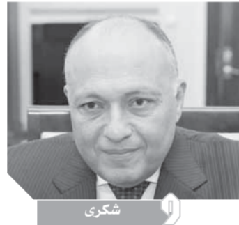
وزير شكري أكد ثقته في استمرار الدعم الأوروبي للفلسطينيين

المصرية في إطار المصالحة الفلسطينية، مع التشديد على ضرورة ترجمة هذا المناخ الإيجابي إلى واقع عملي على الأرض. كما أعرب وزير الخارجية للمسئولة الأوروبية عن ثقته في استمرار الدعم الأوروبي للقضية الفلسطينية على كافة الأصعدة، وبما في ذلك في إطار وكالة الأونروا. من جانبها، أعلنت ممثلة الاتحاد الأوروبي وزير شكري على نتائج اتصالاتها مع مختلف الأطراف المعنية، وعرضت الرؤية الأوروبية لإحياء المفاوضات بين الجانبين. كما أشادت بدور مصر الداعم لعملية السلام في الشرق الأوسط، ومستوى التنسيق القائم مع الاتحاد الأوروبي في هذا الشأن، معربة عن تطلعيها لاستمرار وتيرة التشاور والتعاون مستقبلاً.