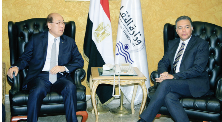
هشام عرفات وزير النقل خلال استقباله كيتاك ليم الأمين العام للمنظمة البحرية

قال الدكتور هشام عرفات وزير النقل، إن مصر تعزز بحضورها في المنظمة البحرية الدولية، وتعتبر من أوائل الدول التي انضمت إليها منذ نشأتها. وأكد عرفات خلال استقباله كيتاك ليم الأمين العام للمنظمة في أهمية النقل البحري والسور الحيوي لنعصر السلامة والبيئة في تطوير هذه الصناعة الهامة. وأضاف عرفات أن مصر تتمتع بموقع جغرافي متميز وتمتلك عدداً كبيراً من الموانئ تصل إلى 43 ميناءً تجارياً وتخصصياً. واستعرض عرفات خلال الاجتماع خطط تطوير الموانئ المصرية والتسويق في مجال النقل البحري بين وزير التجارة والصناعة والسويس والمنطقة الاقتصادية. وأعرب الأمين العام للمنظمة البحرية الدولية، عن تقديره للتطور الذي تشهده قناة السويس لخدمة حركة الملاحة والتجارة البحرية.