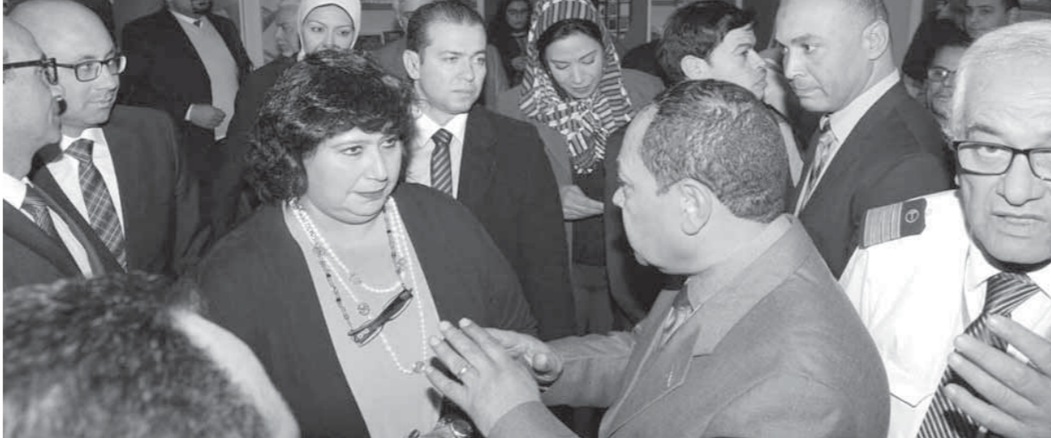
د. ابناس عبدالدايم وزيرة الثقافة خلال جولتها بمعرض الكتاب