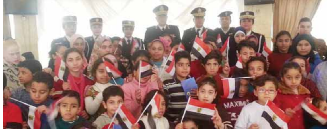
نادى ضباط امن القاهرة يكرم الأطفال الايتام

الاحتفالية عرضوا ترفيهية وغنائية للأطفال وتقديم هدايا تملكت فى لعب أطفال وتناولوا وجبة الغداء مع ضباط المديرية وسط أجواء من البهجة والسعادة التى غمرت الأطفال الذين عبروا عن فرحتهم بهذه الاحتفالية. كما قدم مسئولو دور رعاية الأيتام شكرهم على تلك الاستضافة وأغربوا عن تقديرهم لدور أجهزة وزارة الداخلية فى حفظ الأمن والسهل على راحة وسلامة المواطنين، وفى نهاية الاحتفال ألقى اللواء طارق علام مدير الإدارة العامة لقطاع الجنوب كلمة قدم فيها الشكر لمسئولى دار الأيتام على الجهود التى يقومون بها فى تربية وإعداد الأطفال الأيتام ليكونوا شباباً ونساءً قادرين على تحقيق الخيرية لوطنهم ولمجتمعتهم. وساعد الاحتفال فى إدخال البهجة فى نفوس الأطفال الذين عبروا عن سعادتهم الغامرة بهذه الزيارة، جاء ذلك فى إطار الدور المجتمعي لوزارة الداخلية الذى يهدف إلى بناء جسور الثقة والتعاون مع الجمهور من خلال تعظيم الخدمات الإنسانية والاجتماعية التى تقوم بها الوزارة والعاملون بها للمواطنين والمؤسسات الخيرية التى تقدم خدمات مجاهيرية.