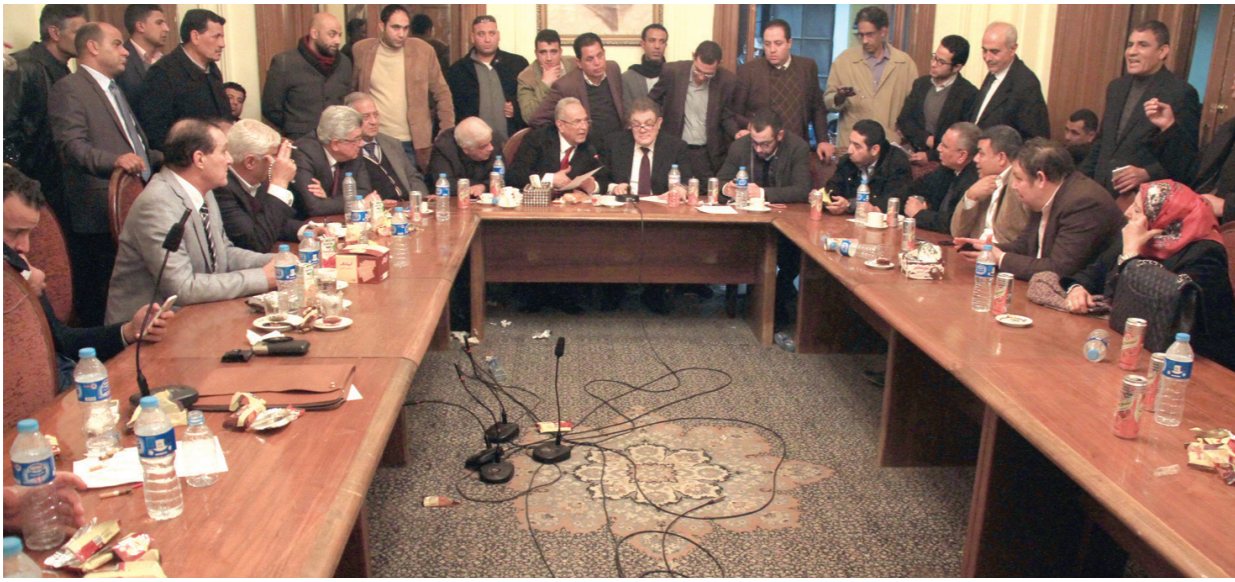
جانب من اجتماع الهيئة العليا لحزب الوفد