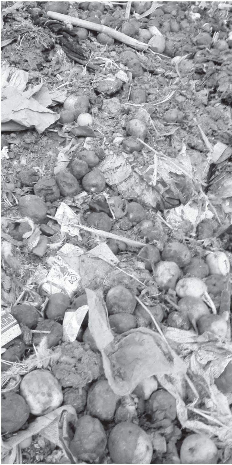
مئات الكيلوجرامات من الفاكهة والخضراوات تُلقي في القمامة

15% من الحاصلات الزراعية تهدر في الحقول أثناء عمليات الجنى والنقل