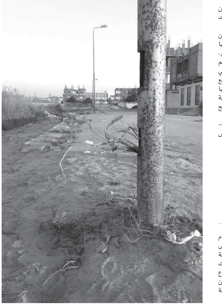
اسلاك الكهرباء العارية فى العراق

عبر أهالي القنطرة شرق بالإسماعيلية عن غضبهم، لعدم تحرك المسئولين لإيجاد حل لأسلاك الموت بالشوارع الرئيسية. وقال الأهالي إننا نضع أيدينا على صدورنا من الرعب عندما يمر أطفالنا وسط الشوارع التي بها أعمدة تخرج منها أسلاك عارية لتحصد أرواح الناس. كما انتقد الأهالي مسئولى الصحة لاستمرارهم في استقبال النفايات الطبية ليتم حرقها في محرقة مستشفى القنطرة شرق التي ترسلها جميع مستشفيات مراكز ومدن المحافظة، ليمت حرقها في محرقة المستشفى، رغم علمهم بالعيوب الفنية بالمحرقة والتي تسبب في خروج دخان ملوث وروائح كريهة.