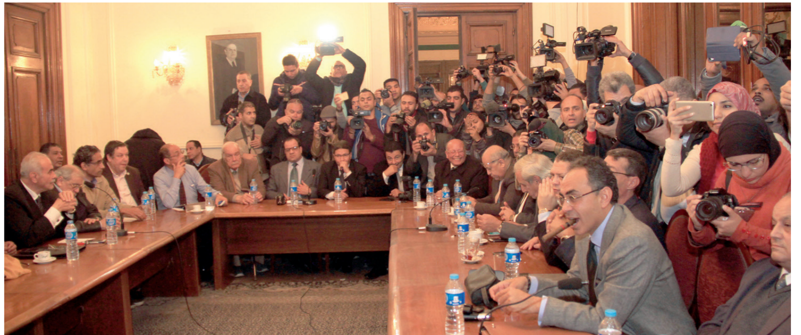
وسائل الإعلام ووكالات الأنباء تتابع اجتماع الهيئة العليا