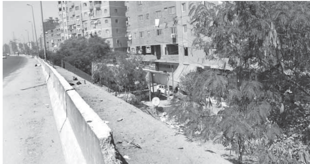
الدائري تحول إلى مواقف عشوائية وغياب عنه الرقابة

التفزيونية في تنفيذ فكرة المطالع والسلاالم اليدوية للوصول أعلى المحور وفيه ناس كثير بتموت علشان مش عارفين إن كل الاتجاهات اللي بتطلع فيها السيارات عكس وغير قانوني».