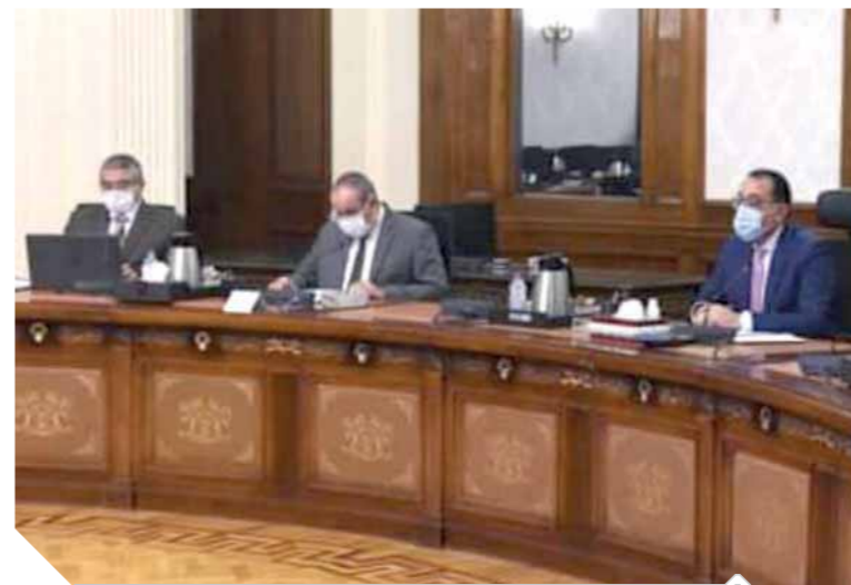
وزير الطيران ونائبه خلال لقاء رئيس الوزراء