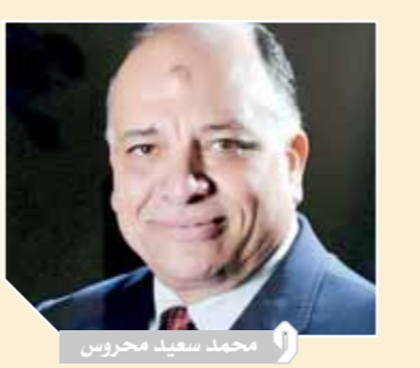
محمد سعيد محروس

صرح المهندس محمد سعيد محروس رئيس الشركة القابضة للمطارات والملاحة الجوية أنه في ضوء استعدادات مصر لاستضافة بطولة كأس العالم لكرة اليد المقرر إقامتها في الفترة من ١٢ إلى ٣١ يناير من العام المقبل ٢٠٢١ وبمشاركة ٢٢ منتخباً، وفي ضوء توجيهات الطيار محمد مناصر مناصر مناصر وزير الطيران المدني فإنه جاري وضع تجهيزات خاصة بمطار القاهرة لاستقبال المنتخبات المشاركة بالبطولة ومشجعي تلك المنتخبات بالشكل الحضاري الذي يليق بمكانة مصر السياحية والتاريخية واستحقاقها لتنظيم البطولة، خاصة أن إقامة البطولة تأتي في ظل ظروف عالمية، خاصة بسبب جائحة كورونا وهو ما يتطلب مجهودات أكبر من أجل الحفاظ على سلامة ضيوف مصر في هذه البطولة.