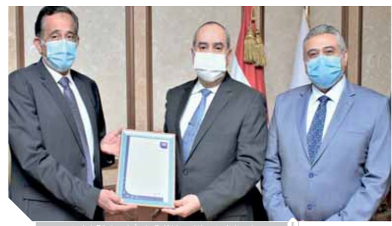
وزير الطيران ونائبه خلال تسليم أيزو سلطة الطيران