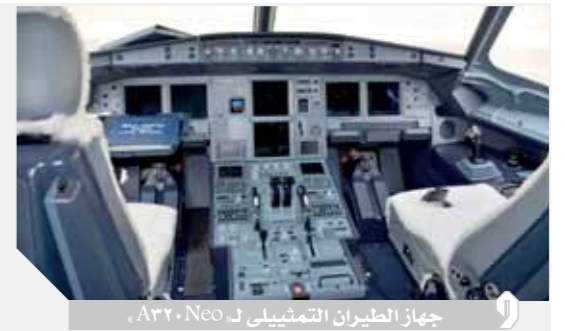
جهاز الطيران التمثيلي لـ A320Neo