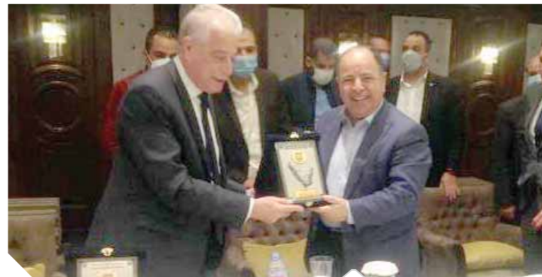
محافظ جنوب سيناء يكرم معيط