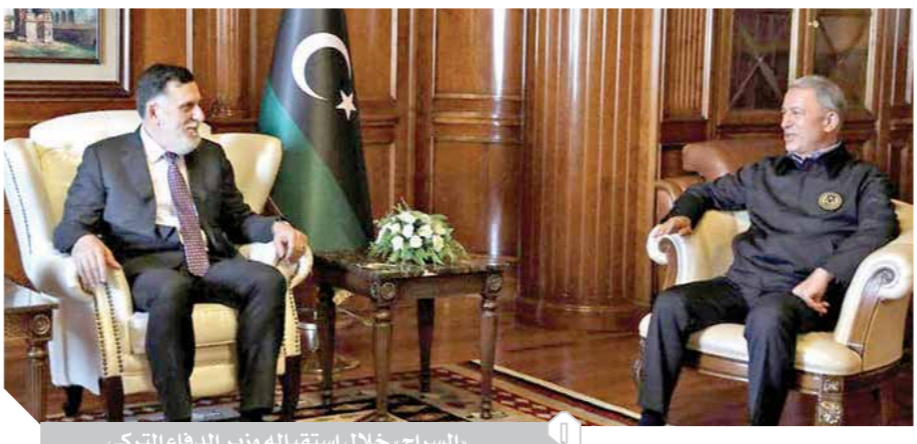
السراج، خلال استقباله وزير الدفاع التركى

كتب - أحمد الأطرش: بعد أن دعا خليفة حفر، قائد الجيش الوطنى الليبي، قواته إلى «طرده» القوات التركية من ليبيا لإنهاء الحرب فى بلاده، توجه خلوصى أكار، وزير الدفاع التركى إلى ليبيا، برفقة رئيس الأركان وقادة الجيش، لتفقد عناصر القوات التركية المتمركزة فى المنطقة الليبية. ومن المنتظر أن يلتقى الوفد التركى فى ليبيا، رئيس المجلس الأعلى للدولة فى حكومة الوفاق خالد المشرى ووزير الدفاع صالح الدين النمروش، ووزير الداخلية فتحى باشاغا، ويعتزم أكار وقادة الجيش زيارة مقر قيادة القوات التركية فى ليبيا، لعقد لقاء مع عناصر القوات المتمركزة هناك، وأكد «حفر» فى كلمته بمناسبة الاحتفال بالذكرى الـ ٦٩ لاستقلال ليبيا، الخميس الماضى، أنه «لا قيمة للاستقلال ولا معنى للحرية ولا أمن ولا سلام وأقدام الجيش التركى