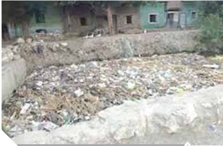
أكوام القمامة تغلق المصارف