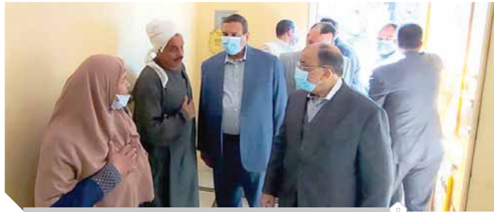
شعراوي، ومحافظ البحيرة يتفقدان قرية الشيخ عبد الحليم محمود

أكد اللواء محمود شعراوي وزير التنمية المحلية، أن مبادرة حياة كريمة جزء محوري من اهتمامات رئيس الجمهورية ومبادراته التامة التي تستهدف تحسين معيشة المواطنين الأكثر احتياجاً وهي امتداد للمبادرات التنموية التي أطلقها ويرعاها على مدار السنوات الست الماضية، والتي ساهمت في إحداث تغيير جوهري في حياة ومستوى معيشة المواطنين المصريين الأكثر احتياجاً، كما تم خلال أكتوبر الماضي إطلاق المرحلة الثانية لمبادرة «حياة كريمة» لتشمل ٣٧٥ تجمعاً ريفياً، وأشار وزير التنمية المحلية إلى تنفيذ ١٥٩٢ مشروعاً باستثمارات ٩,٦ مليار جنيه في قطاعات الصحة والتعليم والصرف الصحي ومياه الشرب في ١٤ محافظة معظمها في الصعيد مصر بالإضافة إلى محافظة البحيرة. جاء ذلك خلال تقديمه لرفقة اللواء هشام آمنة محافظ البحيرة، قرية عبد الحليم محمود بمرکز أبو المطامير إحدى قرى المرحلة الأولى للمبادرة الرئاسية «حياة كريمة» لتنفذ