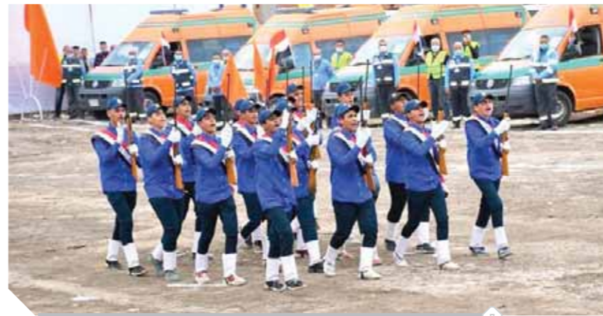
تدريبات عملية لقوات الدفاع الشعبي

الناجمة عنها، مع اتخاذ كافة الإجراءات الوقائية، مع استعداد القوات المسلحة لتقديم يد العون حال الطلب. وخلال التدريب قدم طلبة المدارس العسكرية بالمحافظات عروضاً عسكرية ورياضية عكست مستوى التدريب والتأهيل والانضباط العسكري لديهم، وشمل التدريب تقاعد المعدات والمركبات الخاصة بالمحافظات للتأكد من مدى جاهزيتها، وكذلك تقاعد مسكر الإيواء العاجل ومستشفيات العزل الميداني بمشاركة مديريات الشباب والرياضة والتضامن الاجتماعي والصحة والتربية والتعليم، كما تضمنت الأنشطة تكريم بعض أسر الشهداء.