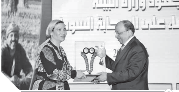
وزيرا البيئة والتنمية المحلية خلال الاحتفال

أرض الواقع مشيراً إلى أهمية البعد البيئى فى العمليات الإهرايية، لجات الى حرب الشائعات، لتصبح الاستدامة البيئية عنصراً أساسياً فى تنفيذ المشروعات القومية والتحول لمجتمعات جديدة صديقة للبيئة. كما أشار إلى أهمية التعاون بين البيئة والتنمية المحلية والوزارات المعنية الأخرى لتنفيذ منظومة المخلفات الجديدة بدعم من رئيس الجمهورية لتوفير عدد من التداخلات التى تصب فى مصلحة المواطنين.