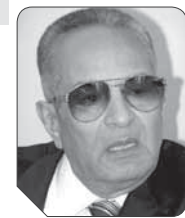
بهاء الدين أبو شوق