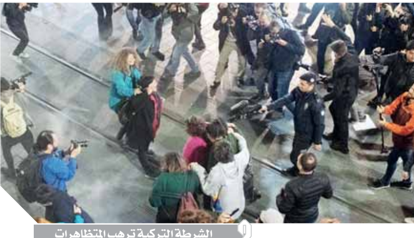
الشرطة التركية تهرب المتظاهرات

وبعد تجرّع بدأ سلمياً توجهت المسيرة إلى ميدان الاستقلال، المركز التجاري حيث تصمد للمتظاهرين عناصر شرطة مكافحة الشغب الذين استخدموا العنف لتفريقهم. وأفاد مصور وكالة فرانس برس بأن عناصر الشرطة أطلقوا الغاز المسيل للدموع والأعيرة المطاطية لتفريق المحتشدين. وقالت مظاهرات تبلغ ٢٥ عاماً إن «قتل النساء في بلدنا ازداد بشكل كبير، والمجتمع يقوم بإسكاتنا»، وهي الأسابيع الأخيرة أفادت وسائل إعلام تركية بمقتل عدد من النساء. وحتى الآن، قتل ٢٧٨ امرأة في تركيا خلال عام ٢٠١٩، وفق منظمة محلية تدافع عن حقوق النساء، علماً أن عدد اللواتي قتلن العام الماضي بلغ ٤٤٠ امرأة مقابل ١٢١ جريمة قتل لإناث وقعت في عام ٢٠١١.