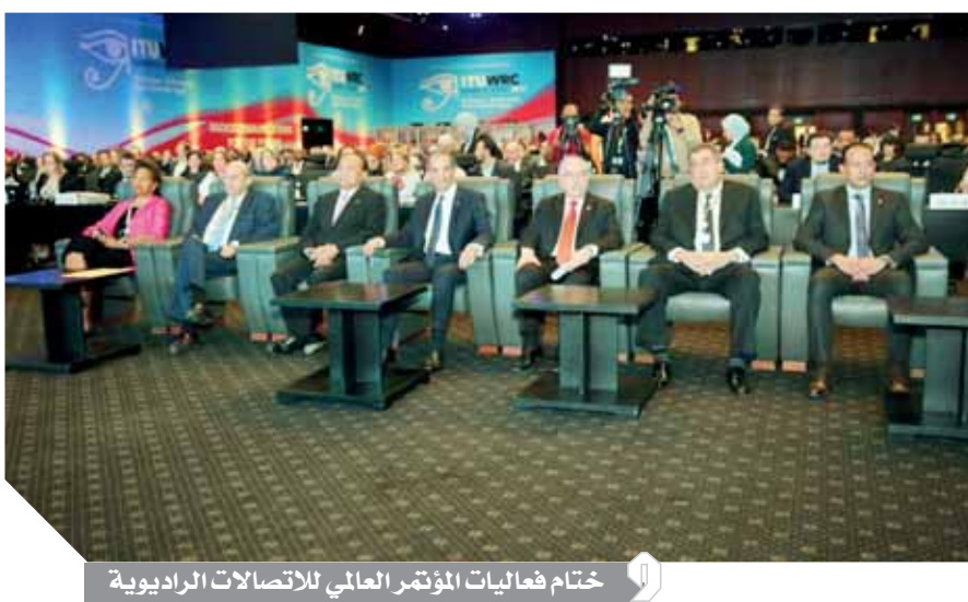
ختم فعاليات المؤتمر العالمي للاتصالات الراديوية

كذلك وافق المؤتمر على توصية جديدة بشأن منظومة النقل الدولية (ITS) وتم إصدار قرار جديد بشأن أنظمة الاتصالات الراديوية بالسكك الحديدية بين القطارات وجانب المسار (RSTT)، كما تم أيضا تحديث منظومة السلامة والاستغاثة البحرية GMDSS. كذلك قام المؤتمر بالنظر في الاحتياجات من الأطياف الخاصة بتكنولوجيا محطات المصايد عالية الارتفاع (HAPS) حيث نجح المشاركون في تفتيح الإطار التنظيمي لأنظمة الأقمار الصناعية غير المستقرة بالنسبة إلى الأرض، ومن مزايا تكنولوجيا HAPS أنها تعمل في الستراتوسفير، ويمكن استخدامها لتوفير اتصال واسع النطاق ثابت للمستخدم النهائي والوصول الخلفية لشبكات المحمول، وبالتالي زيادة تغطية هذه الشبكات. تم أيضا إطلاق إعلان حول المساواة بين الجنسين في قطاع الراديو والاتحاد الدولي للاتصالات مما يعتبر خطوة في غاية الأهمية بالنسبة للاتحاد حيث إن قطاع الراديو هو القطاع الوحيد بالاتحاد الذي لا يوجد به قرار في هذا الموضوع، وهو أمر هام بالنسبة لقطاع الراديو والذي يديره ويشارك