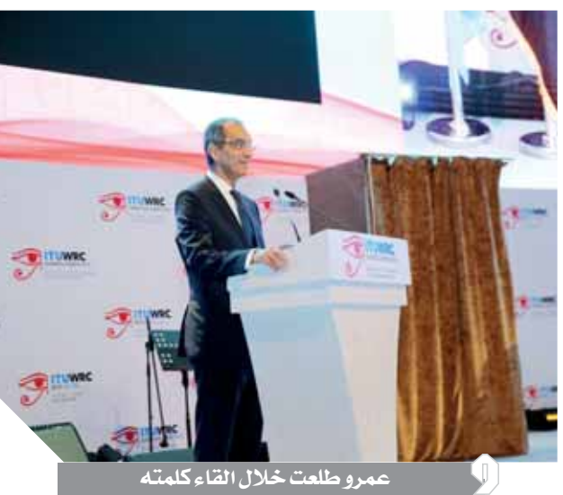
عمرو طلعت خلال إلقاء كلمته