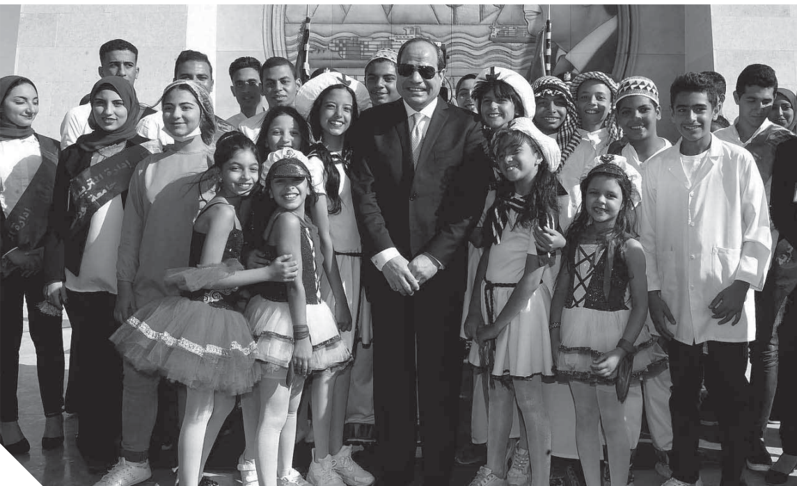
جانب من الاطفال الذين استقبلوا الرئيس بالضفة العامرة

طريق الإسماعيلية/ بورسعيد ومحور ٣٠ بونية، وعن محور ٣ يوليو غرب قناة السويس، وهو عبارة عن طريق اتجاهاين بطول ٧,٥ كم وعرض ٢٨، يتكون من ٢ حارات مرورية لكل اتجاه بالإضافة إلى جزيرة وسطى بعرض متغير مدعماً بمجموعة من الكباري منها أربعة كباري سطحية مع كوبري علوي، حيث تنفيذ مجموعتي الكباري الاستشاريات الفنية، حيث تم اكتساب خبرات كبيرة لكوادر الشركة الوطنية التي نفذت المشروع وتنفذ الشهيد أحمد حمدي، وكوبري السلام، وتوسط كل هذه التحديات جاءت توجيهات الرئيس عبدالفتاح السيسي القائد الأعلى للقوات المسلحة بإنشاء مجموعة أنفاق سيارات لسفن قناة السويس هي الأضخم في تاريخ مصر لربط سيناء بكل أنحاء الجمهورية، مشيراً لافتتاح أنفاق (تحتيا مصر) شمال الإسماعيلية ضمن المجموعة الأولى من الأنفاق خلال احتفالات تحرير سيناء هذا العام.