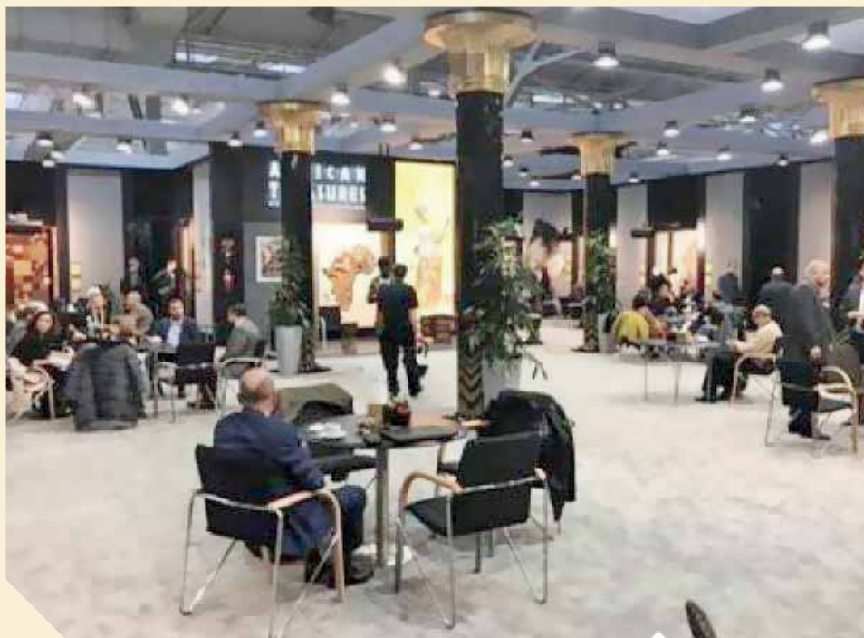
مجموعة النساجون تشارك في معرض دومتيكس

وضعت مجموعة النساجون خطة للوصول بصادراتها إلى ٨٠٪ من حجم إنتاجها والوصول بها إلى أكثر من ١٤٠ دولة حول العالم، علماً بأن عدد الدول التي تصدر لها مجموعة النساجون الشرقيون منتجاتها من السجاد وأغطية الأرضيات سواء نساجون مصر أو نساجون الصين أو نساجون الولايات المتحدة الأمريكية تصل في الوقت الحالي إلى ١٣٠ دولة في شتى أنحاء العالم وهو ما أكسب المجموعة شهرة غير مسبوقة لأي شركة مصرية على مستوى العالم كافة. ووصلت نسبة الصادرات من حجم المبيعات إلى ٧٥٪ وهو ما لم تحققه أي شركة مصرية في أي قطاع صناعي أو زراعي أو خدمي.