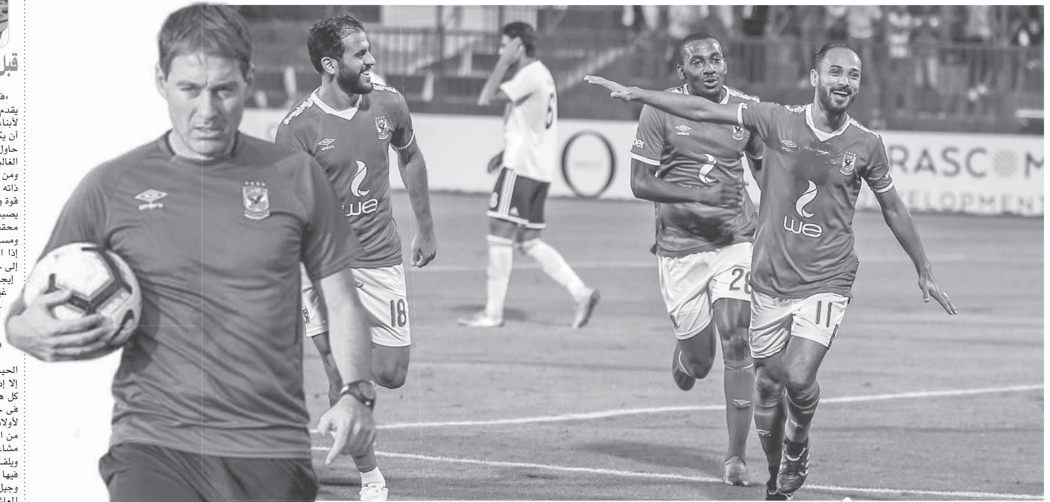
احتفال لاعبي الأهلي برباعية الجونة