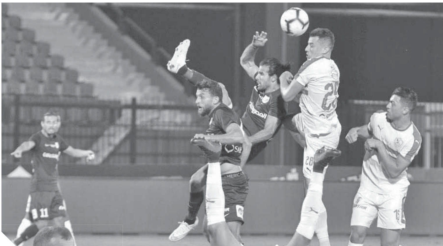
اداء باهت للزمالك امام انبي

الجماهير تهاجم نجوم الفريق و«ميتشو».. والإدارة تشكو حكم المباراة رسمياً