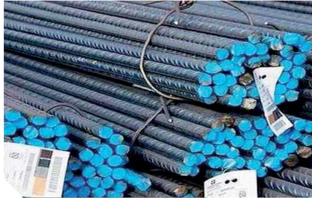
استقرار أسعار الحديد بعد الزيادات الأخيرة

شهد سوق الحديد ولدى التجار والموزعين هدوءاً واستقراراً في أسعار الحديد عقب الزيادات الأخيرة والتي تراوحت بين ٢٠٠ و٤٠٠ جنيه في الطن وهي الزيادات التي جاءت في أعقاب الارتفاعات الأخيرة في أسعار الخامات بالبورصات العالمية سواء في البليت وهو الخامة الرئيسية في إنتاج حديد التسليح أو الخرصة، تراوحت نسبة الزيادة في البليت والخرصة بين ٦٠ و٧٠ دولاراً للطن، ما أدى إلى لجوء المصانع المحلية سواء مصانع الدرفلة أو المصانع المتكاملة وشبه المتكاملة إلى تحريك أسعارها بالزيادة. جاءت الزيادات الأخيرة متفوقة بين المصانع وكانت أكبر الزيادات في حديد الجارحى وسجلت نحو ٤٠٠ جنيه في الطن، بينما كانت الزيادات في مصر استيل نحو ٣٠٠ جنيه في الطن، ولم تتجاوز الزيادة في بشاي وعز والمراكبي نحو ٢٠٠ و٢٥٠ جنيه للطن.