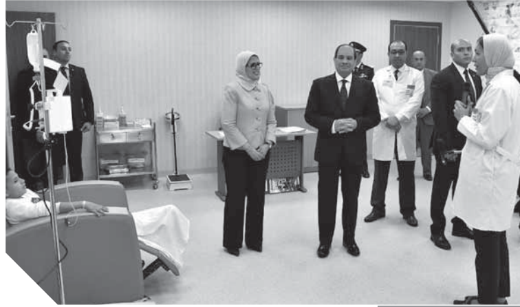
الرئيس يزور المرضى خلال تواجده في بورسعيد

وتابع: «إذا أردنا عمل منطقة اقتصادية في الأربع مناطق الصناعية، سواء في شرق بورسعيد أو السخنة أو شرق وغرب القنطرة والإسماعيلية كان لابد من العمل بهذا الحجم لكن يسهم في حركة النقل، موضحاً أن محور ٢٠ يونيو والذي يبدأ من بورسعيد حتى العين السخنة وهو مواز لطريق الإسماعيلية - بورسعيد بلغت تكلفته ٨,٥ مليار جنيه».