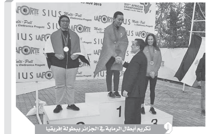
تكريم أبطال الرماية في الجزائر ببطولة إفريقيا