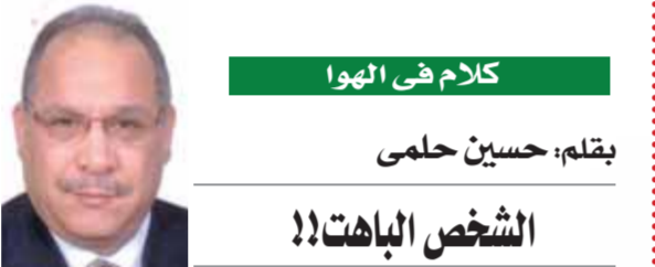
كلام في الهوا