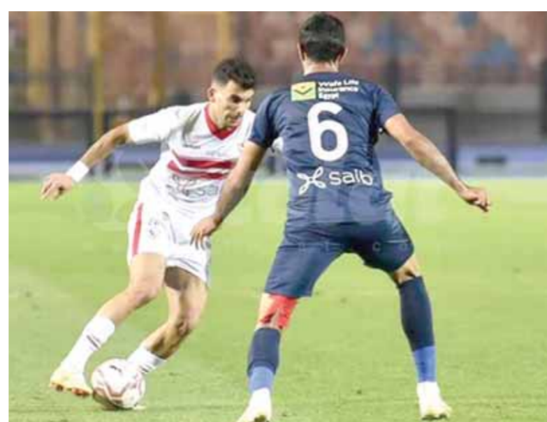
الزمالك وإبنى.. مواجهة صعبة للفريقين