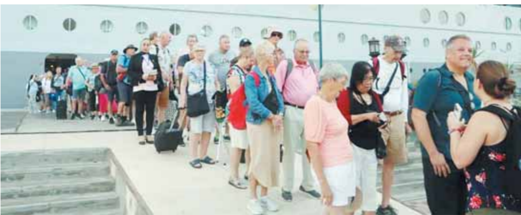
طبع بمطابع الأخبار

إحداث الترويج السياحي المنشود حيث تحمل البواخر التي تزور ميناء بورسعيد العديد من السياح، كما تم التنسيق بين كافة الجهات لتحقيق الاستغلال الأمثل لإمكانات بورسعيد لإحداث رواج سياحي يساهم في عودة بورسعيد لمكانتها الراقدة ووضنها على خريطة السياحة العالمية، وكان الميناء قد استقبل الأيام الماضية عددا من السفن السياحية العملاقة، مما يعد دليلاً على عودة السياحة بالمنطقة وجاهزية لاستقبال هذا النوع من السفن والمتاح المختلفة وجولات حرة ببورسعيد لأفراد الطاقم وبعض الركاب وسوف تغادر السفينة الميناء متجهة لميناء سفاجا، ووجه محافظ بورسعيد بتوفير كافة سبل الراحة للسياح خلال زيارتهم لبورسعيد لما تمثله من أهمية في عكس الصورة الحضارية والسياحية للدولة المصرية على أرض بورسعيد والإسهام في التنمية السياحية في موانئ المنطقة ومعاملات الأمن بها.