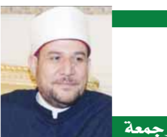
أ.د/ محمد مختار جمعة