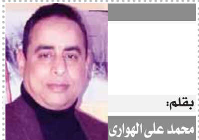
يقلم: محمد على الهوارى