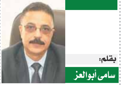
بقلم: سامي أبو الوفاء