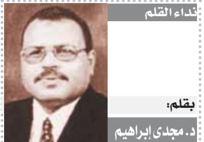
يقلم: د. مجدى إبراهيم