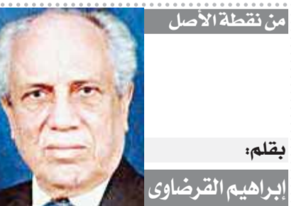
من نقطة الأصل