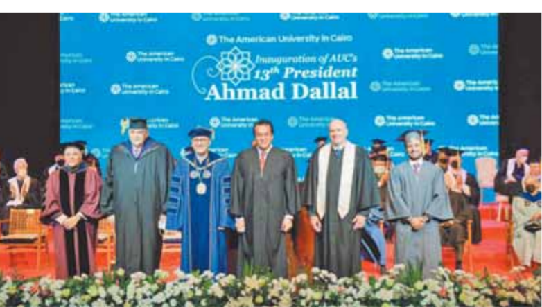
جانب من الاحتفال

كتبت- زكى السعدنى: شهد د. خالد عبدالغفار، وزير التعليم العالى والبحث العلمى، أمس الاثنين، فعاليات احتفال الجامعة الأمريكية بالقاهرة، بمناسبة تنصيب د. أحمد دلال، الرئيس الثالث عشر للجامعة، وبحضور شارك تيرينج، رئيس مجلس أوصياء الجامعة، ود. أشرف حاتم، مستشار الحكومة المصرية بالجامعة، وعدد من رؤساء الجامعات المصرية، والشخصيات العامة، وأعضاء هيئة التدريس والطلاب بالجامعة الأمريكية بالقاهرة، وذلك بقاعة باسيلي فى حرم الجامعة بالقاهرة الجديدة.