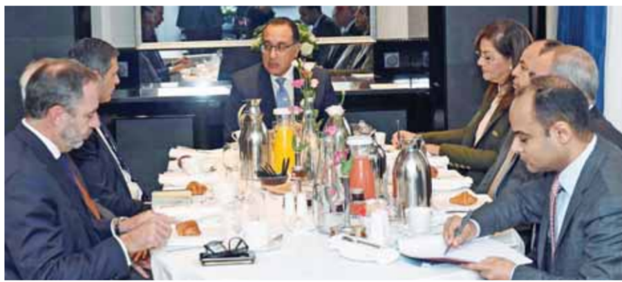
مدبولي خلال توقيع مذكرة التفاهم

ويجوب بند البرنامج القطري، ستركز جميع المحاور بشكل قوي على المساواة بين الجنسين ودمج النساء والشباب في الاقتصاد والمجتمع، وكذلك على دمج القطاع غير الرسمي في الاقتصاد. وسيدعم البرنامج أيضاً العمل الإقليمي لمنظمة التعاون الاقتصادي والتنمية في منطقة الشرق الأوسط مثل مبادرة منظمة التعاون الاقتصادي والتنمية لمنطقة الشرق الأوسط بشأن الحركة والتجارة التنافسية من أجل التنمية، باعتبار مصر شريكاً أساسياً في هذه المبادرة. من جهة أخرى عقد رئيس مجلس الوزراء، قبل التوقيع، جلسة مباحثات موسعة مع السكرتير العام للمنظمة كما عقد لقاء مع سفراء الدول الأعضاء في منظمة التعاون الاقتصادي والتنمية «OECD»، بحضور الوفد الوزاري المصري، وسفير مصر في باريس. وتم التوقيع في «الكتاب الذهبي» الذي يعد السجل التاريخي لهذه المنظمة.