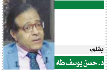
د. حسن حنفي.. بين السماء والأرض

● سألتني أحد الأصدقاء.. هل هذه رسالة للخارج؟ قلت له: هذه رسالة للدخول بان الشعب المصري الذي تحمل صعب المرحلة الماضية من مواجهة مع الإرهاب، وعدم الاستقرار الأمنى حتى عام ٢٠١٨ حصل الآن على نتائج مساندة لجيشه وشرطته في مواجهة القتلة. ● القرار يعني أن مصر اليوم وصلت إلى مرحلة السيطرة الكاملة على منابع تمويل وتجنيد وتشغيل التنظيمات الإرهابية، بعد عدة سنوات من المواجهات المباشرة، مع هذه التنظيمات التي كانت سبباً في المناطق الحدودية التي كانت تعاني من سطوة هذه الجماعات عليها، ولكن الملاحظ أن السنوات الثلاث الماضية شهدت سيطرة كاملة من الجيش والشرطة، وظهرت قدرة الدولة على إدارة المناطق التي كانت تعاني من سيطرة الإرهاب عليها، بدرجة مدهشة بعد سنوات قضيناها في حرب شرسة دفعنا فيها أرواح شهداء بيرة من خيرة شباننا حفاظاً على وحدة التراب الوطنى الذى أرادت القوى الظلامية تحويله إلى بؤرة لهدم الدولة المصرية، ونظفة انطلاق إلى باقى المنطقة لتحويلها إلى بلدان تتصارع وتتقاتل من أجل تنفيذ مخطط رفع رايات الإرهاب -المتاحرة أصلاً- لتحتل باقى شعوب المنطقة إلى لاجئين.