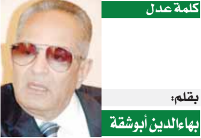
بقلم: بهاء الدين أبوشقة