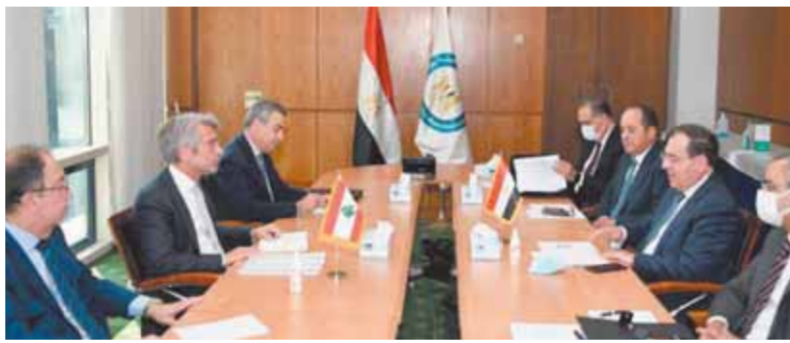
وزير البترول خلال اجتماعه بوزير الطاقة اللبناني

بسرعة إنهاء الإجراءات اللازمة لوصول الغاز الطبيعي المصري إلى لبنان، مضيفاً أنه تم الاتفاق على إجراء المعاينة والتقييم لخط نقل الغاز الطبيعي الواصل بين سوريا ولبنان في إطار استكمال الترتيبات المطلوبة لتجهيز البنية الأساسية اللازمة لنقل الغاز من مصر.