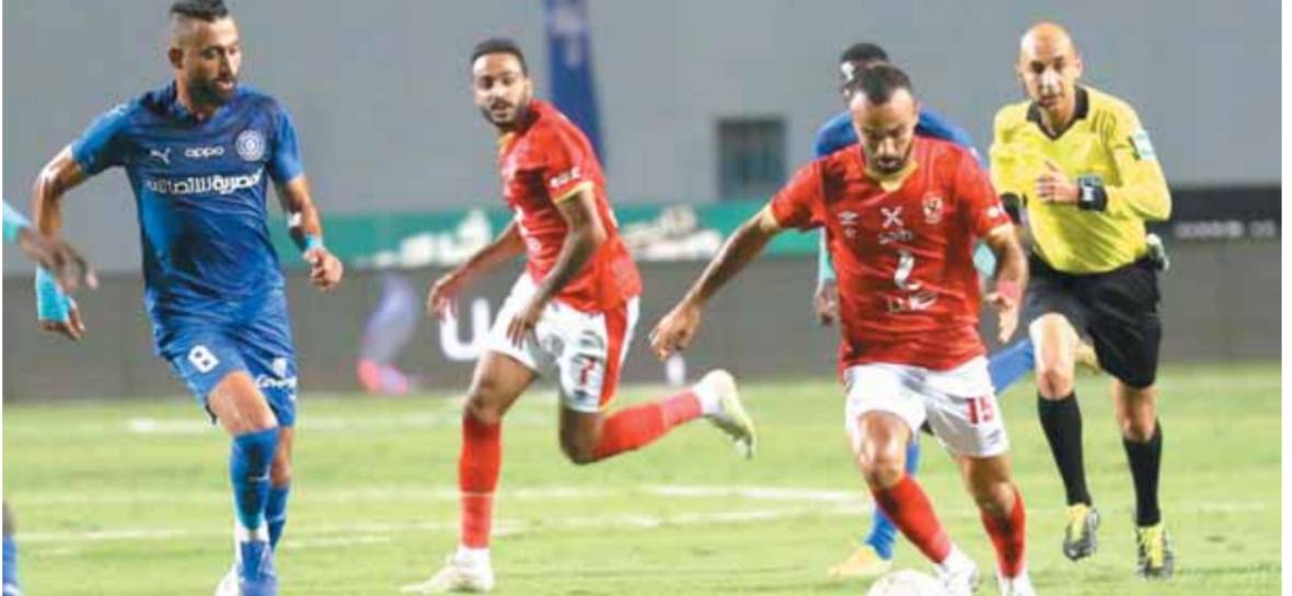
معظم اللاعبين الاساسيين سيغيبون عن الاهلى امام اسوان

موسيمانى المدير الفني للأهلى لابعيه الاساسيين راحه وخامسة الدوليين الذين ينضمون لمعسكرات منتخبات بلادهم فى الفترة القادمة بجانب اختبار قدرات بعض البدلاء تمهيدا لحسم شكل القائمة فى الموسم الجديد. ويعتمد موسيمانى على تشكيلة تضم على الأرجح الحارس على لطفى وامامه رباعى خط الدفاع أحمد رمضان بييكهم وسعد سمير ورأسى ربيعة ومحمود وحيد بينما يقود خط الوسط المالى أيو ديانج وكريم وليد نيدفيد وأحمد نبيل كوكا وفى الهجوم ناصر ماهر وصالح محسن ومحمد شريف.