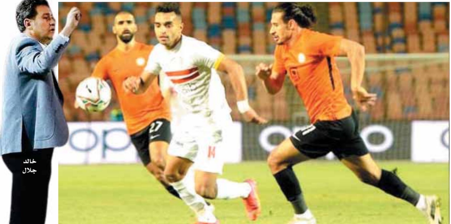
الزمالك يسعى للفوز على البنك الأهلى فى ختام الدوري الليلية

ولا أقول أنه متعمد ولكن هذا ما شعرت به». كان مؤثراً ومزعجاً لأى مدرب، ولكن نجح اللاعبين المسؤول إلا أغامر بمباراة ما بسبب لاعب بعينه، ليس دورى أن أطرح سؤالاً للاعبى الفريق هل أنتم المرضى قبال كارتيرون : «أعلم تماماً أن مركز حراسة المرمى شائك، وهذا ليس بجديد.. احتاج لاعبين يدومون حتى استطيع أداء مهمتى، كنت أشعر بالفعل أن هناك تباطؤ ما من جانب جنش،