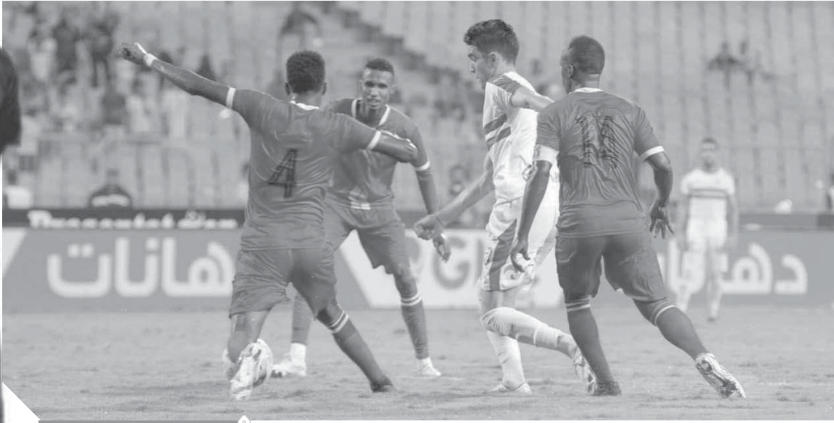
الزمالك يستعد لمواجهة المقاصة

زبرو لخط الوسط محمد أوتاجم وأشرف بن شرقي وشيكابالا ويوسف أوباما وعمر السعيد ومصطفى محمد لخط الهجوم. على الجانب الآخر، اطمأن الجهاز الفني على جاهزية طارق حامد بعد أن شارك في التدريبات الجماعية أمس الأول بعد أن أنهى البرنامج التأهيلي الخاص به والموضوع له من الجهاز الطبي الذي أدى إلى غيابه عن لقاء الذهاب والعودة أمام ديكاها الصومالي.