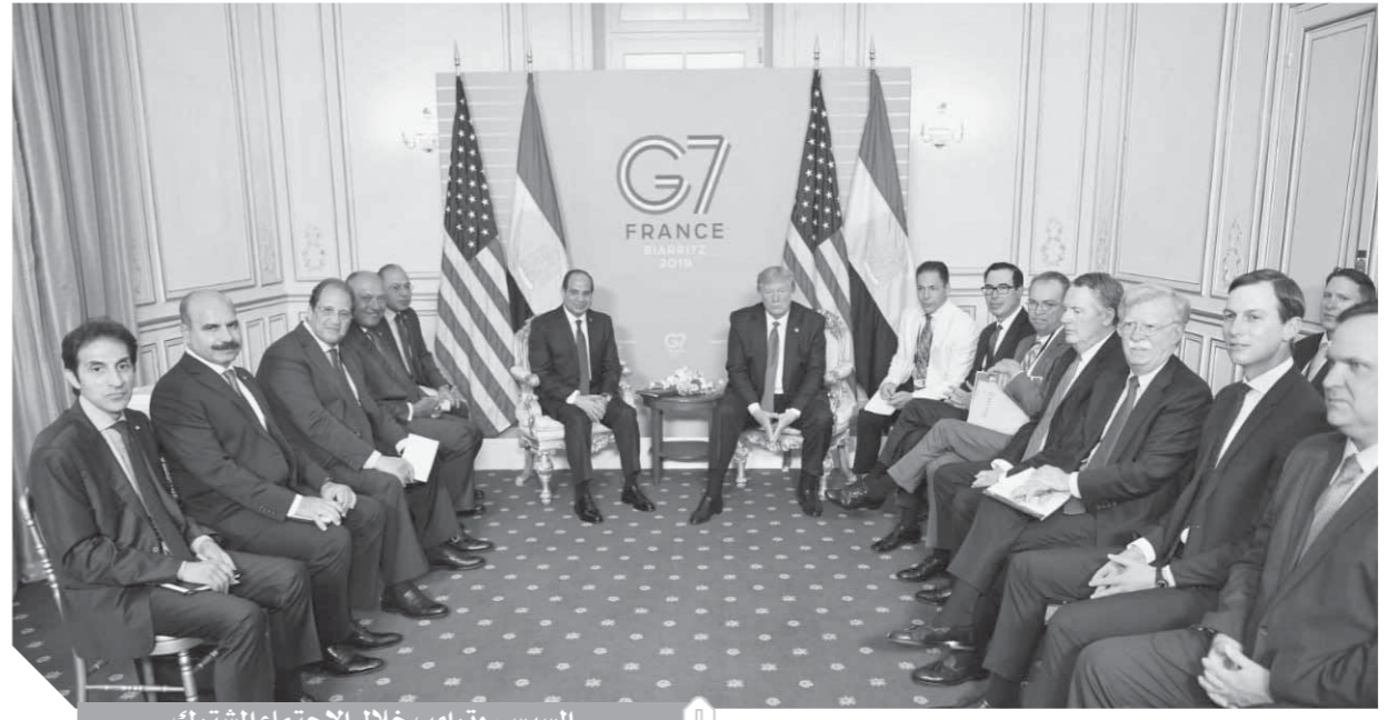
السيسي وترامب خلال الاجتماع المشترك