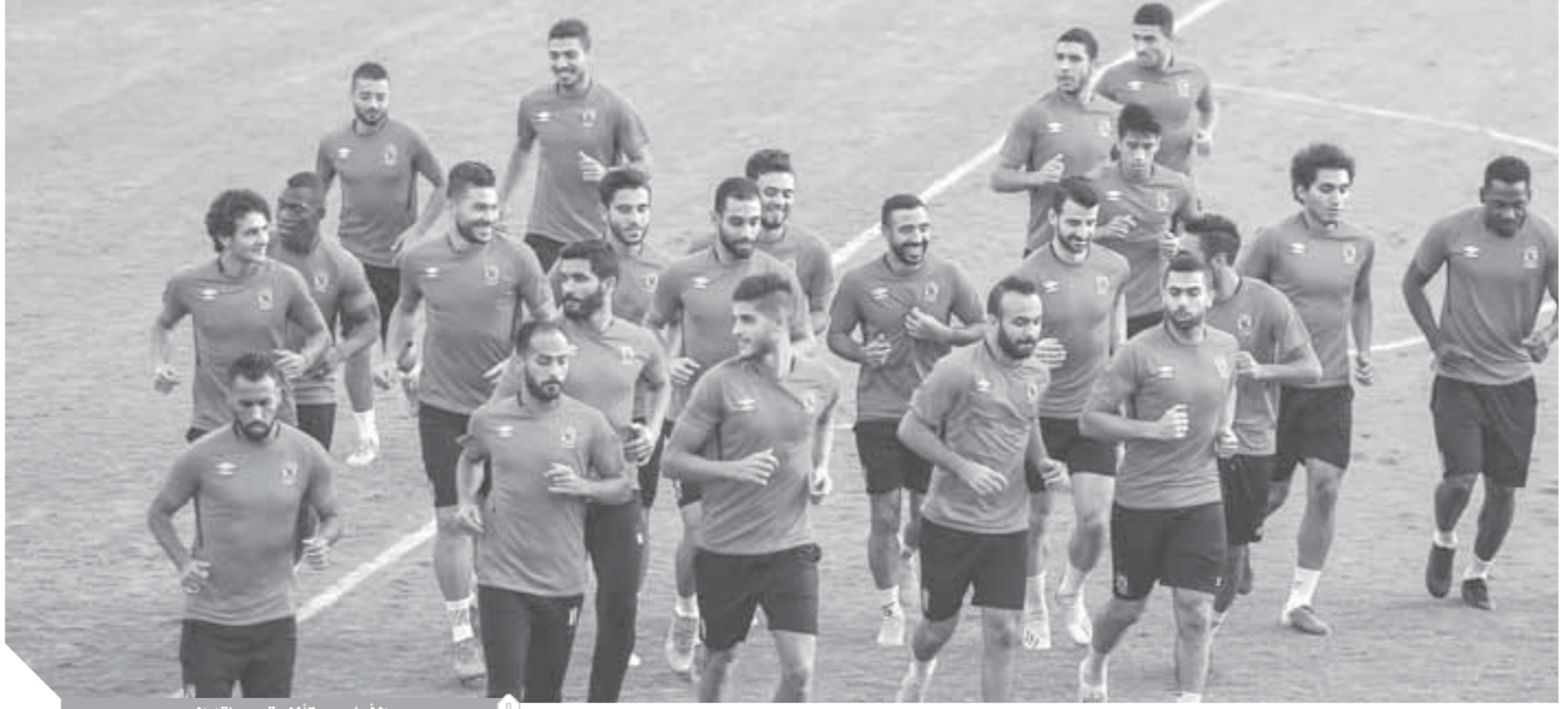
الأهلى يستأنف تدريباته اليوم

ليس من الممكن أن تسعى اللجنة المشكلة من الجمعية العمومية لفرض قرار قابل للطعن بالقوة والصوت العالى واستغلال قوتها وللجوء للجهات الدولية. طلب أخيراً إلى عمومية الجبالية قبل أن تناقشوا اللوائح لابد أن تكون البداية مع لوائح الانتخابات والترشيحات بما يضمن مستقبلاً وجود مجالس إدارات باختيار سليم تتشكل في النهاية مجالس قوية قادرة على التطوير وتمتلك القوة للتصدي لسطوة الأندية، خاصة الكبار بدلاً من استمرار لعبة التوازنات والمصالح.. استقيموا برحمتك الله.