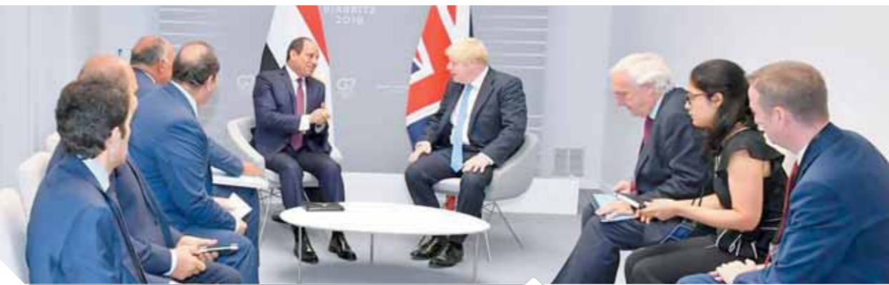
مباحثات مهمة يجريها السيسي وجونسون لدعم العلاقات المصرية البريطانية

وأعرب رئيس الوزراء البريطاني عن سعادته بلقاء الرئيس السيسي، وتقديره للمشاركة المصرية الفعالة في اجتماعات قمة مجموعة السبع، في ضوء