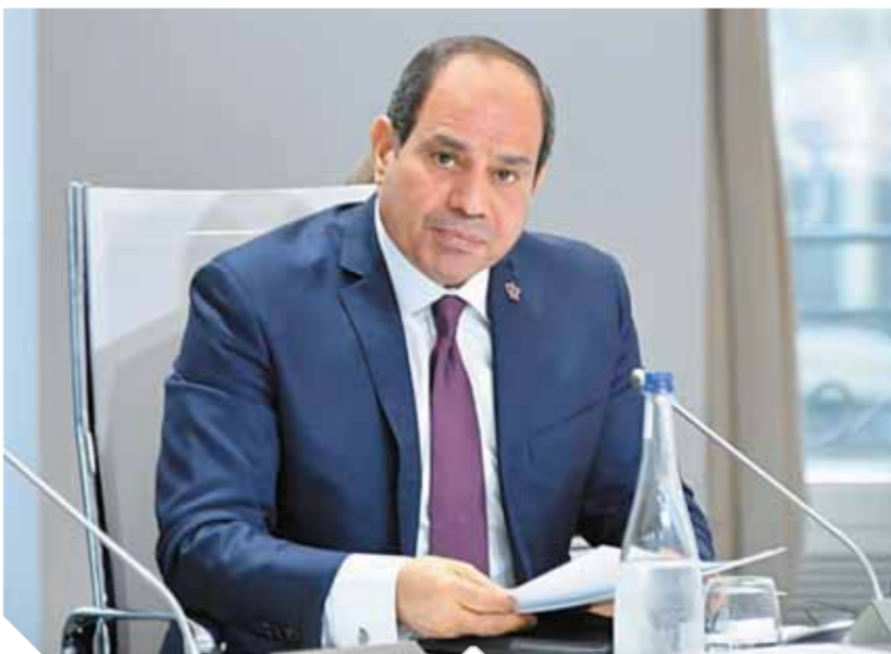
السيسي يلقي كلمة خلال جلسة المناخ

ثانياً: أهمية توفير التمويل المستدام والمناسب للدول النامية لمواجهة تلك الظاهرة،