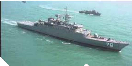
المدمرة الإيرانية «سهند»

١.٢ مليار دولار للتوسع في أنشطة البحث والاستكشاف والتنمية من خلال حفر ١٣ بئراً تنموية واستكشافية جديدة وإجراء ١٢ عملية لإصلاح الآبار وهو ما يساهم في الوصول إلى معدلات الإنتاج المستهدفة ودعم الاحتياطيات البترولية. وأضاف حمدان أنه في إطار جهود تطوير وإحلال البنية الأساسية والتسهيلات الإنتاجية لتوفير أعلى درجات الأمن والسلامة بالحقول والحفاظ على كفاءة التشغيل، فقد جرى الانتهاء من تنفيذ عدة مشروعات بكل من حقل أكتوبر ومنطقة رأس بكر والوحدة ١٠١ بصنعك استخلاص الغازات، وأوضح حمدان، أنه يجري العمل حالياً في تنفيذ ٤ مشروعات جديدة تشمل مشروع إعادة تأهيل البنية الأساسية لتسهيلات الإنتاج بمحطة مرجان- ٣٦ بالإضافة إلى مشروع إحلال شبكة الخطوط البحرية وتطبيق تقنية حقن المياه قليلة الملوحة بحقل بدرى والمرجان لتعظيم إنتاج الزيت الخام، وجرى حالياً العمل على الإجراءات الخاصة بمشروع معالجة مياه الصرف الصناعي بحقول رأس شقير طبقاً لأفضل المواصفات والمعايير العالمية بما يساهم في دعم التوافق البيئي، مشيراً إلى الالتزام بالصوامر بإشراطات الأمن والسلامة المهنية، التي كان لها أكبر الأثر في إنجاز الأعمال بصورة آمنة. كما أعلنت وزارة البترول، الإعداد للبدء في حفر بئرين جديدين بحقل غاز آتول والقطامية بمنطقة امتياز شمال ديماط البحرية بدلتا النيل بالبحر المتوسط بإجمالي استثمار ٢٨ مليون دولار تمهيداً لوضعها على خريطة الإنتاج العام المقبل.