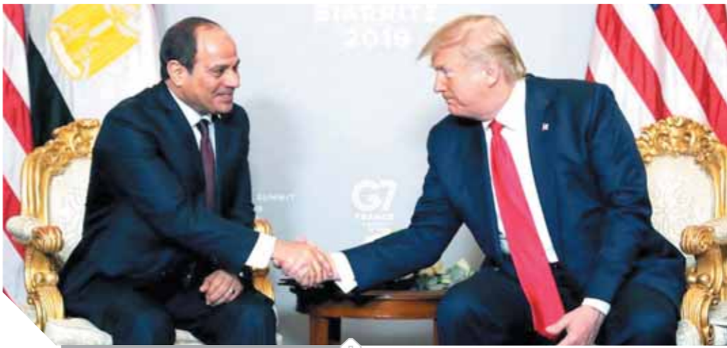
ترامب يرحب بالرئيس السيسى

أشاد الرئيس الأمريكى دونالد ترامب بما حققته مصر تحت زعامة الرئيس عبدالفتاح السيسى، وقال: إن مصر حققت تقدماً كبيراً تحت زعامة السيسى والفريق الممتاز الذى يعمل معه. وأضاف ترامب: «أود أن أهنئكم على ذلك كثيراً». جاء ذلك خلال لقاء الرئيس السيسى نظيره الأمريكى ترامب، على هامش قمة مجموعة الدول السبع الصناعية الكبرى فى فرنسا. ورد السيسى، على إشادة ترامب قائلاً: «زعامة الرئيس، أنا بشكر واحترام والتقدير المتبادل بيننا أكثر من عظيم». مؤكداً: «أكن لفخامة الرئيس كل الاحترام والتقدير». واحتضنت مدينة بياريتز الفرنسية على مدى ٣ أيام قمة قادة دول مجموعة البلدان الصناعية السبع الكبرى ليبحث عدد من الموضوعات ذات الاهتمام المشترك، ومن بينها الاتفاق النووى مع إيران وحرائق غابات الأمازون والحرب التجارية بين الدول الكبرى، إلى جانب مسألة إعادة روسيا للمجموعة. وعقد الرئيس عبدالفتاح السيسى أمس لقاءً مع رئيس الولايات المتحدة الأمريكية «دونالد ترامب».