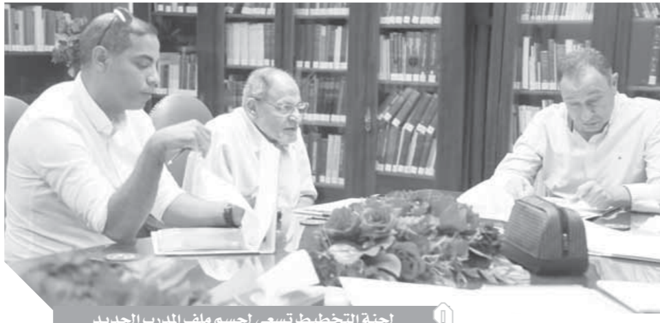
لجنة التخطيط تسعى لحسم ملف المدرب الجديد