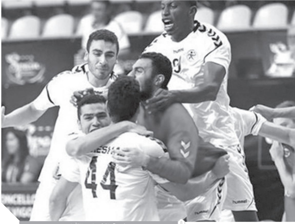
فرعنة منتخب اليد بالتأهل

الجدير بالذكر أن البعثة المصرية المشاركة فى هذه الدورة تضم ٢٩ لاعبا ولاعبة، لخوض منافسات ٢٤ لعبة.