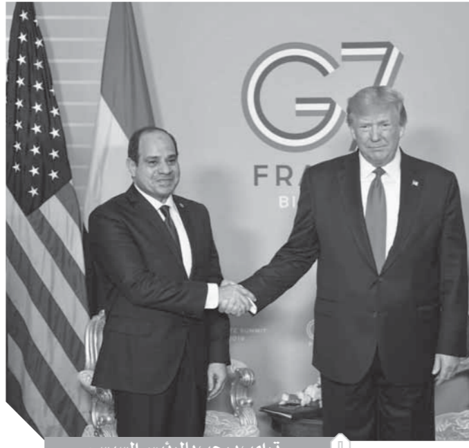
ترامب يرحب بالرئيس السيسي

ولأن النائب المفروض أن يكون سنداً للشعب وللدولة عن طريق شعبيته الحقيقية لذلك يجب أن يكون قد فاز عن جدارة بثقة من انتخابوه عن طيب خاطر دون أي مؤثرات مادية.