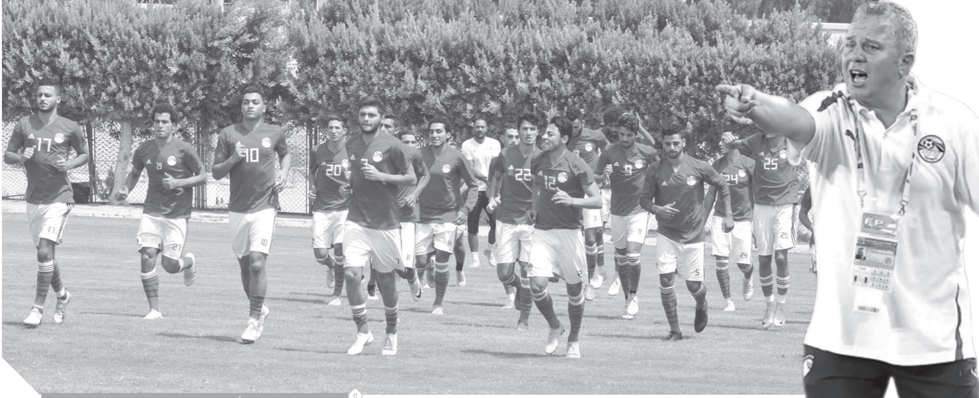
المنتخب الأولمبى يستعد لوديتى السعودية