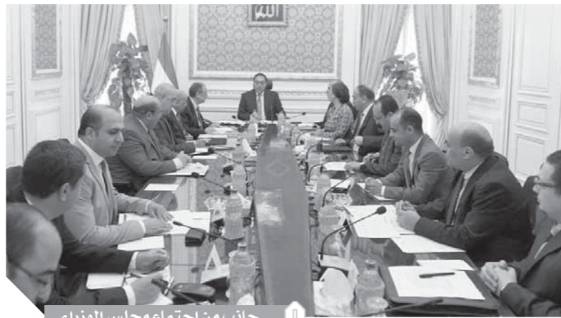
جانب من اجتماع مجلس الوزراء

«مدبولي»: القانون يهدف إلى التغلب على المشكلات والارتقاء بالخدمات المقدمة للمواطنين