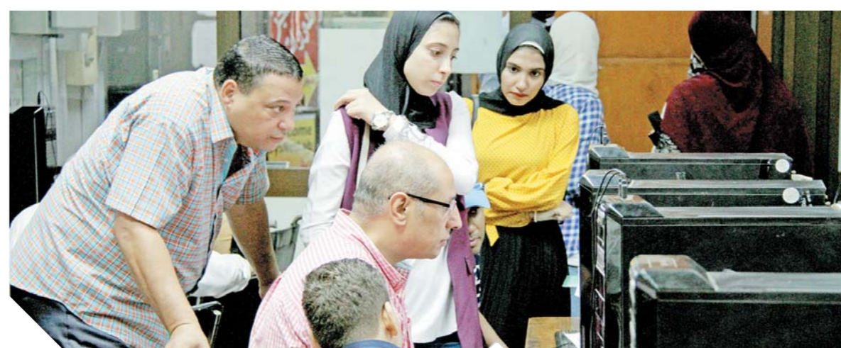
الطلاب خلال تسجيلهم رغبات الالتحاق بالجامعات

٩٩% للطب.. و٩٨,٥% للأسنان.. و٩٨% للصيدلة.. و٩٥% للهندسة.. و٩٤,٥% للتخطيط العمرانى