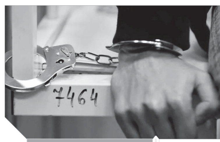
ربط المدمنين بقيود حديدية

شرق موسكو، قام بعزل المدمنين مع المجتمع ومنعهم من التجول بحرية، وأن طاقم العمل كانوا يستخدمون الأقفال والقضبان المعدنية على التواخذ، والأصفاد لربط الناس بالسريير، وضربهم بصورة وحشية وكانوا يمتعون عنهم الكائن في منطقة تبعد نحو ٢٢٠٠ كيلومتر