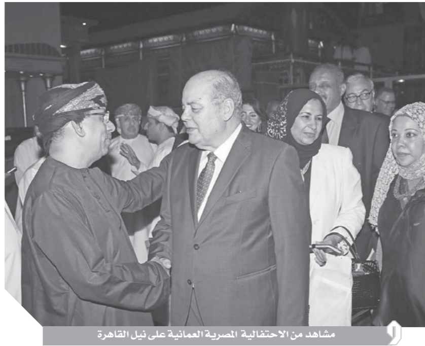
مشاهد من الاحتفالية المصرية العمانية على نيل القاهرة