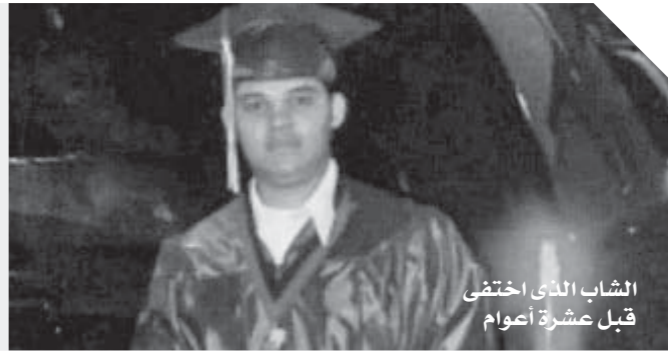
الشباب الذي اختفى قبل عشرة أعوام