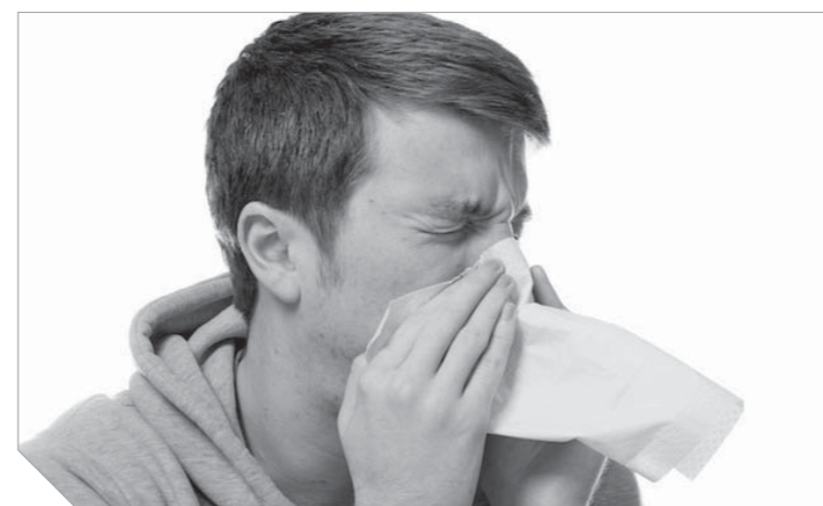
فيروس الزكام يعالج سرطان المثانة

يشرى طبية قد تبدو غريبة لنا، فيروس للزكام يقضى على مرض سرطان المثانة اللعين، فهذا الفيروس يهاجم الخلايا السرطانية ويحفز الجهاز المناعي على مواجهتها وتدميرها. هذا ما كشفته دراسة بريطانية حديثة بجامعة «سري»، حيث أكد الباحثون قدرة فيروس الزكام الشائع، والذي يتسبب في الإصابة بنزلات البرد، على قتل خلايا سرطان المثانة والتخلص منها، وتم إجراء الأبحاث على عدد صغير من المرضى، وتأكد اختفاء جميع علامات المرض تماماً من بعض الأشخاص المصابين، بينما كانت هناك أدلة على موت الخلايا السرطانية تماماً في ١٤ مريضاً باستخدام سلالة فيروس الزكام، وقال الباحثون أن هذا الاكتشاف الطبي سيساعد في إحداث ثورة في علاج سرطان المثانة، ويقطع من خطر عودة الخلايا السرطانية مرة أخرى.