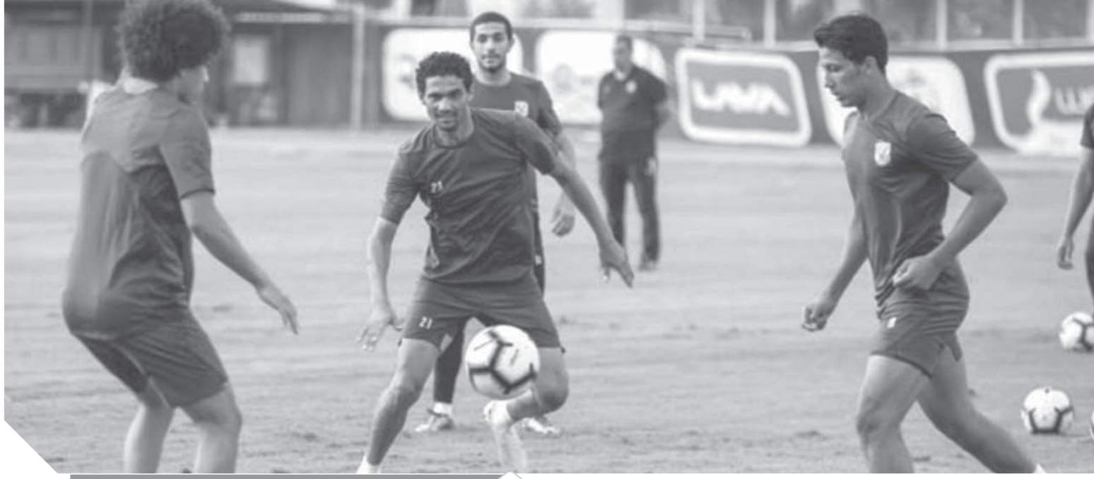
الأهلي يختتم تدريباته لمواجهة الزمالك