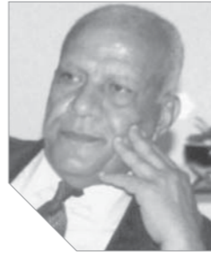
المستشار ليب حليم لبيب يكتب:

يعبر الحزب السياسي عن منظمة جماهيرية للأفراد في سياق انتماءاتهم الفكرية، وتقوم على أفكار أيديولوجية موحدة تجسد أولويات مجتمعية محددة، وتوفر العمل المشترك في إطار المناقشة السياسية، وتبغى الوصول إلى السلطة من أجل إحداث تغييرات اجتماعية منشودة وفق تصورات مستقبلية مرسومة.