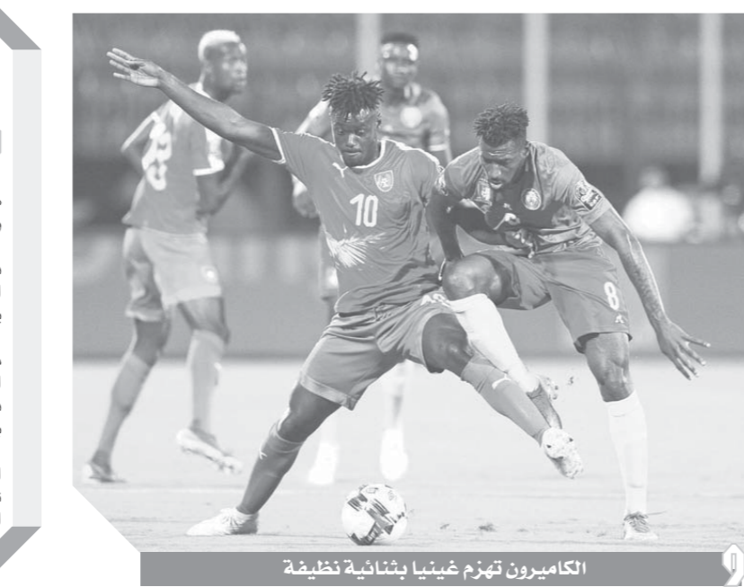
الكامبيرون تهرم غينيا بثباتية نظيفة

كتب- وتيد خليل: أصبح المنتخب الكاميرونى بقيادة المدرب كلارنس سيدورف هو أول منتخب ينجح في تحقيق الفوز بمباراته الأولى بالبطولة وهو حامل للقب منذ تسع سنوات. وكان المنتخب الوطنى هو آخر حامل للقب يتمكن من الفوز فى مباراته الافتتاحية بعد الفوز على نيجيريا 1-2 فى دور المجموعات عام 2010 وهى البطولة التى ضارها القرعة وهو يحملون لقب نسختى 2006 و 2008. وبدأت عقدة المباراة الافتتاحية لحامل اللقب بعد أن فشل منتخب مصر فى التأهل للبطولة عام 2012 والتي توج بها المنتخب الزامبي والذي فشل بدوره فى تحقيق الفوز على إثيوبيا فى أولى مبارياته بنسخة عام 2013 لتنتهى المباراة بالتعادل بهدفٍ لثمة. وتكرر الأمر عام 2010 عندما فشل المنتخب النيجيرى حامل اللقب فى التأهل للنهايات ليحجز منتخب كوت ديفوار باللقب، ثم يخفق فى تحقيق الفوز فى مباراته الأولى بكان 2017 حيث انتهت مباراته امام توج بالتعادل السلبى.