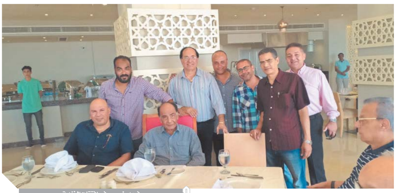
فريد خميس في افتتاح الفندق

ويبدو أن الشركة أحسنت الاختيار جيداً، فالفنان حسين فهمي بما له من رصيده مصري وعربي هو من الفنانين النادرين الذي تخصص في تقديم فن راق وهادف مثل ومازال إحدى ايقونات السينما على مر عصورها. حسين فهمي الذي مازال يمثل (فارص الأحلام) بشخصيته الطاغية وعصرته اللافتة يعكس طبيعة مشروع جنوب الذي يعد أحد مشاريع شركة الشرفيون للتنمية العمرانية في تقديم منتج عقارى بنكهة شرقية طاغية ولحمة عصرية لافتة تتناغمان لتقديم مشروع