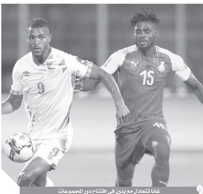
غانا تتعادل مع بنين في افتتاح دور المجموعات

كتب- وتيد خليل: حقق اندرى ايو قائد منتخب غانا إنجازاً كبيراً بعد أن أصبح الهدف التاريخي للنجوم السوداء في تاريخ مشاركتهم بكأس الأمم الإفريقية، واعتلى ايو صدارة هدافى غانا في أمم افريقيا بعد أن سجل الهدف التاسع لى في البطولة عندما حرز هدف التعادل لغانا في شباك بنين في المباراة التي جمعت المنتخبين والتي انتهت بالتادل بهدفين لكل فريق في إطار منافسات الجولة الأولى بالمجموعة السادسة بكأس الأمم الإفريقية والتي تستضيفها مصر حتى 19 يوليو المقبل. وتصدر ايو قائمة الهدافين برصيد تسعة أهداف ويفارق هدف واحد عن زميله جيان اسامواه صاحب الثمانية أهداف والذي بدأ المشاركة مع المنتخب الثاني للكرة الافريقية قد بدأ المشاركة مع المنتخب الثاني بداية من نسخة عام 2008 الا أنه لم يسجل أي أهداف، قبل أن يفتتح سجله الهدافى بالكاد قبل أن يسجل اول اهدافه عام 2010 في شباك بوركينا فاسو. وفي أمم افريقيا 2012 سجل ايو هدفين آخرين، ثم ثلاثة أهداف في النسخة التالية عام 2010، كما سجل النجم الغانى هدفين في البطولة الاخيرة والتي اقيمت بالجاويان عام 2017.