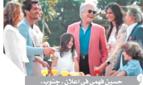
حسين فهمي في اعلان «جنوب»

الترام الفنان وشعبيته «مصرياً وعربياً» يتماشيان مع أهداف الشركة في تقديم منتجات عقارية «موثوقة»