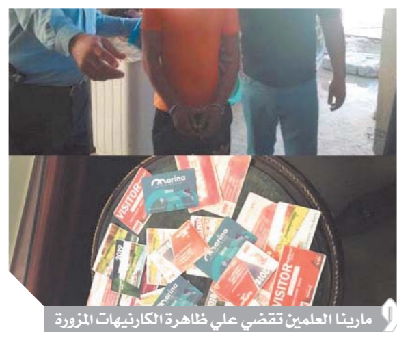
مارينا العلمين تقتضي على ظاهرة الكارنيهات المزورة

جاءت أول هذه الخطوات من خلال إحكام الحنق على فوضى الدخول إلى مارينا من خلال تطبيق أحدث تكنولوجيا في العالم على كارنيهات الدخول إلى مارينا وكذلك بإدراج السيارات. جانبته يقول هشام زعزوع إن الكارنيهات هذا العام أصبحت لأول مرة في مصر مزودة بتكنولوجيا التعرف باستخدام موجات الراديو (RFID) ورمز الاستجابة السريعة (QRCode). بالإضافة إلى العلامات المائية مما يجعل الكارنيه يعمل جميع بيانات المالك الأصلي المسجلة على الكمبيوتر من واقع البطاقات الشخصية وشهادات ميلاد الأولاد، وتصدر بشكل مميكن تماماً مما يجعل التزوير مستحيلاً.