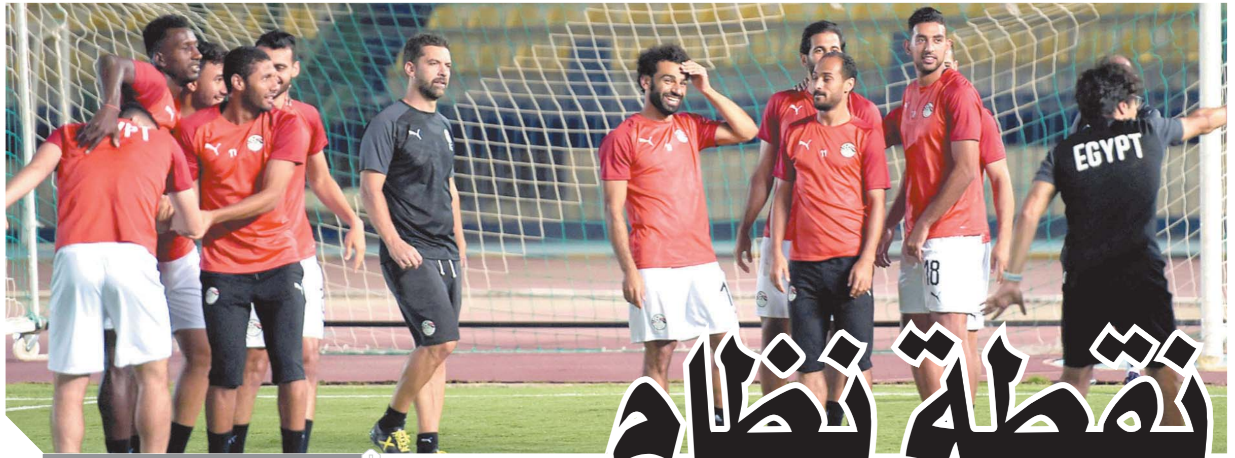
المنتخب الوطنى يعود للتدريبات استعداداً لموقعة أوغندا

٢٣ من شوال ١٤٤٠هـ - ٢٧ يونيو ٢٠١٩م - ٢٠ يونيو ١٣٧٥ق