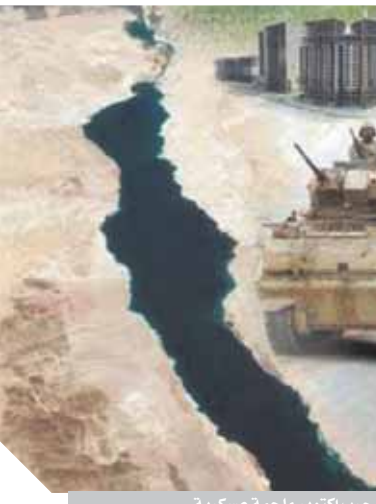
حرب أكتوبر ملحمة عسكرية