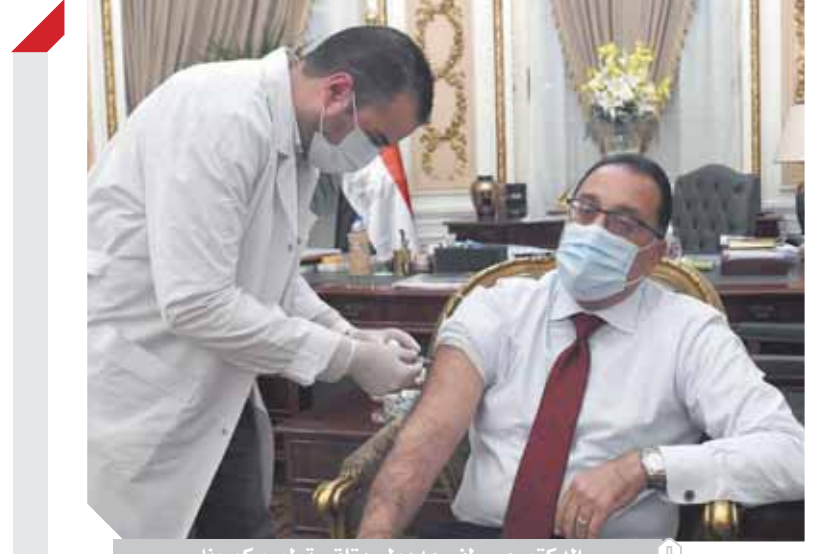
الدكتور مصطفى مديبولي يتلقى تطعيم كورونا

وحذر الوزيران من تصاعد حدة الاعتداءات والأعمال الاستفزازية ضد الفلسطينيين وإعاقة وصولهم إلى المسجد الأقصى المبارك، والتي تصاعدت منذ بداية شهر رمضان المبارك. وشددوا على ضرورة وقف هذه الأعمال والانتهاكات التي تستهدف الهوية العربية الإسلامية والمسيحية للقدس