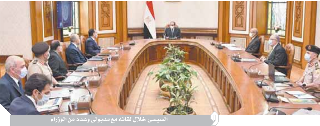
السياسي خلال لقائه مع مذبولى وعدد من الوزراء

الموقف التنفيذي للمشروع القومي لاستصلاح الأراضى الزراعية فى وسط وشمال سيناء.. وقد وجه الرئيس فى هذا الإطار بمواصلة جهود التنمية الشاملة فى شبه جزيرة سيناء، خاصة مشروعات استصلاح الأراضى، الهادفة إلى زيادة رقعة الأراضى الزراعية فى وسط وشمال سيناء وإقامة مجتمعات تنمية وسكنية، وذلك فى إطار استراتيجية الدولة الشاملة للتوسع فى الزراعة المتكاملة واستصلاح الأراضى على مستوى الجمهورية، وبالتكامل مع المشروعات الأخرى المماثلة، خاصة فى الدلتا الجديدة فى شمال غرب البلاد، وكذلك فى منطقة توشكى وشرق العوينات بجنوب الوادي. كما وجه الرئيس بتوفير أحدث المعدات والآلات لاستصلاح الأراضى المستهدفة فى سيناء، واستكشاف أفضل الأنشطة الزراعية، وتطبيق أحدث وسائل الري