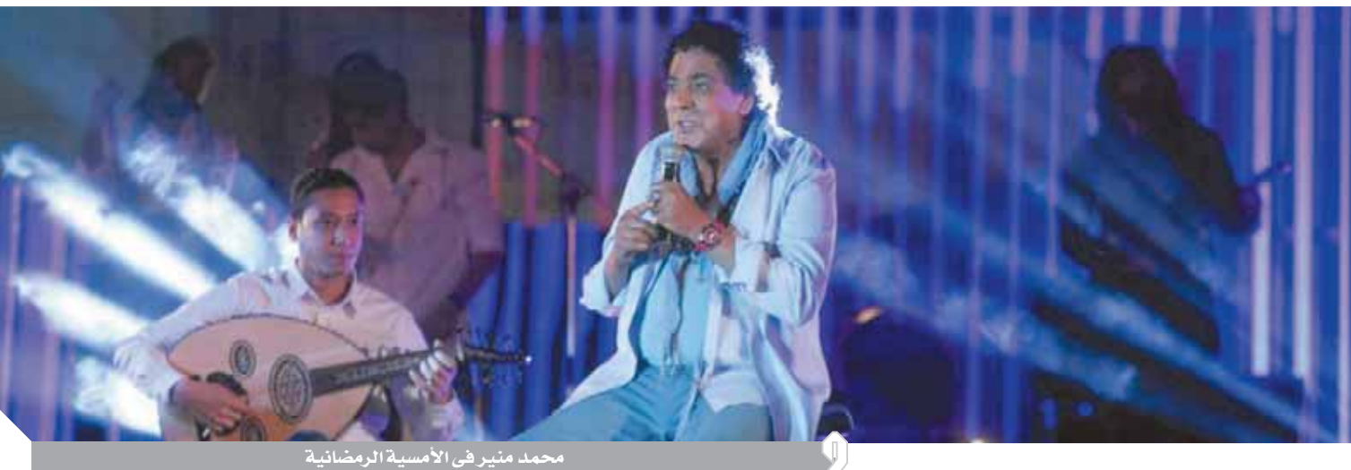
محمد منير في الامسية الرمضانية

المعيد الأسبق لكلية الآداب جامعة الزقازيق