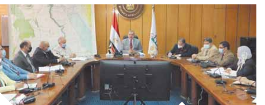
وزير القوى العاملة خلال اجتماعه مع قيادات الوزارة

وشدد الوزير على ضرورة اكتشاف الشباب الصفوف الثانية والثالثة من خلال الدورات التدريبية التي تقدم للعاملين بالوزارة والمديرية لانتقاء أفضل العناصر من بينهم، وإعداد قواعد بيانات متكاملة لهم للاختيار فيما بينهم مستقبلاً من يصلح للوظائف