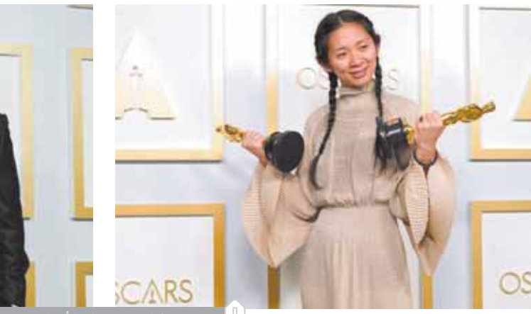
هانزان بجوائز الأوسكار

أفضل سيناريو مقتبس عن سيناريو فيلم The Father. أما أوسكار أفضل تصوير سينمائي ذهبت للفوتوغرافي إريك ميسير شميدت عن فيلم Manik. وجائزة أفضل أغنية أصيلة حصلت عليها أغنية Fight For Me، التي جاءت في فيلم «يهودا والمسح الأسود» وهو فيلم دراما أمريكي عن السيرة الذاتية مأخوذ عن حياة فريد هامبتون، رئيس حزب الفهود السود في أواخر الستينيات في إلينوي، الفيلم من إخراج وإنتاج شاكا كينج، وكتبه كينج وويل بيرسون، استناداً إلى قصة كتبها كينج وبيرون وكيتي وكيت لوكاس. الفيلم من بطولة دانيال كالويًا ولايكت ستانفيلد. وحصد فيلم Sotil، جازتين هما أوسكار أفضل فيلم رسوم متحركة، وأوسكار أفضل موسيقى تصويرية.