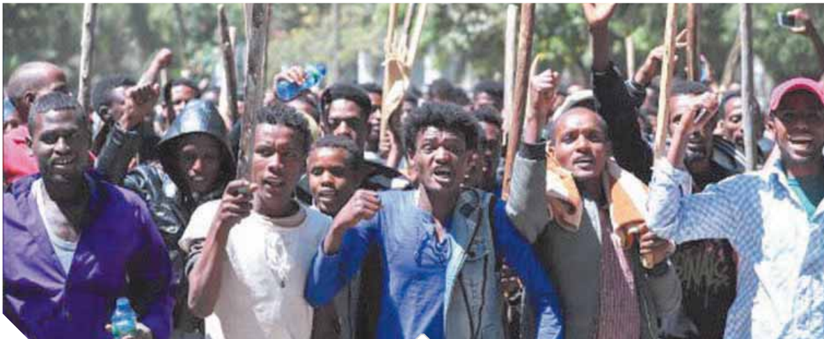
الاشتباكات العرقية تثير القلاقل في إثيوبيا

وكان مجلس الأمن الوطني الإثيوبي أعلن قبل أيام قليلة خلال اجتماعه مع رئيس الوزراء أبي أحمد، أن أديس أبابا ستقوم بعملية الملء الثاني لسد النهضة في الموعد المقرر، مع بدء موسم الفيضان المقبل. وقال مسؤول بارز إن عدد القتلى في الاشتباكات التي وقعت هذا الشهر بين أكبر مجموعتين عرقيتين في إثيوبيا، أورومو وأمهرة، في منطقة أمهرة بشمال البلاد، ربما يصل إلى ٢٠٠ قتيل، رغم أن تقارير سابقة أشارت إلى وقوع ٥٠ قتيلاً فقط. وأكد سكان ومسؤولون في منطقة «أوروما» الخاصة، وهي منطقة في أمهرة يسكنها غالبية من عرق الأورومو، وبلدة أتاي، أن اشتباكات دامية وقعت في المنطقة يوم ١٦ أبريل الجاري.