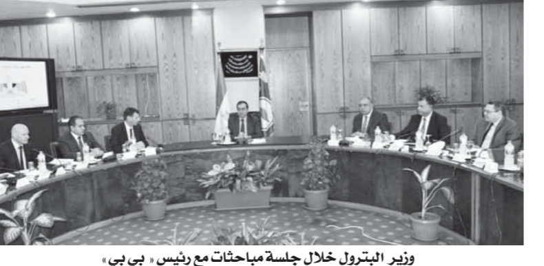
وزير البترول خلال جلسة مباحثات مع رئيس «بي بي»

العالمية ذات الخبرة المتميزة يأتي في إطار حرص قطاع البترول على مساندة المتغيرات العالمية وأوضاع السوق والعمل باستمرار على تطوير وتوسيع البنية الأساسية وتحسين مواصفات المنتجات البترولية لتنمائي مع المعايير العالمية.