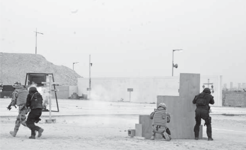
فعاليات التدريب المصري البحريني المشترك