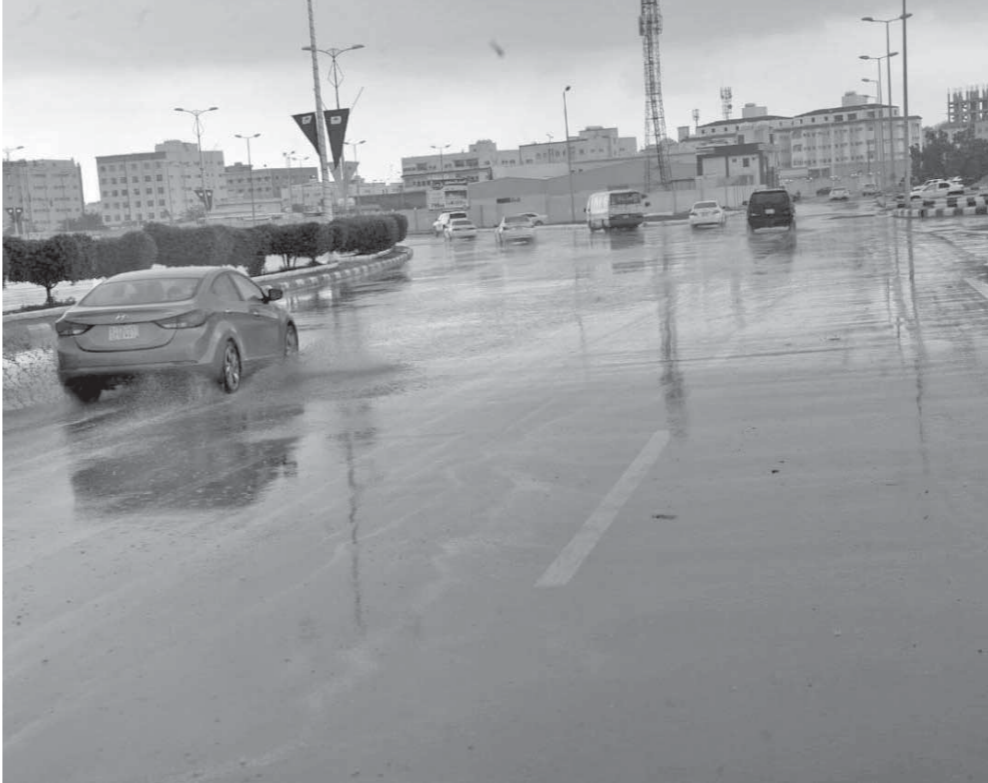
مياه الأمطار أغرقت شوارع القاهرة