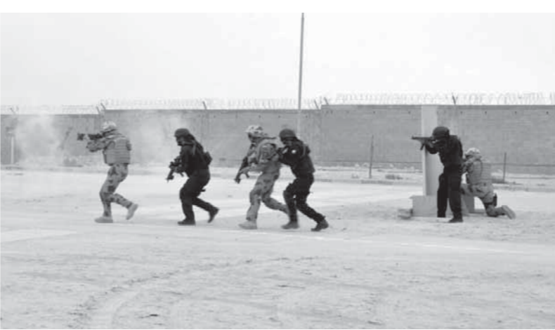
جانب من الفعاليات

استهدفت فعاليات التدريب المصري-البحريني المشترك خالد بن الوليد 2018 الذي نفذته عناصر من وحدات الصاعقة المصرية والقوات الخاصة الملكية البحرينية بحضور عدد من قادة القوات المسلحة البحرينية والمصرية والسفيرة المصرية بالبحرين الذي استمر لعدة أيام بمملكة البحرين الشقيقة، وأعرب قائد القوات الخاصة الملكية البحرينية عن شكره وتقديره للقوات المصرية المشاركة على التعاون البناء والمثمر معرباً عن سعادته بوجود العديد من ضباط القوات الخاصة البحرينية خريجي الكليات والمعاهد العسكرية المصرية. من جانبه، نقل قائد وحدات الصاعقة المصرية تحيات وتقدير الفريق أول صدقي صبحي، القائد العام للقوات المسلحة وزير الدفاع والإنتاج الحربي، للقوات المنفذة للتدريب، مؤكداً عمق الروابط التي تربط بين القوات المسلحة لكلا البلدين، حيث بدأ البيان النهائي للتدريب بتنفيذ أعمال الرماية النمطية وغير النمطية من الأوضاع المختلفة في الميادين المفتوحة باستخدام أحدث الأسلحة والعتاد والتدريب على رماية القنص من مسافات مختلفة، كما تضمنت الأنشطة التدريبية تنفيذ عملية مشتركة للقضاء على العناصر الإرهابية المسلحة والخارجين على القانون وأعمال مقاومة