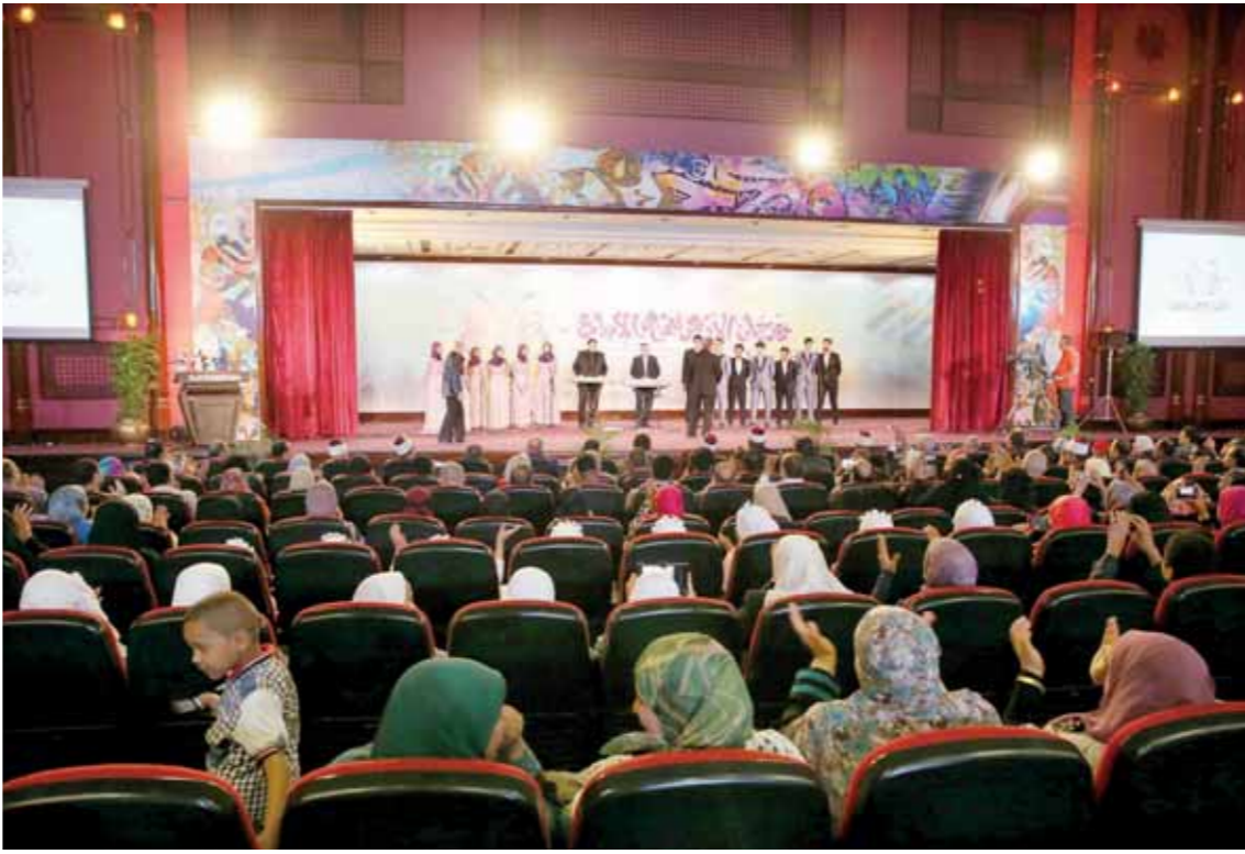
جانب من الفعاليات الفنية بالأزهر