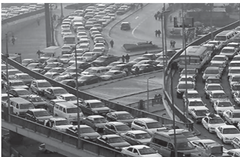
شلل مرورى بسبب الامطار بالقاهرة

وأشارت الثانية البرلمانية ، إلى أن البنية التحتية في الطرق والشوارع الرئيسية غير مهيأة لاستقبال الأمطار والسيول فى ظل بهله عمل الوحدات المحلية، منوهة إلى أن البنية التحتية في مصر يجب أن تكون على أتم الاستعداد لمواجهة أخطار السيول ، وأنه يجب ان يكون رؤساء الأحياء والوحدات المحلية على تواصل تام مع الجميع، وللاستجابة والتحرك لتجنب تفاقم المشكلات.