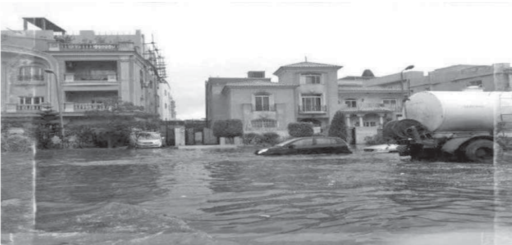
مياه الأمطار اكتسخت شوارع القاهرة الجديدة

كما حرص اللواء خالد عبدالغفار، مساعد الوزير لقطاع أمن القاهرة، على تفقد الحالة المرورية بعدد من محاور العاصمة بالإضافة لمدينة القاهرة الجديدة، وكلف جهات المديرية باستنفار كافة الجهود لمواجهة حالات سقوط الأمطار والتخفيف من آثارها، كما قام رجال المرور بالعمل على تسيير الحركة المرورية والدفع بأوناش مرورية حديثة ومجهزة لرفع السيارات المعطلة نتيجة تساقط مياه الأمطار ومساعدة قائديها على مستوى المدينة ورسد أماكن تجمع