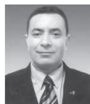
«السياسي» والقومية العربية (2)