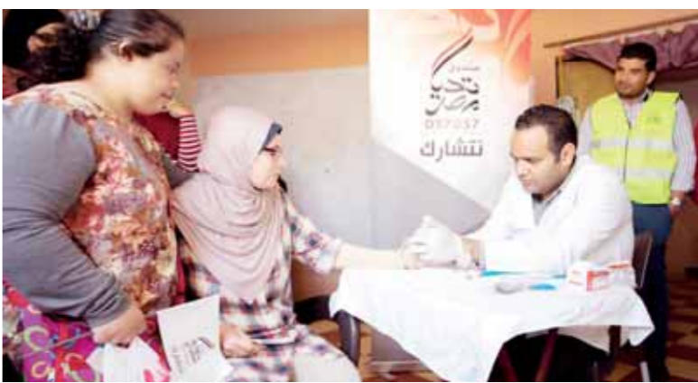
جانب من الكشف الطبي على المواطنين

وعلق آخر ساخراً: «إحباط محاولة للهجرة غير الشرعية والقبض على 200 شاب فى زورق بشاطئ التجمع الخامس». وقال تامر مكاوى مازحاً «لدواعى السفر يخت 16 قدم 150 حضان بيرسى خاص بمننتج التجمع الخامس رخصة عام من المسمحات المائية والوسطاء يمتعون». وأخر: «البيع لدواعى السفر فيلا بالتجمع شارع التسعين ترى البحر مباشرة Sea VIEW للوسطاء يمتعون». ونشر آخر صورة للفنان أحمد ركنى فى فيلم اليه اليوبار معلقاً عليها «الشقة دلوقتى فى التجمع تعملها مكيستين 20 ألف جنيه».