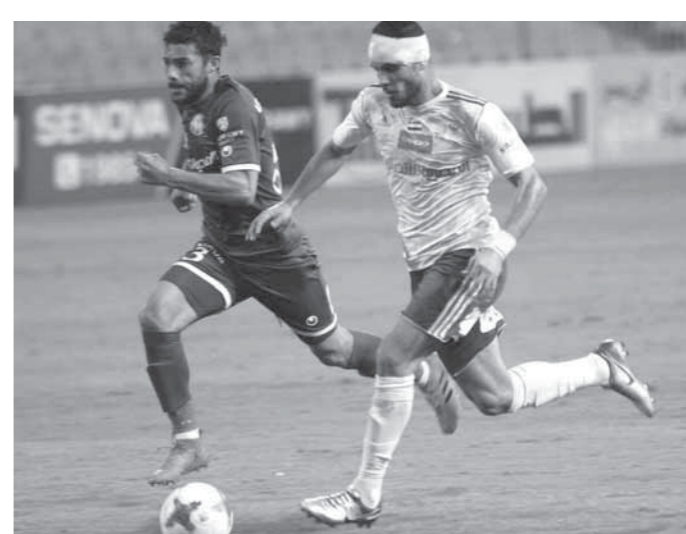
المصري نجح في تحويل تأخره لفوز أمام سموحة

من جانبه، أعرب حسام حسن، المدير الفني للفريق، عن سعادته البالغة بالفوز المتكرر الثالث للفريق والذي جاء نتيجة الشكر في العديد من المرات بعد المستوى المميز للبطولة بعد امتلاء مدرجات البطولة بالمشجعين للاستمتاع باللعبة ومؤازرة نجوم مصر، كما كشف أن حفل الختام سيشهد العديد من المفاجآت. وكانت مصر قد ضمنت مقعداً في المباراة النهائية، بعد وصول 3 لاعبين و3