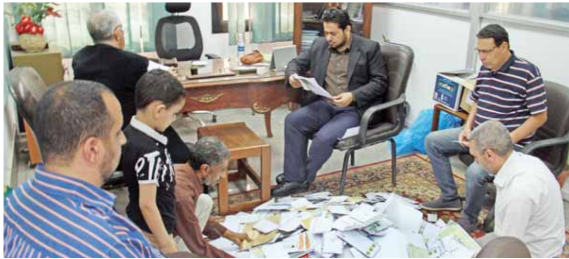
جانب من أعمال فرز مسابقة الوفد الرضائية