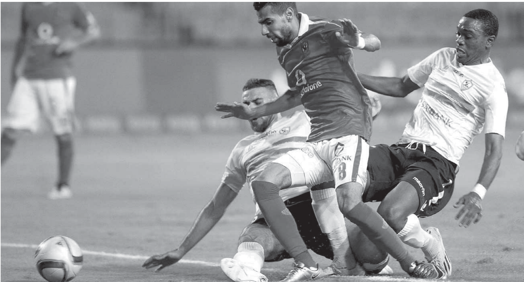
مؤمن يعود للأهلي بفرمان البدري