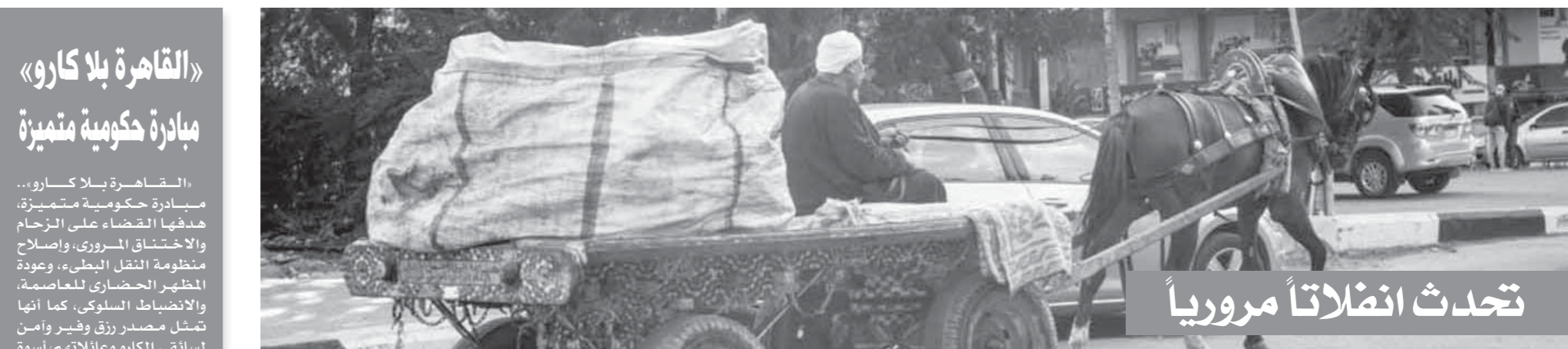
تحدث انفلاتاً مرورياً

أكد اللواء عبد السميع وهدان، مستشار وزير النقل، رئيس حي المقطم سابقاً في تصريح خاص له للوفد: «أن حملات الإشغالات ستظل مستمرة فيما يخص رفع السيارات القديمة للحد من مخاطرها الأمنية والبيئية، والعمل دوماً على ضبط السير وتيسيره لجميع المواطنين. وأضاف اللواء وهدان: «أن موظفي الأحياء يقومون بحملات يومية على الطرق والشوارع والأحياء المختلفة، لرفع السيارات المهملّة التي لا تحمل لوحات معدنية، بعدما تركها أصحابها لمدة طويلة في الشوارع، وهي بالتأكيد تمثل عبئاً في مباشرة عملهم، كما أنها تمثل استنزافاً لوقت في حالة إبلاغ الإدارات المرورية عن تواجدها في منطقة ما لكي يتم التعامل معها، لتخطورتها على الأمن العام وسلامة المجتمع.