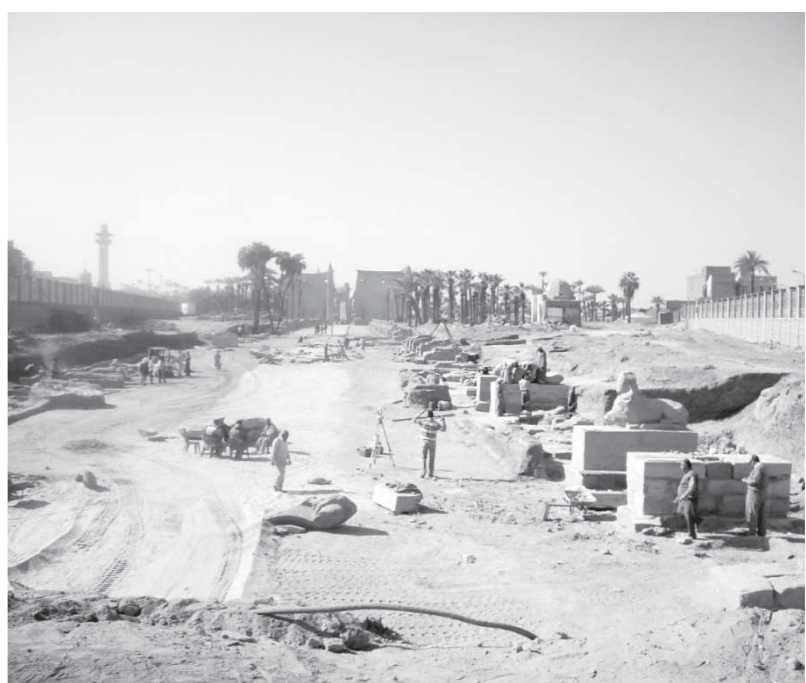
طريق الكباش الفرعوني