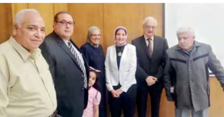
الشيءاء بعد حصولها على درجة الدكتوراه