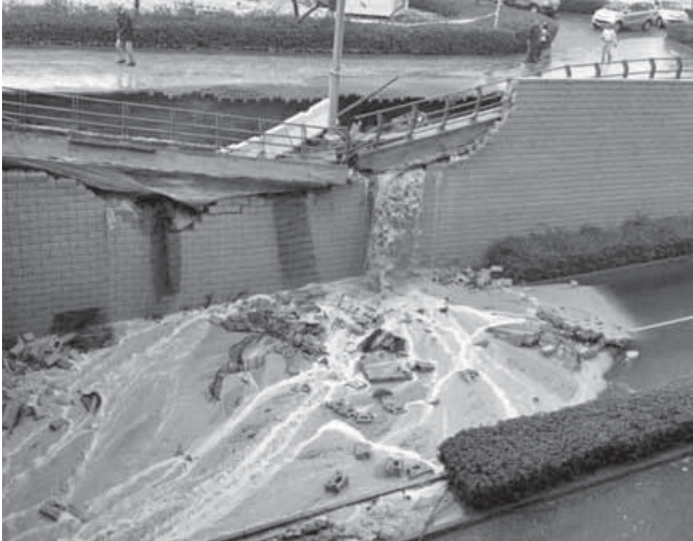
انهيار نفق، كايرو فيستيفال، بالتجمع الخامس