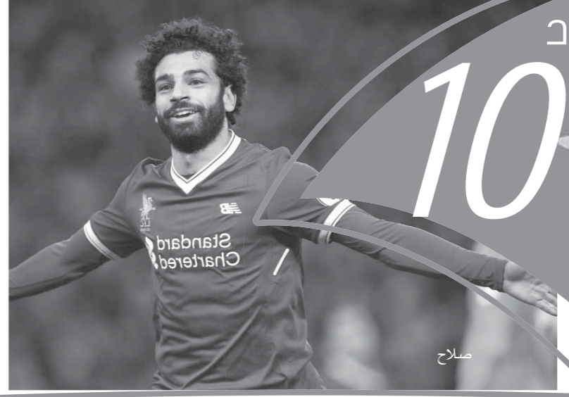
إشراف: أكرم عبد الفتى