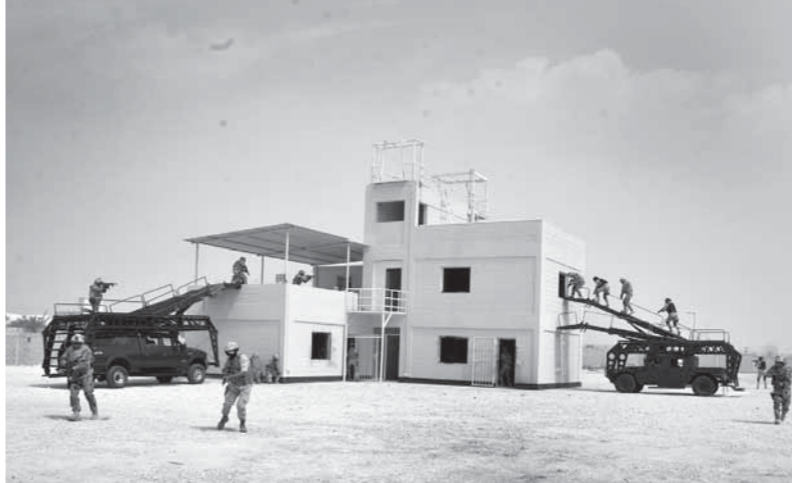
فعاليات التدريب المصري البحريني المشترك

المتكررة بقدرة وكفاءة عالية، وكانت المراحل الأولى قد تضمنت التدريب على المهارات التكتيكية واستخدام طبيعة الأرض وتحركات الفرد في الميدان، وكذا تنفيذ الرمايات الفردية والتكتيكية بالأسلحة الصغيرة نهاراً وليلاً للحفاظ على معدلات الكفاءة القتالية للعناصر المشاركة، كما نفذت عناصر المهندسين العسكريين التدريب على أعمال نسف وتدمير الموانع المختلفة، وتنفيذ طوابير تدريب تكتيكي للتدريب على عمليات قتال واقتحام وسائل المواصلات الجماعية والفردية وتحرير الرهائن المحتجزين بداخلها، كذلك تطهير المناطق المبنية التي سيطرت عليها جماعات إرهابية. كما شاركت عناصر من سلاح الجو الملكي البحريني في التدريب «خالد بن الوليد 2018»، حيث تم تنفيذ أعمال الإبرار الجوي واقتحام العمودي والإنزال المشترك للقوات الخاصة من الجانبين، لتنفيذ المهام على مساحات العمليات داخل المناطق المبنية باستخدام مروحيات هليكوبتر، وبعد التدريب المشترك خالد بن الوليد أحد التدريبات المشتركة التي تنفذها القوات المسلحة المصرية والقوة دفاع البحرين، ما يساهم في تعزيز أواصر التفوق العسكري ونقل وتبادل الخبرات والتعرف على العقائد القتالية المختلفة والقدرة على التعاون والتنسيق المشترك وتحقيق الأمن والاستقرار لكل البلدين الشقيقين.