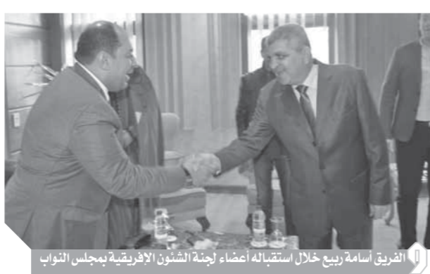
الفريق أسامة ربيع خلال استقباله أعضاء لجنة الشؤون الإفريقية بمجلس النواب

القياسية، اختصرت زمن عبور السفن إلى ١١ ساعة بدل ٢٢ ساعة بالقناة القديمة، مشيراً إلى تنفيذ المشروع بالكامل فى ٢٥٤ يوماً أى قبل المواعيد المحددة بـ ١ يوماً. وأكد رئيس هيئة قناة السويس، عدم تأثر حركة الملاحة وحجم السفن المارة بالقناة بسبب فيروس كورونا، متابعا: «نتمنى ألا يحدث تأثير، ولا سيما أن ٧٢٪ من تجارة الصين تمر بقناة السويس، لكننا حتى الآن لم نأثر ومحافظة على الأرقام». كما أكد حرص الرئيس عبدالفتاح السيسى على متابعة حركة الملاحة بالقناة، متابعا: «سألنى الرئيس عن حجم السفن المارة بالقناة والإيرادات ومدى تأثرها بالأوضاع الاقتصادية العالمية، فقلت إنها فى تزايد، فسألنى كيف ذلك، لأؤكد لسيادته أن السياسة التسويقية الجديدة التى تتبعها القناة عملت على زيادة معدل السفن المارة بالقناة بما ساهم فى تعويض خسارة نمو التجارة العالمية».