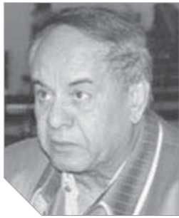
الدكتور نبيل لوقا بياوى يكتب:

أتمنى لَكُمْ يوماً هادئاً وأحلاماً سعيدة.