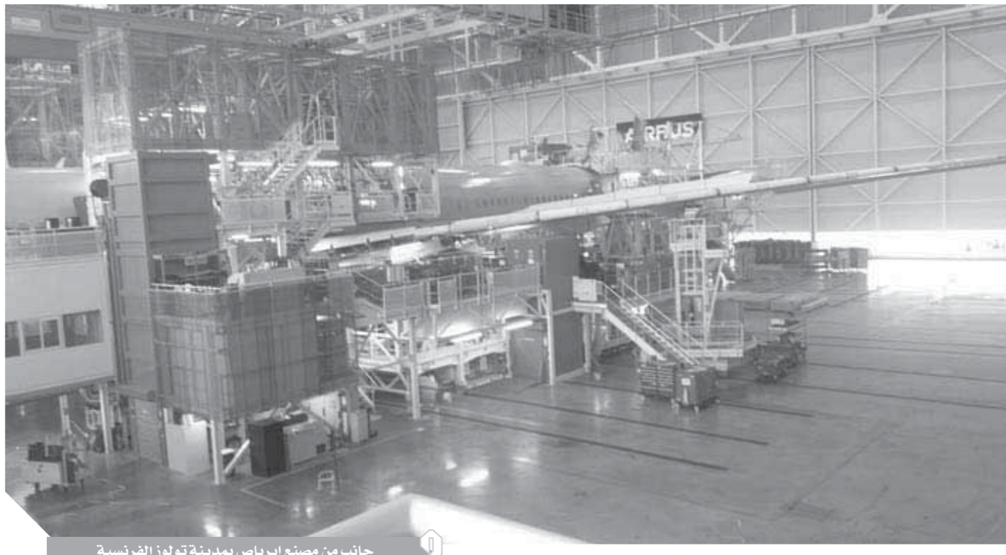
جانب من مصنع إيرباص بمدينة تولوز الفرنسية

قام وفد جريدة وموقع الورد، بزيارة مصنع إيرباص المصنعة للطائرات بمدينة تولوز الفرنسية.. واطلع على مراحل تصنيع الإيرباص A320neo والتي تصانصت مصر للطيران، واستلمت منها بالفضل ٢ طائرات، ويعود الورد الإعلامى المصرى بالطائرة الرابعة فجر اليوم الخميس.. وأكد المصنعون للطراز للوفد.. إن عائلة A320 تعد أكثر الطائرات انتشاراً على مستوى العالم من فئة الطائرات أحادية الممرين شركات الطائرات التي تتراوح من الناقلات الاقتصادية، التي تعتبرها خيارها المفضل، وصولاً إلى الطرازات الجديدة للطائرات من فئة الأعمال تضاهاى من حيث الأداء وراحة الركاب.