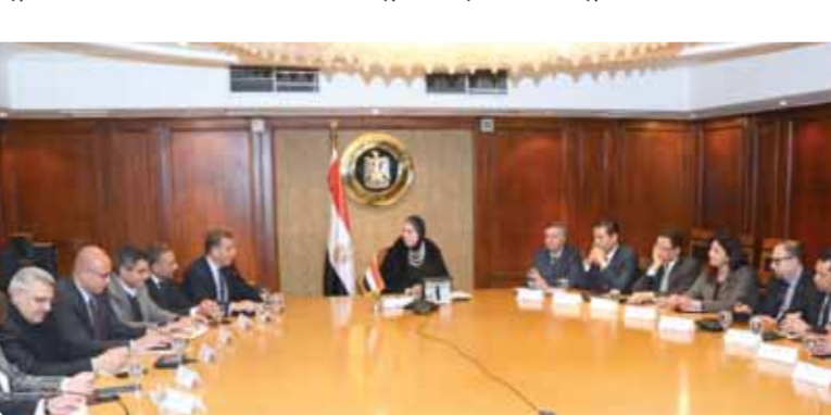
اجتماع نيفين جامع مع غرفة التجارة الأمريكية

وأشارت جامع إلى أهمية تعظيم الاستفادة من الإمكانيات والمقومات الصناعية المتوافرة لشركات