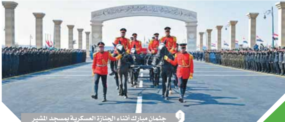
جثمان مبارك أثناء الجنازة العسكرية بمسجد المشير