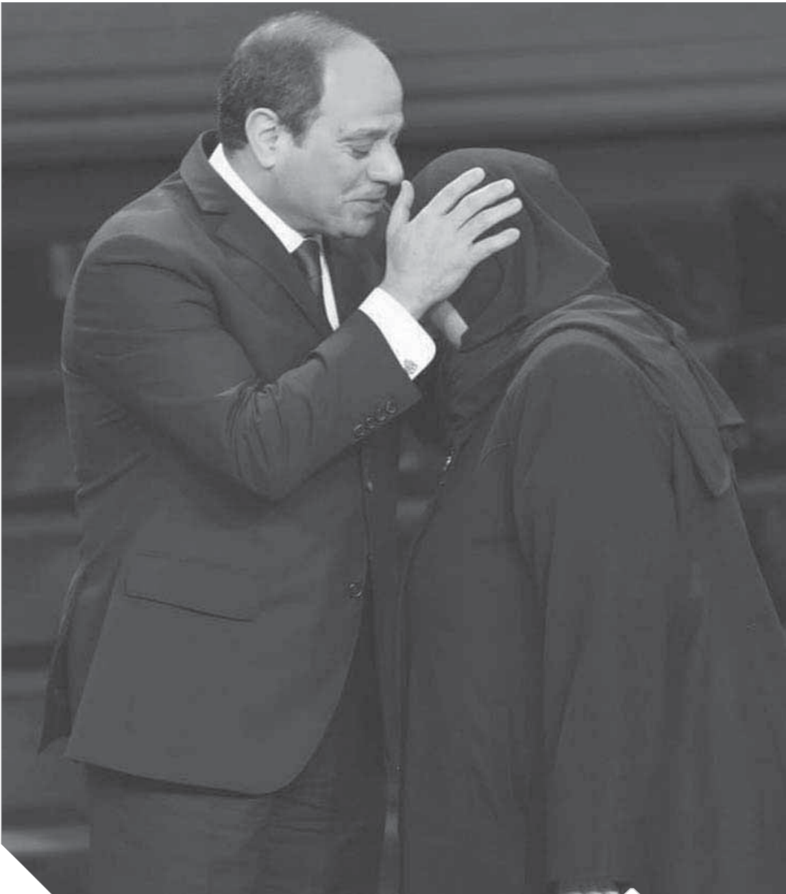
السيسى دائماً ما يقدم القدوة والمثل الأعلى فى تكريم أسر الشهداء والمصابين