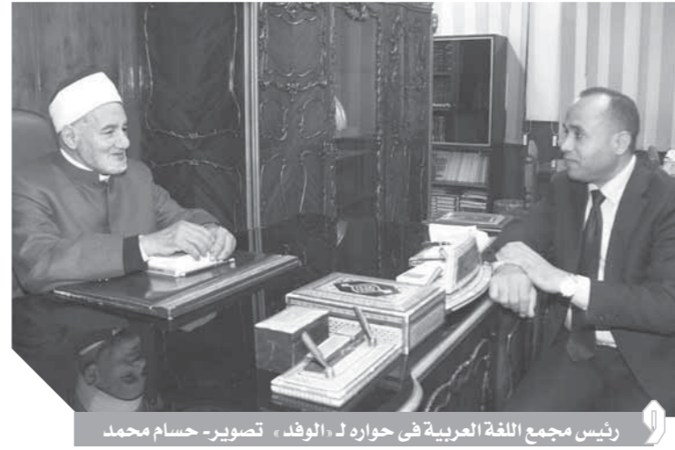
رئيس مجمع اللغة العربية في حوار لـ «الورد»

● السبب في ذلك أمران؛ أولاً الأعلام نفسه؛ فالإعلام المصري كان في وقت من الأوقات مشغولاً فقط بالسياسة والفنون وما يتصل بهما كان مصر انحزت في هذين المجالين؛ ولكن مصر فيها علماء وجود ثقافية وأنشطة اجتماعية وفيها مجتمع مدني؛ فما الوسيلة بين قراراتنا وجمعياتنا ابتلى وتكاد تكون المدرسة مستقلت من وظيفتها؛ والوزير الجديد يعمل جاهداً على إعادة أبنائنا إلى المدارس أعانه الله.