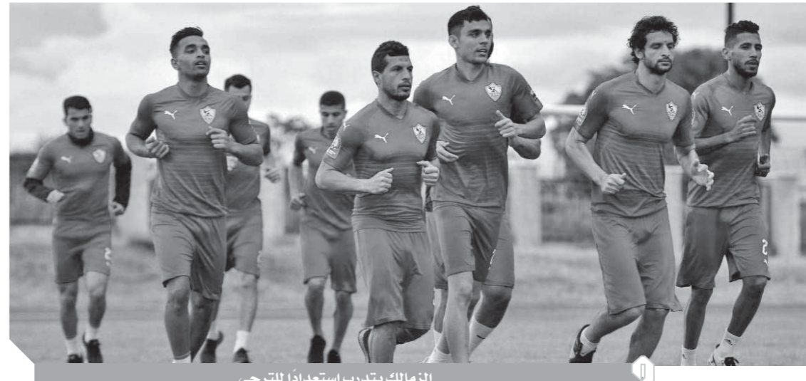
الزمالك يتدرب استعداداً للترجي

والوسط، مع التنبيه على لاعبي خط الهجوم بضرورة استغلال الفرص وتحقيق مكسب مريح قبل مواجهة العودة. وأصدر المستشار مرتضى منصور، رئيس النادي، تعليماته بصرف مكافآت الفوز في مباراتى السوبر الإفريقي والمصري للاعبين بعد الجلسة التي عقدها معهم أمس الأول بحضور الجهاز الفني وأمير مرتضى المشرف على الكرة. أما فريق الترجي التونسي فيؤدي مرانه الأخير في السادسة مساء اليوم باستاذ القاهرة بحسب لاتحة الاتحاد الإفريقي بعد أن وصلت البعثة في الساعة مساء أمس، وأقامت بأحد فنادق مصر الجديدة، واكثف معين الشعياني المدير الفني بإجراء مران خفيف لفك العضلات بالفندق.