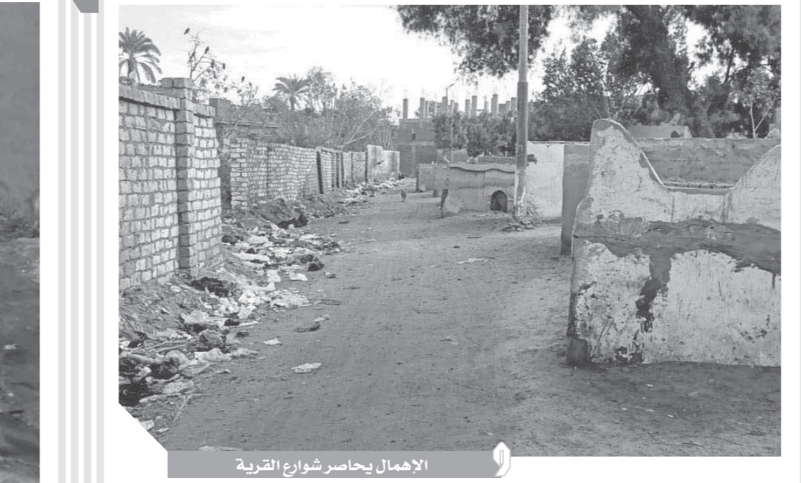
الإهمال يحاصر شوارع القرية