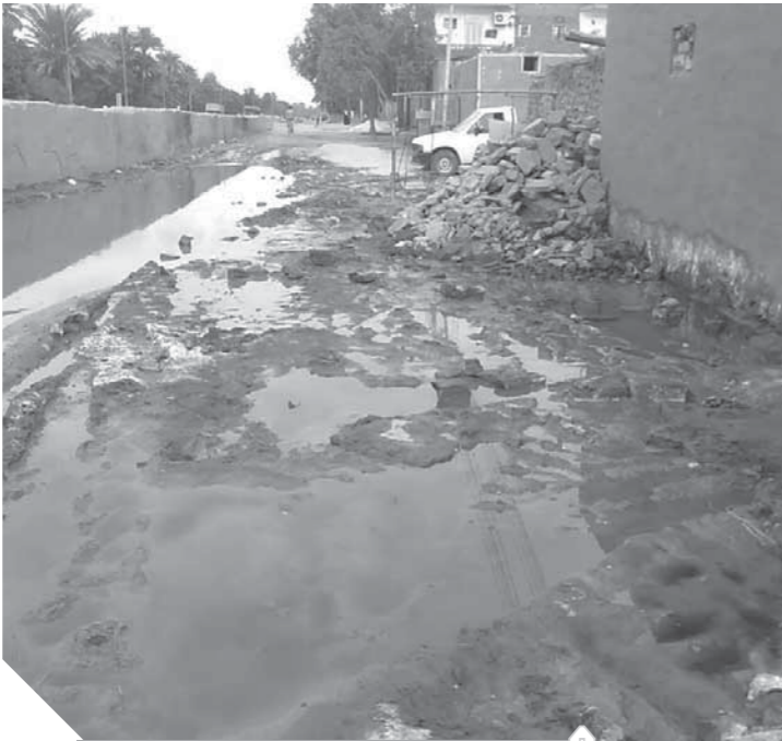
المياه الجوفية تحاصر المنازل