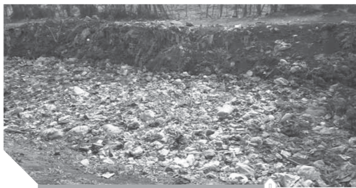
القمامة تحاصر القرية