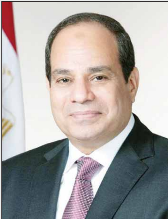
الرئيس عبد الفتاح السيسى