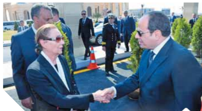
الرئيس السيسى يقدم واجب العزاء للسيدة سوزان مبارك

الأمين العام لجامعة الدول العربية بباع الحزن والأسى وفاة الرئيس الأسبق «مبارك»، مؤكداً تفانيه وإخلاصه للعروة، ولل قضية الفلسطينية. كما نعى مجلس القضاء الأعلى ونادى القضاء الرئيس الأسبق «مبارك»، مشيرين إلى تاريخه العسكرى الطويل والمشرف، وأنه ابن من أبناء القوات المسلحة.