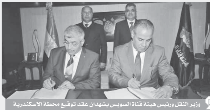
وزير النقل ورئيس هيئة قناة السويس يشهدان عقد توقيع محطة الإسكندرية

الإقليمية والإفريقية. وأشار وزير النقل إلى أن المشروع يعد أبرز المشروعات التى تنفذها الوزارة فى مجال النقل البحرى، إذ يساهم فى رفع تصنيف ميناء الإسكندرية، كما يساهم فى استقبال السفن ذات الحمولات الكبيرة بميناء الإسكندرية، كما يساهم المشروع فى تفعيل المنطقة اللوجستية خلف الميناء، والتي تصل مساحتها إلى مليونى متر ولا تبعد عن الميناء لأكثر من ٢٠ كم مما يسهل نقل البضائع إليها من خلال وسائل النقل المختلفة، وأكد الفريق أسمية ربيع رئيس هيئة قناة السويس حرص الهيئة على توثيق التعاون مع كافة قطاعات وزارة النقل، وأشد بالجهود المبذولة للارتقاء بقطاع النقل البحرى، وكشف عن نجاح الهيئة فى إزالة كافة العوائق وانتشال كافة الوحدات البحرية الغارقة فى منطقة الأرصفة المقرر إنقاذها بميناء الإسكندرية من خلال فريق الإنقاذ البحرى والروافع التابعة للهيئة.