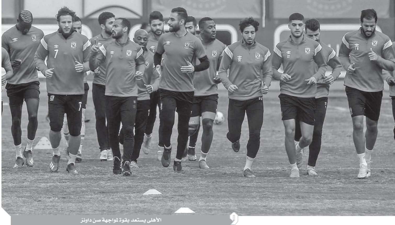
الأهلي يستعد بقوة لمواجهة صن داونز

اللقاء مواجهة ثارية، خاصة أن الأهلي هدفه الأساسي التأهل وليس الثأر مثلما يردد البعض. على صعيد آخر، يخوض فريق صن داونز مرانه الرئيسي مساء اليوم شرابط لشرة مباريات خاضها الفريق الأحمر والتي كشفت كل أوراق الأهلي قبل مواجهة الفريقين قاتلاً إن حضور ٣٠ ألف مشجع للأهلي لن يؤثر على فريق صن داونز، وقد يكون عاملاً سلبياً ويمثل ضغطاً على الفريق صاحب الزمالك والترجي التونسي التي تقام غداً