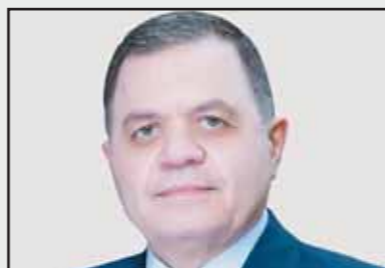
اللواء محمود توفيق