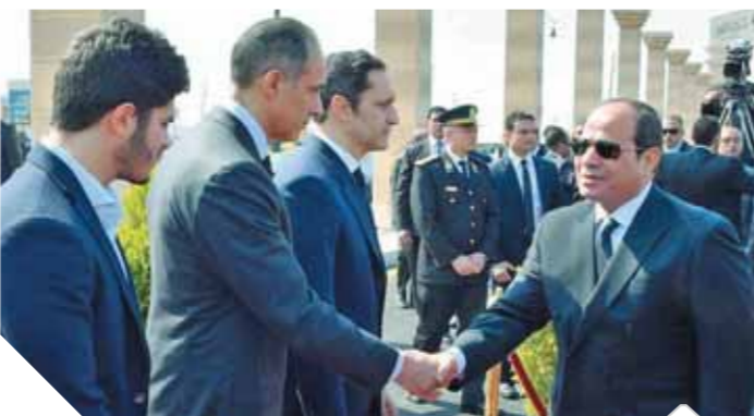
الرئيس يقدم واجب العزاء لعلاء وجمال مبارك