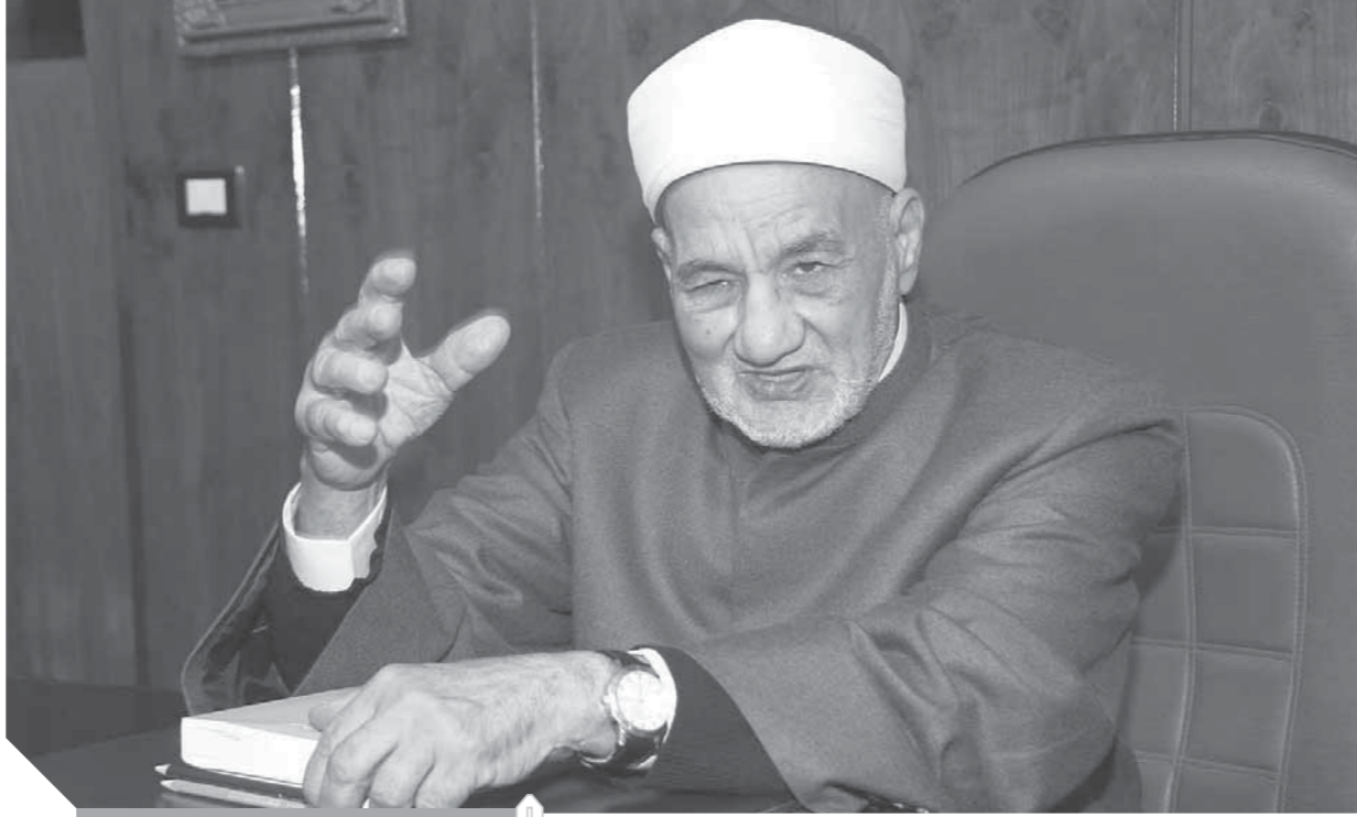
الدكتور حسن الشافعي

ولد الدكتور حسن الشافعي رئيس مجمع اللغة العربية ورئيس مجلس اتحاد الجامعات اللغوية العلمية في عام ١٩٢٠ في قرية بيتي ماضي بمحافظة بني سويف؛ وحفظ القرآن الكريم؛ وفي منتصف الأربعينيات ألتحق والده بالمعهد الديني في القاهرة؛ وقرأ «الفتاوى» لابن مالك على يد الشيخ أشهب القاضي لمدة خمس سنوات بعدة شروح؛ التحق بكلية أصول الدين ويعد عام واحد التحق بكلية دار العلوم فدرس في الكليات في آن واحد؛ وعند تخرجه عين معيدا في أصول الدين؛ ثم اختار دار العلوم وأعد رسالة الماجستير عن «الأمدي» وكانت أول دراسة عن الأمدي «التكلم»؛ ثم أُنجز أطروحة الدكتوراة على يد الدكتور محمود قاسم عميد دار العلوم آنذاك؛ وأُبيحت له الفرصة للسير إلى لندن في بعثة علمية؛ فحصل على الدكتوراة هناك؛ ثم تولى رئاسة قسم الفلسفة بدار العلوم ثم وكيلا لها؛ وسافر إلى باكستان وأسس الجامعة الإسلامية في إسلام آباد؛ وعمل رئيسا لها لمدة ست سنوات؛ واختير عضوا بمجمع اللغة العربية في ظل رئاسة الدكتور شوقي ضيف.