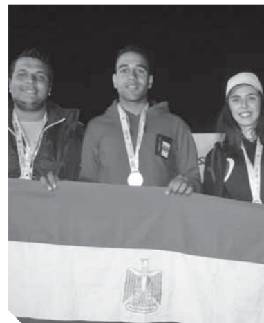
تكريم منتخب الرماية