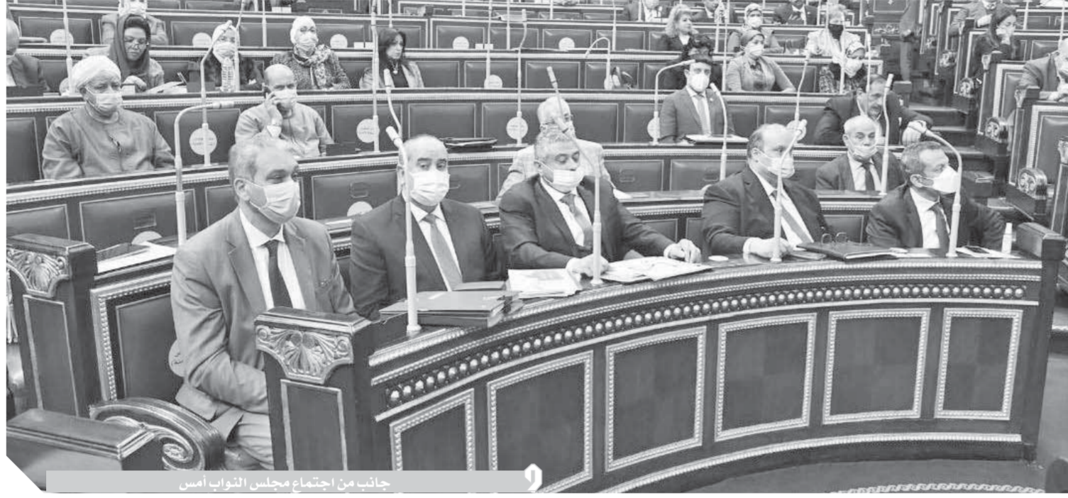
جانب من اجتماع مجلس النواب أمس