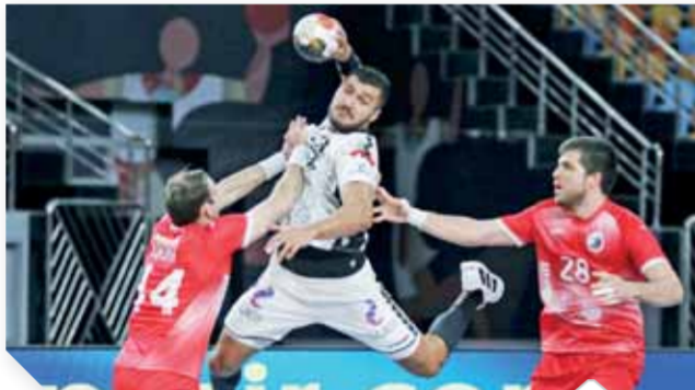
الليلة.. منتخب اليد يعيد أمجاد ٢٠٠١ أمام الدنمارك

منتخب اليد يحلم بتكرار إنجاز ٢٠٠١ أمام الدنمارك الليلة