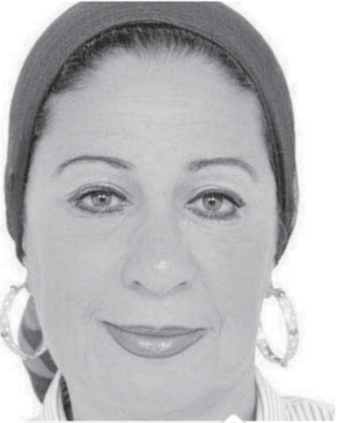
ليلي أبو اسماعيل

أكدت النائبة الوفدية الدكتورة ليلي أبو اسماعيل أن عمال شركة سمونود للنسيج والوبريات ما زالوا يعانون من عدم حصولهم على رواتبهم وعلاواتهم مما تسبب في عدم استقرارهم الأسري بسبب تعثر الشركة بهدف تسريحهم وتصفيته الشركة، ورغم كل ذلك نجد أن إجمالي ما يتقاضونه من مرتبات يتراوح ما بين ١٣٠٠ إلى ١٧٠٠ جنيه، وطالبت «أبو اسماعيل» وزير القوى