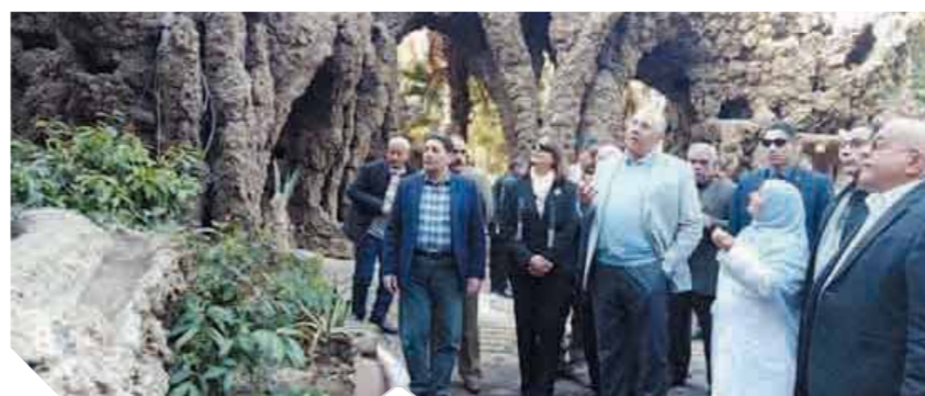
اهتمام بالغ بحديقة الحيوان

ومن المقرر أن يفتتح الوزير حديقة حيوانات الطفل خلال أسبوعين والتي ستكون أحد أهم مزارات حديقة الحيوان خلال الفترة المقبلة وتقع على مساحة ألفي متر مربع وستكون مخصصة للأطفال من زوار الحديقة. وتضم حديقة حيوانات الطفل، عدداً من الحيوانات والطيور النادرة المحيية لدى الأطفال ومنها عائلة الطيور مثل الطواروس وبعض حيوانات الثدييات الصغيرة مثل الأيل الأوروسى والأسماك الملونة وسلاحف وبيتا للزواحف، كما تضم قاعة سينمائية للأطفال مزودة بتقنيات الواقع الافتراضى. ومن جانبه قال اللواء الدكتور محمد رجاتى رئيس الإدارة المركزية لحداثك الحيوان والحياة البرية، إن أعمال التطوير داخل الحديقة حوتها كأحد المقاصد السياحية الداخلية ومتوسط يبلغ ٥٠ ألف زائر رغم برودة الطقس، متوقفاً زيادة الأعداد خلال عطلة