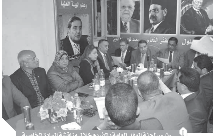
رئيس لجنة الوفاء العامة بالفيوم خلال مناقشة المادة الخامسة

لم تتمكن من الحضور، كما تم الاتفاق على أن يعقد الاجتماع كل شهر وبشكل دورى. كما زار أعضاء اللجنة العامة للوفد بالفيوم مديرية أمن الفيوم لتقديم التهنئة لرجال الشرطة بمناسبة العيد الثامن والستين، وخلال الزيارة قدم الكاتب الصحفي عبدالمعطي الباسل، درع التهنئة إلى اللواء عادل الطحلاوي مساعد وزير الداخلية ومدير أمن الفيوم وذلك بحضور عدد من القيادات الأمنية والذين عبروا عن تقديرهم لحزب الوفاء بيت الوطنية المصرية والذي أصدر القرار التاريخي بالمقاومة للاحتلال فى ١٩٥٢ مما خلد هذا اليوم ليكون احتفالاً بعيد الشرطة المصرية.