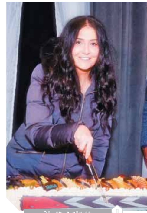
غادة تقمع التوتيرة