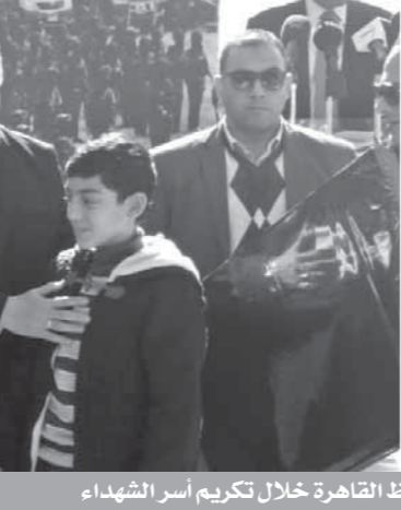
محافظ القاهرة خلال تكريم أسر الشهداء