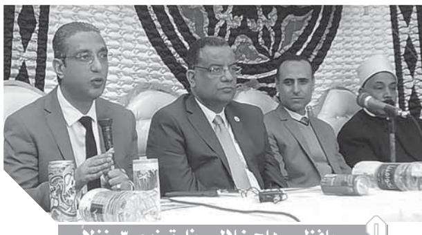
محافظ سوهاج خلال حفل توزيع ٣٠ منزلاً

سيكون هناك دور فعال للجمعية لتفعيل مبادرة محافظ سوهاج فى معو أمية أهالى القرية، موضحاً أن الأمية فى القرية تبلغ 6% وسيتم القضاء عليها خلال العام القادم لتكون القرية نموذجية. وقال مدير فرع مؤسسة «مصر الخير» بسوهاج أن برنامج التنمية المكاملة لقرية الشيخ زين الدين، والسدى تدعمه وزارة الاستشمار والتعاون الدولى برئاسة الوزيرة د. سحر نصر وتنفيد مؤسسة «مصر الخير» بالتعاون مع وزارة التنمية المحلية يشمل عدة أنشطة منها بناء مدرسة لتعليم أساسى وتم تسلم الأرض الخاصة بها وجار أعمال البناء خطوط المياه بمسافة 3 كم لعدد 336 مستفيداً، وبناء عدد 36 منزلاً، مشيراً أن ما تم تنفيذه حتى الآن يتضمن بناء 30 منزلاً، وجار استكمال أعمال البناء لعدد آخر من المنازل، وتم تغيير خطوط المياه بمسافة 3 كم.