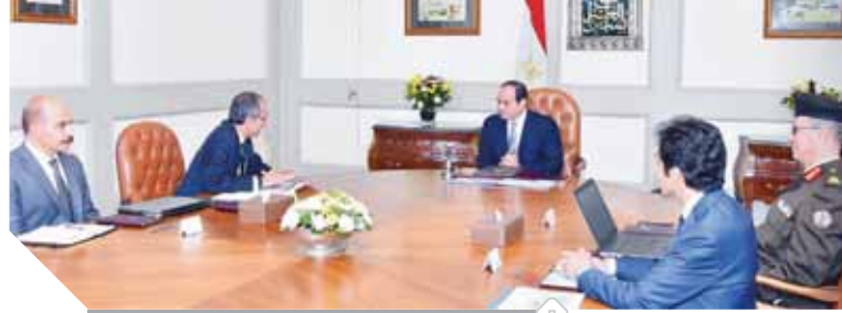
السياسي خلال اجتماعه مع وزير الاتصالات

والالتزام بالجدول الزمني المقرر لإنشاء البنية الرقمية والمعلوماتية بالعاصمة الإدارية الجديدة، بحيث تصبح بوابة لدخول مصر لعصر المدن الذكية. وأشار السفير بسام راضي المتحدث باسم رئاسة الجمهورية إلى أن الرئيس، وجه بتكثيف الجهود فيما يتعلق بميكنة أعمال الحكومة، وخاصة من خلال تطوير نظم إدارة المؤسسات الحكومية سواء على مستوى الموارد البشرية أو الموارد المالية واللوجستية، مشيراً في هذا الإطار إلى أن الدولة تولي قطاع الاتصالات وتكنولوجيا المعلومات أهمية كبيرة.