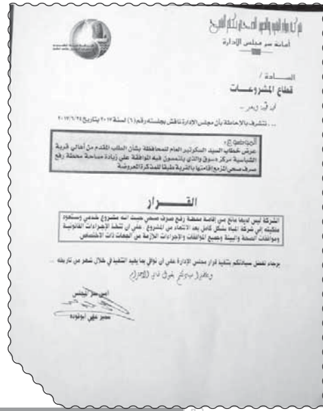
الوحدة المحلية تتجاهل موافقة شركة مياه الشرب على إقامة محطة رفع للصرف الصحي

الوحد بمركز دسوق، قد بذل مجهودا كبيرا مع مسئولى شركة مياه الشرب والصرف الصحي بمحافظة منذ عام 2012 حتى حصل على تخصيص قطعة أرض لإقامة محطة رفع الصرف الصحي بالقرية، وبعد كل الجهود التي قام بها، إلا إنه بمتابعة الإجراءات مع الجهات المعنية فوجئ بالصدفة، بعدم الوحدة المحلية بشبابية تجاهل قرارات تخصيص لإقامة المحطة وضياح حقوق آلاف المواطنين من عيشة أدمية كريمة خالية من الأمراض والأوبئة. وطلاب الزغلي، بحاسبة كل من تعمد فى إغفاء الاستندات الدالة على تخصيص الأرض لإقامة محطة الرفع بقصد سوء أو إهمال.