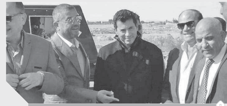
وزير الرياضة أثناء تفقده ملاعب الفيوم

مبارك الجنوبي سفير دولة الإمارات بالقاهرة، وفضيلة الشيخ الدكتور على جمعة رئيس مجلس أمناء مؤسسة مصر الخير، والفريق ركن محمد هلال الكعبى رئيس اللجنة العليا لماراثون زايد الخيري، والمهندس حسام القباني رئيس مجلس إدارة جمعية الأورمان. وتطلق فعاليات المؤتمر الصحفي للإعلان عن النسخة الخامسة لماراثون زايد الخيري، احتفالاً بمئوية الشيخ قارون مساءً.