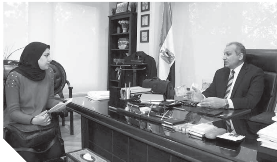
«الوفد»، حوار مدير صندوق تطوير العشوائيات

– الرئيس السيسي على دراية كاملة ودقيقة وصاحب متابعة جيدة لمشكلات الدولة، ففي بعض الأحيان عندما يقدم الدكتور مصطفى مدبولي المشروعات للرئيس يجد الرئيس على دراية بها، فهو يتابع المشروعات بصفة يومية من خلال الزيارات الميدانية المفاجئة.