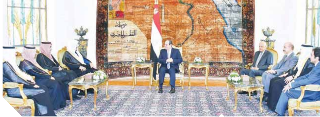
الرئيس خلال استقباله رئيس مجلس الشورى السعودي والوفد البرلماني المرافق

أشاد الرئيس عبدالفتاح السيسي بمواقف المملكة العربية السعودية الشقيقة قيادة وشعباً تجاه مصر على جميع الأصعدة. وقال الرئيس إن هذه المواقف تعكس الروابط التاريخية والمودة المتأصلة والتحالف الاستراتيجي الوطيد بين الدولتين، وكان الرئيس السيسي قد استقبل أمس الدكتور عبدالله بن محمد آل شيخ رئيس مجلس الشورى السعودي والوفد البرلماني المرافق له، وحضر اللقاء الدكتور عبدالعال رئيس مجلس النواب والقائم بأعمال سفارة المملكة العربية السعودية بالقاهرة، وصرح السفير بسام راضي المتحدث الرسمي باسم رئاسة الجمهورية، بأن الرئيس رجب ربه رئيس مجلس الشورى السعودي، وطلب نقل تحياته إلى جلالة الملك سلمان بن عبدالعزيز، وولي عهده الأمير محمد بن سلمان، وأشار إلى أهمية الارتقاء بقنوات التواصل الشعبية بين الجانبين على المستوى البرلماني، وذكر المتحدث الرسمي أن الدكتور عبدالله بن محمد آل شيخ نقل إلى الرئيس تحيات العاهل السعودي وولى عهده، مؤكداً اعتراف الحكومة والشعب السعودي بما يجمع البلدين من أواصر تاريخية ثابتة وعلاقات وثيقة، كما أكد حرص السعودية على تعزيز التعاون مع مصر على جميع المستويات، والتنسيق معها بشكل دوري إزاء مختلف القضايا ذات الاهتمام المشترك.