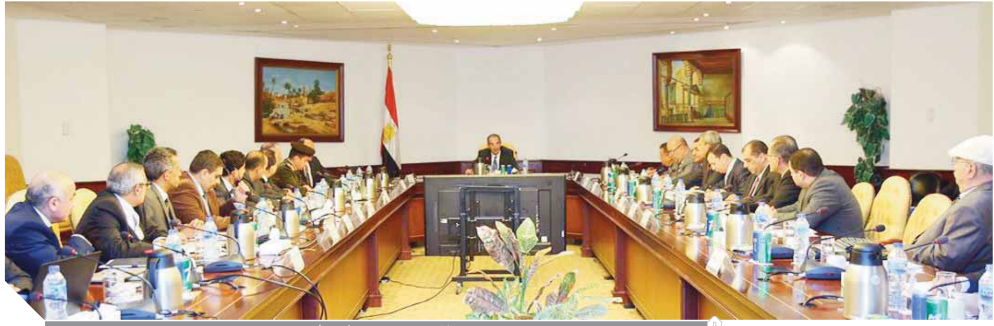
طلعت، أثناء اجتماعه بالمجلس الأعلى للأمن السيبراني

اجتمع المجلس الأعلى للأمن السيبراني برئاسة الدكتور عمرو طلعت وزير الاتصالات وتكنولوجيا المعلومات؛ حيث تناول الاجتماع استعراض برامج عمل الاستراتيجية الوطنية للأمن السيبراني، وأهم التدابير اللازمة لمواجهة الأخطار السيبرانية. وخلال الاجتماع أكد الدكتور عمرو طلعت أن مصر تتقدم بخطى ثابتة في مجال تنمية وتطوير قطاع الاتصالات وتكنولوجيا المعلومات باعتباره أحد القطاعات الهامة للاقتصاد القومي، مشيراً إلى حرص الدولة على تأمين البنية التحتية للاتصالات وتكنولوجيا المعلومات ورفع مستوى الاستعداد لمواجهة الأخطار السيبرانية بما يسهم في تعزيز دور صناعة تكنولوجيا الاتصالات والمعلومات في تنمية القدرة التنافسية لمصر وخلق فرص عمل وجذب الاستثمارات. وأشار الوزير إلى الدور المهم للمجلس الأعلى للأمن السيبراني في دعم التحول