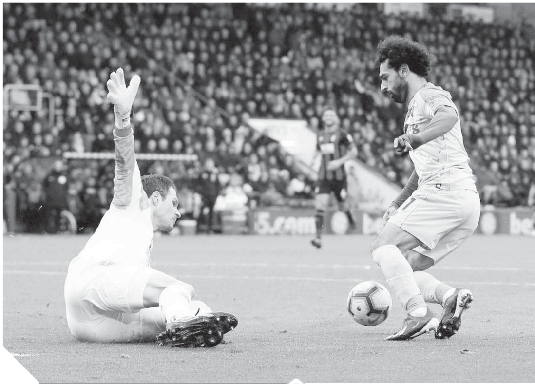
محمد صلاح يبحث عن صدارة الهدافين