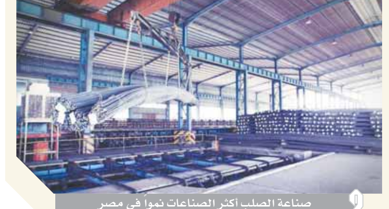
صناعة الصلب أكثر الصناعات نمواً في مصر

للمصانع المصرية المنتجة للصلب تصل إلى 13 مليون طن، بينما تبلغ معدلات الإنتاج الفعلية حالياً نحو 8 ملايين طن سنوياً. مشيرة إلى أن هناك منافسة كبيرة بين المنتجين المصريين والمنتجين في المنطقة وبقاى الدول نتيجة ارتفاع أسعار الطاقة في مصر، حيث يصل سعر الغاز المقدم للمصانع إلى 7 دولارات لكل مليون وحدة حرارية، لافتة في الوقت ذاته إلى أن عنصر الطاقة وحده يمثل 15% من تكاليف التشغيل والإنتاج. وأضافت نورهان العشري أن مساهمة مجموعة العشري في المشروعات الوطنية ومنها مشروع الصوب الزراعية بمدينة العاشر من رمضان، بالإضافة إلى الرئيس عبدالفتاح السيسي بضرورة إشراك الشركات الوطنية بمختلف قطاعاتها الإنتاجية في المشروعات القومية باعتبارها شريكاً رئيسياً في التنمية الاقتصادية الشاملة. يذكر أن مجموعة العشري لإنتاج الصلب وحديد التسليح تقذف ومجموعة primetals، بريمتالز والتي تتواجد في نحو 40 دولة حول العالم مصنعا ضخما لإنتاج الصاج المجلفن والصاج المحسوب على البارد بطاقة إنتاجية تتراوح بين 350 و500 ألف طن سنوياً، واستثمارات تقدر بنحو 100 مليون دولار لتصل الطاقة الإنتاجية من القطاعات الخفيفة المتنوعة مثل الزوايا والماسير وغيرها بالمجموعة إلى 400 ألف طن سنوياً.