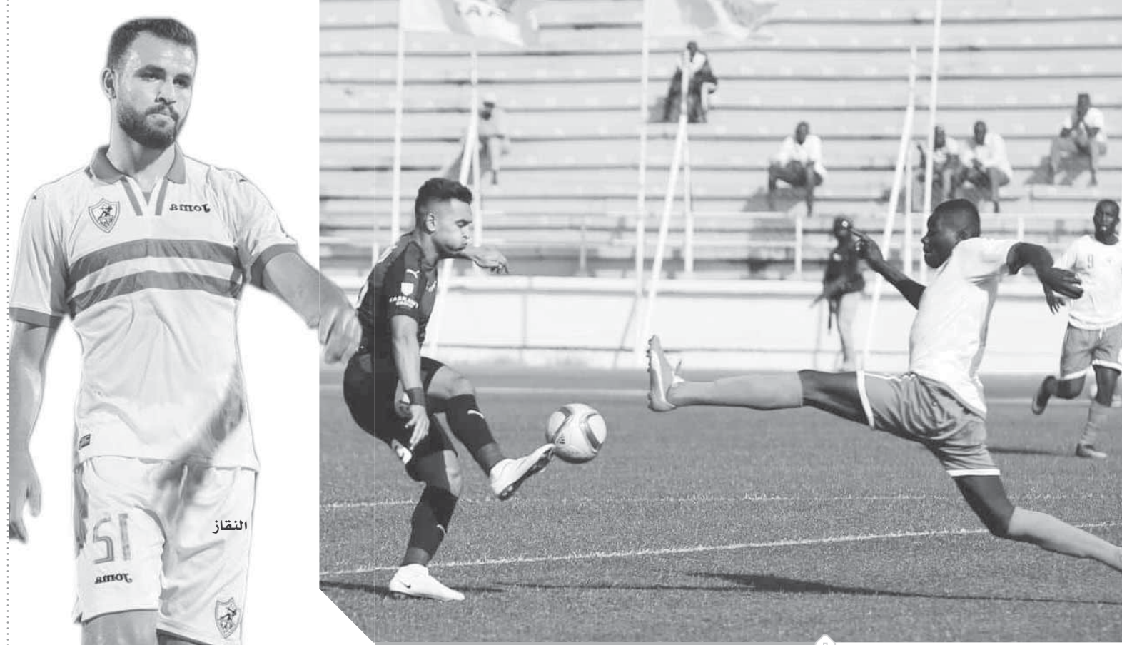
خشونة لاعبي القطن التشادي تسببت في إصابات لاعبي الزمالك