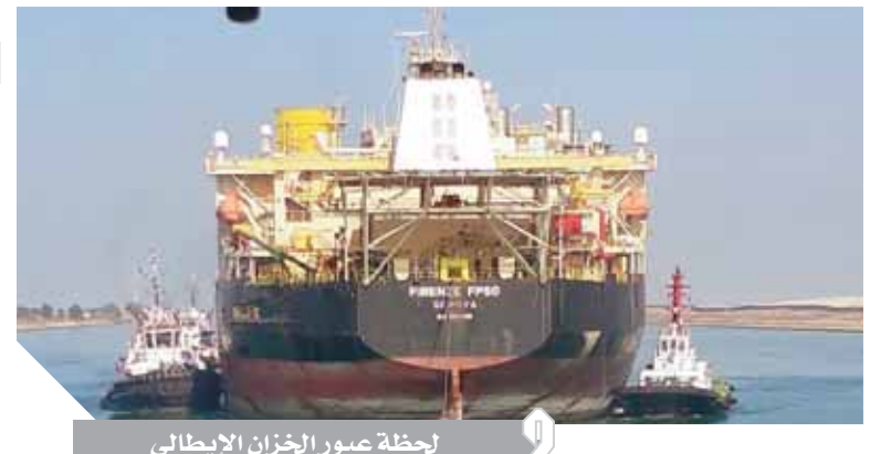
لحظة عبور الخزان الإيطالى

عبر قناة السويس أمس الثلاثاء الخزان النفطى العائم Firenze Ppsو رافعا علم إيطاليا بجمولة 60 ألف طن وسط إجراءات استثنائية وصفتها إدارة قناة السويس بأنها أصعب عمليات العبور تمر بالقناة مسدداً رسوم عبور بلغت 2,5 مليون دولار. وقال الفريق مهذب ميميش رئيس هيئة قناة السويس إن عبور الخزان تم بمراقبة 5 من أكبر قاطرات قناة السويس وسط ترتيبات الغرفة، إلى ضريح يزوره الأهالى للتبارك الخزان العائم مر بالقناة بسلام محققا كل