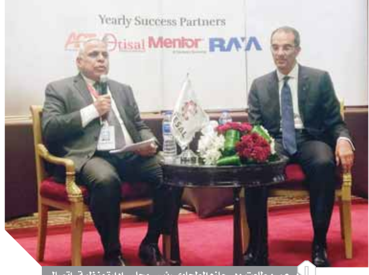
د. عمرو طلعت ود. حازم الطحاوي رئيس مجلس إدارة منظمة «اتصال»

دعا الدكتور عمرو طلعت، وزير الاتصالات وتكنولوجيا المعلومات إلى ضرورة العمل على تنمية مهارات الشباب والكوادر البشرية المصرية في كافة تخصصات قطاع الاتصالات وتكنولوجيا المعلومات، مؤكداً في لقائه مع أعضاء منظمة اتصال Government The Meet أن الدولة المصرية قبل إجراءات الإصلاح الاقتصادي والتويع كانت تأتي في المركز الثالث بعد الهند والفلين في توفير الكوادر المدربة والمتخصصة، إلا أنه بعد التويع كان لا بد من أن يلقى ثمار هذا الإصلاح، حيث أصبحت مصر تأتي في مقدمة هذه الدول، لأنها أصبحت الآن قادرة، ورغم ذلك هناك ندرة في توافر الكوادر البشرية بسبب هجرة العقول البشرية إلى الخارج والتي تعد بمثابة القوة الناعمة لمصر.