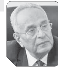
بهاء الدين أبو شققة