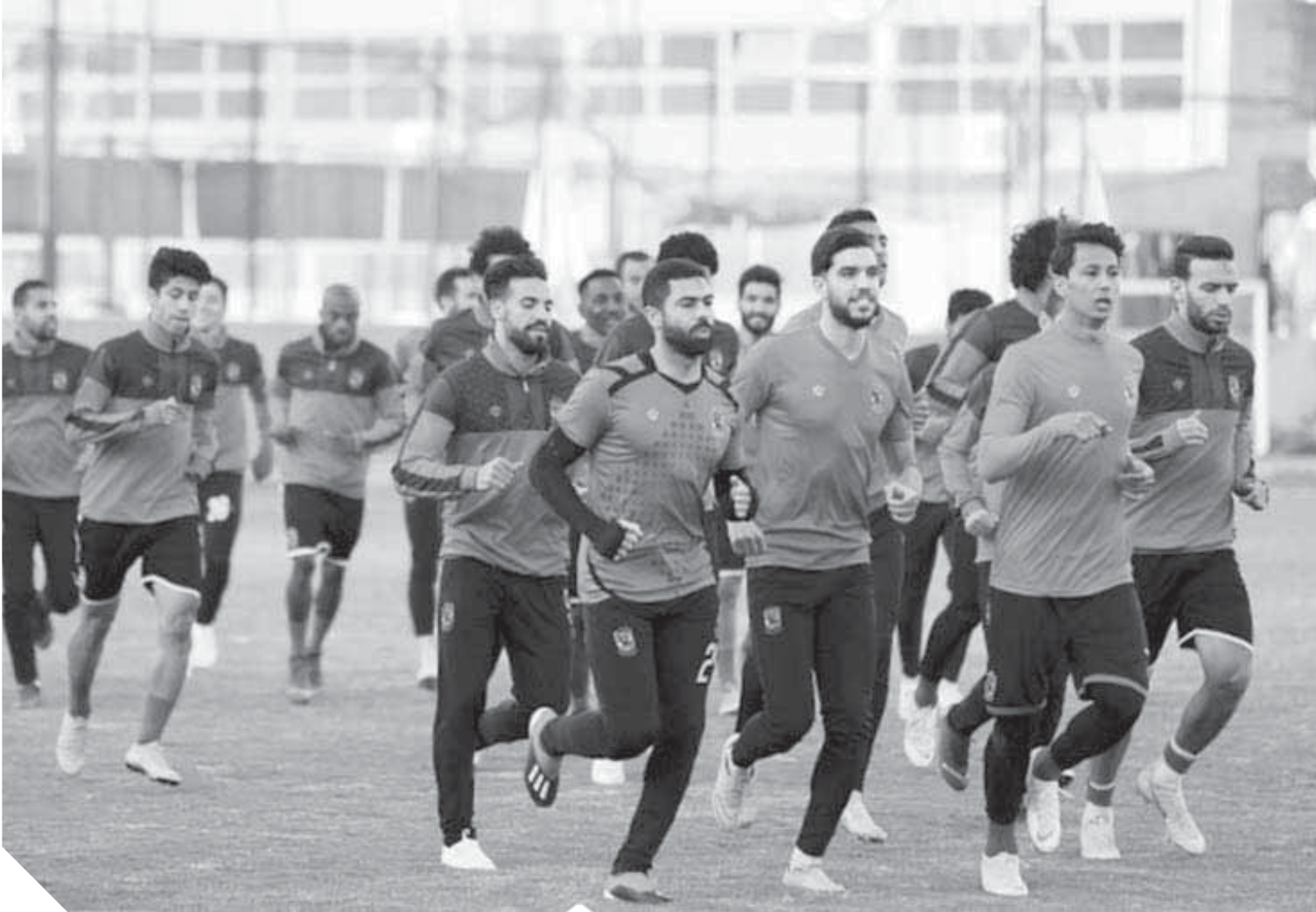
الأهلى يستعد لمواجهة الداخلية