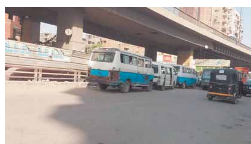
رسم اشتراك التوك توك ألف جنيه شهرياً

وداخل موقف شارع بورسعيد العشوائي يقول سائق ميكروباص «٢٥ عاماً» من سكان المرق، إنه ينتظر المواطنين الباحثين عن ميكروباص لتقضاء مشاوير خاصة لفترات أو حالات الوفاة والعزاءات، مؤكداً أنه لا ينتظر دورا للتحميل أثناء تواجده فى الموقف حيث لا يجبر سائق على الاعتراض عليه أو منعه من تحميل الركاب فى أى وقت. وقال: «سبق أن اعترض سائق على تحميلي الركاب دون انتظار لدوري فكان ردى إصابته بجرح قطعى خط الخصوص والمرج والزاوية الحمراء دون تدخل مالك الميكروباص أو توفير