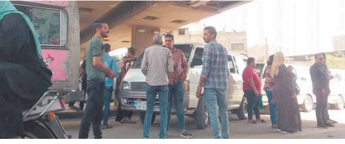
عذاب يومي بين الركاب والسائقين