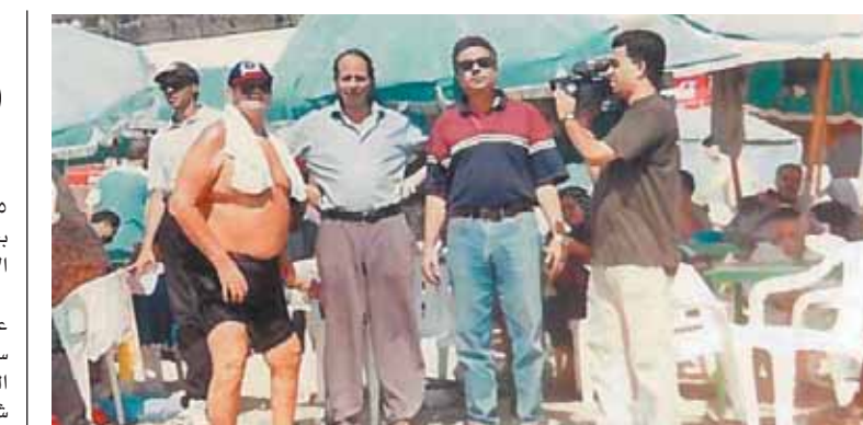
لقطة من فيلم «تمساح النيل»

أيضاً يشارك فيلم «لا أنسى البحر» للمخرجة هالة القوصي، وهو إنتاج مشترك مع هولندا، وتدور أحداث «الحفرة» في مدينة شريف ثروت، وتدور أحداث الفيلم في مدينة شريف ثروت، وتدور أحداث الفيلم في مدينة شريف ثروت، وتدور أحداث الفيلم في مدينة شريف ثروت.