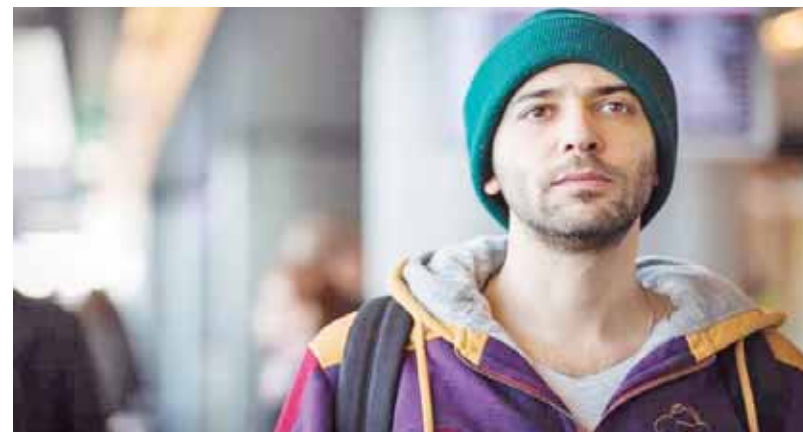
مشهد من فيلم «الحفرة»

أحداث «Memento Mare»، الذي يعرض عالمياً لأول مرة، في منتج صحي مهجور حول شاب يقابل سيدة الحكايات «أم» محمولين على كلماتها يجر الأثان في رحلة إلى البحر المجهول، فهو تأمل شعري في ماهية الخوف وقوة الخيال.