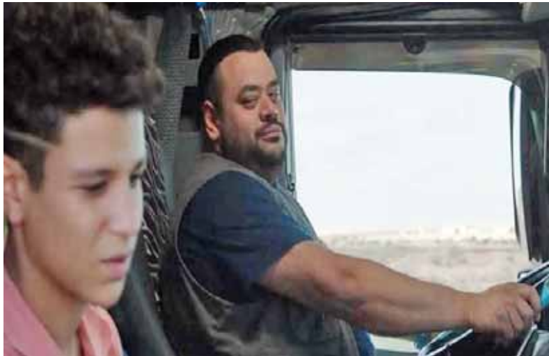
مشهد من فيلم «أبوصدام»

داش، فهما يقومان بدور البطولة، لافتة إلى أنهما كانا يخيراها الأول للعمل منذ البداية، وهذا ما أسفر عن نتاج رائع أمام الكاميرا، أكثر مما كانت تتوقع. وعين اختيار الأبطال، كشفت «خان» أن كل من سيعمل خلال الأحداث هم من ضيوف المهرجان هذا العام، مؤكدة أن المهرجان