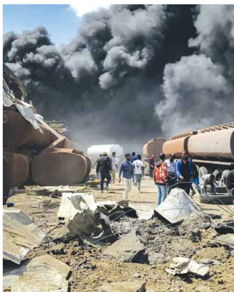
خراب وفوضى ودمار فى إثيوبيا