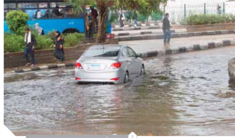
الأمطار تغرق شوارع القاهرة