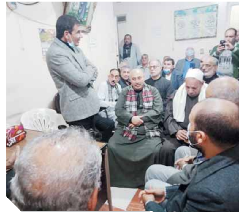
..ويلتقى عدداً من أهالى دائرته