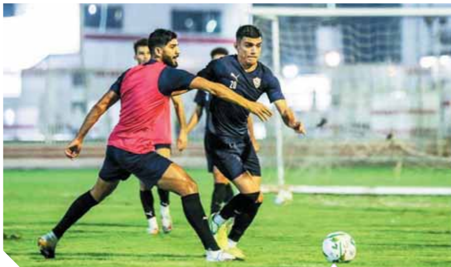
استعدادات جاده فى معسكر الزمالك للقمة الإفريقية

«مرتضى» للاعبين: أنتم الأقوى.. وتكرار أحداث سوبر الإمارات مرفوض