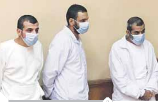
المتهمون بقتل فتاة المعادى

كتب- سيد العبيدي: وجه اللواء محمود شعراوى وزير التنمية المحلية ، وحدات تكافؤ الفرص بالمحافظات بتنفيذ عدة أنشطة وفعاليات خلال فترة حملة الـ ١٦ يوما لمناهضة العنف ضد المرأة فى الفترة من ٢٥ نوفمبر حتى ١٠ ديسمبر ٢٠٢٠ لزيادة الوعي بهذه القضية والقضاء على جميع أشكال العنف ضد المرأة وتفعيل مشاركتها فى خطط التنمية المستدامة. وأكد اللواء محمود شعراوى أهمية دور المرأة فى المجتمع والارتقاء بخطط التنمية مشيراً الى ان الوزارة نفذت عدة مبادرات فى مجال الحماية ومناهضة العنف ضد المرأة منها مبادرة ( معاً ضد العنف ) وذلك