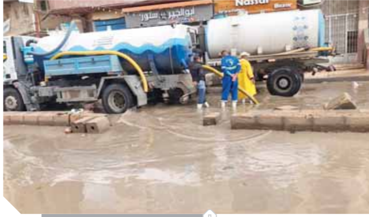
استمرار أعمال شطف المياه بالإسكندرية