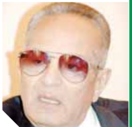
بهاء الدين أبوشقة