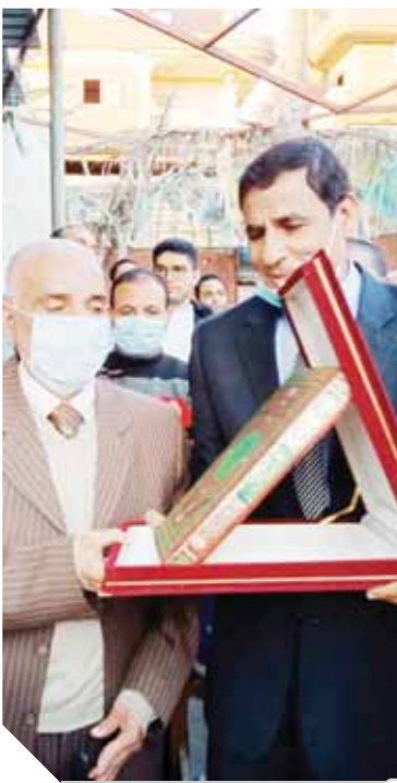
..ويشارك في حفل تكريم أستاذه