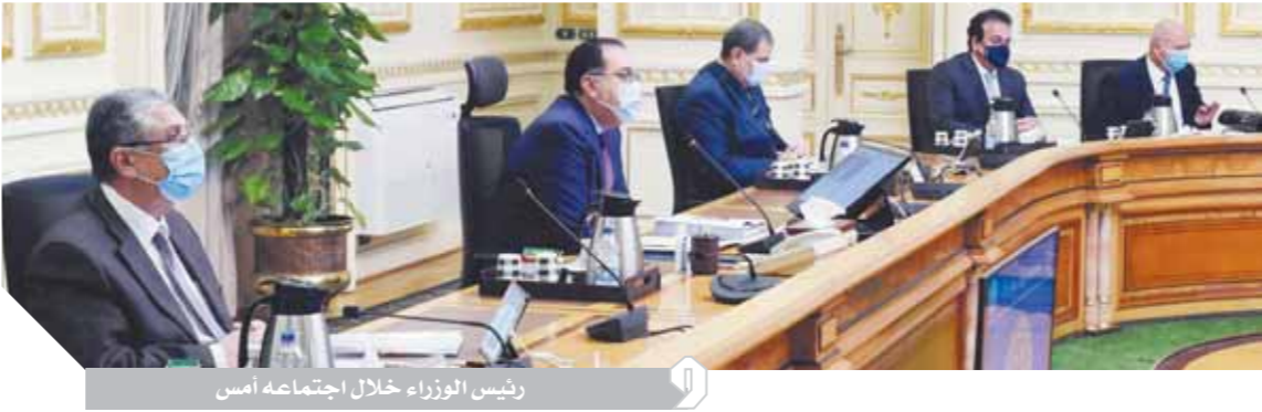
رئيس الوزراء خلال اجتماعه امس