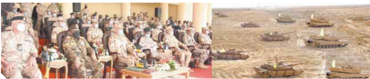
كتب. محمد صلاح وابوزيد كمال

القائد الأعلى للقوات المسلحة والفريق أول محمد زكى القائد العام للقوات المسلحة وزير الدفاع والإنتاج الحربى لكافة الوفود المشاركة. وكان الفريق محمد فريد حضر إحدى مراحل المناورة، والتي تضمنت تنفيذ القوات المشاركة عملية اقتحام بؤرة إرهابية مسلحة داخل قرية حدودية وتطهيرها من العناصر الإرهابية وتحرير الرهائن وإعادة الحياة لطبيعتها داخل القرية بمشاركة عناصر من القوات الجوية والبرية والقوات الخاصة من المظلات والصاعقة. تزامن ذلك مع تنفيذ القوات البحرية للدول المشاركة عددا من الأنشطة التدريبية شملت