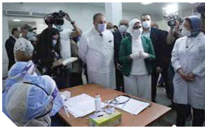
الصحة تستعد للموجة الثانية لـ كوفيد ١٩