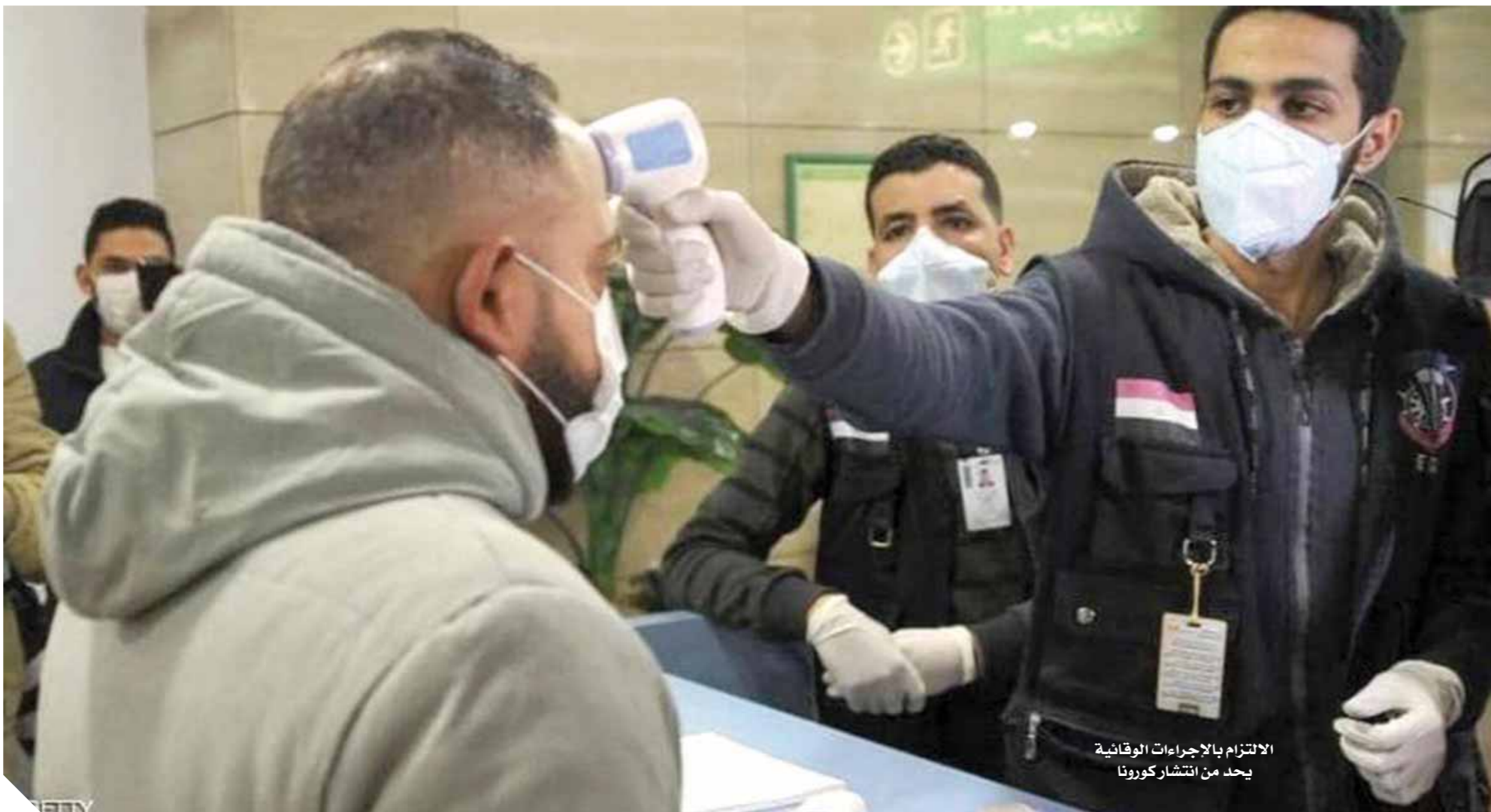
الالتزام بالإجراءات الوقائية يحد من انتشار كورونا

موجة جديدة من فيروس كورونا اجتاحت دول العالم في الأسابيع الماضية، وازدادت حدتها نتيجة لتخفيف الإجراءات الاحترازية، ومع عودة الارتقاع من جديد في أعداد المصابين في مصر، ازدادت مخاوف المواطنين، خاصة في ظل وجود بعض الآراء التي تؤكد خطورة الموجة الثانية، لكن الخبراء حسموا الأمر وراهنوا على وعي المواطن، ليتوقف حجم انتشار الفيروس وزيادة الإصابات على مدى التزام المواطنين بالإجراءات الاحترازية والوقائية، والتي ستكون بمثابة خط الدفاع الأول ضد هذا الوباء. طبقاً لبيانات وزارة الصحة يصل إجمالي المتعافين من الفيروس إلى ١٠٠٧٦٠ حالة، بينما يصل عدد المصابين إلى ١١٠٠٩٥ حالة، منذ بداية دخول الفيروس لمصر.