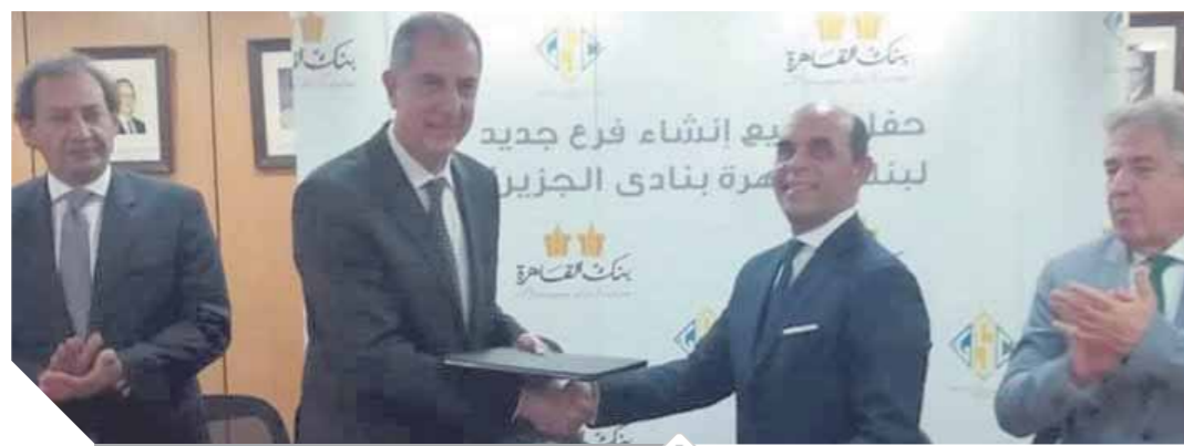
فايد جزايرين خلال توقيع عقد الرعاية