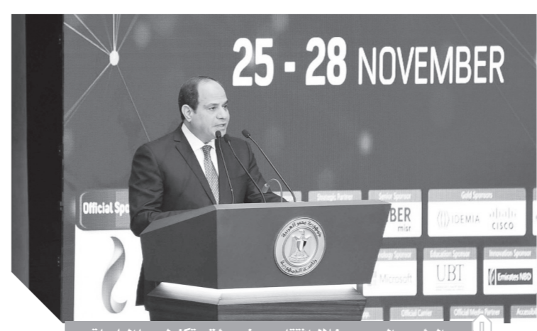
الرئيس السيسي، خلال افتتاح معرض ومؤتمر تكنولوجيا المعلومات

تأسس ١٠٠ شركة ناشئة مصرية وإفريقية في هذا المجال». وأكتم «السيسي» كلمته بالقول: «أتمنى لمؤتمر كل النجاح في استثمار الإمكانيات الهائلة والفرص المتميزة التي يتيحها قطاع الاتصالات وتكنولوجيا المعلومات بما يساعد على التوصل إلى حلول مبتكرة لدفع عجلة التنمية المستدامة، وأكد لكم دعم الحكومة الكامل لهذا القطاع لوكالة التطورات العالمية المتسارعة في هذا المجال ولتقيام بدوره في إقامة مجتمعات جاذبة للاستثمارات وداعمة للإبداع التكنولوجي وبناء مستقبل مزدهر يليق بمكانة وطننا وشعبنا العظيم».