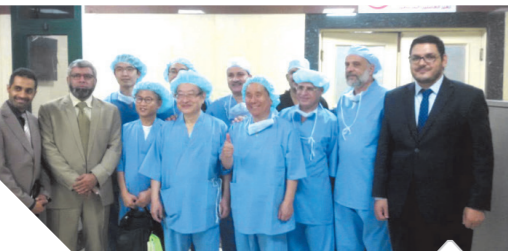
فريق جراحة كوري

أصدرت مساء أمس محكمة الأسرة بمدينة نصر حكماً بإلزام الفنان أحمد عز بالمصاريف الدراسية لتطليه التوأم من الفنانة زينة، والتي قدرتها بمبلغ 30 ألف جنيه إسترليني للعام الدراسي الحالي. وكشف معزز الذكر محامي الفنانة زينة، في تصريحات له «الوفا» أنه تم تحديد قيمة المصاريف الدراسية بالعملية الأجنبية نظراً لانحياز التوأم بمدارس أجنبية دولية لا تقبل المصاريف إلا بالعملات الأجنبية. وكانت خلافاً قد نشبت بين أحمد عز وزينة ودار بينهما صراع كبير في المحاكم الأليات وزوجهما ونسب التوأم زين الدين وعز الدين للفنان أحمد عز، وبعد صراع طويل داخل المحاكم أصدرت المحكمة السابقة في القضية وقضت بأبائت نسب طفلتهما وتسجيلهما باسمه، وفي حكم أخرى قضت محكمة الأسرة بمدينة نصر الصراع القضائي الطويل بإصدارها حكم نهائياً بالخلع للفنانة زينة من أحمد عز.