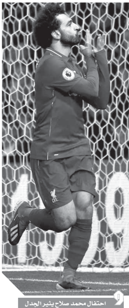
احتفال محمد صلاح بتيار الجدل