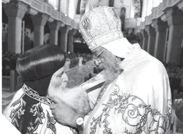
البابا تواضروس يرسم أساقفا

ترأس قداسة البابا تواضروس الثاني-بابا الإسكندرية-بطريرك الكرازة المرقسية قداستا صباح أمس الأحد بالكاتدرائية المرقسية بالعاصمة لرسامة أساقفة جدد، ومطارنة من أساقفة الإبراشيات، مهناً الأقباط بدء صوم الميلاد المجيد. ومنح البابا تواضروس 6 أساقفة رتبة «مطران» وهم على الترتيب (الأنبا مرقس أسقف شبرا الخيمة، الأنبا إبرام أسقف الفيوم، الأنبا بولا أسقف طنطا وتوابعا، الأنبا بساده أسقف إخميم وساقته، الأنبا أندراوس أسقف أوتيتج وصندا، والأنبا إشعيا أسقف طهطا وجهينة). ورسم البابا تواضروس خلال القداس الذي حضره مئات الأقباط، وعدد من أساقفة المجمع المقدس خمسة أساقفة جدد هم: (القمص بيشوى آفا موسى أسقفًا عامًا باسم الأنبا بيزل، والقمص مكسيموس آفا موسى أسقفًا عامًا باسم الأنبا جريجوري، الراهب القمص مرقس الأنبوبي أسقفًا لولادي الجديد والواحات باسم الأنبا أرسانيوس، الراهب القمص بولس المحرقى