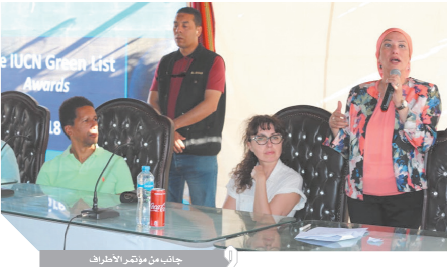
جاناب من مؤتمر الأطراف

ملحوظة: مستعد للإعتذار الكامل عن كلامي إذا ثبت أنه خطأ وشابه قدر من عدم الدقة، ورغم أن الكاتب لا يتمنى أن يكون على خطأ فإنتي ادعو الله من كل قلبى إلا أكون على صواب!!!