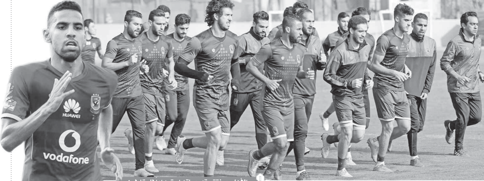
الأهلي يختم تدريباته استعداداً للمقاولون