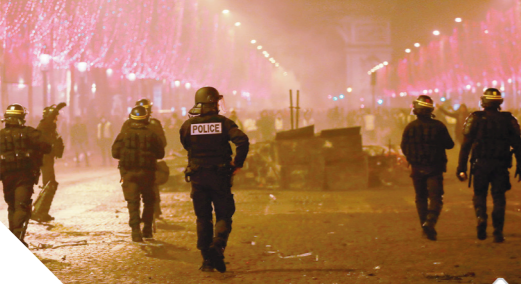
الشرطة الفرنسية تستخدم الغاز لتفريق المحتجين على شعار الوغد