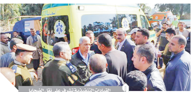
القيادات التنفيذية تتصرف على نقل الضحايا