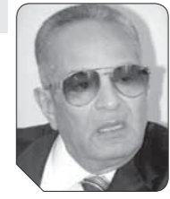
بهاء الدين أبوشقة