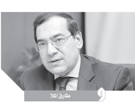
وقال المهندس طارق الملا وزير البترول والثروة المعدنية، رئيس المؤتمر، إن حضور السيسي ورعايته لهذا الحدث الإقليمي المهم لصناعة التعدين على أرض مصر يعكس دعم الدولة واهتمامها بقطاع الثروة المعدنية في إطار تقديم الدعم الكامل لهذا القطاع الحيوي الذي تعمل الدولة

على تطويره وفق خارطة طريق ورؤية واضحة إدراكًا منها لأهمية هذا القطاع وتطلعا لأن يسهم بدور كبير في تعزيز اقتصاد مصر، وأن يصبح أحد مصادر العائدات للخزانة العامة للدولة في ظل توافر الثروات المعدنية التي تزخر بها العديد من المناطق في مصر. وأضاف أن هذا الحدث المهم يعقد للمرة الثانية على أرض مصر بعد استضافته في القاهرة عام 1999 ويعد نافذة مهمة للترويج للاستثمار في الأنشطة المعدنية في مصر والدول العربية خاصة أن مصر تعمل حاليًا على تهيئة المناخ الاستثماري في قطاع الثروة المعدنية ليصبح أكثر جاذبية للاستثمارات المحلية والعربية والأجنبية، لافتًا إلى أن المؤتمر يعد فرصة للتشاور بين المسؤولين بقطاعات التعدين في الدول العربية حول سبل تعزيز التعاون في هذا القطاع وتبادل الخبرات والاستفادة من التجارب الناجحة لكل دولة في النهوض بهذا القطاع وإقامة صناعات تعدينية لزيادة القيمة المضافة من مواردها الطبيعية، مشيرًا إلى أنه سيعقد على هامش المؤتمر اجتماع تشاوري لوزراء الثروة المعدنية العرب المشاركين بالمؤتمر.