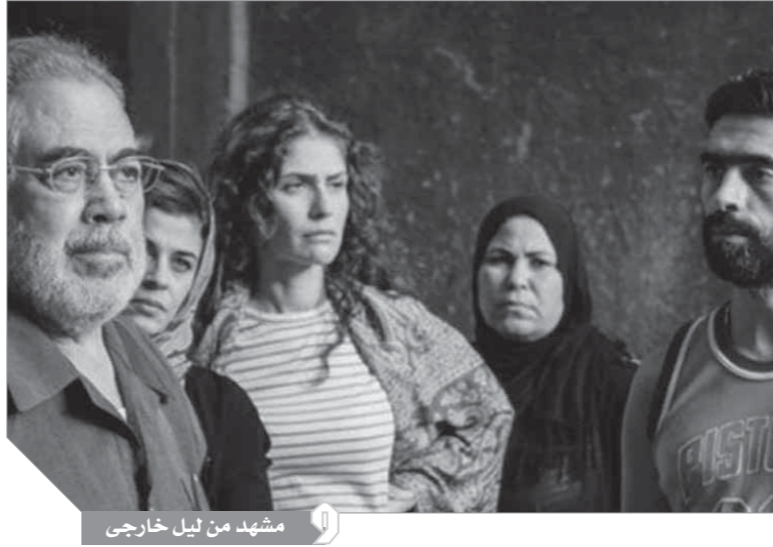
مشهد من ليل خارجي