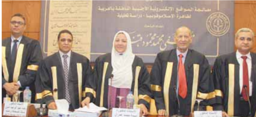
الباحث مع لجنة المناقشة

الغربية ثم الاقليات المسلمة. وواصت الدراسة بتفعيل دور المؤسسات الدينية والمساجد في مواجهة ظاهرة الاسلاموفوبيا من خلال نشر الخطب والندوات الدينية واطلاق مشروع اسلامى اعلامى دولى لتصحيح صورة الاسلام المغلوطة من خلال تكاتف الدول الاسلامية والأزهر الشريف وضرورة تطوير مرصد الازهر من خلال الاستفادة من التقنيات التي وفرتها وسائل الاتصال والتكنولوجيا التي تجذب القارئ وتجعله يتفاعل مع الموقع ودعمه بالكوادر الصحفية والاكاديمية القادرة على تطوير العمل به.