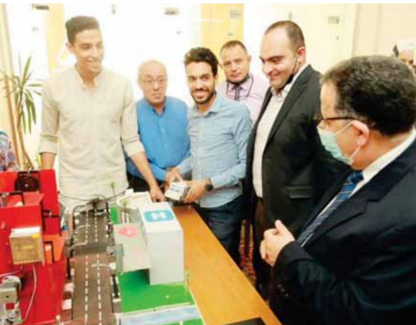
افتتاح معرض مشاريع التخرج

١٥ مشروع تخرج للعام الدراسى ٢٠٢٠/٢٠٢١ وعدد من الأنشطة الطلابية كمخرجات لمقررات تعليمية، وأشد المشاركين بمستوى المشاريع التي أعدها طلاب الهندسة وتميزها لأنها تلبى احتياجات المجتمع.