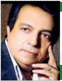
بقلم: د. حسن حماد