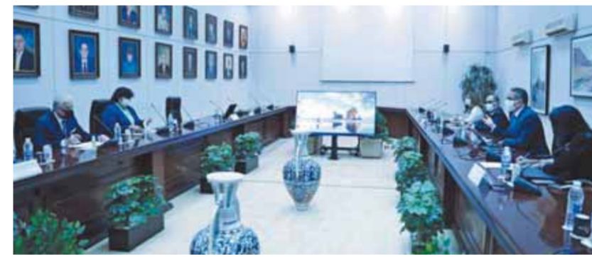
وزير السياحة في لقائه مع وزيرة الثقافة ومحافظ جنوب سيناء

وأشار الوزير إلى أن الوزارة تحرص على الارتقاء بمستوى جودة الخدمات، مشيراً إلى قيام الوزارة بإصدار قرار بتحديد الحد الأدنى لمقابل خدمة الإقامة في المنشآت الفندقية بحيث يكون الحد الأدنى لمقابل خدمة الإقامة (بأي من أنواعها) للفرد في الليلة الواحدة للمنشآت الفندقية، الخمس نجوم ٤٠ دولاراً أمريكياً أو ما يعادلها، و٢٨ دولاراً أمريكياً أو ما يعادلها من المقرر أن يبدأ سريان هذا القرار اعتباراً من ١ نوفمبر المقبل.