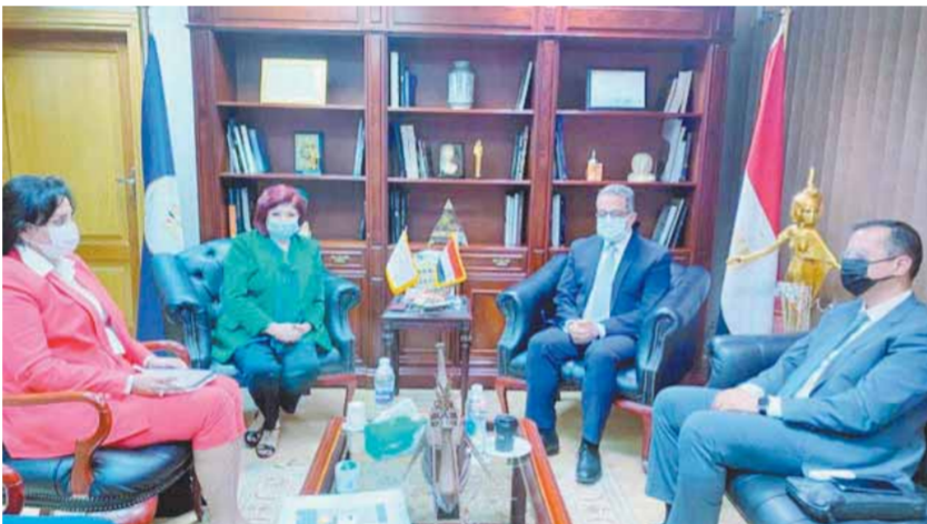
«العناني» في لقائه مع نورا على ورئيس اتحاد الغرف السياحية

وأضاف أن صناعة السياحة تأثرت بشكل ملحوظ في مصر مثلما تأثرت دول العالم بتداعيات جائحة فيروس كورونا، ولكن استطاعت الحكومة المصرية احتواء الأزمة والوقوف بجانب القطاع السياحي المصري ودعمه من أجل الحفاظ على هذه الصناعة المهمة وعدم تسريح العمالة واستئناف الحركة السياحية بشكل آمن يضمن سلامة وصحة العاملين بالقطاع والمواطنين وكذلك السائحين، موضحاً أن حركة السياحة الوافدة لمصر والسياحة الداخلية قد شهدت مؤشرات إيجابية في هذا الشأن.