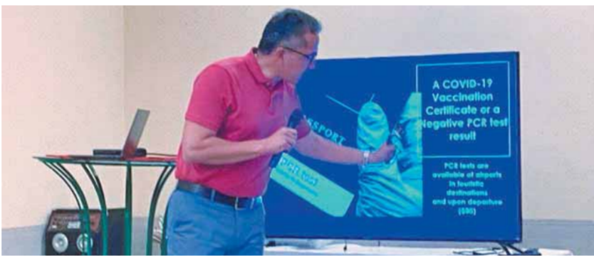
«العناني» خلال كلمته وشرح توضيحي لسفراء ٥٠ دولة