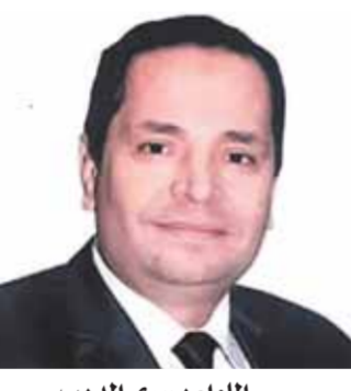
اللواء يسرى الديب

الدعم الفنى والاستشارات الهندسية للهيئات الأخرى من خلال الأعمال التي تؤذيها لتغير، ثم التسيق مع هيئة التنمية الصناعية ووزارة التنمية المحلية لتنفيذ مشروعات ضمن مبادرة «حياة كريمة». كما انتهت الهيئة من مشروع تطوير وإحلال مركز معلومات الهيئة والذي يعد أكبر مراكز المعلومات بالجهات الحكومية والذي يحتوى على قواعد بيانات جميع المدارس على مستوى محافظات الجمهورية، وجر العمل على دعم وزيادة عدد العاملين بنظام التعاقد على مشروع لواجهة العجز الشديد في عدد العاملين والمهندسين.