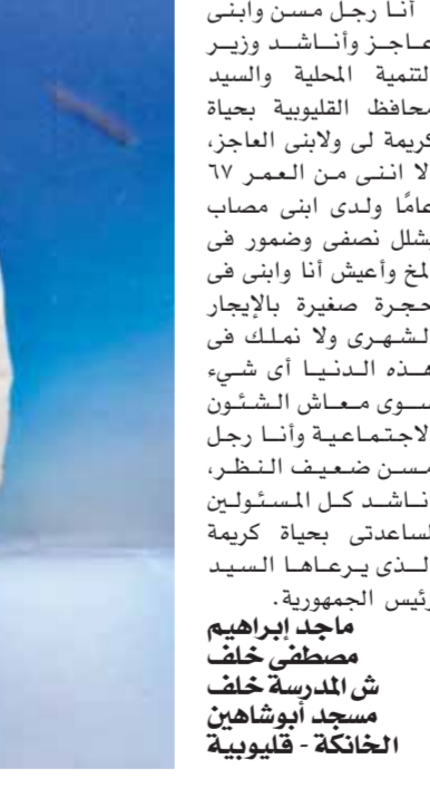
أنا رجل مسن وابنى عاجز وأناشد وزير التنمية المحلية والسيد محافظ القليوبية حياة كريمة لى ولابنى العاجز، الا اننى من العمر ٦٧ عاماً ولدى ابنى مصاب بشلل نصفى وضومر فى الخ وأعيش أنا وابنى فى حجرة صغيرة بالإيجار الشهرى ولا نملك فى هذه الدنيا أى شيء سوى معاش الشئون الاجتماعية وأنا رجل مسن ضعيف النظر، أناشد كل المسؤولين مساعدتى بحياة كريمة لسعدتى يرعاها السيد رئيس الجمهورية.