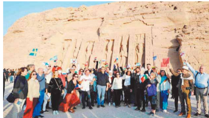
«العناني» مع سغراء العالم لحظة تعامد الشمس على معبد أبو سمبل

عقد الدكتور خالد العناني، وزير السياحة والآثار، عدداً من اللقاءات المهمة خلال الأسبوع الماضي سواء على المستوى المحلي أو الدولي كان أولها لقاءه مع لجنة السياحة والإعلام بمجلس الشيوخ المصري وتلاها اللقاء كلمة مسجلة في المنتدى الاقتصادي العربي النمساوي، كما عقد لقاء مع وزيرة الثقافة إناس عبدالدايم، واللواء خالد فودة محافظ جنوب سيناء، لبحث إقامة احتفالية عالمية وسانت كاترين، كما بحث مع رئيس لجنة السياحة والطيران بمجلس النواب ورئيس اتحاد الغرف السياحية استعدادات القطاع السياحي لاستقبال الموسم الشتوي.