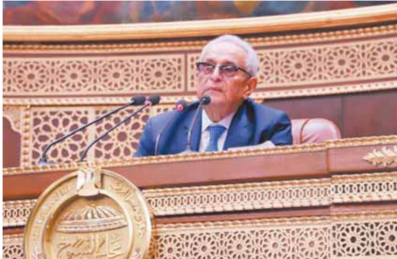
«أبوشقة»، خلال رئاسته جلسة الشيوخ أمس