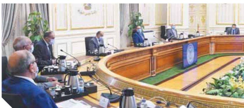
مدبولي، أثناء اجتماعه أمس مع بعض الوزراء

أكد الدكتور مصطفى مدبولي، رئيس مجلس الوزراء، أن الحكومة تضع المشروع القومي لرصف الطرق المحلية على أجندة أولويات عملها خلال المرحلة الحالية، من أجل رصف ورفع كفاءة الطرق المحلية ذات الأولوية، وذلك في إطار خطة الدولة لتحسين الخدمات المقدمة لمواطني المحافظات المختلفة، وأضاف: سننوع في استخدام منظومة إعادة تدوير الطرق الأسفلتية، إلى جانب تطوير المزلقاتان، وسنعمل على تدليل أى عوائق في هذا الملف.