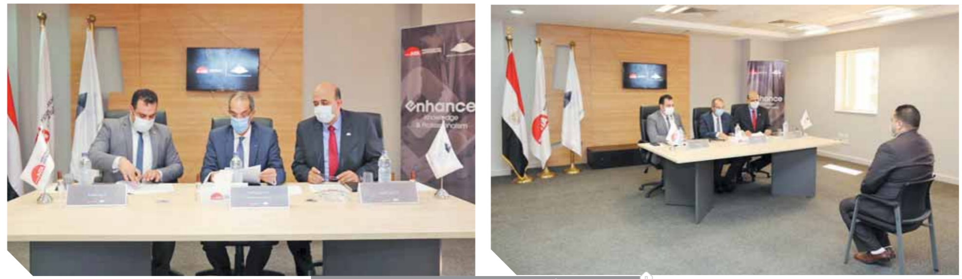
وزير الاتصالات أثناء المقابلات الشخصية للمتقدمين للبرنامج الرئاسي

الدولة كافة في المرحلة العمرية من ٣٠ حتى ٤٥ عاما سعيا نحو إيجاد نهج متكامل يربط كل جهات الدولة من الجهاز الإداري بالإضافة إلى الكوادر الخاصة المختلفة. ويتم تقديم البرنامج بالتعاون مع عدد من الشركاء الدوليين لإضفاء بُعد دولي ونقل خبرات عالمية للمتدربين. يشار إلى أن وزارة الاتصالات وتكنولوجيا المعلومات تتعاون مع الأكاديمية الوطنية للتنوير في برامج عديدة، فمؤخرا تم إطلاق المرحلة الثالثة من برنامج «المستول الحكومي المحترف» في إطار تنفيذ خطة الدولة لرفع قدرة وكفاءة العاملين بالجهاز الإداري للدولة في التعامل مع التكنولوجيا الحديثة بما يتواءم مع التحولات الإدارية وتوجه الدولة نحو التحول الرقمي.