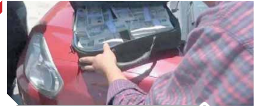
أثناء قيام رجال الرقابة الإدارية بالقبض على المتهم

وأوضح أن القانون الجديد يتضمن تيسيرات جديدة للمتعاملين مع الجمارك، منها: استحداث نظام جديد لتسوية المنازعات الجمركية يتيح النظم إلى جهة الإدارة قبل اللجوء للحكيم؛ بما يمنع تفاقم المنازعات بين أصحاب البضائع ومصصلحة الجمارك، ويضع حلولاً