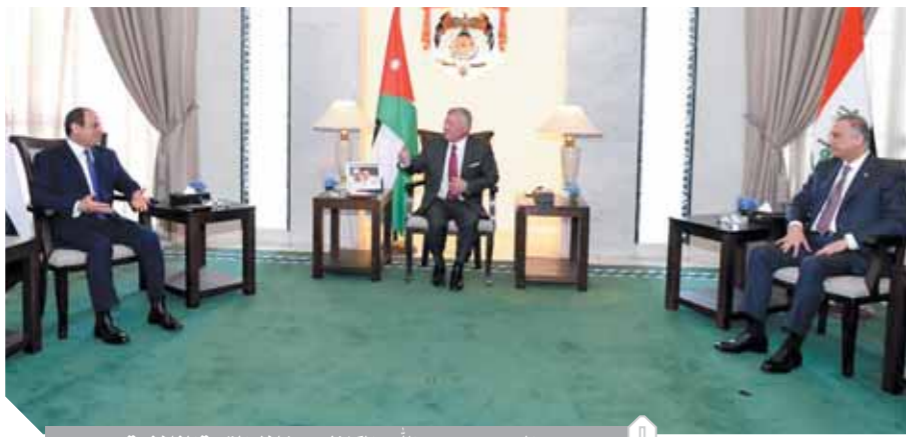
السياسي وعبدالله والكاظمي خلال القمة الثلاثية