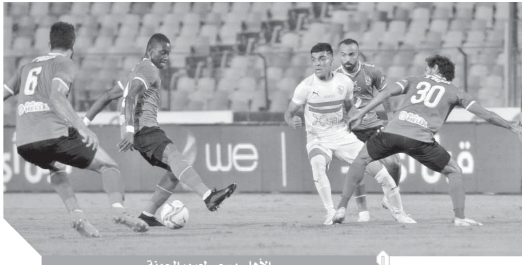
الأهلى يسعى لعبور الجونة

بأطل أفريقيا بعد أن تحسنت حالته عقب إجراء جراحة الكتف. من ناحية تتجه الأنظار في التاسعة مساءً إلى ستاد القاهرة لتابعة جماهيره بعد الخسارة الماضية أمام