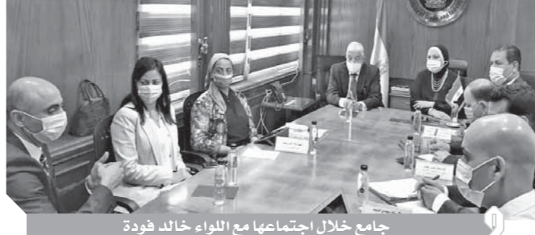
جامع خلال اجتماعها مع اللواء خالد فودة

عقد الدكتور عاصم الجزار، وزير الإسكان والمرافق والمجمعات العمرانية، اجتماعه الدورى بحضور مسئولى صندوق الإسكان الاجتماعى ودعم التمويل القارى، وقيادات الوزارة، وهيئة المجتمعات العمرانية الجديدة، لتابعة موقف تنفيذ الوحدات السكنية بمشروع الإسكان الاجتماعى، بمحافظة القليوبية - (القليوبية) - الإسماعيلية)، ومدن (العبور) - بدر - العاشر من رمضان. وأكد الدكتور عاصم الجزار، ضرورة المتابعة الحثيثة والدورية لجميع مراحل التنفيذ، من أجل الالتزام بالمواعيد المحددة للالتناء من الأعمال بأعلى جودة، حتى يتم تسليم تلك الوحدات لمستحقيها، وشدد الوزير على ضرورة الاهتمام بأعمال اللاند