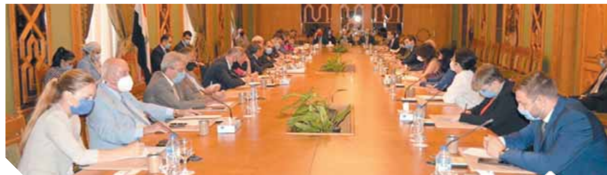
«لوزا» يطلع السفراء الأوروبيين على آخر مستجدات المفاوضات