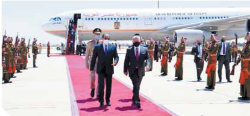
الرئيس السيسي لدى وصوله مطار عمان وفى استقباله الملك عبدالله

عقدت أمس قمة ثلاثية بالعاصمة الأردنية عمان بين الرئيس عبدالفتاح السيسي، وعاهل المملكة الأردنية الملك عبدالله الثاني، ورئيس وزراء العراق السيد مصطفى الكاظمي. وصرح المتحدث باسم رئاسة الجمهورية بأن القمة تناولت سبل تعزيز التعاون الثلاثي المشترك في مختلف المجالات بين الدول الثلاث، خاصة تلك التي تتعلق بالطاقة والربط الكهربائي والبنية الأساسية والغذاء، فضلاً عن التشاور والتنسيق بشأن مستجدات الأوضاع السياسية والأمنية في المنطقة، وجهود مكافحة الإرهاب.