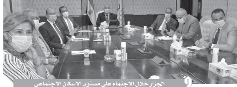
الجزائر خلال الاجتماع على مستوى الإسكان الاجتماعى

الوزير تحددت عن طموحات الوزارة والدولة فى المرحلة القادمة بالوصول إلى قطارات نظيفة تطلق فى مواعيدها المحددة وتصل فى المواعيد المحددة شمالا وجنوبا، وقال إن الدولة تتفق على ٤٦ مليار جنيه على إشارات القطارات للوصول إلى الخدمة المتكاملة فى السنة الحادية. كامل الوزير وجه التحية والتقدير لأهل الصعيد قائلا: لا نعمل شيئا يضركم، أو ضد مصالحكم، فتحتم عمل لصالح البلد والشعب بالكامل بتوجيهات من الرئيس السيسى رئيس كل المصريين، ونحن تحت أمر كل مصرى، وعندما تم تعييني وزيرا للنقل هكذا يقول الوزير. قلت أنا تحت أمر مصر، ولن يضرنا مصرى داخل وخارج مصر فى هذا العهد الذى لا يفرق بين مسلم ومسيحي ولا بين مصري وبحراوى ولا بين صغير وكبير. الفتحة نائمة عن الله الإخوان الذين حاولوا النفع فيه وتحريض أبناء الوطن، وأهلتا فى الصعيد على الدولة، فىس الإخوان، وينس تفكيرهم المرضى، وأهلا بأهلتا فى الصعيد فى القاهرة التى مازالوا يطلقون عليها مصر، مصر للجميع إلا الإرهابية الخونة، فهم لا يستحقون هذا الوطن الذى قرر النهوض رغم حقد الحاقدين من دول وجماعات إرهابية.