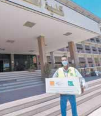
جانب من المساعدات الطبية المقدمة