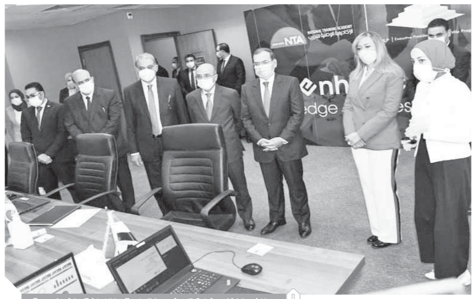
الملاء، خلال مشاركته فى اختبارات المقابلات الشخصية

الأماكن الشاغرة بكليات القمة وقد يحرم اعداد من طلاب المرحلة الأولى من الحلق الطبيعى عن هذه الكليات وخاصة الحاصلين على ٤٠٠ درجة بنسبة ٩٧.٦٠٪. وتؤكد المؤشرات ان طلاب المرحلة الأولى من العلمى علوم سيغفلون الأماكن المقررة لهم بكليات القمة ويقبل باقى الطلاب فى كليات اخرى حسب ترتيب الرغبات فى بطاقة الاختيار وكشفت الاحصاءات الرسمية أن الطلاب الحاصلين على ٩٧.٥٪ لن يكون لهم أماكن بكليات القمة فى المرحلة الأولى وستكون جميع الأماكن الخالية بكليات القمة كاملة العدد لطلاب العلمى علوم وتؤكد المؤشرات الرسمية وفقا لاحصاءات «الأعلى للجامعات» والاعداد المقرر قبولها المرحلة الأولى أن طلاب الرياضيات فرصتهم أفضل فى القبول بكليات القمة هذا العام من طلاب العلوم والأدبى.