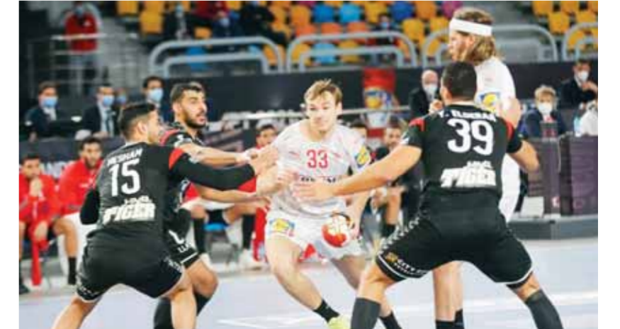
المنتخب يسعى للفوز على الدنمارك

كتب - محمد اللاهونى؛ يخوض المنتخب الوطنى لكرة اليد مواجهة نارية ضد الدنمارك بطل العالم فى الاسبوع والربع صباح اليوم الاثنين فى ثاني جولات المجموعة الثانية بنافسات اللعبة فى دورة الألعاب الأولمبية التى تستضيفها العاصمة اليابانية طوكيو. حقق المنتخب فوزاً مهماً على حساب البرتغال بنتيجة ٢١/٢٧ فى الجولة الأولى، بينما يتصدر منتخب الدنمارك بفوزه العريض على حساب اليابان بنتيجة ٣٠/٤٧. وكان آخر لقاء بين مصر والدنمارك فى كرة اليد قد أقيم فى ربع نهائى بطولة العالم التى أقيمت فى مصر خلال شهر يناير الماضى وخسر