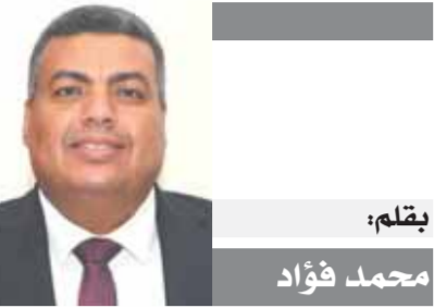
بقلم: محمد فؤاد