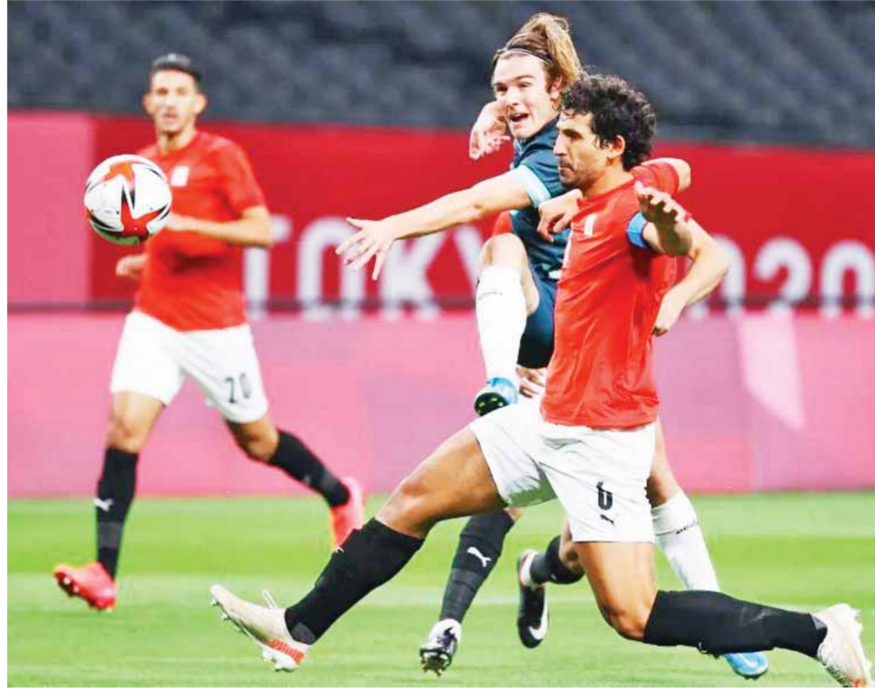
المنتخب قدم أداء دفاعياً أمام الأرجنتين

متباعدة معتمداً فقط على الكرات الطولية أو الانطلاقات الفردية من رمضان صبحى، والتي لم تؤت ثمارها لعدم وجود تجانس بينه وبين إبراهيم عادل أو أحمد ياسر ريان. الأخطاء لم تكن فقط على مستوى اللاعبين، بل هي من البداية فى إدارة شوقى غريب للقاء، فوضع جيداً أن المدرب لم يدرس المنافس جيداً، ويالغ فى احترامه من خلال تكرار نفس طريقة اللعب التى خاض بها لقاء إسبانيا، رغم علمه بضرورة المغامرة الهجومية وأهمية الفوز. أمام منتخب اليف لم يشكل أى خطورة على أستراليا فى المباراة الأولى.