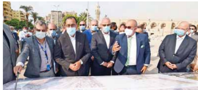
مدبولى خلال تفقده أمس مشروع حدائق القسطاط

والذى يشمل تطوير منطقة عين الحياة، وإتاحة مسار للمشاة، فضلاً عن تطوير حديقة القسطاط التاريخية، وتطوير منطقة الحفريات، وخلال الجولة التقيدى بموقع تطوير ساحة مسجد عمرو بن العاص، استعرض اللواء محمود شحاتة الاستعمالات الحالية للموقع والمناطق المحيطة، ومخطط تطوير هذه الاستعمالات وفق التصميم الجديد لتطوير المنطقة، لافتاً إلى أنه سيتم الاستفادة من الفراغ العمرانى للساحة فى إعادة تنظيم العلاقة الوظيفية بين أنشطة الساحة والاستعمالات المحيطة. وخلال الجولة، تم كذلك التنبه إلى أن مخطط تطوير ساحة المسجد يشمل تحديثاً شاملاً للمدخل الرئيسى للمسجد، وأشجاراً للظل، وتراسات ورسيفاً للمشاة، وأماكن انتظار للسيارات، ونافورة، فضلاً عن تطوير سوق القسطاط القائم، كما تم تصميم الفراغات الرئيسة للمشروع، حيث يتضمن المخطط محور حركة رئيسياً يمر بمنتصف المشروع، وساحة تجميعية تتوسط كل فراغ ومناطق خضراء من التجليل لضييف اللون الأخضر الجذاب إلى الساحة مع تصميمه على نفس منسوب أرضية الساحة؛ كى تصلح