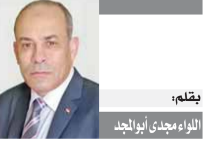
بقلم: اللواء مجدى أبوالمجد