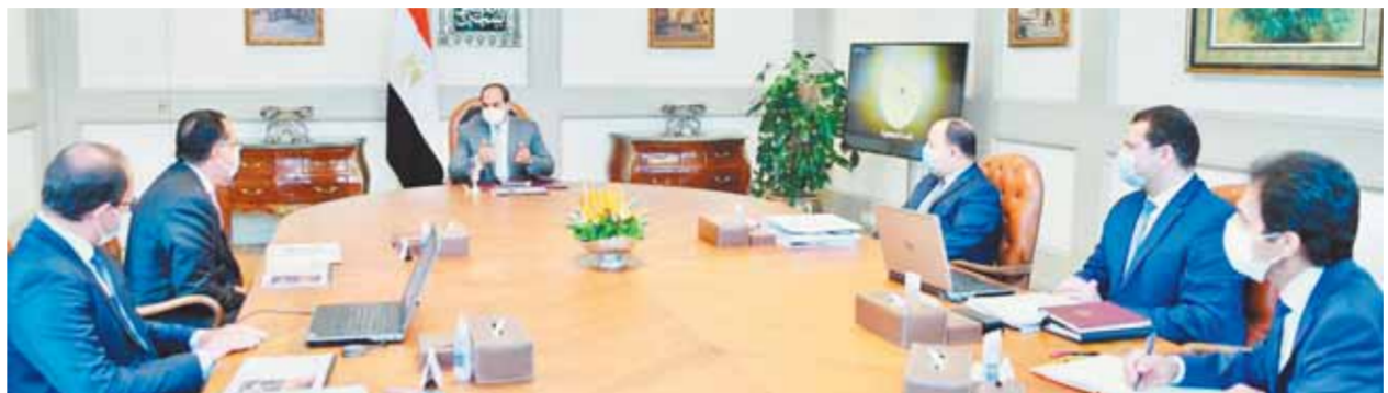
الرئيس خلال اجتماعه أمس ووزير المالية

من أقل من ٢, ١٠٠ عام قبل يونيو ٢٠١٧ إلى ٤٥, ٣ عام فى يونيو ٢٠٢١، كما تم خفض تكلفة خدمة الدين من ٤٠٪ من إجمالي المصروفات المحلى، وذلك على الرغم من جائحة كورونا التي أثرت على معدلات النمو الاقتصادى والإيرادات والمصروفات، وأدت بالعديد من الدول إلى زيادة معدلات الدين، حيث نجحت مصر فى رفع كفاءة إدارة الدين العام خلال موازنة العام المالى والدولية، كما تراجع الدين إلى الناتج المحلى فى مصر من ٨٠٪ خلال عام ٢٠١٦/٢٠١٧ إلى ٩٠,٦٪ بنهاية العام المالى ٢٠٢٠/٢٠٢١، فضلاً عن نجاح الحكومة فى إطالة عمر الدين