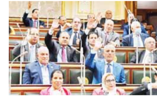
جانب من جلسة مجلس النواب أمس