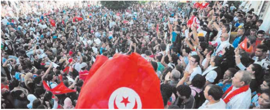
المتظاهرون يحتجون على تردى الأوضاع

وعنت المعارضين فضلاً عن وضع محاولة استغلال المؤسسة القضائية لإفساد ملفات التقاضي في عدة قضايا إرهابية أبرزها مقتل شكري بلعيد ومحمد البراهمي. وأغلقت السلطات التونسية كافة الطرقات والمنافذ المؤدية لمقر البرلمان وشارع الحبيب بورقيبة والشوارع الرئيسية القريبة منه، لتعطيل وصول المتظاهرين. حيث تظاهر عدد من التونسيين أمس، في محيط البرلمان التونسي، للاحتجاج على تردى الأوضاع الصحية والسياسية والاقتصادية والاجتماعية في البلاد، ومطالبين بحسبة الحكومة والغنوشي. وانتشرت الاحتجاجات في محافظات أخرى بخلاف العاصمة التونسية، حيث اقتحم محتجون، أمس، مقرات حركة النهضة التونسية في توزر والقيروان وسوسة وصفاقس والكاف، وفقاً لموقع توزر نيوز التونسي، وقام المحتجون خلال تجمعهم أمام مقرات حركة النهضة في عدة محافظات تونسية باقتلاع اللافتة الخاصة بالحزب في محافظة سوسة الساحلية وسط هتافات ودعوات تنادي برحيل الإخوان وزعيمهم في تونس راشد الغنوشي، ورفعوا شعارات تطالب بخروجها من الحكم.