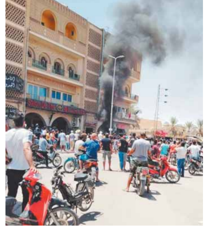
المحتجون يحرقون مقر الإخوان

كتبت - منار السويضي: انتفض أمس الشعب التونسي ضد جماعة الإخوان، واقتحم المحتجون مقرات حركة النهضة وأحرقوا مكاتب الجماعة ومطابروا بسوقواشد الغنوشي، ورحيل الإخوان عن البلاد، وأكد المتظاهرون أن الحركة الإخوانية هي المسؤولة عن تدهور الأوضاع الاقتصادية والاجتماعية والصحية بسبب فشلها في إدارة شؤون البلاد. وتجاوزت المظاهرات الغاضبة العاصمة التونسية إلى عدة مدن ومحافظات وشهدت حشداً شعبياً كبيراً، بعد أن بدأت في ميدان باردو حيث مقر البرلمان التونسي في العاصمة، ثم امتدت الاحتجاجات إلى خارج العاصمة. وانطلقت الاحتجاجات في كل من محافظة سوسة الساحلية وصفاقس والكاف، بنفس الشعارات التي تتهم إخوان تونس في الذكرى الـ٦ لعيد الجمهورية باحتلال تونس. وهتف المحتجون: «يا غنوشي يا سفاح يا قاتل الأرواح»، و«الشوارع والصدام حتى يسقط النظام»، واتهم المتظاهرون، سياسة حركة النهضة بسرقة أحلام الشباب، الذي وصلت نسبة البطالة فيه إلى ٢٠٪ في المئة، وفق آخر إحصائيات المعهد التونسي للإحصاء. ويطلب المحتجون بتشكيل حكومة جديدة، إلى جانب