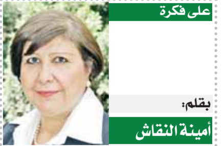
على فكرة بقلم: أمنية النقاش

لمزيد من الأخبار والتقارير المصورة ALWAFD.NEWS | إشراف: نيرمين حسن