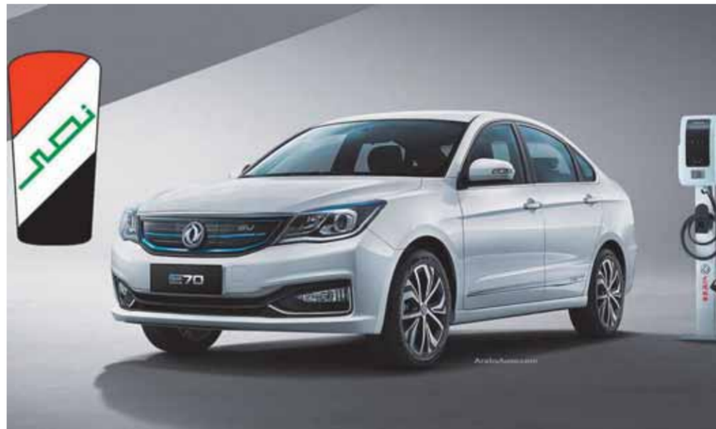
السيارة الكهربائية المصرية نصر E70

مدارس السيارات ووجه الرئيس السيسي بضرورة زيادة عدد مدارس التكنولوجيا التطبيقية وإدراج العديد من التخصصات الجديدة وفق احتياجات سوق العمل، وفي مقدمتها مجال السيارات، وذلك بالتعاون مع كبريات الشركات والمؤسسات، بما يتناسب مع استراتيجية الدولة المصرية ورؤية ٢٠٣٠، وتوفير تعليم فني يجمع بين الجانبين النظري والعمل بما يمكن الطلاب من اكتساب التقنيات والمهارات والتدرجات اللازمة لسوق العمل، وهو ما يتماشى مع خطة الدولة نحو تطوير صناعة السيارات والصناعات الغذائية لها بمصر، ومواكبة التقدم العالمي في مجال صناعة السيارات والأفاق المستقبلية لتلك الصناعة.