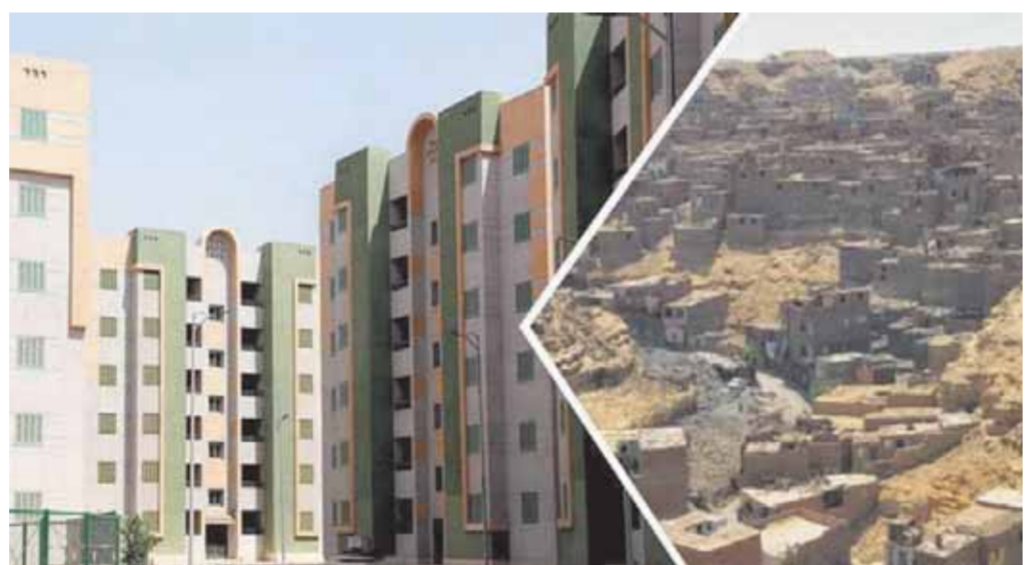
الفرق واضح بين الصورتين

تطوير فى شق الثعبان لم يحدث منذ ٣٠ عاما تحرس الدولة على أن تصبح منطقة شق الثعبان منطقة عالمية فى تصنيع الرخام حيث قامت أجهزة الدولة بتطوير البنية التحتية للمنطقة وتقنين أوضاع أصحاب المصانع وبعد هذا إنجازا كبيرا بحسب اللواء خالد عبدالعال محافظ القاهرة، والذي يقوم بالإشراف على التطوير إذ إن المنطقة على مدى ٣٠ عاما لم تشهد مثل هذا الإنجاز الذي يتم استكماله بإنشاء مركز خدمى لرجال الأعمال وإنشاء منطقة لوجستية وطريق يصل إلى الطريق الدائري الأوسطى إلى داخل شق الثعبان بطول ٧ كيلومترا يهدف إلى نقل حركة الواد وسيارات النقل الكبيرة من طريق الأوتستراد إلى الطريق الأوسطى ما يخفف الضغط المروري والتكدس بالمنطقة.