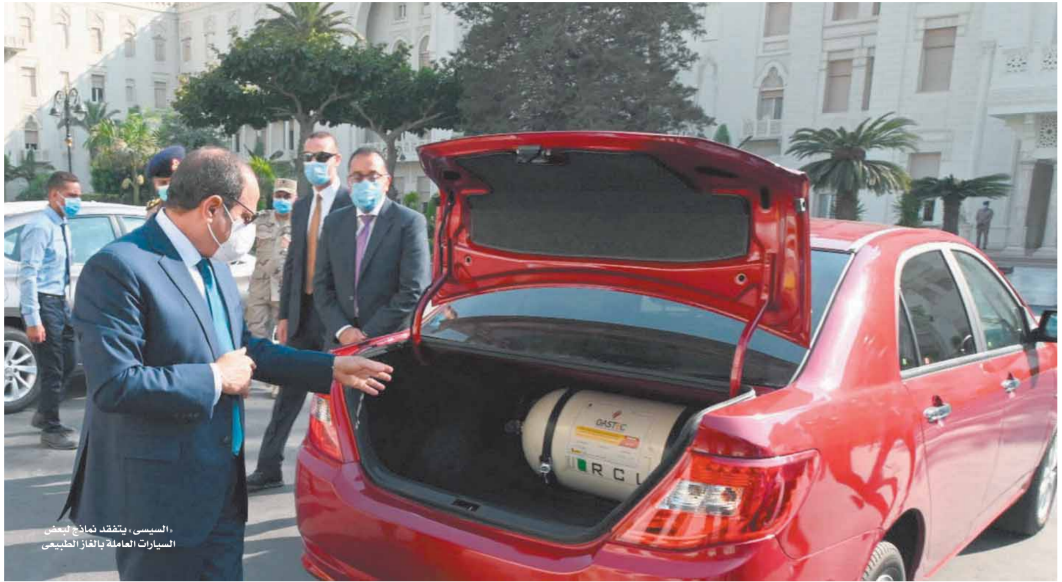
السيسي، يتفقد نماذج لبعض السيارات العاملة بالغاز الطبيعي

تعد المبادرة الرئاسية لإحلال السيارات القديمة التي مر على إنتاجها أكثر من ٢٠ عاماً بأخرى جديدة تعمل بالغاز الطبيعي، كذلك من أهم الإنجازات التي تحققت خلال الفترة الأخيرة، وهي بمثابة حلقة مهمة في سلسلة المبادرات والمشروعات الكبرى التي تتبناها القيادة السياسية لإحداث طفرة من التنمية في شتى القطاعات في البلاد. وقد انطلقت مبادرة إحلال السيارات، في الرابع من يناير الماضي مع افتتاح الرئيس السيسي معرض تكنولوجيا إحلال السيارات للعمل بالغاز الطبيعي، وتتضمن المرحلة الأولى من مبادرة الإحلال التنفيذ في عدد (٧) محافظات وهي القاهرة - الجيزة - القليوبية - الإسكندرية - السويس - البحر الأحمر - بورسعيد، على أن يتوالى بعدها التنفيذ في باقي محافظات الجمهورية. وتشمل مبادرة إحلال السيارات، السيارات الملاكى والتاكسي، والميكروباص، ومن المقرر أن تشمل كذلك التوك توك خلال الفترة القادمة، حيث سيتم تقنين أوضاعه وترخيصه مقابل رسوم ميسرة، وإحلاله اختياريًا بسيارات ميني فان.