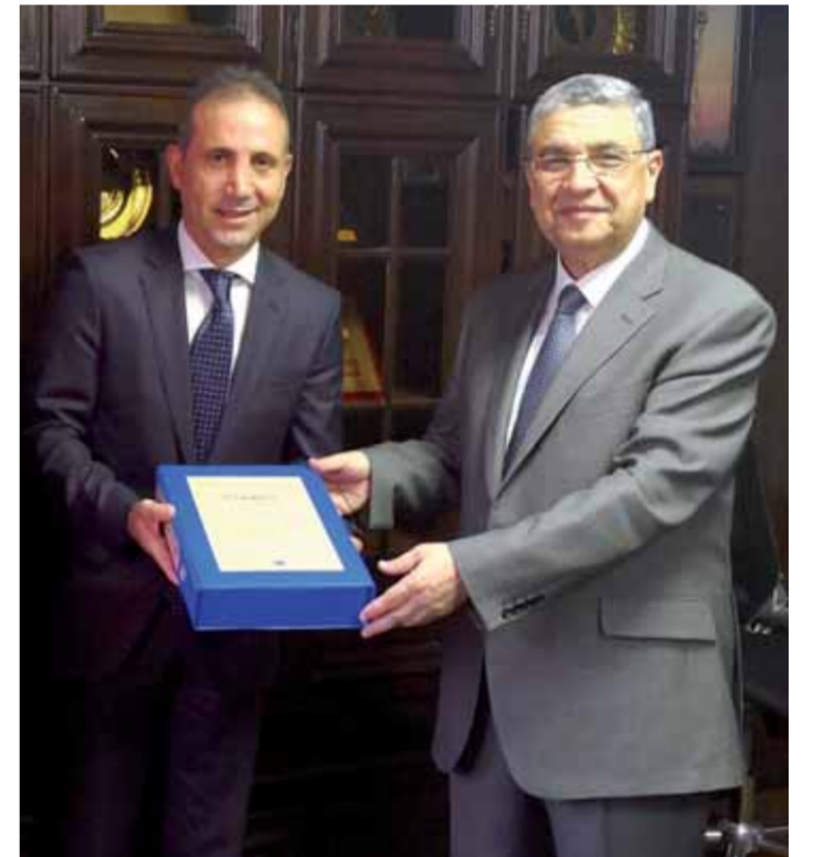
شاكر خلال استقباله المسئول القبرصي

تسلمت مصر أمس دراسة الجدوى الاقتصادية والفنية لمشروع الربط الكهربائي مع أوروبا من خلال قبرص، ويهدف الربط إلى ترسيخ دور مصر كمركز إقليمي للطاقة في منطقة شرق المتوسط في ضوء ما تملكه مصر من إمكانيات لتبني هذه المكانة في المنطقة. ومن المقرر أن يعرض الدكتور شاكر وزير الكهرباء الدراسة على الرئيس السيسي لبدء الإجراءات الفعلية لتنفيذ الربط عن طريق كابل بحري بين مصر وقبرص. استقبل الدكتور محمد شاكر وزير الكهرباء والطاقة المتجددة ب مكتبه صباح أمس لؤيس كاسوليدس رئيس المركز الاستراتيجي لشركة ايريو افريكا إنتر كونتراتور، وخرايس مورتييس سفير قبرص بالقاهرة، وناسوس كاتوريدس المدير التنفيذي لشركة ايريو افريكا إنتر كونتراتور، بحضور عدد من قيادات قطاع الكهرباء. وسلم ناسوس كاتوريدس المدير التنفيذي لشركة ايريو افريكا دراسة الجدوى لمشروع الربط الكهربائي بين مصر وأوروبا للدكتور محمد شاكر وزير الكهرباء طبقاً للجدول الزمني المعد لإنهاء الدراسة. وأكد «شاكر» أن هذا المشروع التاريخي له أهمية كبرى لخطة مصر الاستراتيجية من أجل تحقيق التنمية الاقتصادية وتأمين الطاقة، ويعد أحد المشروعات التي تساعد على ربط مصر بالشبكة الكهربائية الأوروبية وبهذا ستكون مصر نقلاً مهماً للطاقة بالنسبة للقارة الأوروبية. وأشاد بالمجهودات التي تقوم بها شركة «ايريو افريكا» في هذا الصدد موضحاً أننا بذلك نكون قد نجحنا في وضع حجر الزاوية لبدء العمل بمشروع الربط الذي سيحقق فوائد اقتصادية وسياسية للدول المعنية، ووجه «شاكر»