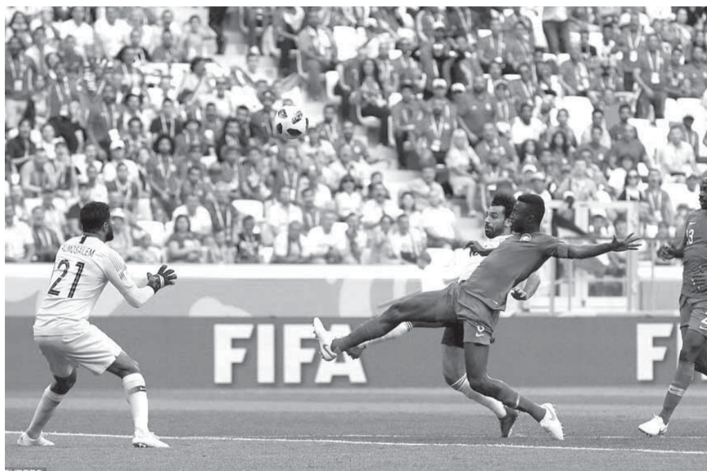
محمد صلاح يسجل هدفه الثاني في المونديال