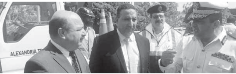
تكثيف الحملات المرورية على الطرق السريعة للكشف عن متعاطى المخدرات

بالعديد من سيارات الإغاثة المرورية على الطرق لمواجهة أى أعطال والدفع بسيارات الدفع الرباعى والدراجات البخارية، كما تم نشر قوات نظامية بإشراف اللواء عاطف الشاعر مدير إدارة البحث الجنائى بالإدارة للتأكد من التزام قائدى السيارات بالتعريف المقررة، يأتى ذلك فى إطار توجيهات وزير الداخلية بشن حملات مرورية على الطرق السريعة لقائدى السيارات بإشراف اللواء علاء الدجوى مساعد الوزير لقطاع الشرطة المتخصصة.