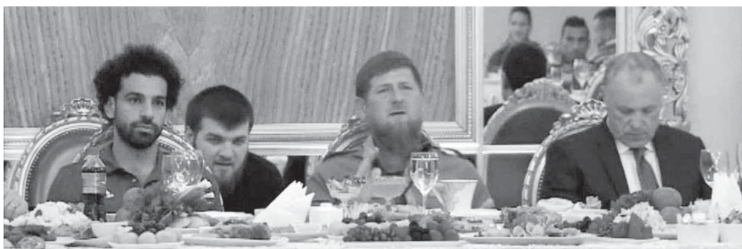
محمد صلاح مع قديروف وأبوريدة

للإتحاد المصري في هذا الشأن، ويسد الإتحاد المصري هذه الفواتير لفيينا من الحصة الممنوحة له وهي الحصة نفسها الممنوحة لجميع الفرق المشاركة، بما لا يدع أي مجال لأي جهة أخرى في دفع أي مستحقات مالية للمنتخب.