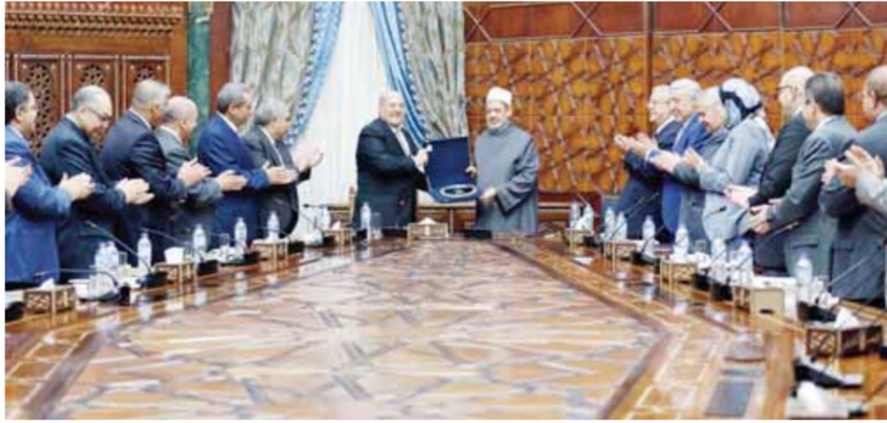
فضيلة الإمام الأكبر أثناء استقباله رئيس المحكمة الدستورية العليا والوفد المرافق له

وأعرب رئيس المحكمة الدستورية العليا عن اعتزازه الكبير لشخص فضيلة الإمام الأكبر، وتقديره وتقدير المحكمة لدور الأزهر الشريف في مواجهة وتفنيد الفكر المتطرف، مبيناً أن فضيلته يمثل قامة ورمزاً إنسانياً في العالم أجمع، خاصة بعد مواقفه تجاه القضايا العالمية والإنسانية المهمة كالسلام والإرهاب، ودعمه القضية الفلسطينية التي سجل فيها الأزهر موقفاً سيطل حياً في