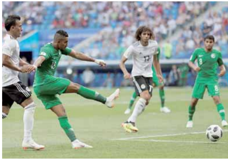
الدوسري يسجل هدف فوز السعودية في شباك الحضري

من عمر اللقاء، ليحقق أول فوز للمنتخب السعودي في المونديال الحالي، وبذلك الفوز يرتقى المنتخب السعودي إلى المركز الثالث في المجموعة الأولى برصيد 3 نقاط، ويتبدل المنتخب المصري المجموع دون نقاط. وتأهل المنتخب الأرجواني على رأس المجموعة محققاً العلامة الكاملة 9 نقاط بعد فوزه في المباراة الأخرى على المنتخب الروسي صاحب الأرض والجمهور بنتيجة 3-0، ويتأهلاً معاً إلى الدور ثمن النهائي. ودخل عصام الحضري، حارس مرمر المنتخب، تاريخ كأس العالم بعدما تصدى لركلة جزاء في مشاركته الأولى مع مصر بالمونديال ويحقق رقماً قياسياً ليكون أكبر لاعب سنّاً مشاركة في ذلك الحدث العالمي.