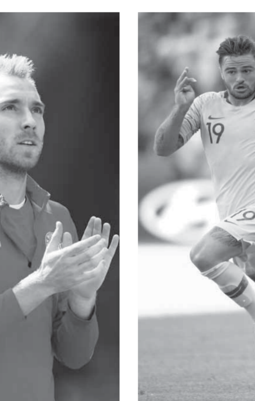
منتخب فرنسا في مواجهة صعبة أمام الدنمارك

في المقابل، يتسلح منتخب أستراليا بأحر أمل من أجل التأهل بالفوز على بيرو أملاً في سقوط الدنمارك والصعود بفارق الأهداف.. ويعتمد المدرب الهولندي بيرت فان مارفيك على تشكيلة تضم الحارس ماثيو رايان وأمامه مارك ميليجان وسانسبري وريسدون وعزيز بيهيتش للدفاع وميلو جيديناك وأرون موى وروجيتش للوسط وماثيو لوكي وروبي كروس وبيريتش للهجوم. ويستمر بيرو بقيادة مديره الفني الأرجنتيني ريكاردو جاريكا لتحقيق أول فوز منذ 40 عاماً بالونديال معتمداً على نجومه باولو جيريرو وفارفان وريباتو تالبا.