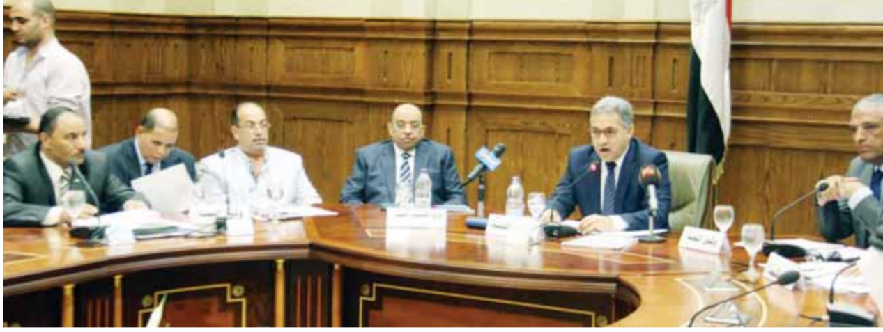
اللواء محمود شعراوي، وزير التنمية المحلية خلال حضوره اجتماع لجنة الإدارة المحلية بمجلس النواب، أمس، برئاسة النائب أحمد السجيني

وعدد «السجيني» الملفات المنتظرة للوزير الجديد ممثلة في تطوير قطاع التفتيش وتنظيم الموارد المالية للإدارات المحلية، وإيضاً الأجرة العمرانية، وتدوير القمامة، وتضمنت أيضاً ملف النقل العام والموافق والسرفيس وتراخيص المحال التجارية وانتظام المركبات بالشوارع وتقسيم الأراضي ومخالفات البناء، قائلًا: 12 ملأً في انتظار الوزير، وعلى رأسها قانون الإدارة المحلية.