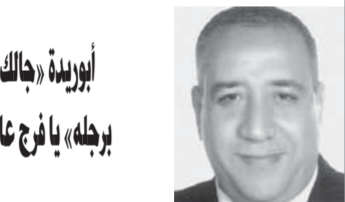
أبورية «جالك» برجله | با فرج عامر

واختتم البيان: يمتد الجزء الأول من المرحلة الرابعة بطول 5.15 كم، ويشتمل على (4) محطات نفقية هي هارون وهليوبوليس وألف مسكن ونادى الشمس ومحطة علوية هي محطة النهضة، وهو الجزء الذى من المقرر افتتاحه في نهاية العام الجارى.