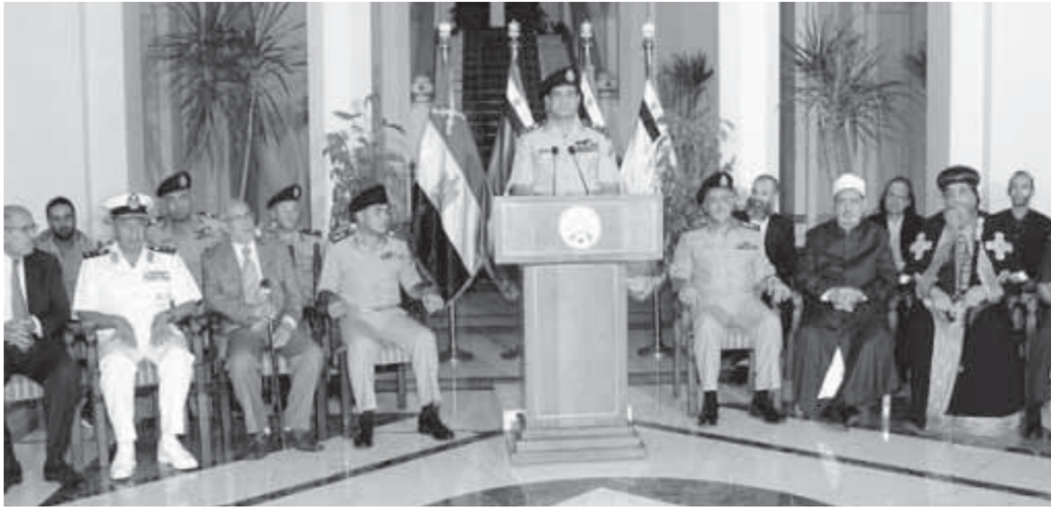
البيان التاريخي لانتقال مصر من الفوضى

ويبقى الملف الأهم وهو القضاء على الإرهاب «الطوفان» الذي تقصده الجماعة وتحاربه الدولة بكل جسارة واستطاعت خلال الفترة الماضية أن تقطع شوطًا ليس بالهين فيه، سنستعرض كافة هذه الإنجازات تباعا لنرى أن مصر لم ولن تهزم مهما ازدادت قلة مارقة.