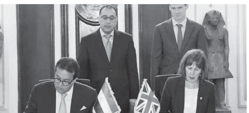
رئيس الوزراء يشهد توقيع مذكرة التعاون

مبادرات الأبحاث الدولية، فضلاً عن تصنيفها ضمن أفضل 1% من الجامعات على مستوى العالم، والتي ترتبط اسمها بتسعة من الحاصلين على جائزة نوبل.