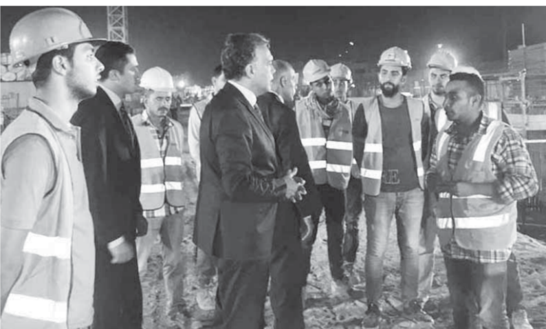
هشام عرفات أثناء تفقده لواقع العمل

وذكرت الوزارة في بيان أمس أن عرفات قام بجولة تفقدية أمس الأول لمتابعة معدلات التنفيذ بالجزء الثاني من المرحلة الرابعة للخط الثالث للمترو (4B)، حيث تقصد الوزير عدداً من محطات المرحلة (هشام بركات - قبا - عمر بن الخطاب - عدلى منصور). وأضاف البيان أن الوزير شدّد خلال لقائه مع العاملين بالمشروع على ضرورة الالتزام بالجدول الزمنى في تنفيذ الأعمال، مؤكداً أهمية تنفيذ مشروعات مترو الأنفاق نظراً للدور المهم لمترو الأنفاق في تخفيف الضغط المرورى على شوارع ومحاور القاهرة كأحد