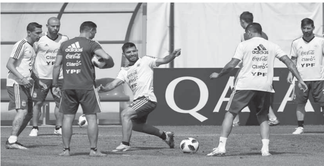
منتخب الأرجنتين يسعى لتخطي عقبة نيجيريا

زملاته من أجل الفوز على أيسلندا وفتح الطريق أمام راقصي التانجو للفوز على نيجيريا والتأهل إلى الدور ثمن النهائي. ويتربع المنتخب الكرواتي على صدارة المجموعة الرابعة بـ 6 نقاط، ويحتل منتخب نيجيريا المركز الثاني بـ 3 نقاط، بينما تقع الأرجنتين وأيسلندا في المركزين الثالث والرابع برصيد نقطة واحدة لكل منهما.