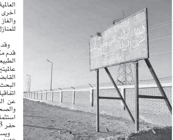
مشروع الضبعة النووي نقلت نوعية لإنتاج الكهرباء