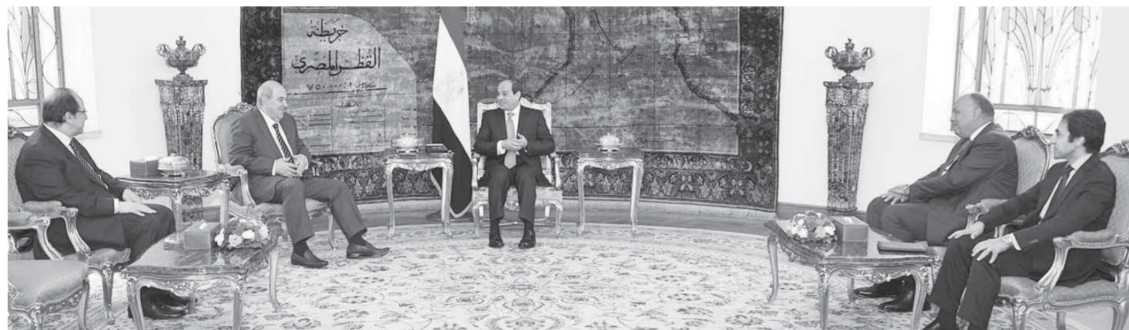
الرئيس عبدالفتاح السيسى أثناء استقباله إيداد علاوى نائب رئيس جمهورية العراق

وذكر السفير بسام راضى أن اللقاء تطرق إلى عدد من مجالات التعاون المشترك وسبل تعزيزها لمصلحة الشعبين الشقيقين، حيث أعرب الجانبان عن تطلعهما لاستمرار التنسيق بين البلدين والعمل على تطوير العلاقات الثنائية بينهما، ولاسيما الاستفادة من الخبرة المصرية في عملية إعادة إعمار المناطق التي تضررت نتيجة الحرب على داعش، وفي تنفيذ عدد من المشروعات المشتركة في مختلف المجالات.