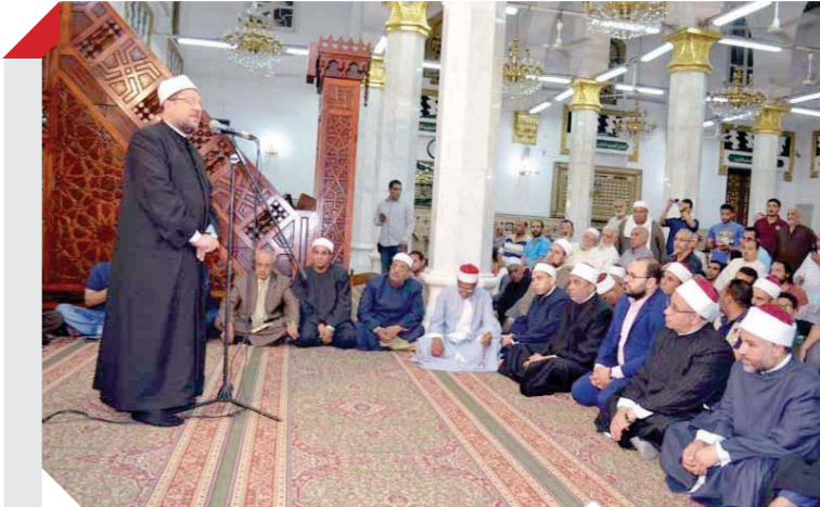
وزير الأوقاف في خطبة عن التطرف والإرهاب