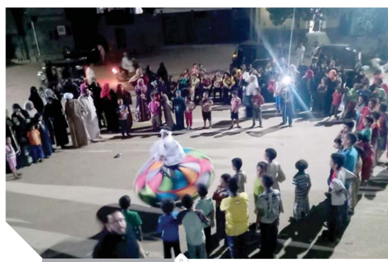
عروض مسرحية بالشارع

٢٢٥٧ قرية داخل ١١٩ مركزاً، وتتعلق العروض على التوالي من محافظة أسوان حيث ستتم بمركزى أسوان ودراو تليها محافظة الأقصر حيث ستتم بمركزى الأقصر وأرمنت، تليها محافظة قنا بمركزى الوقف، وقنا ثم محافظة سوهاج بمركزى جرجا والمنشأة ثم محافظة اسيوط بمركزى اسيوط ومنفلوط يليها محافظة بنى المنيا بمغاغة وبنى مزار يليها محافظة بنى سويف بأهناسيا وبنى ثم محافظة الفيوم بمركزى الفيوم وسنورس ثم محافظة البحيرة بإيتاى البارود وكوم حمادة نهاية بمحافظة الجيزة التى ستقدم بها العروض بمركزى العمرانية والوراق. جدير بالذكر أن برنامج ٢ كفاية يستهدف رفع وعى الأسر المستهدفة بمفهوم الأسرة الصغيرة حيث يستهدف الحد من الزيادة السكانية بين ١.١٤٨.٨٦١ أسرة مستهدفة من برنامج تكافل والارتقاء بالخصائص السكانية لها، ويتم ذلك بالتعاون مع ٩٢ جمعية أهلية وتمويل يصل إلى ١٠٠ مليون جنيه في المحافظات العشر الأكثر فقراً، والأعلى خصوبة، إضافة إلى دوره في تنمية الكوادر البشرية العاملة في مجال تنظيم الأسرة على مستوى نطاق التنفيذ وتنفيذ حملات توعية محلية وقومية مع رفع كفاءة عيادات تنظيم الأسرة التابعة للجمعيات الأهلية لتقديم خدمة متميزة.