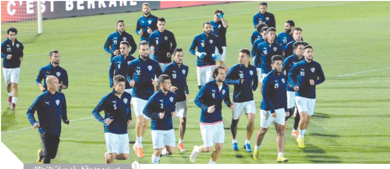
إصرار وجدية في تدريبات الزمالك

الليلة.. ملايين المصريين يدعون للزمالك بالفوز على نهضة بركان «مرتضى» يعد نجوم الفريق الأبيض بمكافآت خيالية