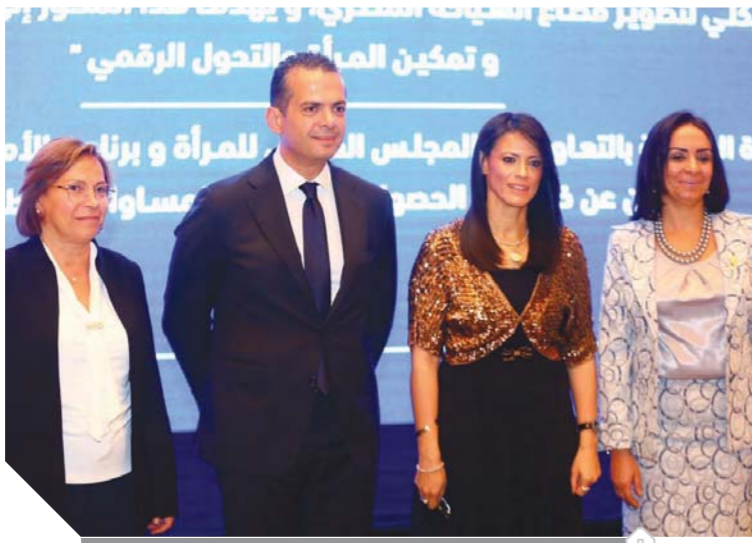
عضو برنامج الأمم المتحدة الإنمائي