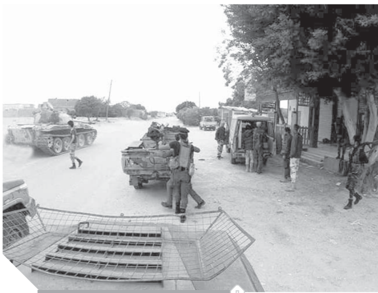
قوات حشتر تسيطر على مداخل طرابلس

وأكد مصدر عسكري لىبى أن سلاح الجو التابع للجيش الليبى شن غارات جوية مكثفة على معسكرات تابعة للمليشيات المسلحة فى منطقة خلّة الفرجان ضواحي العاصمة طرابلس.. ورجّح مصدر عسكري فى كتية