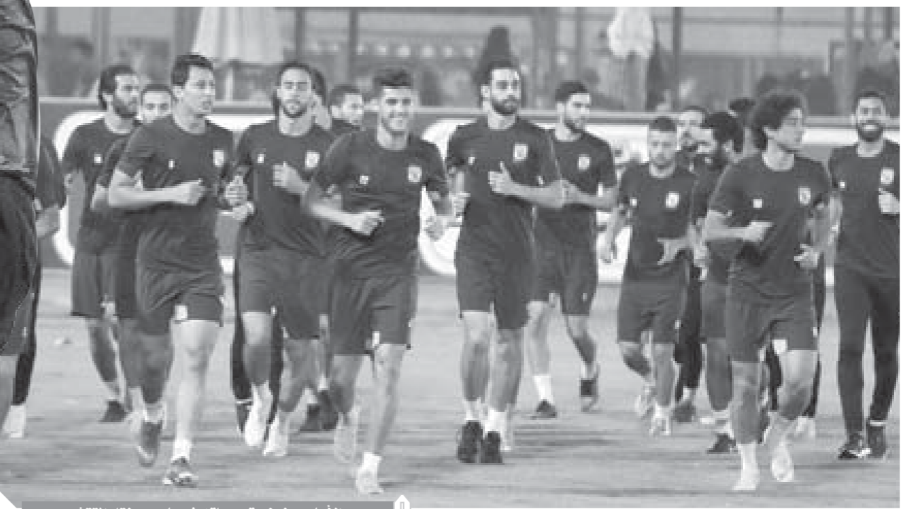
الأهلى يخوض تدريباته فى ملعب مختار التتش