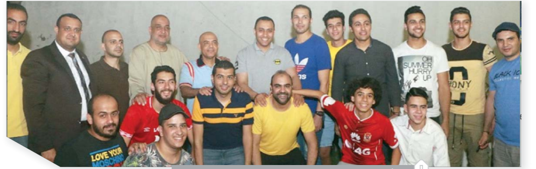
أعضاء لجنة الوفد بالوراق خلال الدورة الرمضانية