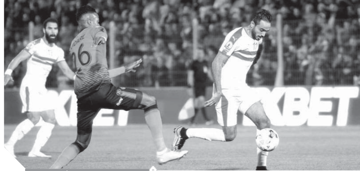
كهرى يقود هجوم الأبيض