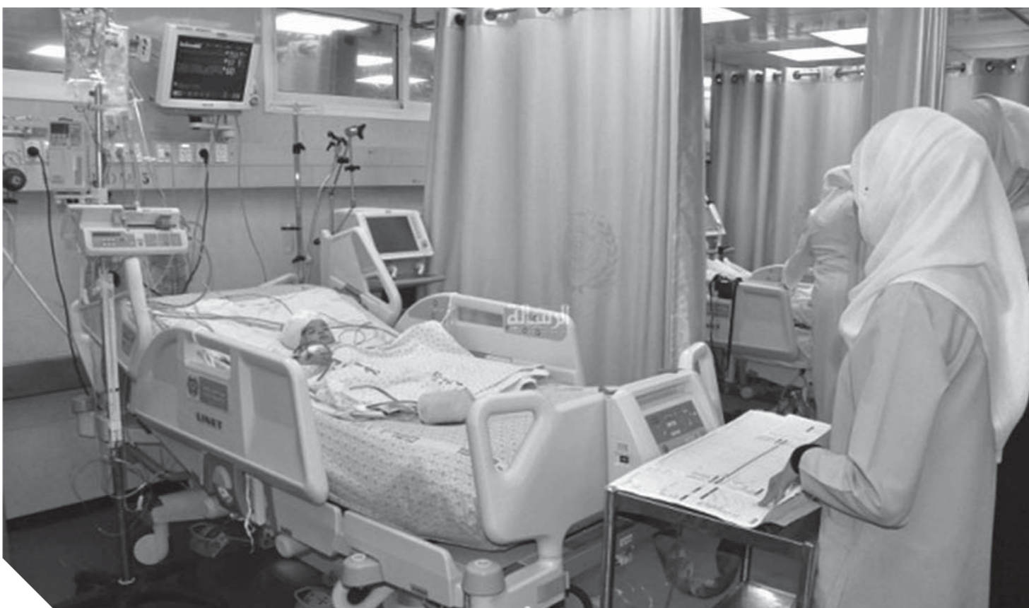
مرمضات داخل إحدى غرف الرعاية المركزة