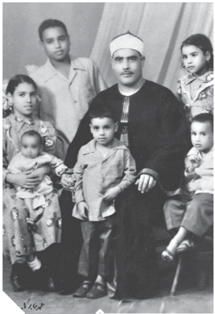
الشيخ الحصري وأولاده