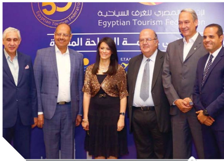
وزيرة السياحة مع أعضاء جمعية مرسى علم

من تجربة مصر. وأعربت رئيس المجلس القومي للمرأة عن أملها في زيادة معدلات تشغيل الإناث في قطاع السياحة، مشيرة إلى أنه قطاع آمن وبه قدر كبير من حماية المرأة ويوجد به مساواة بين الرجل والمرأة، ويوجد به الكثير من الرجال الداعمين والمساندين للمرأة. وتحدثت عن الاستراتيجية الوطنية لتمكين المرأة المصرية ٢٠٣٠ التي أطلقتها الرئيس عام ٢٠١٧، وهي أول استراتيجية على مستوى مصر يقرها رئيس الجمهورية.