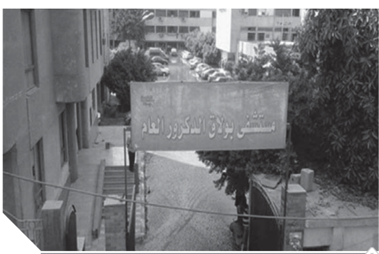
الصالحة المؤدية للعناية المركزة بالمستشفى

لا تزال ميزانية الصحة محل جدل، ففي حين يطالب البعض الوزارة بالتدخل لحل أزمة القطاع، فإن البعض الآخر يرى أن المشكلة لا تكمن في ميزانية القطاع الصحي، بل في سوء التوزيع. حيث لا تتجاوز للصحة لا تقل عن ٣٪ من الناتج القومي الإجمالي، تتصاعد تدريجياً لتتقارب مع الميزانية العالمية، وهو ما لم يحدث خلال المازنة، وهو ما يراه الكثير من الخبراء سبباً في تدني أوضاع الصحة في مصر. وبالنظر إلى موازنة الصحة التي وضعتها الحكومة مؤخراً وتم إقرارها في العام المالي ٢٠١٨-٢٠١٩، ارتفعت لـ ٧٦ مليار جنيه، بزيادة ١٠ مليارات جنيه على العام الماضي، وقسمت الميزانية بواقع ٣١.٦ مليار جنيه للأجور وتعميمات العاملين، و١٢.٤ مليار جنيه لشراء السلع والخدمات، و١٢٠ مليون جنيه كقوائد، و٥.٢٢ مليار جنيه للدعم والمنح والمزايا الاجتماعية، و١.٢٤ مليار جنيه مصروفات أخرى، و١١.١٥ مليار جنيه للاستثمارات.