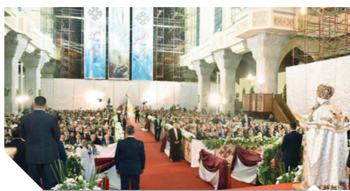
البابا تواضروس خلال عيد القيامة - صورة أرشيفية

عدد من الشخصيات العامة والمسؤولين، وأشار إلى أن الاحتفال يتضمن عظة عن القيامة ويعقد بمقر الطائفة بمصر الجديدة.