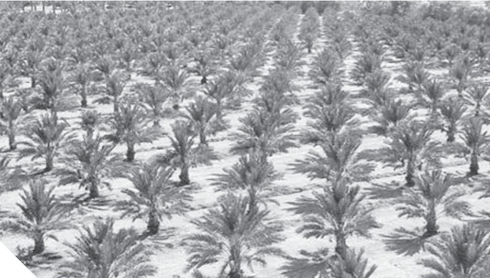
مشروعات زراعية ضخمة تم إطلاقها خلال الفترة الأخيرة

استزراع ٥ آلاف فدان في الحسنة ونخل.. و١٣ تجمعاً تنموياً في بئر العبد ووسط سيناء