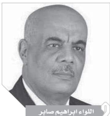
اللواء إبراهيم صابر

يومين من وقوع الجريمة، فألقينا القبض على الأب وبضيق الخناق عليه ومواجهته بشهادة الشهود وما أسفرت عنه التحريات، اعترف بأنه قام بإخفاء لجثته لانتهاز جاره الفنى الجائى الذى تم تشكيله برئاسة اللواء حسين حامد مدير مباحث سوهاج - آنذاك - فى العمل ليل نهار لمدة أسبوعين متتاليين دون التوصل إلى خيوط يكشف لنا تلك الجريمة الغامضة، ولكن غناية الله تعالى شامت الا تضع دماء هذه الطفلة البريئة هدراً ويتم القبض على الجانى لينال عقابه على أيدي العدالة.