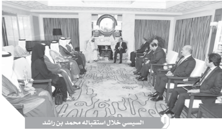
السيسي خلال استقباله محمد بن راشد

كما شهد اللقاء تباحثاً حول مجمل التطورات السياسية في المنطقة، حيث تبادل الجانبان وجهات النظر حول عدد من القضايا والموضوعات الإقليمية ذات الاهتمام المشترك.