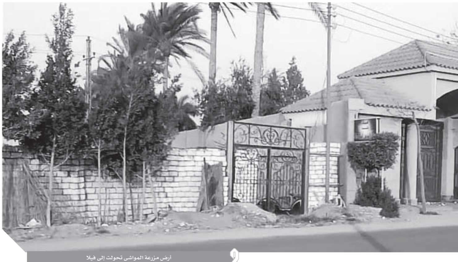
أرض مزرعة المواشى تحولت إلى فيلا

إلى من يهمه أمر المال العام في مصر وهم أكثر ونحن على يقين تام أنهم مشغولون بحماية هذا المال والحفاظ عليه. ما يحدث داخل «زراعة الجيزة» أمر يستوجب وقفة من هؤلاء، حفاظا على الرقعة الزراعية التي تتآكل يوماً بعد الآخر. إننا ننشد بل ونتوسل إلى المهندس عز الدين أبوستيت، وزير الزراعة واستصلاح الأراضي واللواء أحمد راشد محافظ الجيزة، مراقبة ومتابعة ما يحدث داخل مديرية الزراعة بالمحافظة لإنقاذ الرقعة الزراعية.