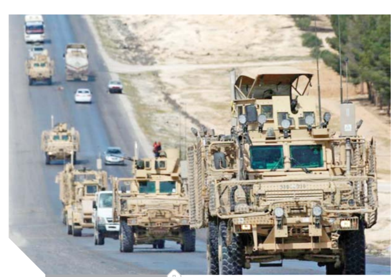
قوات أمريكية في سوريا

ونقلت عن مسئول أمريكي قوله إن ما يقارب النصف من الدول التي تلقت طلب واشنطن، أكدت رفضها الصريح، أما العواصم الأخرى المتبقية فوافقت على تقديم دعم محدود. ويعتزم الجيش الأمريكي سحب قواته من سوريا بشكل كامل بعد اندحار تنظيم داعش، في مارس الماضي، لكن رفض الحلفاء إرسال قوات إلى سوريا، يضع عدة عراقيل أمام مهمة «البنجاحين»، وتريد الولايات المتحدة أن تبرز عدة نقاط من خلال هذه