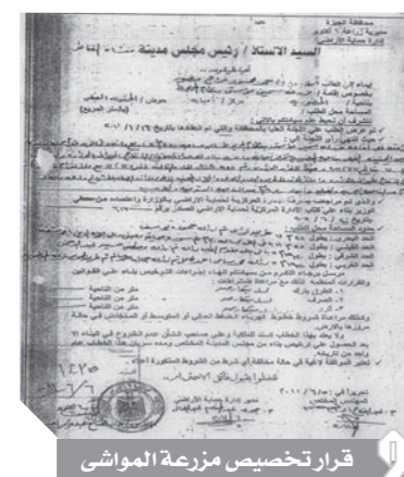
قرار تخصيص مزرعة المواشى