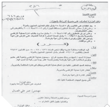
استبعاد مسئول حماية الاراضي