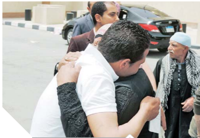
أم تستقبل ابنها بعد الإفراج عنه