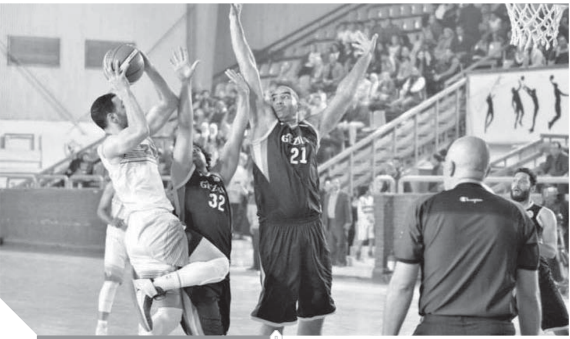
دور دوري السلة حار بين الزمالك والجزيرة