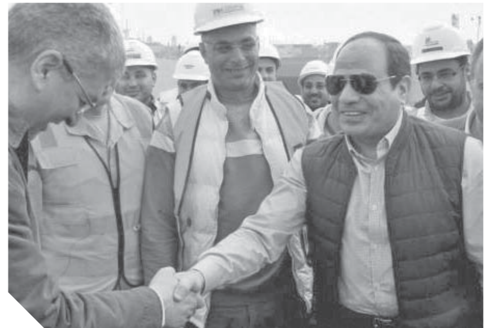
الرئيس السيسي خلال إحدى جولاته بأرض الفيروز صورة أرشيفية

أخرى بسبب إقبال كثير من السائحين، وأضاف نقيب المرشدين السابق، سيناء أهم منطقة سياحية في مصر وجنوب سيناء يوجد بها تنمية شاملة وكان نصيب الأسد بسياحة سيناء في الفترة الأخيرة، وأصبحت شرم الشيخ ملتقى لمعظم المؤتمرات والندوات العالمية وآخرها مؤتمر التنوع البيولوجي العالمي وأيضاً منتديات الشباب العالمي، وهي ما يعرف بسياحة المؤتمرات التي أسهمت بشكل كبير في إعادة الحياة السياحية لمدين سيناء وهذا يؤكد سعى الحكومة للتطوير وتنمية سيناء بشكل فعلى وعلى أرض الواقع.