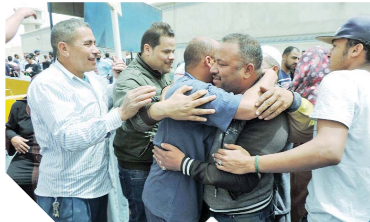
لحظة الإفراج عن بعض السجناء