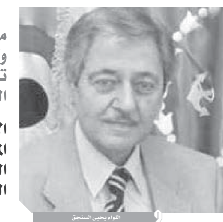
اللواء يحيى السنجق

معدتهم أمام التحديات، وأوضح اللواء السنجق أنه لم يكن أحد يتوقع أن تقوم مصر من تكسها، ولكن بعد النكسة بأيام بدأت القوات المسلحة في تنفيذ عملياتها الانتقامية، ودخلنا أيضاً في حرب الاستنزاف ضد العدو، ونصبنا كماناً ضد طائراته الحديثة من طراز الفانتوم، والميراج، من خلال المواقع التبادلية، كنا نضرب الطائرات الإسرائيلية بصواريخ الدفاع الجوي فجأة، ونسقط الطائرات ثم ننسحب منه بسرعة إلى موقع تبادلي آخر، وعندما كانت تأتي