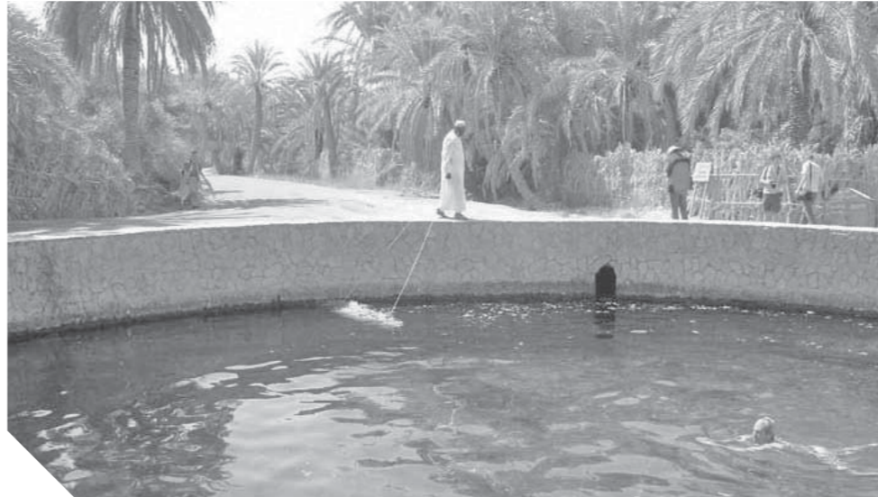
الدولة تتبني خططاً تنموية لإحداث طفرة بسيناء

لأنها سيناء.. أرض الأتنياء.. أرض القمر.. الأرض المقدسة التي تجلى عليها وجه الله تعالى.. ولأنها الأرض التي ضحى آلاف المصريين بأرواحهم من أجل أن تظل دائماً في حضن الوطن.. لأنها كل ذلك، كان لها نصيب كبير من اهتمام المصريين شعباً وحكومة.. فهي دائماً مقصد تهفو إليها قلوب ملايين المصريين طلباً للراحة والسياحة والمتعة والجمال.