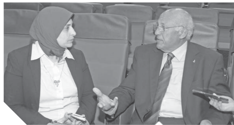
لواء أحمد محمد صادق في حديثه للوفد

وقامت وحدات بث الأنغام البحرية بإغلاق مدخل خليج السويس، كما هاجمت الضفادع البشرية منطقة بلاعيم ودمرت حفاراً ضخماً، فيما تم قصف منطقة رأس سدر على خليج السويس بالصواريخ، لتصاب عمليات شحن البترول في خليج السويس إلى ميناء إيلات بالتشل التام، حيث كان الهدف الاستراتيجي للقوات البحرية هو حرمان إسرائيل وقواتها المسلحة من البترول المسلوب من الأبار