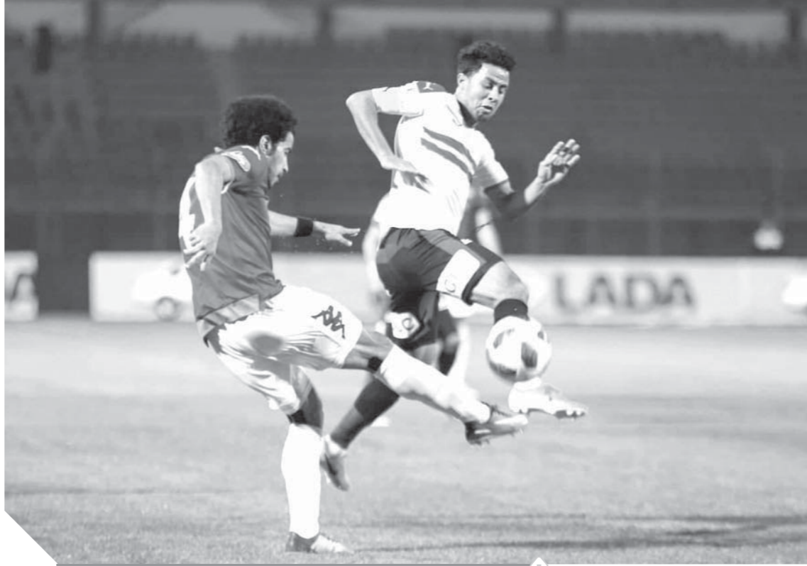
الهزيمة من بيراميدز أحبطت جماهير الزمالك

أتمنى ألا ينظر محمد صلاح نجم منتخب مصر لبعض المحاولات لزخ الخلافات بينه وبين قائد ليفربول الإنجليزي جيمس ميلنر ويفكر في رجوعه لمستواه الفني من أجل العمل مع منتخب مصر خلال الفترة القادمة للفوز ببطولة كأس الامم الأفريقية لأن الجميع يضع على عاتق أبو مكة أمالا كبيرة في الفوز بالبطولة بعد فترة غياب دامت تسع سنوات. لم يتحرك أحد بعد منع الصحفيين من حضور قذوة أمام أفريقيا والكتف بأدخال صحفي واحد فقط من كل مؤسسة بعد «التحليل» على مسؤولي الاتحاد الأفريقي لدخول الصحفيين مصر.. وبعد مباراة بيراميدز والزمالك تم الاعتداء على مصور صحفي وسحله في الملعب أمام الجميع من عامل غرفة ملابس الزمالك وبعض اللاعبين.. فإلى متى تستمر إهانة الصحفيين؟