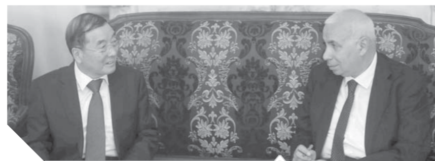
السفير الصيني خلال حديثه للزميل على حسن

٦٣ عاماً الماضية منذ إقامة العلاقات الدبلوماسية بين مصر والصين وعلى الرغم من أن البلدين متباينين جغرافياً عن بعضهما البعض، إلا أنهما كانا دائماً يتقومان بعضهما البعض، ويتق و يدعم كل منهما الآخر. وأضاف السفير الصيني أنه خلال الزيارة الأولى التي قام بها الرئيس السيسي إلى الصين في عام ٢٠١٤، تمت ترقيته العلاقات الصينية المصرية إلى شراكة استراتيجية شاملة، وأصبحت الصداقة والتعاون بين الصين ومصر نموذجاً للتعاون المخلص بين الصين وإفريقيا.