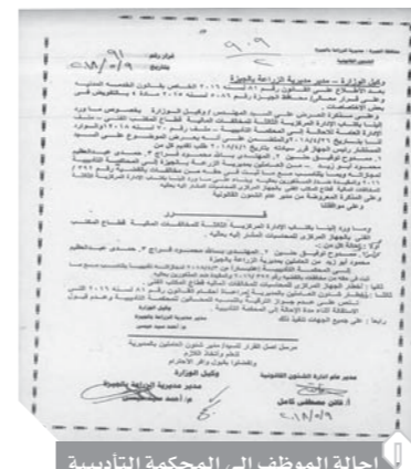
إحالة الموظف إلى المحكمة التأديبية

هذه الأحياء المقام عليها المدارس الخاصة بكفر حكيم مركز كرداسة، خاصة أن هناك مدرسة تقع على مساحة فدان، وتعمل منذ ثلاث سنوات بترخيص تشغيل من وزارة التربية والتعليم. وجاءت المدرسة الثانية والمقامة على مساحة ٢ فدان بكفر حكيم وتتكون من