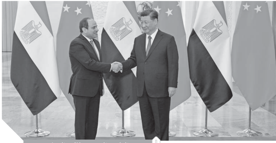
الرئيس «السيسي» وتظهره الصيني