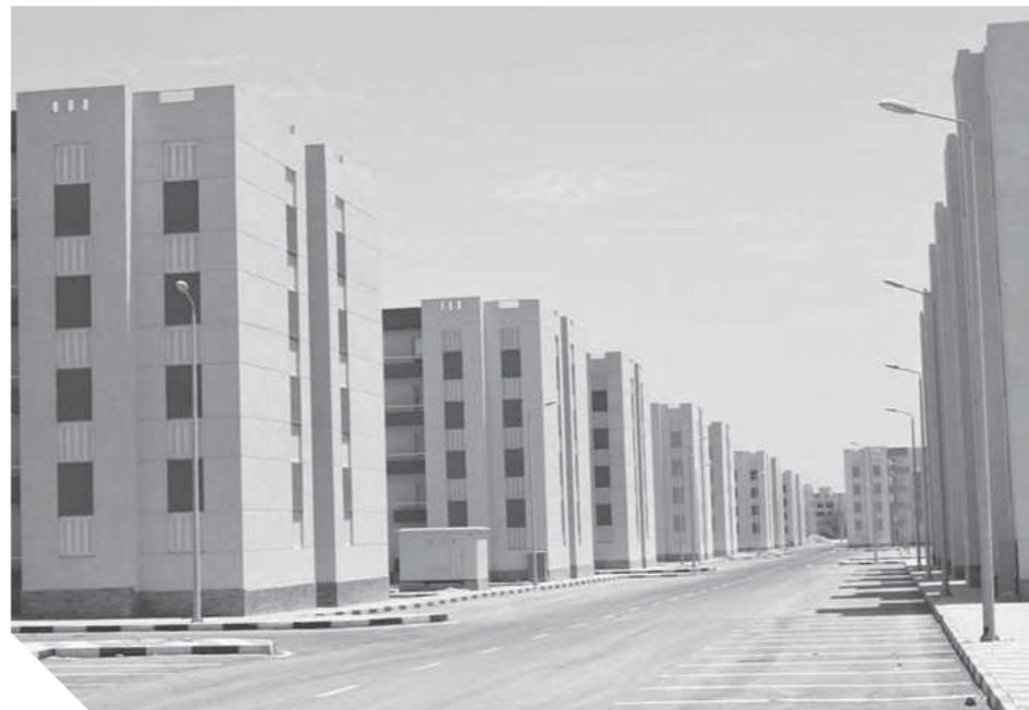
طفرة كبيرة في مشروعات الإسكان تشهدها سيناء

رئيس لجنة السياحة بالبرلمان: ٢٥٪ من زوار مصر يقصدون سيناء