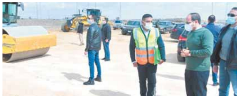
كتب - حمادة بكر:

يناقش مجلس الشيوخ برئاسة المستشار عبدالوهاب عبدالرازق خلال الجلسة العامة غدا الأحد نصوص مشروع القانون المقدم من الحكومة بشأن إصدار قانون التأمين الموحد. وتأتى النصوص التشريعية الجديدة، بغية إيجاد تنظيم قانونى متخصص محض، ومشجع لنشاط التأمين الطبى الاختيارى لأول مرة فى سوق التأمين المصرى، وبما يسمح بإنشاء شركات تأمين متخصصة لهذا النوع من التأمين، بشروط ميسرة عن مثيلتها من شركات التأمين التى تزاو