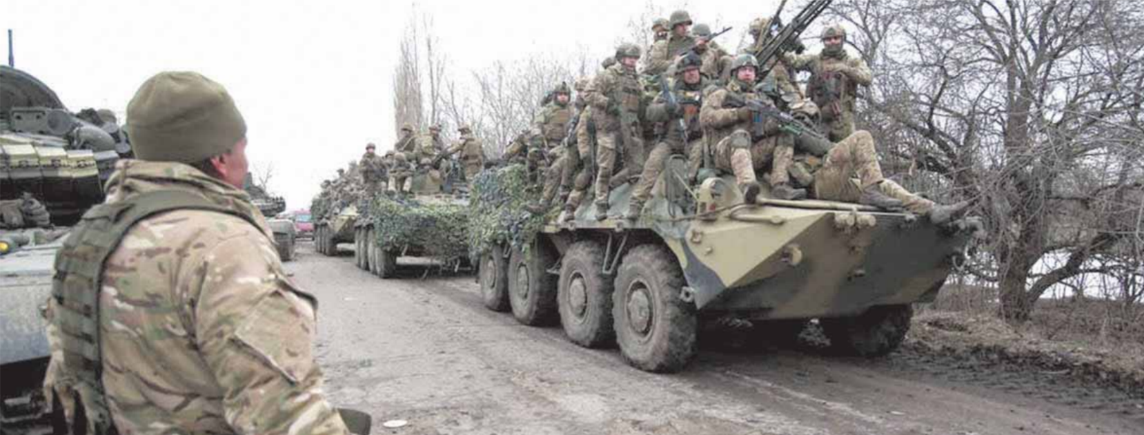
حشود الجنود الأوكرانيين في انتظار القوات الروسية على مشارف «كيف»

أسرع وقت ممكن». ووفقا لها، فإن الهدف الآن شرق أوكرانيا. وأعلن الرئيس الروسي فلاديمير بوتين بدء عملية عسكرية في إقليم دونباس شرق أوكرانيا، والذي اعترفت روسيا باستقلاله قبل يومين وأبرمت مع قاده اتفاقية صداقة، بالتزامن مع بدء التحرك البري العسكري في مدن الأوكرانية خلال الساعات القليلة الماضية. وقال بوتين أن بلاده لا توى احتلال أوكرانيا وإنما حماية إقليم دونباس الذي يضم جمهوريتي دونيتسك ولوجانسك، محذرا من أي تدخل خارجي في أوكرانيا ودعا في الوقت نفسه الجيش الأوكراني لإلقاء السلاح.