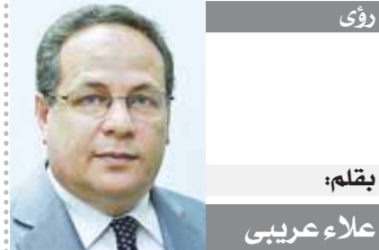
بقلم: علاء عربي

إعلان بوتين به الهجوم على أوكرانيا. وبدأ المبعوث الروسي الجلسة بقرعة نصن تم إرساله إلى هاتمه من الكرملين بيرر الهجوم، وأصر على أنه لا يوجد غزو، وقال إن عملية عسكرية خاصة يتم تنفيذها في دونباس. ويجري التفاوض خلف الكواليس على تحرك من مجلس الأمن لإدانة روسيا ومطالبها بالانسحاب غير المشروط، وسيتم مناقشته على الأرجح الجمعة، إلا أن روسيا كعمضو دائم على المجلس سيستخدم حق النقض. وقال السفير الأوكراني لدى الأمم المتحدة سيرجي كيسيليتشيف قال في اجتماع الأربعاء أن المادة ٤ من ميثاق الأمم المتحدة تص على