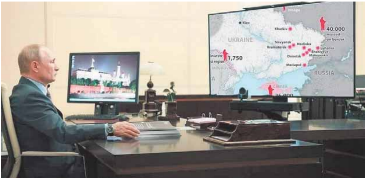
«بوتين، يدرس الحرب الأوكرانية تقنياً»

الاقتصاد الروسي تكاليف باهظة، على الفور وعلى المدى البعيد في آن واحد. كما فرض الاتحاد الأوروبي عقوبات على العديد من المسؤولين الروس رفيعي المستوى، بينهم وزير الدفاع سيرغي شويغو، ورئيس مكتب بوتين أنطون فابنوف ونائب رئيس الوزراء مارات خوسنوفين ويوريفيتش غريغورينكو ووزير الاقتصاد والتنمية ماكسيم فينوشينيتش.