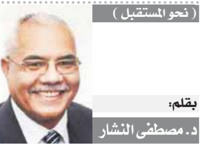
بقلم: د. مصطفى النشار

قرر الاتحاد الأوروبي لكرة القدم «يويفا»، أمس الجمعة، نقل المباراة النهائية لدوري أبطال أوروبا هذا الموسم إلى العاصمة الفرنسية باريس.