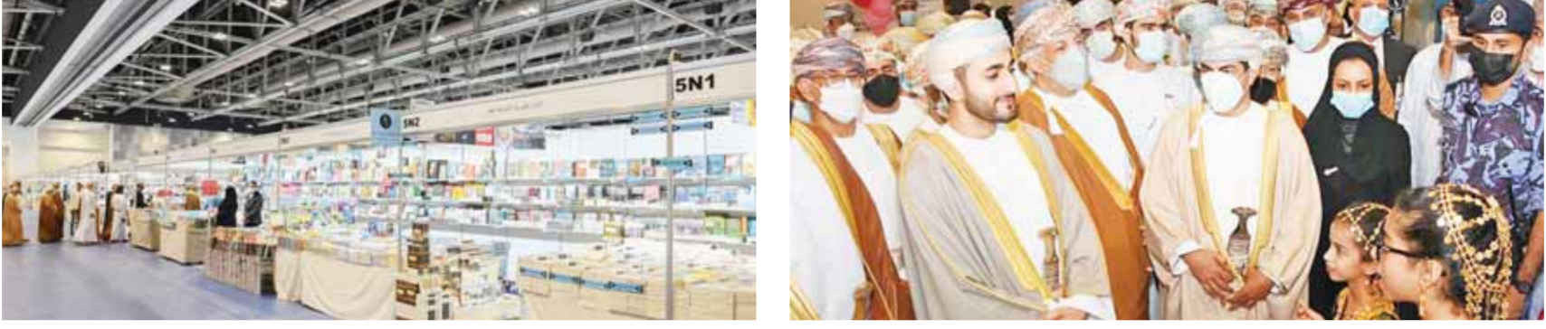
دي زين بن هيثم آل سعيد خلال افتتاح معرض مسقط الدولي للكتاب

عمان تعيش حالة ثقافية مبهجة.. والسمة المميزة تعاون وتكامل الأجهزة المعنية بالسلطنة