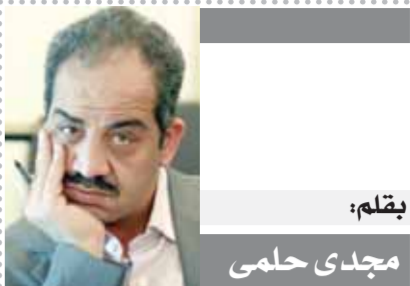
بقلم: مجدى حلمي

ودخلت قوات برية روسية في ماريبول وأوديسا، وشب حريق كبير في منطقة ميكولاى إثر سقوط صاروخ على مستودع للصواريخ والمعدات المدفعية شرقى أوكرانيا.