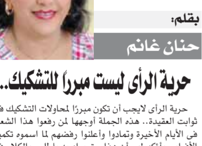
بقلم: حنان خانم

إن هذه الرؤى التصورية الشاملة والملمة للدكتور هويدى من « البيان » القرآنى صلح أساسا ما نشتدنا الآن ونندعو إليه من تجديد الخطاب والفكر الدينى فهل هناك من يقرا ويتامل ؟ رحم الله د. هويدى وعظم الله أجره د.عبد الحميد المذكور الذى أخرج هذا العمل إلى النور.. malnashar@hotmail.com