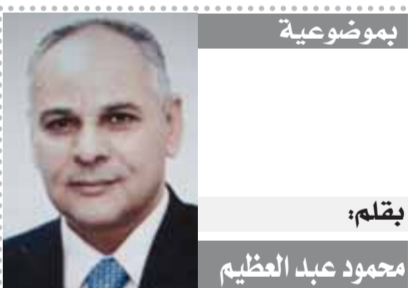
بقلم: محمود عبد العظيم

سيعود سؤال مهم أين سيكون العرب من نتائج هذه الحرب؟ هل ستعود للعمل الجماعي أم ستظل كل دولة تبحث عن مصالحها دون النظر إلى مصالح الدول العربية الأخرى وبالتالي تستمر حالة التشرذم التي نعيشها وكانت النتيجة حرب أهلية في دول عربية ودولة مازالت تحت الاحتلال.