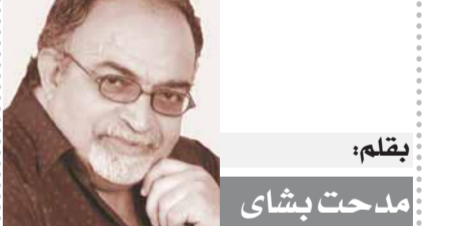
بقلم: د. مدحت بشاي