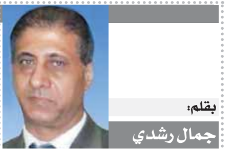
بقلم: جمال رشدي