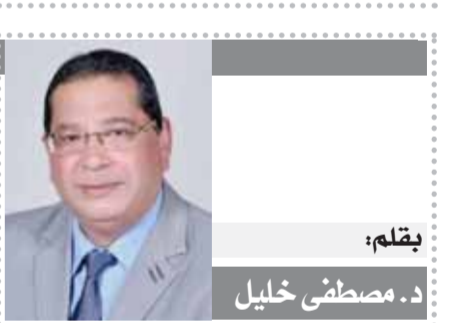
بقلم: د. مصطفى خليل

وهذا سؤال منطقي يطرح نفسه، ماذا عن الصين والهند الذين يشكلان ما يقرب من ٦٠٪ من سكان العالم، وكيف يتم دمجهم بتلك العقائد المتنوعة داخل الحكومة الموحدة بكل مشتقاتها؟ الإجابة في مبرط حضان الأحداث الجارية حاليا، الحكومة الموحدة الصهيونية تريد ديكتاتورية قرار، وهذا منظور يتوق من ثقافة العرب الصهيونية المسيحية، وبما ان الصين قادمة لا محالة تحكم العالم فهذا التخطيط الصهيوني الذي يستفز من سيطرة الغرب المسيحي بعد تدميرها ان السببية الضمنية الصهيونية المتوافقة تماما مع ما تريد من وحدة قرار شامل حاكم، وهذا ما يتفق مع الأهداف الاستراتيجية الهندية التي لا تعارض ولن تعيق البداية الأمريكية الجديدة.