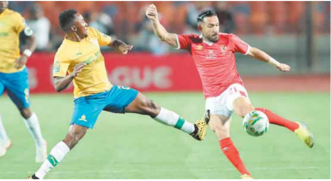
الأهل يواجيه صن داونز الليلة بروح عالية

والهدف من هذا البحث هو الكشف عن الطاقة الشمسية في مصر القديمة، حيث تم اكتشافها في مدينة نينون السويسرية عن مواجهة برشلونة أمام جالطة سراي، وإشبيلية في مواجهة وست هام.