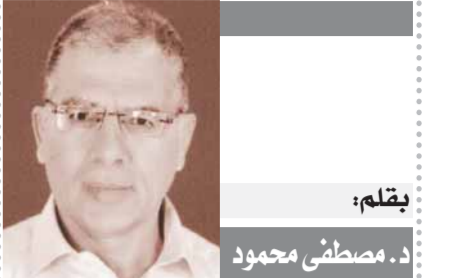
بقلم: د. مصطفى محمود