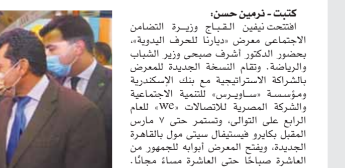
كتبت - نرمين حسن:

افتتحت نيفين القباج وزيرة التضامن الاجتماعى معرض «ديارنا للحرف اليدوية»، بحضور الدكتور أشرف صبحى وزير الشباب والرياضة، وتقام النسخة الجديدة للمعرض بالشراكة الاستراتيجية مع بنك الإسكندرية ومؤسسة «ساويرس» للتنمية الاجتماعية والشركة المصرية للاتصالات «WC» للعام الرابع على التوالى، وتستمر حتى ٧ مارس المقبل بكابرو فيستيفال سيتى مول بالقاهرة الجديدة، ويفتح المعرض أبوابه للجمهور من العاشرة صباحاً حتى العاشرة مساءً مجاناً. وتهدف النسخة الحالية من معرض «ديارنا للحرف اليدوية» شعار «مصر بتكلم حرفى»، حيث تقام على مساحة أكثر من ٣٥٠٠ متر مربع، ويوسط إجراءات احترازية مشددة. وتحتفل الدورة الجديدة بالثقافة والفنون النوبية الفريدة كصناعات الحرف، بالإضافة إلى مشاركة عدد من الجمعيات الصديقة للبيئة، وذلك فى إطار استعداد مصر لتنظيم مؤتمر اليقطين المناخى بشرم الشيخ.