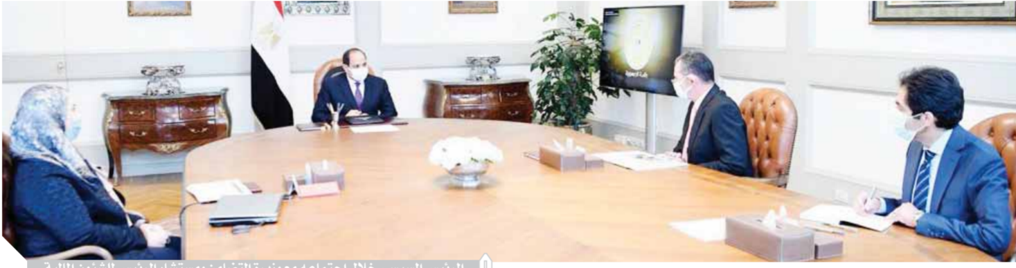
الرئيس السيسي خلال اجتماعه مع وزيرة التضامن ومستشار الرئيس للشئون المالية

الحماية الاجتماعية الشاملة، موجهاً سيادته بتكثيف تلك الجهود والأنشطة المتكاملة والتمكين الاقتصادي لفئة الريفيات المصري لتوفير المزيد من مقومات النجاح، تلك البرامج الاجتماعية من خلال مختلف الأجهزة الحكومية التنفيذية المخضلة لها الانتشار الفعلي على أرض الواقع في الريفيات المصري خلال الفترة القادمة، وهو الأمر الذي يمثل إضافة ويعظم من النتائج.