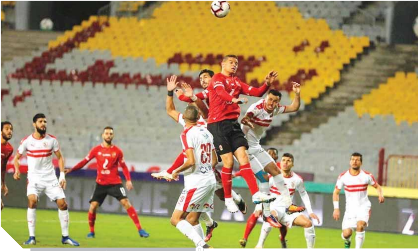
الأهلي والزمالك يلتقيان معا في الدوري خلال شهر رمضان

يذكر أن الزمالك بتصدر قمة ترتيب الدوري الممتاز حالياً برصيد ٢٩ نقطة بعدما لعب ١٢ مباراة، بينما يحتل الأهلي المركز الثالث برصيد ٢١ نقطة بفارق ٨ نقاط عن الزمالك بعدما لعب ٩ مباريات فقط.