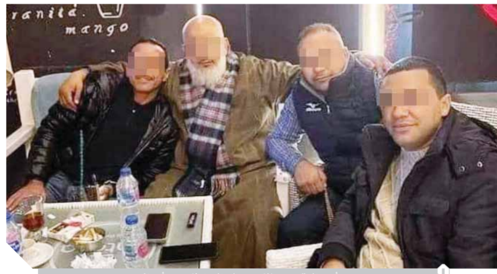
أحد المتهمين بالنصب على المواطنين مع أوائمه

تم تقديمها للمحاكمة بعد أن أقر جميع الشهود والضحايا أنها كانت تحصل على الأموال، ولكن الشخص الآخر النصاب أنكز معرفته بها، ورغم ذلك لم تعد لنا أماناً حتى الآن.