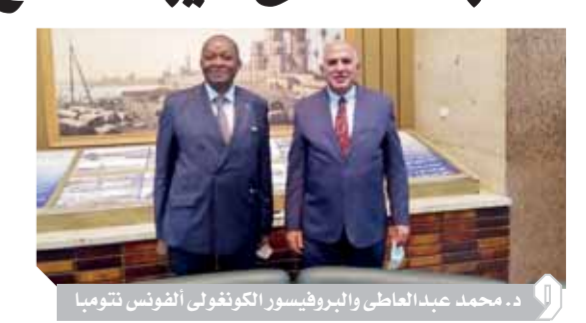
د. محمد عبدالعاطى والبروفيسور الكونغولى ألفونس تومبا

كتب - نغم هلال: استقبل الدكتور محمد عبدالعاطى وزير الموارد المائية والرى، البروفيسور ألفونس تومبا منسق خلية العمل المعنية بالرئاسة الكونغولية للاتحاد الأفريقى والوفد المرافق له الذى يقوم بزيارة القاهرة حالياً للتعرف على آخر التطورات الخاصة بملف سد النهضة الإثيوبى، فى ضوء رعاية الاتحاد الأفريقى لمسار المفاوضات الحالية. وأعرب الدكتور عبدالعاطى عن تقديره للمساعي الكونغولية للدفع بمسار مفاوضات سد النهضة الإثيوبى، موضحاً أنه استعرض خلال الاجتماع الموقف الراهن إزاء المفاوضات، ورغبة مصر الواضحة فى استكمالها، مع التأكيد على ثوابت مصر فى