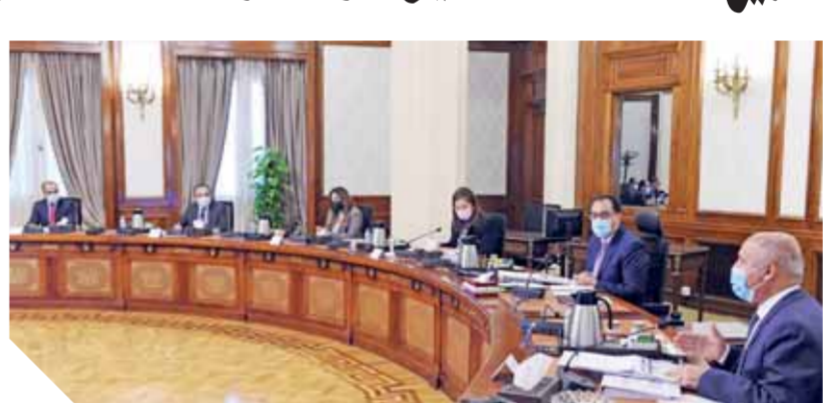
وزير النقل يعرض المشروعات الاستثمارية خلال اجتماع الحكومة

الأنفاق، بطول ١٩ كم، وعدد ١٧ محطة، ومشروع تحديث وتطوير خطى مترو الأنفاق الأول والثانى. وعرض وزير النقل أيضاً أهم التكاليفات الرئيسية بالمشروعات المطلوب استكمال تنفيذها خلال مشروع الخطة الاستثمارية للعام المالى ٢٠٢١-٢٠٢٢، وأبرزها استكمال المشروع القومي للطرق، وتطوير الطريق الدائرى حول القاهرة الكبرى، وتطوير شبكة الطرق بالدلتا محاور طولية وعرضية، وإنشاء كبارى خرسانية على المحاور المائية بديلة للمعديات.