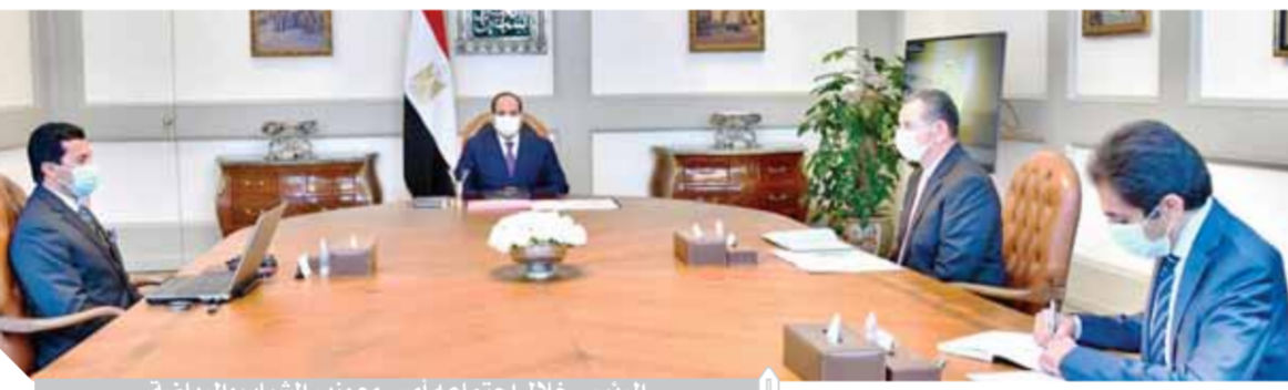
الرئيس خلال اجتماعه مع وزير الشباب والرياضة

المدينة الرياضية في مدينة سلام مصر بشرق بورسعيد، والتي تتضمن إنشاء أساتذ حديث وعدد متوع من المنشآت الرياضية والترفيهية وفق أحدث نماذج التطوير لتعليم الأمل لتلك المنشآت، بالإضافة إلى سير العمل بكل من مدينة مصر الدولية للألعاب الأولمبية ومدينة الجيول العالمية «مرايط» في العاصمة الإدارية الجديدة، والذين سيمتلان معاً صرحاً رياضياً متكامل الأركان والخدمات وفق أعلى المواصفات العالمية. وقد وجه الرئيس بأن يتم إنشاء وتطوير منشآت ومرافق البنية الأساسية للمنظومة الرياضية في مصر وفق نهج شامل يتكامل مع المشروعات التنموية الضخمة التي تقيها الدولة، مما يهّل مصر لامتلاك القدرات اللازمة لاستضافة كبرى البطولات العالمية في مختلف الألعاب.