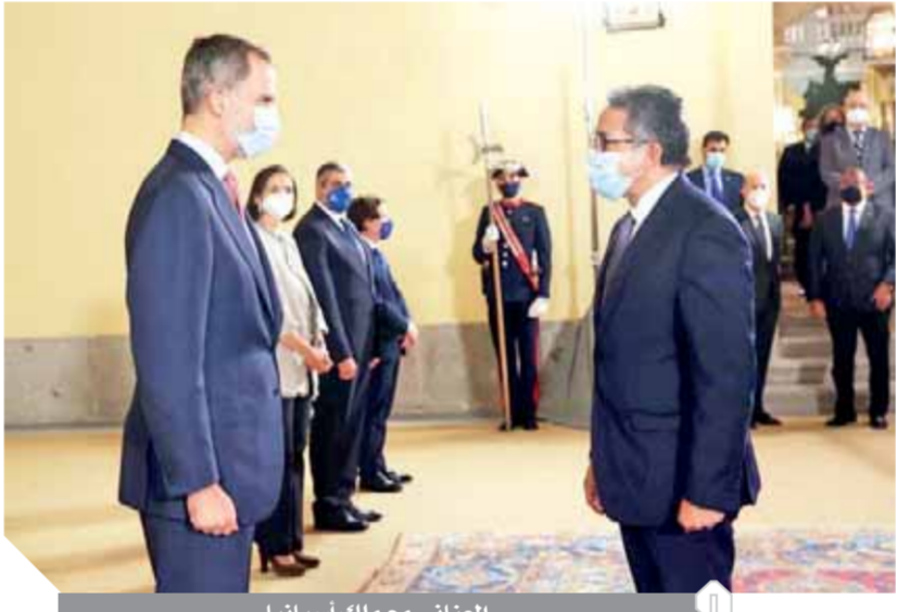
العنانى مع ملك إسبانيا

منظمة السياحة العالمية: ثقة السائح لن تعود إلا بتوفير لقاحات «كورونا» ضرورة تكاتف جهود الدول لتوفير لقاحات آمنة