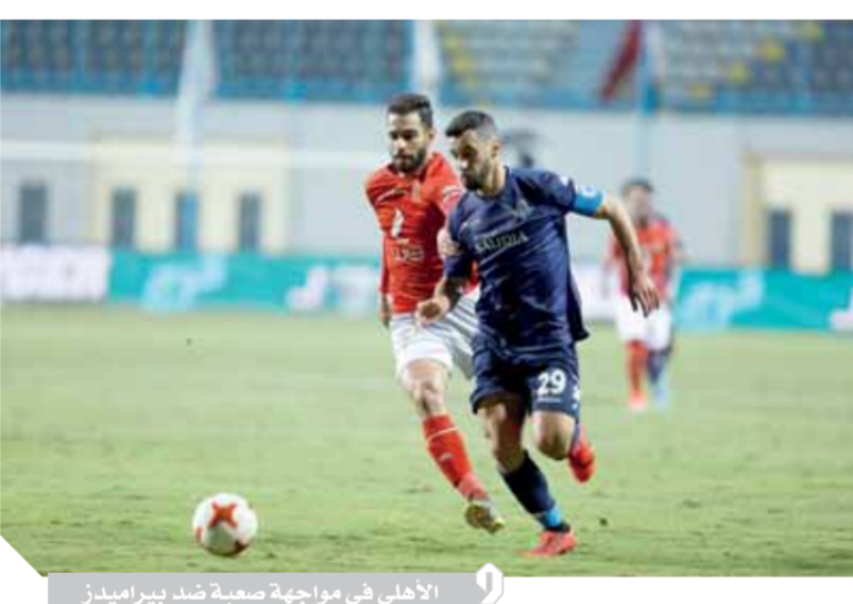
الأهلى فى مواجهة صعبة ضد بييراميدز