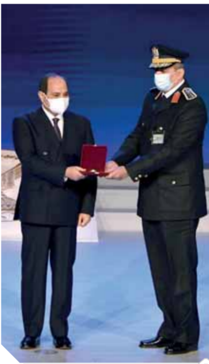
السيسي خلال تكريمه عدد من رجال الشرطة

وتابع: نتعامل مع واقع غير منظم، إنا ننشغل على فري غير منظمة بالإضافة إلى نمو توابها.. وأوزين نعمل شغل مخطط وهيبتي فيه كثير من الجهد والتحدى، مؤكداً: نحن جادين في أن ننهى هذا الأمر تماماً من مصر فكرة أن هناك ريف يعاني أهله.. وسترون إن شاء الله هذا الأمر وإحنا نبحث كل مرحلة وإحنا نخلصها. واختتم السيسي بالقول: وتحمية للشعب المصري العظيم الذي يعي قيمة الأمن والأمان والاستقرار ويحافظ عليها ويقدّر لرجال الشرطة مجهوداتهم المخلصه في خدمة هذا الوطن.. حفظ الله بكم مصرنا العزيزة الغالية لتظل لنا دائماً.. وطناً آمناً مطمئناً ومنازلة للخير والنماء والتقدم.. كل عام وأنتم بخير.. ومصر العزيزة الغالية في تقدم وازدهار.. ودائماً وأبداً.