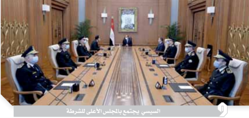
السيسي يجتمع بالجلس الأعلى للشرطة