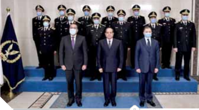
الرئيس مع المجلس الأعلى للشرطة