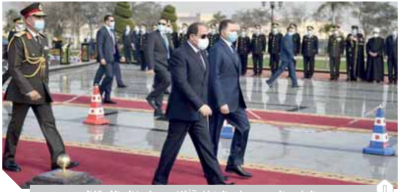
الرئيس السيسي ووزير الداخلية أثناء وصولهما إلى الاحتفال

برصيد من الثقة فيما أنجزوه من انحصار للإرهاب وشل حركة فلول عناصره وبالرغم من النجاحات المحققة التي انعكست على فرض الأمن والاستقرار بالبلاد إلا أن الوزارة تعى أهمية استمرار اليقظة الأمنية، ورسد تحركات التخطيطات الإرهابية التي تعتمد على استغلال محيط إقليمي يشهد حالة من التوتر والعنف، وتتطلع منه لزراعة استقرار دول قارتنا الإفريقية، وفي هذا تكامل الجهود الأمنية لمواجهة المحاولات اليائسة التي تديرها رؤوس جماعة الإخوان الإرهابية بالخارج لليل من مصر وشعبها عبر ترويق الشائعات وتحريف الحقائق وخنق الشباب وتحريضهم على تدمير مقدرات ووطنهم.