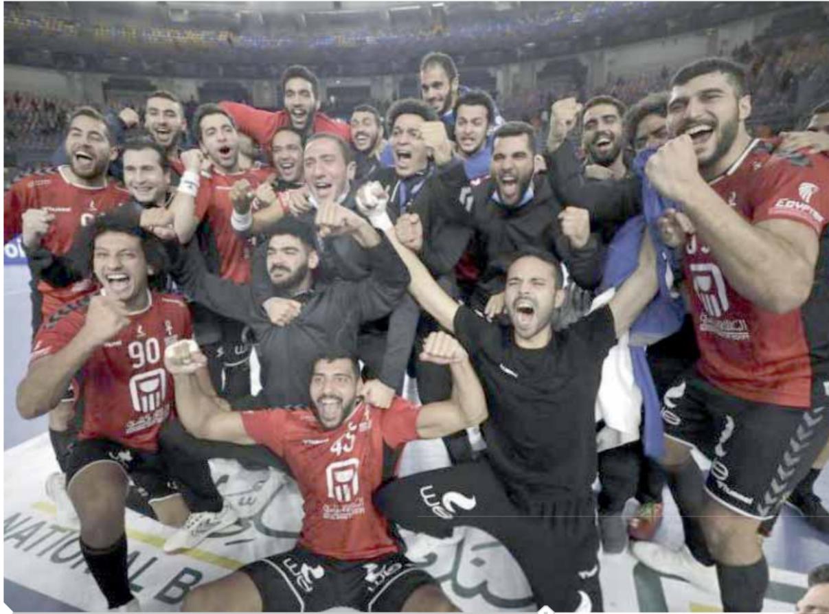
احتفال نجوم اليد بالتأهل لربع النهائى