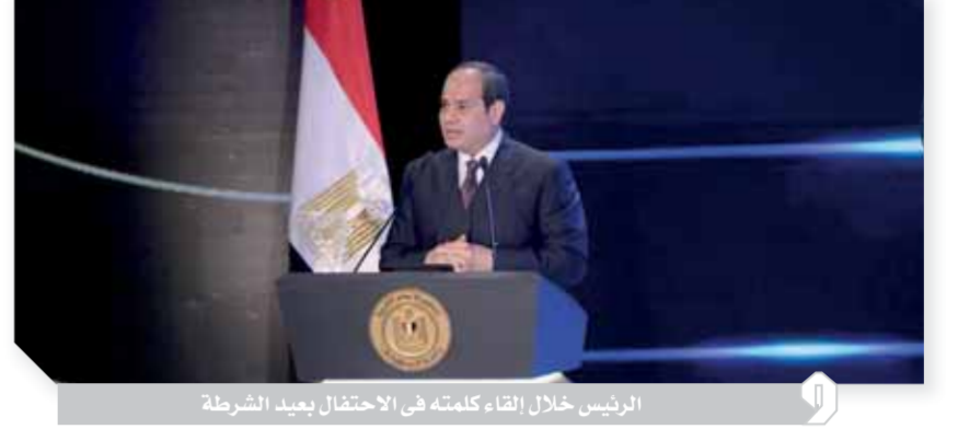
الرئيس خلال إلقاء كلمته في الاحتفال بعيد الشرطة