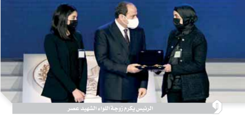
الرئيس يكرم زوجة اللواء الشهيد عصر

تضحيات رجال الشرطة والقوات المسلحة وراء الوضع المستقر لمصر