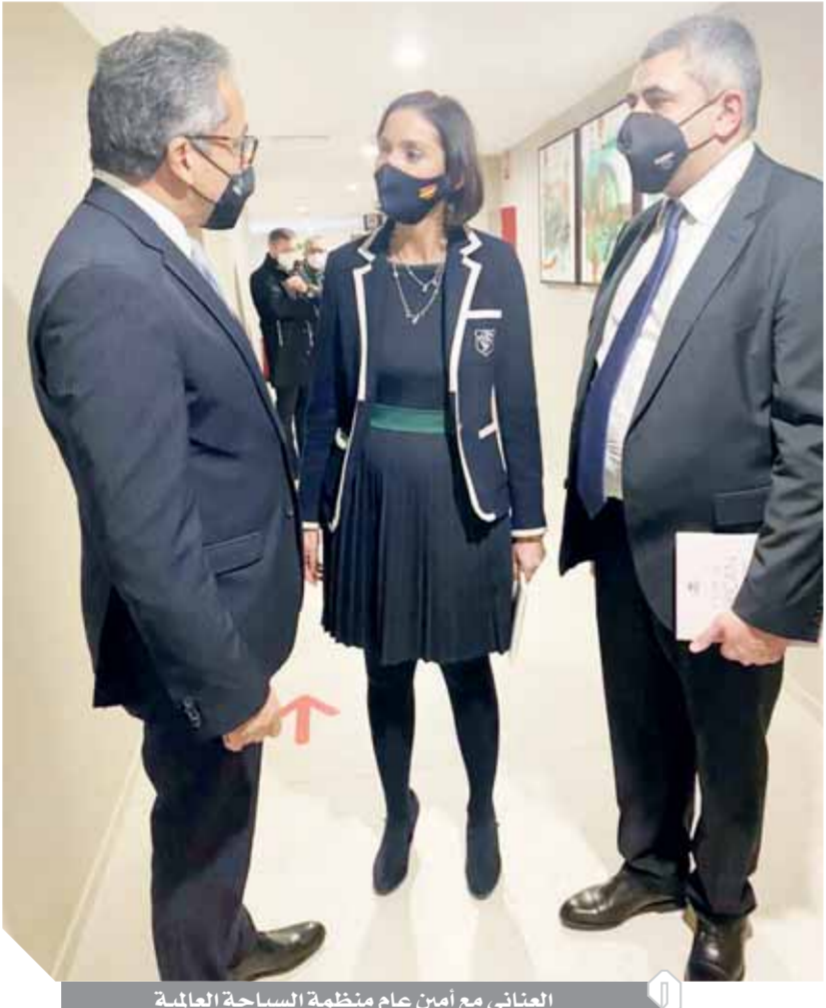
العنانى مع أمين عام منظمة السياحة العالمية

على كافة الأصعدة. والتقى الدكتور خالد العنانى، وزير السياحة والتجارة والسياحة الإسبانية، ماريا ريس ماروتو اليليرا (MARIA REYES MAROTO ILLERA)، حيث توأصلا هاتفيًا سابقًا لمناقشة تداعيات أزمة كورونا على السياحة في البلدين، ووجه الوزير الدعوة للوزير الإسبانية لزيارة مصر في أقرب فرصة. كما عقد اجتماعاً مطولاً مع وزير الدولة لشئون السياحة الإسباني، بحضور السفير عمر سليم، سفير مصر بإسبانيا، واستعرض وزير الدولة لشئون السياحة الضمانات التي تعرض لها الاقتصاد الإسباني جراء أزمة جائحة فيروس كورونا. وأشار إلى أن إسبانيا اتخذت عدداً من الإجراءات لفتح ممرات آمنة بين جزر البليار والكناري مع بعض الدول لاستقبال السياحة بشكل آمن. وأبدى وزير الدولة لشئون السياحة استعداد بلاده الكامل للتعاون مع مصر ومساعدتها لاستعادة حركة الطيران وحركة السياحة الوافدة إليها من إسبانيا بصفة خاصة وأوروبا بصفة عامة وذلك بالتنسيق مع الاتحاد الأوروبي.