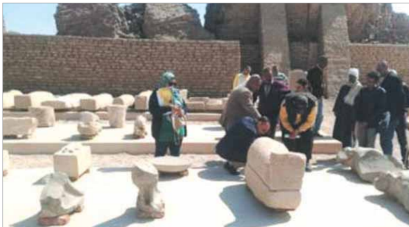
تطوير واجهة أسوان السياحية