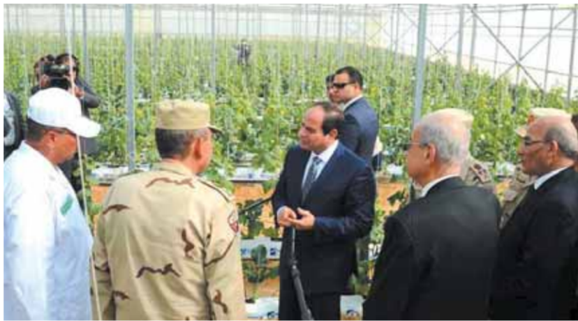
الصعيد فى بؤرة الاهتمام

وأكد أن الدولة فى الوقت الراهن تولي اهتماماً لقطاع الزراعة بمصانع العسل الأسود بالصعيد، خاصة أن هناك فجوة غذائية بمصر، حيث تستورد مصر ٥٠٪ من احتياجاتها الغذائية من الخارج، نتيجة الزيادة السكانية التي تمثل عبئاً على الدولة، مضيفاً أن زيادة الإنتاج الزراعى من خلال التوسع فى الرقعة الزراعية واستصلاح الأراضي والقيام بأبحاث لزيادة الإنتاج الزراعى من أهم الحلول التي تنتهجها الدولة للتعاضد على هذه الفجوة.