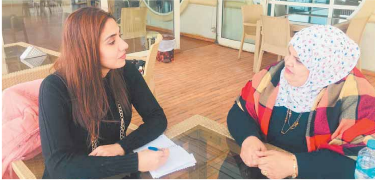
المخرجة الفلسطينية فى وراها مع محررة الوفد

● كيف استطعت الوصول بفيلم «قبلة موقوتة» إلى فرنسا ليفوز فى مهرجان مارسيليا؟ بعد إرسال الفيلم عن طريق الإنترنت، وصلت رسالة بيان الفيلم دخل التصنيفات النهائية، ويجب إرساله على CD ليكون بجودة عالية ويتم تحكيمه من جميع النواحي الفنية، إلا أننى فوجئت عند معبر «إيرز» بمنع القوات الإسرائيلية وصول الفيلم لفرنسا للمشاركة فى المسابقة الدولية للفيلم الوثائقي بزعم أنه ضد السياسة الإسرائيلية ومنوع يخرج من قطاع غزة، فتوجهت إلى المركز الثقافي الفرنسى بغزة وعبر الفيلم الحدود بحوزة السفير الفرنسى.