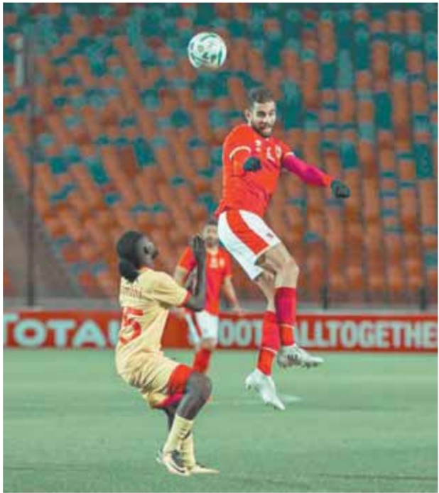
الأهلي يُحمل جهاز المنتخب مسؤلية إصابة «السولية»

كتب - محمد اللاهوتي، رفع مسئولو النادي الأهلي الراية البيضاء في أزمة تضارب مواعيد بطولتي كأس العالم للأندية التي تقام بالإمارات في الفترة بين ٣ إلى ١٢ فبراير المقبل وكأس الأمم الأفريقية التي تقام بالكامبيون في الفترة بين ٩ يناير و٦ فبراير المقبلين. وجاء فشل محاولات تأجيل بطولة كأس الأمم الأفريقية ليعد الملف إلى نقطة الصفر خاصة مع رفض الفيفا إجراء أي تعديلات على مواعيد بطولة كأس العالم للأندية، كما تقرر فتح باب القيد في القوائم قبل المباراة الأولى بـ٤ ساعات إجراء استثنائي لمواجهة أزمة التضارب. ويتربط الأهلي مصير المنتخب ومشاركته بطولة كأس الأمم الأفريقية وفي حالة تأهل المنتخب إلى دور الأربعة