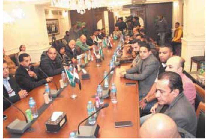
حضور إعلامي ورياضي كبير في حفل تكريم الوفد