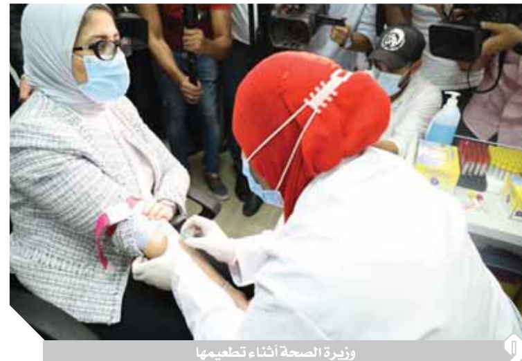
وزيرة الصحة أثناء تطعيمها