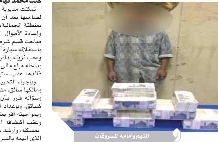
المتهم وأمامه المسروقات