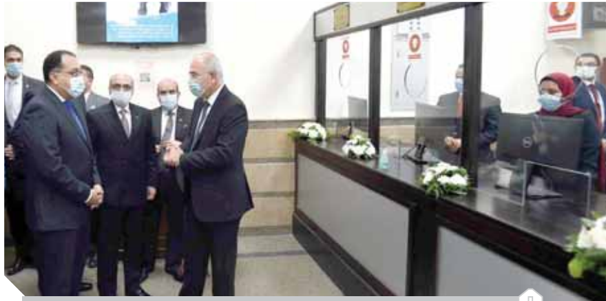
رئيس الوزراء يتفقد أعمال تطوير مجمع محاكم عابدين

تفقد رئيس الوزراء سيارة التوثيق المتقل المتابعة لمصلحة الشهر العقاري والتوثيق، حيث تمت الإشارة إلى أن هذه السيارة تقوم بتقديم مختلف خدمات التوثيق والدعم لمكاتب التوثيق، وكذا معاملات الانتقال للأشخاص والشركات، وذلك وفقاً للكثافات، بما يساهم في التيسير على المواطنين الراغبين في الحصول على خدمات التوثيق، ويأتي ذلك في إطار دعم وتطوير الخدمات المقدمة للمواطنين.