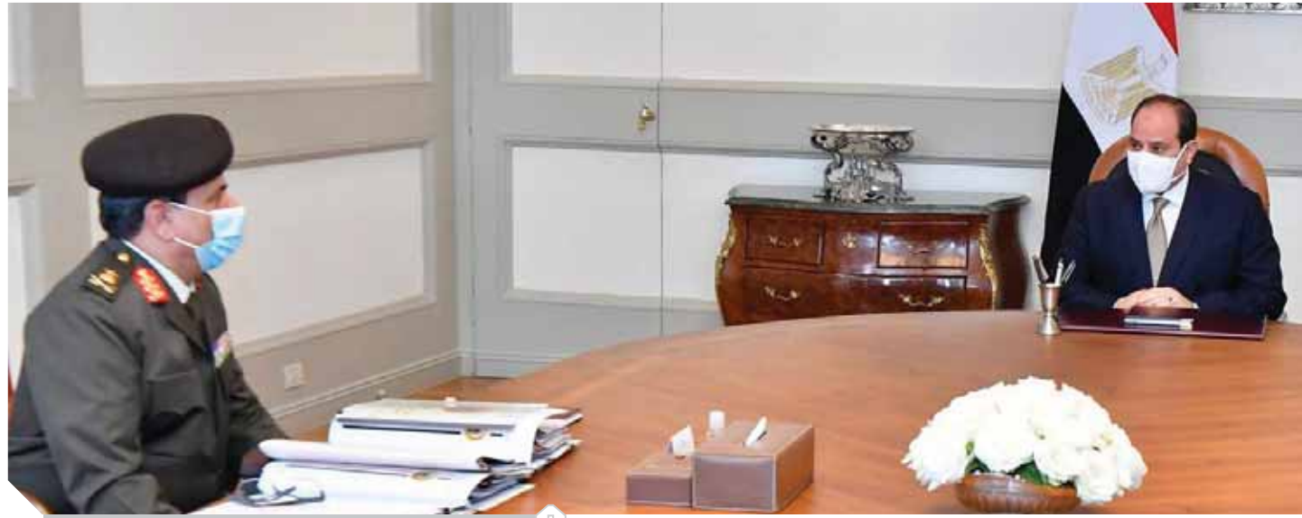
الرئيس «السياسي» خلال اجتماعه مع رئيس هيئة الشؤون المالية بالقوات المسلحة