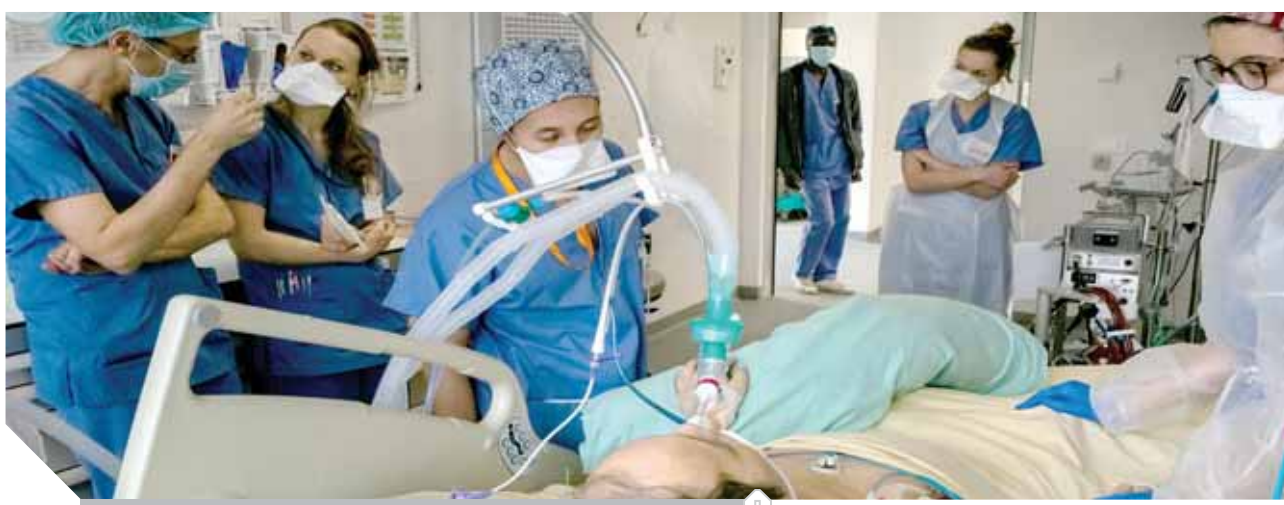
سلالة جديدة فى نيجيريا تختلف عن سلالة بريطانيا وجنوب إفريقيا

كتب - هشام الهلوتى وعبدالرحيم أبوشامة ومحمد ثروت، شدد الدكتور مصطفى مدبولي، رئيس مجلس الوزراء، على ضرورة المتابعة المستمرة من الجهات المعنية للتأكد من توافر مختلف الأدوية والمستلزمات الطبية في المستشفيات، وخاصة ما يتعلق بالتعامل مع فيروس كورونا، والتأكد من انتظام عمل الأطقم الطبية، بما يسهم في تقديم الخدمات الصحية للمواطنين على الوجه الأمثل.