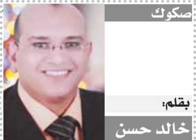
بقلم: خالد حسن

كتب صفحات التاريخ بأحرف من نور عن قصص وحكايات أبطال أكتوبر صنع المجد وأن كانت هناك قصص كثيرة لم تسرد عن هؤلاء الأبطال فاللحمة كبيرة والنصر مبين وشارك فيه كل المصريين بل والعرب إلا أننا اليوم في تلك الذكرى العطرة نقف تحية لإجلال وتقدير لثابت عظيم عبقرى واستثنائى وشجاع ويملك رؤية شمولية وسيظل الكتاب والمفكرون ينظرون بعين الإعجاب والإعجاب لعبقرية هذا الزعيم، فلقد قرر السادات أن يطرد الخبراء الروس الذين صاروا عبئاً على الدولة المصرية وأدرك أن الاتحاد السوفيتى سوف يتفكك وكأنه يقرأ من كتاب مفتوح لمستقبل قد كان وأن أمريكا تملك ٩٩٪ من أوراق اللعبة وقرار طرد الخبراء أهدأ في استقلالية المؤسسة العسكرية في إدارة ملفاتها واتفق السادات أن حالة اللاتربح والسلام يجب أن تنتهى فقام بتأمين الحدود وتدريب الجيش على أحدث الأسلحة والمعدات وإعادة بناء القوات الجوية وقوات الدفاع الجوى، وتطور عبقرية السادات فى الخداع الاستراتيجى بشأن موعد الحرب التى فاجأت إسرائيل والعالم أجمع واتخذ قراره التاريخى والشجاع مؤمناً بالنصر حيث قال إننا نقاتل من أجل أراضينا ونحن على يقين بالنصر، وكان العبور العظيم الذى غير وجه المنطقة العربية والذى أعاد لمصر مكانتها الدولية واستعادة مصر كامل أراضيها بفضل عزيمة الأبطال وقادتهم العظيم المفضل الذى قال عنه كينجستون «قائد عظيم ورجل شجاع»، وقال كارتر: «رجل سلام ورجل حكمة» وقال الرئيس الأمريكى ريتشارد نيكسون «رجل رائع وقائد رائع» والحديث عن السادات وعبقريته وزعامته وروحيته المستقبلية يحتاج كتب ومجلدات، إنه البطل صاحب قرار الحرب والسلام عاش بيننا وسيظل رمزاً ونوراً وزعيماً وهلمها وداهية وعبقرياً و«للحديث بقية».