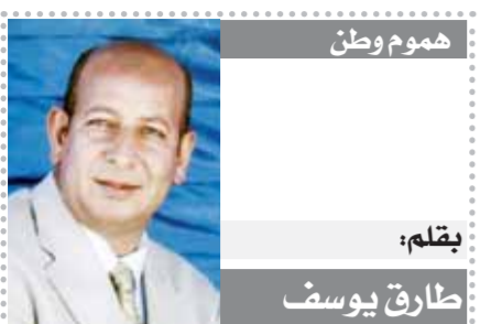
هشام وطن بقلم: طارق يوسف