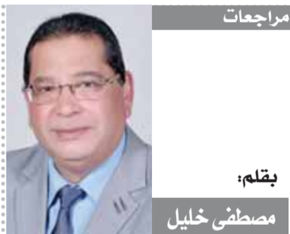
يقلم: مصطفى خليل

عقد أمس مجلس الأمن الدولي مناقشته الفصلية المفتوحة عن تطورات الأوضاع في الأراضي الفلسطينية المحتلة منذ بدء العدوان الصهيوني في السابع من أكتوبر، أنطونيو غوتيريش، والمسئول الخاص لعملية السلام في الشرق الأوسط، تور وينسلاند، وكيل الأمين العام للشئون الإنسانية، مارتن غريفيث، أحاطات تطور التطورات الأخيرة في الأراضي الفلسطينية المحتلة كما قدم أنطونيو غوتيريش تقييماً لتطورات الأوضاع في الأراضي الفلسطينية المحتلة، وتطرقت غريفيث إلى الجهود المبذولة لتأمين وصول المساعدات الإنسانية بشكل منتظم إلى القطاع. وأكدت موسكو عزمها على مواصلة تعزيز العلاقات مع طهران في أجواء تسودها الثقة، وأوضح بيان أصدرته وزارة الخارجية بأن محادثات الوزير سيرغي لافروف مع المسئولين الإيرانيين ركزت على تطوير العلاقات الثنائية، وتعزيز أطر التعاون الشامل في المجالات كلها، وكان لافروف أجرى جولة محادثات مع الرئيس الإيراني إبراهيم رئيسي، ومع نظيره الإيراني حسين أمين أمير العليان. وأعلن عبد الهيمان، بعد المحادثات مع لافروف، أنه طلب من نظيره الروسي منع تبني أي قرار في مجلس الأمن الدولي يعارض مع مصالح فلسطين. وأضاف أنه «يجب أن تهدف كل الجهود إلى منع تبني قرار يتعارض مع مصالح فلسطين». أكد نائب مندوب روسيا الدائم لدى الأمم المتحدة ديمتري بوليانسكي أن واشنطن كانت تسعى إلى عدم إدراج بند لوقف