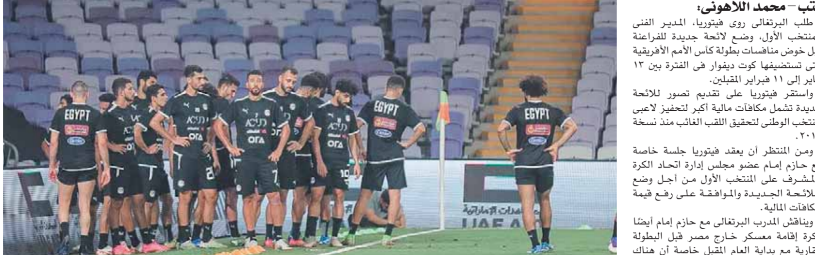
المنتخب يسعى لتحقيق لقب أمم أفريقيا