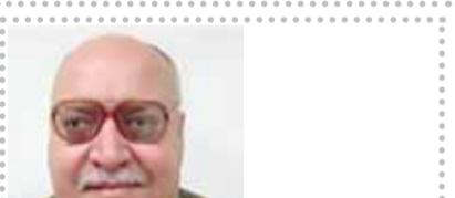
يقلم: محمود سيف النصر

بلغ الضغط من قبل المهاجر اليهودى الروس حاييم وايزمان، إلى جانب الخوف من أن اليهود الأمريكين قد يجسوم الولايات المتحدة على دعم ألمانيا فى الحرب ضد روسيا، بعد ذروتها فى إعلان بلفور للحكومة البريطانية عام ١٩١٧، آيدت إنشاء وطن لليهود فى فلسطين على النحو التالى: تويد وجهة نظر حكومة صاحب الجلالة إنشاء وطن قومى للشعب اليهودى فى فلسطين، وستبدل فصلى جدها لتسهيل تحقيق هذا الهدف.