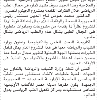
بقلم: عادل يوسف