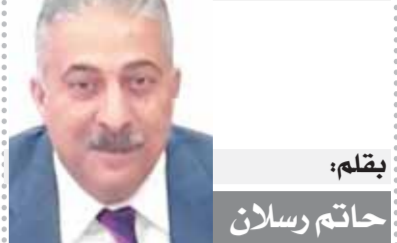
بقلم: حاتم رسلان