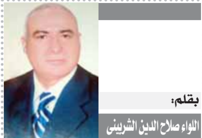
يقلم: اللواء صلاح الدين الشريفي