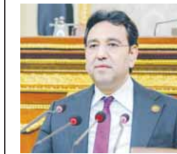
د. أيمن محسب

أكد النائب الوفدى الدكتور أيمن محسب، وكيل لجنة الشؤون العربية بمجلس النواب، أهمية تنمية الصادرات المصرية إلى إفريقيا، من أجل المساهمة في زيادة حجم الصادرات المصرية والوصول إلى حلم ١٠٠ مليار دولار صادرات، وهو ما يساهم في دعم القطاعات الإنتاجية وزيادة فرص التشغيل وتحقيق النمو الاقتصادي، مؤكداً أهمية دعم التبادل التجاري بين مصر وبلدان القارة الإفريقية من خلال فتح أسواق جديدة.