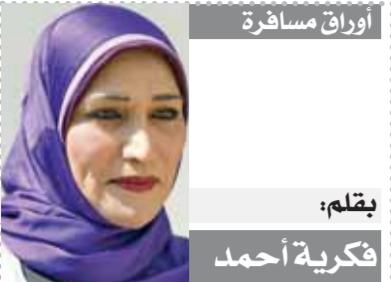
بقلم: فكرية أحمد

ندا مصطفى يونس هلال الطرفاية اليدرشين الجيزة