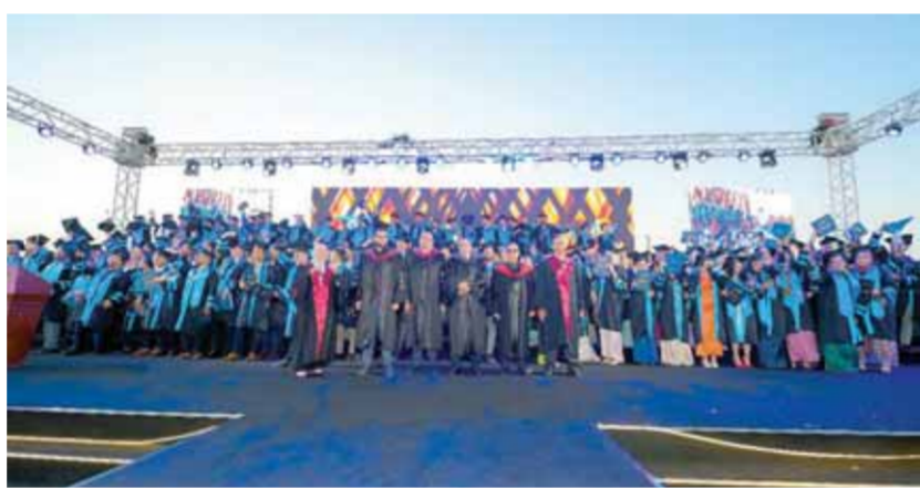
احتفال جامعة الدلتا