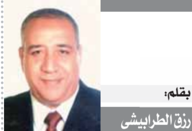
بقلم: رفاق الطرابيشي