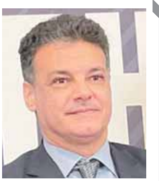
بقلم: د. محمد أبو الفضل بدران

أتمنى أن يتراجع الوزير عن هذه القرارات ويقوم بالعملية التعليمية بالمدراس وتطويرها لتتناسب مع طموح المصريين.