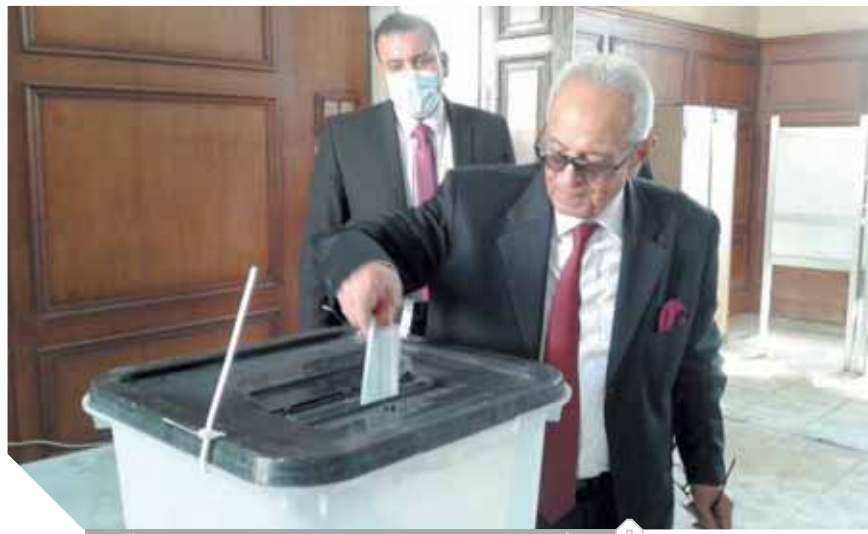
أبوشقة، يبدى بصوته فى لجنة المتحف الزراعى بالدفى

مجلس الشيوخ وما أفرزته من عناصر وطنية وكفاءات تمثل كافة القوى السياسية والحزبية والفكرية والاقتصادية والثقافية، كذلك تشكيل مكتب المجلس برئاسة المستشار عبد الوهاب عبدالرازق الذى ينتمى إلى حزب الأغلبية واليكلين الأول المستشار «أبوشقة» يمثل حزباً معارضاً والثانى السيدة القبطية فيبى فوزى جرجس تمثل حزب الشعب الجمهورى، وهذا يؤكد أننا نؤسس لدولة ديمقراطية عصرية حديثة ونفعل المادة الخامسة من الدستور التى تنص على أن النظام السياسى يقوم على التعددية السياسية والحزبية والتداول السلمى للسلطة. ونوه رئيس حزب الوفد إلى أننا أمام عصر ديمقراطى وعلى المصريين جميعاً أن يكونوا على قلب وتصميم وإرادة رجل واحد من أجل تحقيق حلم المصريين جميعاً على إنجاح الديمقراطية. وثن «أبوشقة» الدور الرائع للشرطة والقوات المسلحة المصرية فى تأمين العملية الانتخابية دون أى تدخلات باى صورة من الصور.