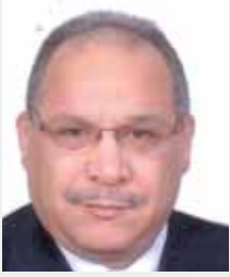
بقلم: حسين حلمي