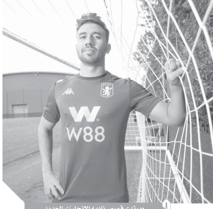
ويرتدي قميص ناديه الإنجليزي الجديد