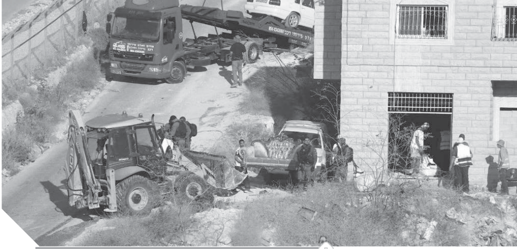
جريمة إسرائيلية جديدة في القدس

مصر الراسخ تجاه دعم حقوق الشعب الفلسطيني الشريفة، ومجدداً الدعوة لاستئناف المفاوضات لدفع عملية السلام على أساس حل الدولتين. وأعرب الأزهر الشريف عن رفضه الشديد لقيام قوات الاحتلال الإسرائيلية بهدم المنازل الفلسطينية في حي وادي الحمص، وحذر الأزهر الشريف من خطورة الإجراءات الإسرائيلية التي وصفها بالغاشمة، وجدد الأزهر في بيانه تأكيده أن عروبة القدس وهويتها الفلسطينية غير قابلة للتغيير أو العبث. وقال البيان: «إن ما حدث في حي وادي الحمص يعد اعتصاماً للأراضي الفلسطينية وحقوق الشعب الفلسطيني المظلوم في العيش على أرضه في أمن وسلام».