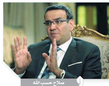
صلاح حسب الله

قال د.صلاح حسب الله، المتحدث باسم مجلس النواب، إن مشروع قانون الإجراء القديم للوحدات غير السكنية ستم مناقشته بدور الانعقاد الخامس، بعد حالة النقاش والحوار الواسع الذي تم حوله في نهاية دور الانعقاد الرابع، مؤكداً أن هذه الحالة صحية وإطار فاعل للديمقراطية، والجميع يحاور من أجل الصالح العام وليس المكاسب الشخصية.