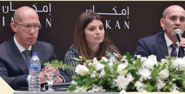
جانب من المؤتمر الصحفي للشركة

لتتمية الأرض بمشروع سيعد نقلة في القطاع الإسكاني بمصر. وتعمل مجموعة أبوظبي القابضة المالكة لشركة «إمكان للتطوير العقاري» في ٧ دول حول العالم كما تنفذ في مصر منذ عام ٢٠١٦. من خلال شركة كابتال جروب بروبريتيز، مشروع مدينة البروج الواقع شرق القاهرة، والذي بلغ حجم أعمال الإنشاءات به خلال عامين ما يزيد عن ٦ مليارات جنيه، تتضمن أعمال ١٥٠٠ وحدة سكنية، بالإضافة إلى ١٠٠ ألف متر مربع مكاتب إدارية، وقد استطاع مشروع البروج تحقيق مبيعات كبيرة وصلت إلى ٦ مليارات جنيه حتى الآن، وستبدأ الشركة تسليم وحداته إلى العملاء خلال الفترة القادمة.