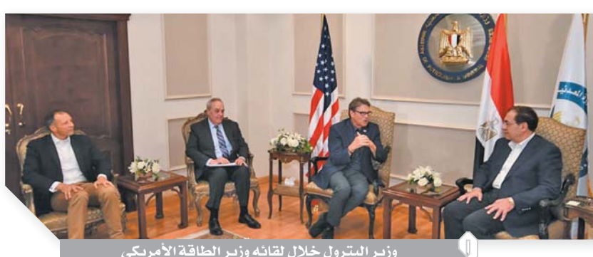
وزير البترول خلال لقائه وزير الطاقة الأمريكي

بالقاهرة والوفد المرافق، أكد الوزير الأمريكي دور مصر كمصدر موثوق للطاقة، مشيراً إلى تقديم كل الخبرات والتكنولوجيات لحصر لتعزيز مكانتها الطبيعية كمركز مهم للطاقة بالمنطقة، وأن هناك استعداداً وريغبة قوية من الشركات الأمريكية للتوسع والاستثمار والعمل في مصر. وأضاف أن مشاركة الولايات المتحدة الأمريكية في أعمال منتدى غاز شرق المتوسط تأتي دعماً للشراكة بيننا وبين دول شرق المتوسط، والاستفادة من الطاقة في تحقيق السلام. استغلال الاقتصاد الأمثل لما تضمه منطقة شرق المتوسط من اكتشافات للغاز واحتياطيات كبيرة وبنية تحتية متميزة لتجارة وتداول الغاز وتصديره، الأمر الذي يعطى قوة دافعة لمشروع مصر القومي كمركز إقليمي لتداول وتجارة الطاقة. واستقبل المهندس طارق الملا وزير البترول والثروة المعدنية، أمس الأربعاء، ريك ويرى وزير الطاقة الأمريكية في أول زيارة له بالقاهرة، وفرانسيس فانو مساعد وزير الخارجية الأمريكي لشؤون الطاقة، وتوماس جولدبرجر القائم بأعمال السفير الأمريكي