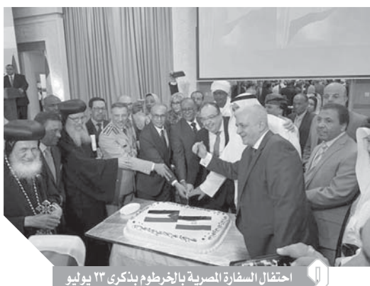
احتفال السفارة المصرية بالخرطوم بذكرى ٢٣ يوليو

المجيدة، وشارك فيه عدد كبير من أبناء المجتمع السوداني، بحضور الفريق ركن محمد علي إبراهيم، الأمين العام لرئاسة الجمهورية السودانية ممثلاً عن المجلس العسكري الانتقالي، ووكيلة وزارة الخارجية السودانية، وممثل وزارات والإدارات الحكومية، وقادة مختلف الأحزاب والتيارات السياسية السودانية، وممثل قوى إعلان الحرية والتغيير، والصادق المهدي زعيم حزب الأمة القومي ورئيس تحالف نداء السودان، وعدد كبير من الإعلاميين والصحفيين وقادة الطرق الصوفية ورجال الأعمال، وعدد من أبناء الجالية المصرية في السودان.