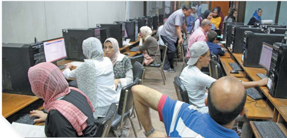
طلاب المرحلة الأولى التثوية من تسجيل رغباتهم

يعتمد الدكتور خالد عبدالغفار وزير التعليم العالي يوم الأحد المقبل نتيجة المرحلة الأولى لتنسيق قبول الناجحين في الثانوية العامة بالجامعات والمعاهد، تقدم للمرحلة حتى أمس ١٢٥ ألف طالب وطالبة، يعلن الوزير الحد الأدنى الذي قبيلته كل كلية والأعداد التي تم قبولها ومواعيد بدء المرحلة الثانية والحد الأدنى لتسقيها، ينتهي كميوتور جامعة القاهرة من ترشيح طلاب المرحلة الأولى، وعددهم ٤٣ ألفاً و٣١٢ طالباً وطالبة، منهم ٣٠ ألفاً و١٥٢ من العلمي، و١٤ ألفاً و٦٩٠ من الرياضيات، و٩٨ ألفاً و٤٧١ طالباً وطالبة من الأدبي، ارتفع الحد الأدنى للمرحلة الأولى إلى ٢٩٨ درجة بنسبة ٧٠,٧٪، وللأسئلة علوم ٢٨٩,٥ درجة بنسبة ٦٩,٥٪ الرياضيات، والأدبي ٢٢٨ درجة بنسبة ٨٠,٠٪، ومن المقرر بدء المرحلة الثانية وقبل الأخرى يوم الثلاثاء بعد أدنى ٢٢٤ درجة بنسبة ٨٠٪ وللأسئلة ٢٩٠ درجة بنسبة ٧٠,٧٪، وللأدبي، وتجتمع اللجنة العليا لتنسيق يوم السبت المقبل لتحديد الأعداد المقرر قبولها بالكليات وزيادة أعداد المقبولين بالكليات بنسب الزيادة في أعداد الناجحين عن العام الماضي لوقف جنون الحد الأدنى لقبول بكليات القمة، وحتى لا يكون مرتفعاً بفارق كبير عن مستوى الحد الأدنى العام الماضي، ويوجد أمام طلاب المرحلة الأولى التي ستبدأ الاثنين المقبل ٣٠٥ آلاف مكان بالجامعات والمعاهد، وكشفت مؤشرات المرحلة الأولى عن تسرب مئات من