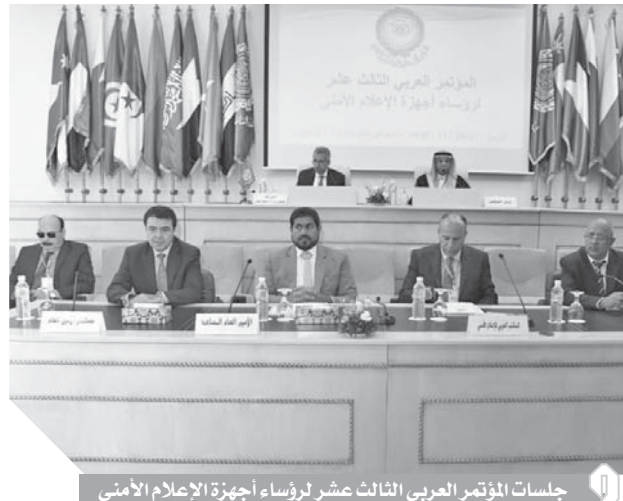
جلسات المؤتمر العربي الثالث عشر لرؤساء أجهزة الإعلام الأمتى