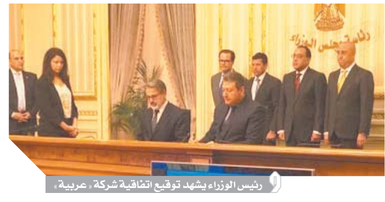
رئيس الوزراء يشهد توقيع اتفاقية شركة «عربية»

ضم العلامة الرياضية الأعرق فى عالم التنس يروج لمناخ الاقتصاد المصرى