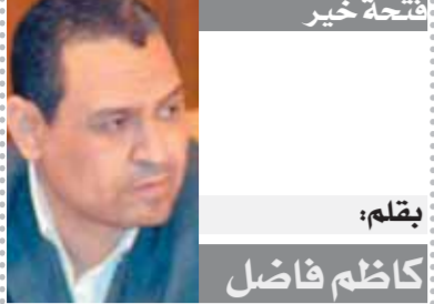
بقلم: كاظم فاضل

الحقيقة أن ما يحدث في الدوري الممتاز هو أمر مثير للجدل في ظل عدم وجود التخطيط الدقيق لوضع الفرق بطريقة التي تتناسب مع المشاركات الأفريقية والدولية للفرق والمنتخب الوطني، ليس من المعقول أن الدوري أوشك على الانتهاء وهناك فرق لم تلعب نصف مبارياتها بالدوري نظراً لحالات التوقف الكثيرة مع فوضى التنظيم والترتيب المحكم لمباريات دوري Nile.