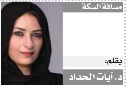
يقلم: د. آيات الحجداد