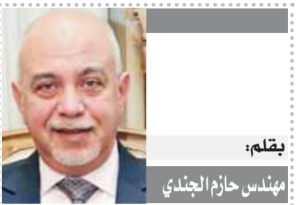
يقلم: مهندس حازم الجندي