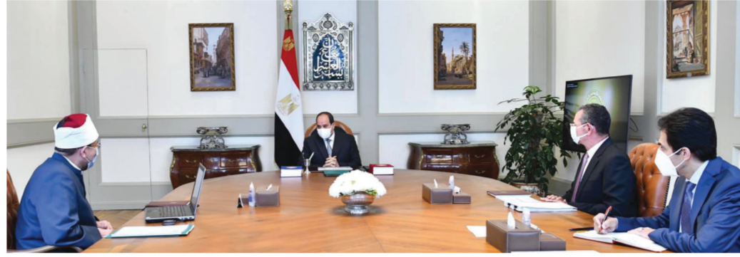
الرئيس خلال اجتماعه أمس مع وزير الأوقاف ومستشار الرئيس للشئون المالية

زيادة تقدر بنحو 16٪، أو ما يعادل 250 مليون جنيه، عن العام الماضي، إلى جانب تحقيق مال بدل وأصول مستحقة بنحو مليار و170 مليون جنيه، ليصبح إجمالي إيرادات الهيئة حوالي 3 مليارات جنيه للمرة الأولى في تاريخها. كما عرض وزير الأوقاف أنشطة الوزارة في مجال