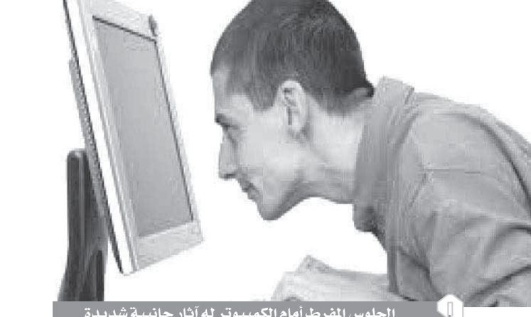
الجلوس المفرط أمام الكمبيوتر له أثار جانبية شديدة

الروماتيزمية مثل خشونة العظام وخشونة المفاصل وزيادة ضعف العضلات، وقلة إفراز الهرمونات التي تساعد على زيادة النشاط أثناء الحركة، وعدم التعرض لأشعة الشمس فوق البنفسجية مما قد يسبب مخاطر للأطفال، ولذا يجب أن يستغل وقت رفع