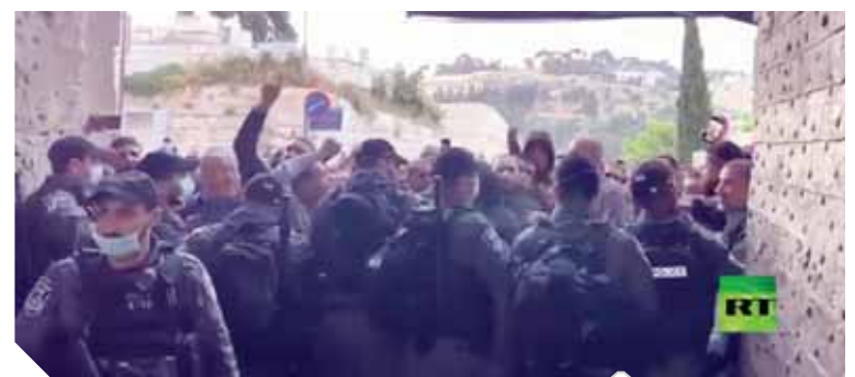
جانب من احتكاك قوات الاحتلال مع المصلين

أكد المهندس كامل الوزير، وزير النقل، أن هيئة السكة الحديد نقلت خلال الأسبوع السابق لعيد الفطر ٢,٦ مليون راكب، بالتزامن مع اتخاذ كل الإجراءات الاحترازية اللازمة لمواجهة فيروس كورونا. وقال الوزير إن فترة حجوزات العيد لم تشهد تكديسا على شبلييك التذاكر، واختصت السوق السوداء بسبب تطبيق عدد من الإجراءات والتدابير التنظيمية الخاصة بعوامة عمليات صرف التذاكر بالمحطات مثل الحجز المتقدم على جميع القطارات قبل ميعاد السفر بمدة أسبوع، وزيادة منافذ