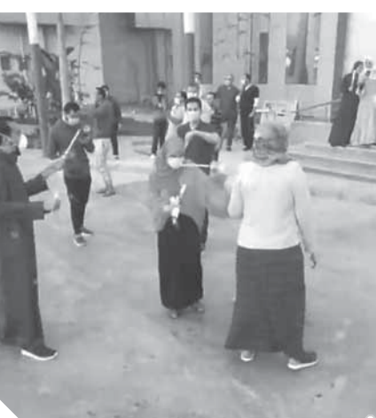
الأطقم الطبية في مستشفى العزل بالإسماعيلية تحتفل بالعيد