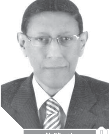
د. ماهر القبلاوي

الحظر في المشي قدر المستطاع لدرجة تصل إلى ٤ ساعات يومياً على الأقل، وعندما يكون موعد الحظر في الساعة السابعة أو التاسعة مساءً يكون تناول وجبة المشاء مبكراً وتتم الأسرة الساعة ٢ صباحاً وخلال هذه الفترة يتناولون أربع أو خمس مرات أخرى الطعام وهذا من المخاطر التي تسبب زيادة في الوزن ويجب أن يكون المشاء مرة واحدة أما في الفترة التي تليها إلى النوم فيجب أن لا تشمل أكثر من الخضراوات والفواكه والعصائر منخفضة السعرات وبدون سكر، وإذا أمكن أن يقوم بعض أفراد الأسرة بعمل بعض التمارين البسيطة وخاصة تمارين البطن التي لا تحتاج إلى مساحة كبيرة لتطبيقها، ويجب على الأم ألا تمنع الطفل من اللعب لأن ذلك يبنى ذكاه وعضلاته، ويجب لا يستمر الجلوس على الكمبيوتر أكثر من نصف ساعة إلى ساعة إلا ربع يعقبها حركة تشييط لمفاصل الجسم المختلفة بالنشاط الحركي في المنزل ثم العودة مرة أخرى للكمبيوتر والجلوس لفترة تمتد إلى ٦ ساعات يؤدي إلى ضعف عضلات فقرات الرقبة والظهر وتؤدي إلى انحناءات في العمود الفقري عند الأطفال وخشونة في الفقرات عند الكبار.