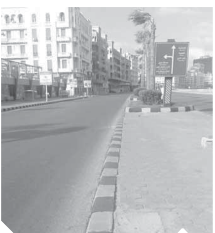
كورنيش الإسكندرية بدون سيارات أو مارة