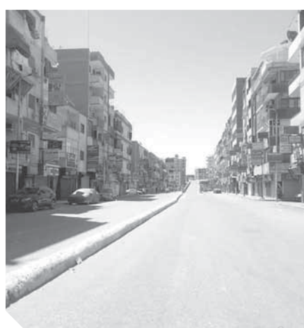
شوارع مدينة قنا خالية من المواطنين والسيارات