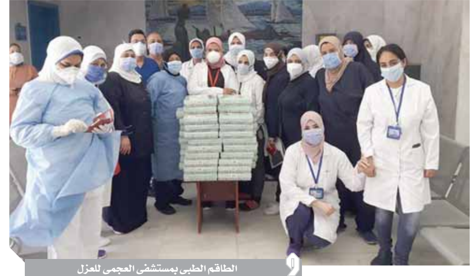
الطاقم الطبي بمستشفى العجمى للعزل