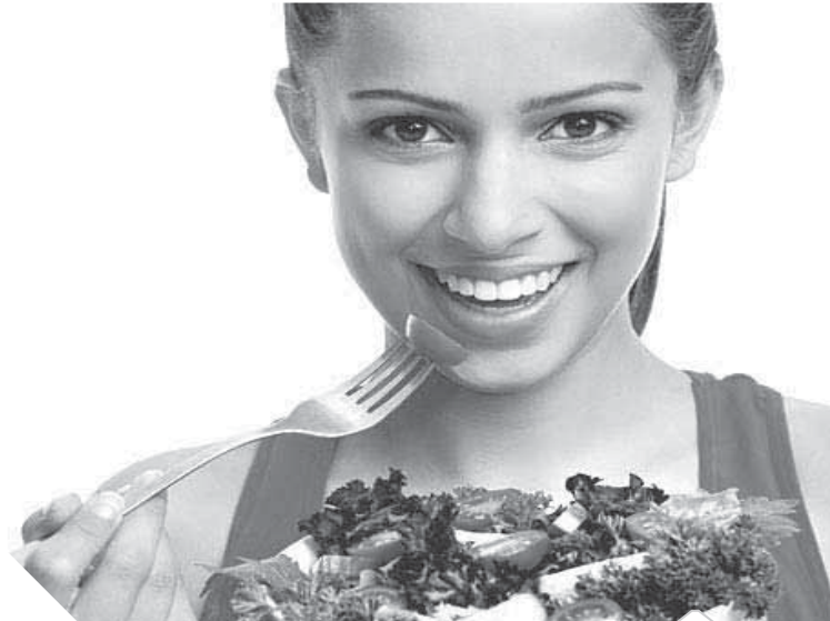
تناول الخضراوات إحدى أهم مواصفات النظام الغذائي السليم

في الطعام يحدث إجهاد على غدد الجسم، حيث تتأثر وظيفتها وتحدث بالجسم تغييرات كيميائية تسرع بالجسم إلى الشيخوخة، ولو التزمنا بروح رمضان وتجنبنا الإفراط في الطعام وتأخر وصولها للجسم، ومصداقاً لقول الرسول صلى الله عليه وسلم «ما ملأ إن آدم وعاء شراً من بطنه فإن كان لا بد فاعلاً فثقل طعامه وثقل لشرايه وبعد لنفسه»، فقد يؤدي الإفراط من تناول الطعام إلى أمراض كثيرة على الجهاز الهضمي ويضعف على الإنسان الفوائد الفسيولوجية الجسدية والصحية في شهر رمضان، فالصيام هو خير فرصة لخفض