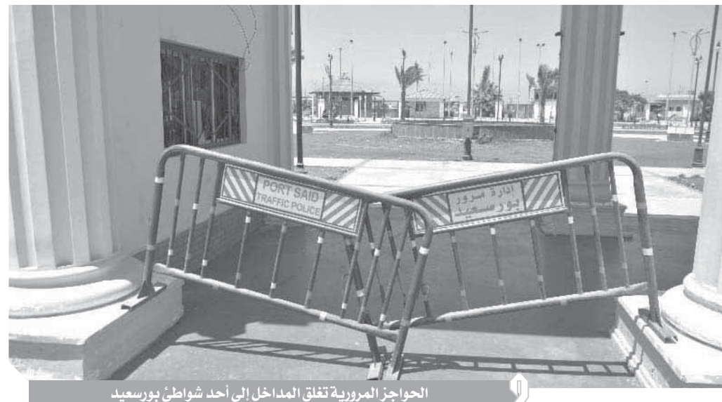
الحواجز المرورية تغلق المداخل إلى أحد شواطئ بورسعيد

كتيب - خالد حسن وعبد الرحمن بصله وولاء وحيد وشيرين ظاهر وسيد الشورة ومحمد عبد الصبور: تصوير: حسام محمد