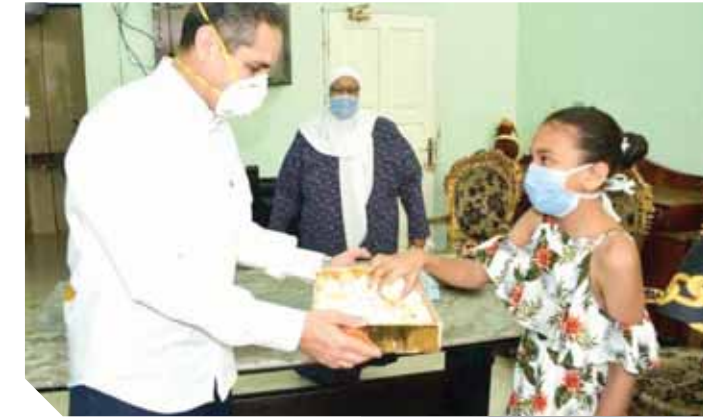
محافظة الغربية يشارك الأطفال والأيتام فرحة العيد

والكرامة لهؤلاء الأطفال، بوصفهم جزءاً لا يتجزأ من نسج المجتمع، ووجه «رحمى» باستمرار تقديم كل أوجه الدعم الرعاية اللازمة لهم، حيث كلف وكيل وزارة التضامن الاجتماعى بوضع خطة زيارات وعرضها عليه لزيارة كل مؤسسة دور الرعاية على مستوى المحافظة وعددهم ٢٥ مؤسسة.