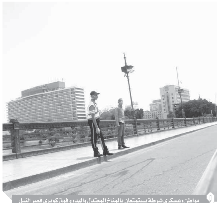
مواطن وعسكري شرطة يستمتعان بالمناخ المعتدل والهدوء فوق كوبري قصر النيل

الأسواق والمحلات.. وحدائق الحيوان والفسطاط والأزهر خارج الخدمة