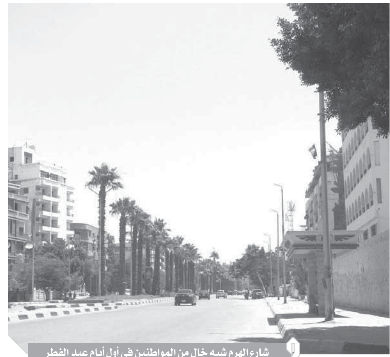
شارع الهرم شبه خال من المواطنين في أول أيام عيد الفطر