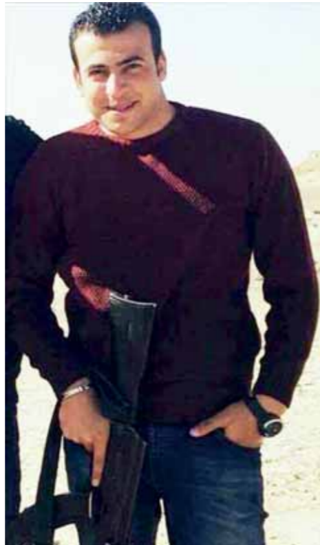
معاون مباحث التل الكبير المصاب

كما تم ضبط رشاش متعدد (جرينوف) وعدد (260) طلقة من نفس ذات العيار وعدد (2) شريط طلقات من نفس ذات العيار وبنديفة آلية وعدد (250) طلقة من نفس ذات العيار وعدد (9) خزن خاصة بها وطبقة ماركه CZ عيار 9 مم وكمية من جوهر الهيرين المخدر تزن حوالي (كيلو و250 جرام) ومبلغ مالى قدره (23 ألف جنيه).