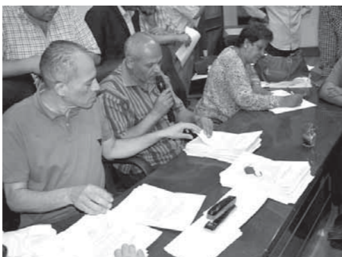
فرز أصوات المرحلة الأولى من الانتخابات العمالية

وتابع وزير القوى العاملة ، محمد سفغان ، إعلان نتائج الفائزين باللجان النقابية على مستوى 27 مديرية للقوى العاملة بالمحافظات، حتى الساعات الأولى من صباح اليوم الخميس ، حيث فاز عدد من المرشحين بالترشيح. ويشرف على الانتخابات لجان مشكلة بمواد القانون ويشرف قضائي من خلال لجنة عليا لاعتماد النتائج، وتنفذ «سفغان» عدداً من اللجان النقابية التابعة للمرحلة الأولى من الانتخابات لتصنيف النقابي للتبرول والمرافق العامة ، والخدمات الإدارية والاجتماعية ، حيث تجرى على مستوى 12 تصنيفا نقابيا، يشمل اللجان التابعة للعاملين بالنقل البرى، والسكة الحديد، والتجارة، والزراعة والرعى والصيد، والبنوك والتمهينات، والتعليم والبحث العلمى والسباحة والفنادق، والإنتاج الحربى، والضرائب والأعمال المالية، ومجانس إدارة الشركات في الوحدات التي تمارس نشاطا يدخل ضمن المجالات المذكورة. ويقوم الوزير بوضع اللمسات النهائية على تجهيز أماكن استقبال طلبات المرشحين للمرحلة الثانية، لتفادي أية أخطاء