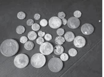
جانب من العملات المصبوطة

نجحت الوحدة الأثرية بجمرك ميناء الإسكندرية البحرى بالتعاون مع رجال الجمارك في ضبط 30 عملة معدنية أثرية، أثناء محاولة تهريبها. صرح بذلك حمى همام رئيس الإدارة المركزية للمناذ والوحدات الأثرية بالموانئ المصرية، موضحا أن وحدة الجمر ك استبنت في أثرية القطع، ويدورها قامت بعرضها على الوحدة الأثرية بالميناء، تم تشكيل لجنة تضم مجموعة من المتخصصين من أمعاء المتحف اليونانى الرومانى بالإسكندرية لفحص ومعاينة القطع. وأضاف «همام» أنه فور فحص ومعاينة القطع أقرت اللجنة أثرية القطع، وبالتالي تمت مصادرتها لصالح وزارة الآثار طبقا لقانون حماية الآثار رقم ١١٧ لسنة ١٩٨٢