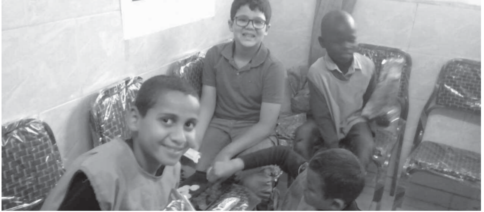
الأيتام يحملون بمستقبل أفضل

الخبراء: التواصل معهم يجب ألا يتوقف بعد رمضان