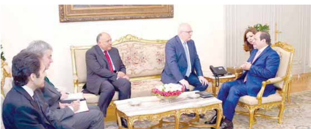
الرئيس السيسي خلال استقباله زعيم الأغلبية الألماني

استقبل الرئيس عبد الفتاح السيسي أمس فولكر كاودر زعيم الأغلبية البرلمانية في البرلمان الاتحادي الألماني، وذلك بحضور سائح شكري وزير الخارجية، وسفير ألمانيا بالقاهرة. وصرح السفير بسام راضي المتحدث الرسمي باسم رئاسة الجمهورية بأن المسئول الألماني نقل للرئيس تحيات المستشار الألمانية أنجيلا ميركل، معرباً عن تميمين بلاده للعلاقات المتميزة بين البلدين وما تشهده من تنام ملحوظ خلال السنوات الماضية على عدة مستويات، معرباً عن تقديره للعلاقات البالغ لردود مصر المزدن في منطقة الشرق الأوسط وما تبذله من جهود لترسيخ الأمن والاستقرار في المنطقة، فضلاً عن دورها الهام في مجال مكافحة الإرهاب والتصدى للفكر المتطرف.