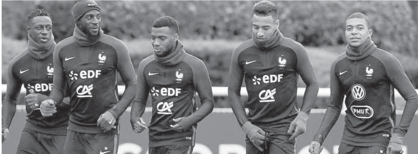
منتخب فرنسا يستعد للمونديال

القائمة الحديدية التى أعلنها منتخب فرنسا لخوض بطولة كأس العالم تيدو بمشايبة سلاح ذى حدين للأحلام الزرقاء من أجل تحقيق حصد بطولة كأس العالم مرة أخرى بعد غياب 20 عاماً كاملة وللمرة الثانية فى تاريخ الديوك الفرنسية ولكن تبقى الديوك الفرنسية ولدى بعض بطولات كأس العالم التى شهدت مشاركة فرنسا بعدة نجوم كبار وعلى أعلى مستوى وكان الفضل الذريع، وأعلن منتخب فرنسا قائمة تضم 23 لاعباً، هم هوجو لوريس (توتنهام الانجلىزى) ستيف مانداندا (مارسيليا) والفرنسى رويلا (باريس سان جيرمان) لحراسة الرمي، دجايريل سيديبيه (مونكو) ونيامين باهار (شوتوتجارت