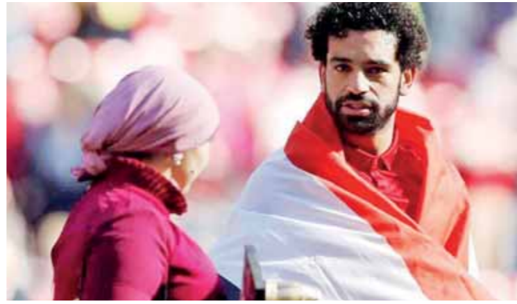
محمد صلاح وزوجته

أي ضغوطات، الأمر الذي لا يجعلني أقدم مستوى جيداً خلال المباراة، وأعتقد أن المباراة النهائية مهمة للعالم كله، والفريق سيقدم مباراة كبيرة». موعد مباراة نهائي ريال مدريد وليفريل أوربوا السبت المقبل قال صلاح: «أريد كل مباراة أن استعداد خاص بها، خاصة وأني أأخوض للمرة الأولى المباراة النهائية بدورى الأبطال». واستكمل الفرعون المصري حديثه قائلاً: «أنا متحمس بشكل كبير لخوض المباراة، ولكن لا أضع على نفسي