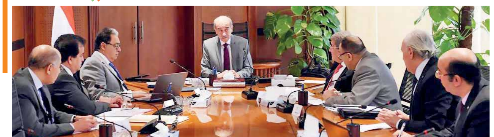
رئيس الوزراء أثناء اجتماعه أمس مع وزراء الصحة والمالية والتعليم العالى

وكتب ليرمان على حسابه فى موقع «تويتر» مغرداً بهذا الصدد: «التزمنا بتسريع عمليات البناء فى الضفة الغربية، وها نحن نفى بوعودنا. 2500 وحدة سكنية جديدة ستمتد على الأسبوع القادم فى مجلس التخطيط من أجل البناء الفورى فى عام 2018». وأضاف الوزير الإسرائيلى: «فى الأشهر القليلة ستواصل للمصادقة على آلاف الوحدات الأخرى، وسوف نستمر بتطوير وتطوير الضفة الغربية عن طريق الأفعال». وناحية أخرى أعلن مسؤل أمريكى أن بلاده تدرس خفض تمويلها لوكالات تابعين للأمم المتحدة، إضافة إلى منظمة لمراقبة الأسلحة الكيميائية بعد انضمام الفلسطينيين إليها.