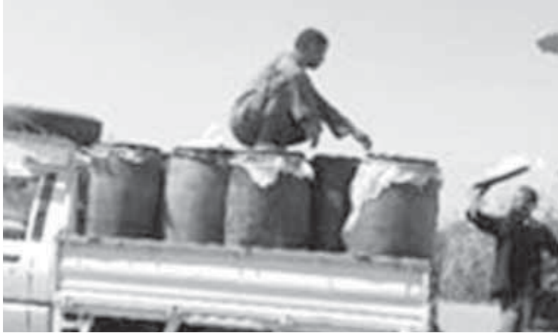
معامل الألبان غير المرخصة بالنييا تهدد صحة المواطنين