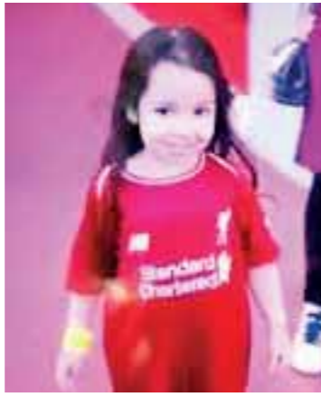
مكة محمد صلاح