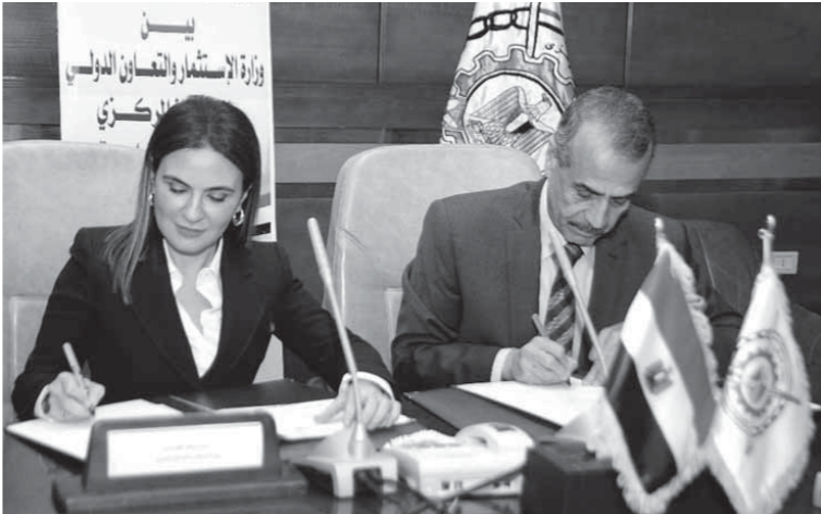
سحر نصر وخيرت بركات يوقعان بروتوكول التعاون

وقعت الدكتور سحر نصر، وزيرة الاستثمار والتعاون الدولى، واللواء خيرت محمد بركات، رئيس الجهاز المركزى للتعبئة العامة والإحصاء، بروتوكول تعاون بين وزارة الاستثمار والتعاون الدولى، والجهاز المركزى للتعبئة العامة والإحصاء. وأوضحت الوزيرة، أن بروتوكول التعاون في إطار تيسير وتبسيط الإجراءات على المستثمرين، وإجراء مسح للمشكلات التى تواجه الشركات وقالت انه بعد تأسيس المستثمر لشركته يكون هناك بعض الإجراءات التى قد تمثل عوائق له، لذلك تعمل الوزارة من خلال هذا المسح على التعرف على أى تحديات لإزالة أى معوقات مستقبلية من أجل ضمان أنه بعد تأسيس المستثمر لشركته أنها تعمل بشكل جيد، وقالت نصر، ان الوزارة تستعمل على توفير التمويل اللازم لإجراء المسح الخاص بدراسة أوضاع المشاكل وتحديات الشركات الناشئة حديثاً، وتوفير كافة