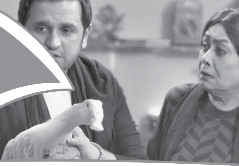
إشراف: أمجد مصطفى

الجمعة ٩ رمضان ١٤٣٩ هـ - ٢٥ مايو ٢٠١٨ - ١٧ يونيو ١٩٣٤ - العدد ١٧٦١ - السنة الثانية والثلاثون