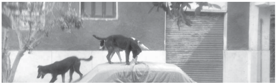
الكلاب الضالة تتحاصر أهالى أسيوط