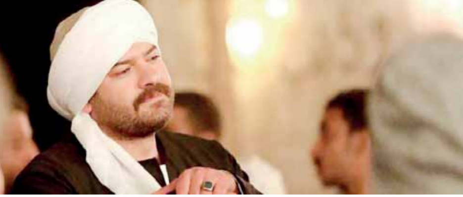
عمرو يوسف فى مشهد عن مسلسل «طابع، الذى يتناول تجارة الأثار

الفرعونية. وأكد أن مسلسل «طابع» للفنان عمرو يوسف المذاع عبر فضائية «أون تي في» يدين لفكرة سرقة الأثار والتقيب عنها ويبيها إلى المتاحف العالمية وخرجها من مصر في القبع الدبلوماسية ما يشكل خطراً على الحضارة المصرية والآثار باعتبارها من قومي، وأشار إلى أن السخرية فى المسلسلات وصلت إلى المساس بالبرديات التي بها كل أسرار العلوم من فلك وكيمياء وطب وهندسة أن يقال عليها انها أوراق مناديل. وقال ان الأعمال الدرامية هذا العام التي تنتدح تحت قائمة الأعمال الكوميدية خالية من الضحك وروح البداية وفيها الكثير من الإسفاف الذى وصل إلى السخرية من آثار مصر والتعريض على التقيب وتجارة الأثار.