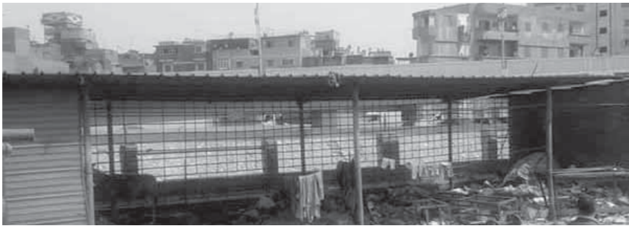
الإهمال يدمر سوق طلخا المطور

صالح الوضع بالمؤلم قائلًا فى ظل غياب المسئولين احتل البلطجية وأصحاب العريات سوق طلخا المطور بعد أن كلف الدولة آلاف الجنيها لتطويره ليصبح فى النهاية بؤرة للخارجين على القانون ومرتبعا للبلطجية وشرب المخدرات ويستغلته بعض الخارجين على القانون فى الأعمال المنافية للأداب، كما أصبح إسبيلا للعريجية بعد أن تركه الباعة وتجار الفاكهة أصحاب الوحدات والتي تهالكت بسبب العوامل الجوية وعدم الاهتمام به منذ أن تم تطويره قبل سنتين. ورفض التجار أصحاب البالكات العودة إلى داخل السوق خوفا من البلطجية التي وضعت يدها على السوق.