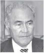
أحمد عز العرب

عند نهاية الحرب العالمية الثانية خرجت أمريكا من الحرب كأول وأقوى دولة عظمى في العالم عسكرياً وسياسياً واقتصادياً، وكانت الدولة العظمى الوحيدة التي لم تعان مدنها دماراً، إذ لم تجر مارك على أرضها باستثناء الهجوم الياباني على بيرل هاربور الذي أغرق جزءاً كبيراً من الأسطول الأمريكي ودفع بأمريكا إلى الحرب الشاملة، ولكن بيرل هاربور بجزء هاواي كانت بعيدة عن القارة الأمريكية، أما الدول العظمى الأخرى التي خرجت من الحرب منضرة وهي روسيا الاتحاد السوفيتي فيما بعد، وبيطانيا والصين وفرنسا فقد عانت خلال الحرب خسائر فادحة ودماراً هائلاً لكثير من مدنها ومصانعها، لذلك كان طبيعياً أن تترك أمريكا في المقدمة والمساعدة في إعادة إعمار الدول الغربية الحليفة لها، وأصبح الدولار العملة الدولية التي تقيم بها كل شيء، وضمنت أمريكا الدولار بألاف الأطنان من الذهب كغطاء له أوكد بقعة فورت نويس وربط الدولار بالذهب على أساس 35 دولاراً للأونصة يعبر التحول منه إليه في أي وقت بضمنان الحكومة الأمريكية وقبول كل دول العالم.