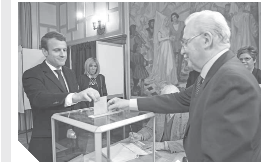
الرئيس الفرنسي ماكرون أثناء الإدلاء بصوته

منح الرئيس حق تعيين رئيس المحكمة العليا بموافقة مجلس الشيوخ بأغلبية الأصوات المحكمة العليا من منظور فلسفة الدستور الأمريكي ليست درجة وظيفية بل تعتمد على عامل الكفاءة والالتزام السلوكي