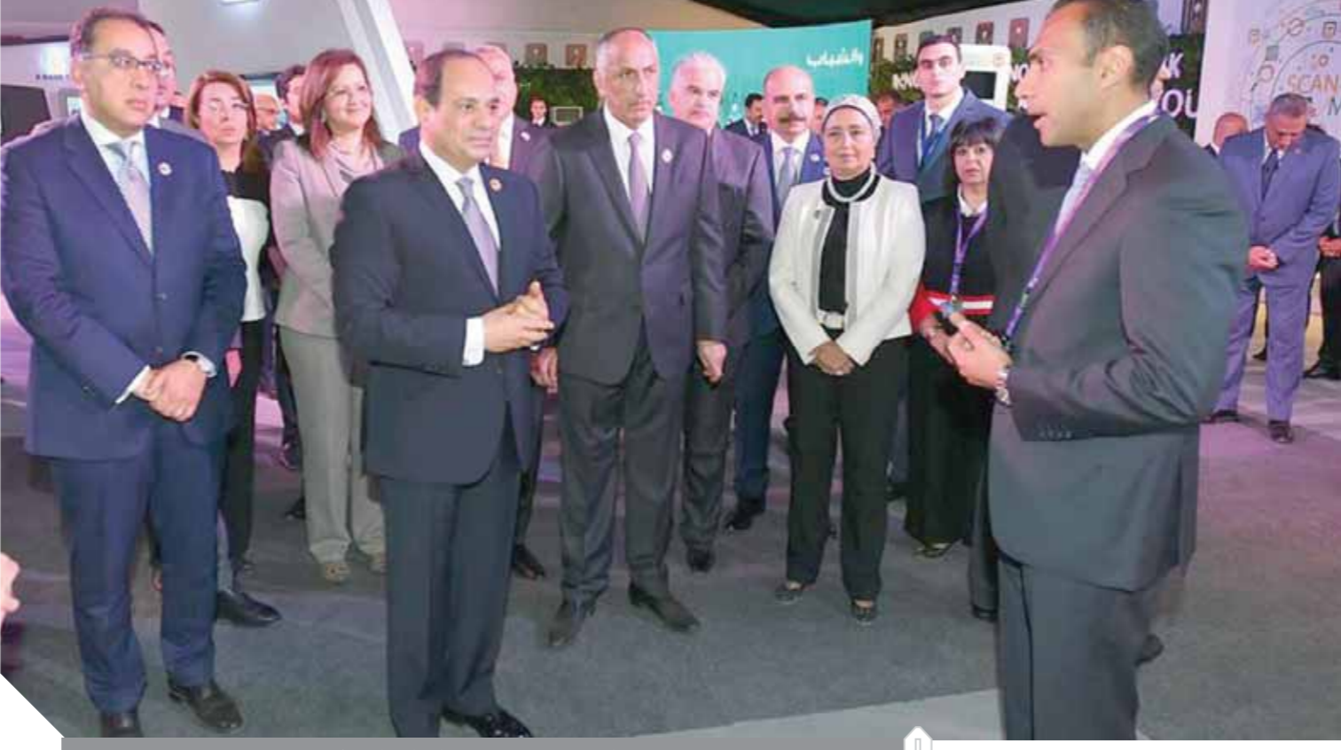
الرئيس يتفقد جناح القطاع المصرفي

إصدار البطاقات الائتمانية التي تعد من الوسائل المثالية في الخدمات ذات الكثافة العالية مثل المواصلات العامة، مشيراً إلى أنه جرى التعاون مع الوزارات المعنية لاستخدام المنظومة في ميكنة المدفوعات والمحصلات الحكومية طبقاً لقرارات المجلس القومي للمدفوعات. وشاهد الرئيس عرضاً توضيحياً من شركة بنوك مصر الذراع التقنية للبنك المركزي تضمن الدور المحوري الذي تقوم به الشركة في بناء وتشغيل منظومة الدفع الوطني، وما تم من إجراءات لاستخدام بطاقة الدفع