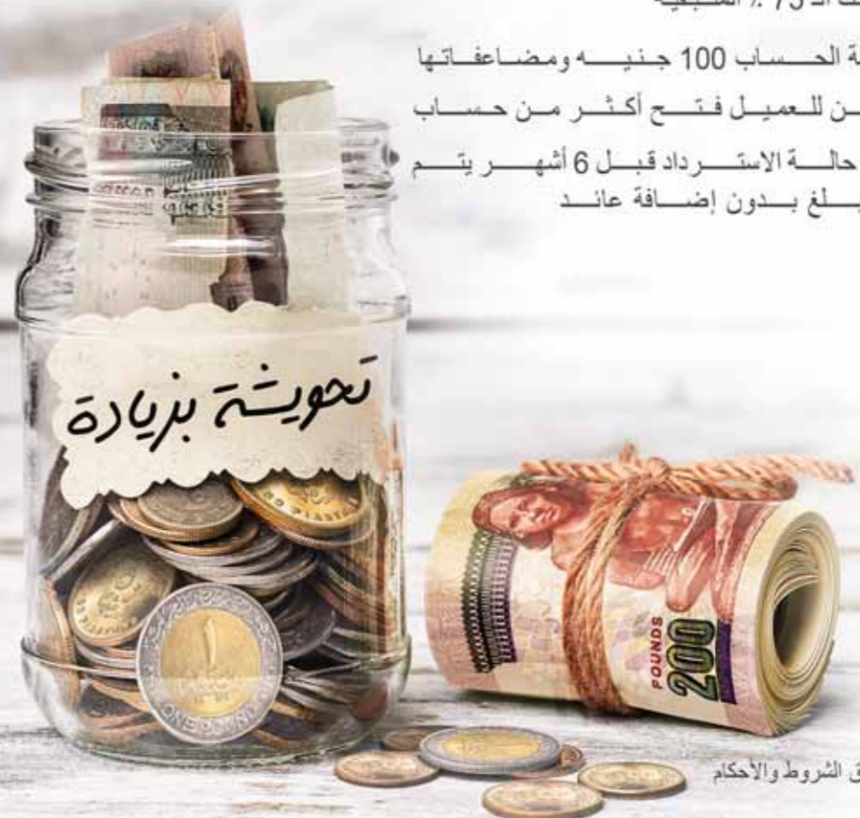
* تطبيق الشروط والأحكام