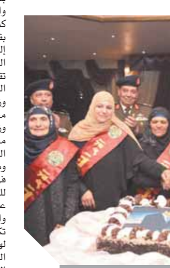
جانب من احتفال القوات المسلحة بالأم المثالية والأب المثالى