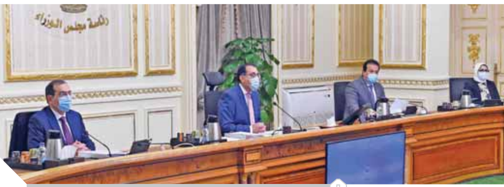
جانب من اجتماع مجلس الوزراء أمس

«مدبولي» يوجه بتيسير إجراءات التسجيل العقاري