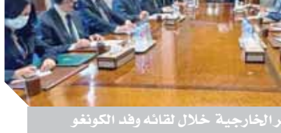
وزير الخارجية خلال لقائه وفد الكونغو

آخر التطورات الخاصة بملف سد النهضة وابعاده المختلفة، أخذاً في الاعتبار رعاية الاتحاد الإفريقى لمسار المفاوضات، كما أشار إلى تأكيد وزير الخارجية خلال اللقاء على تقدير مصر للكبير للمساعدى التكنولوجية في هذا الصدد، موضحةً تطلعا إلى الدور الهام الذى تستطيع الكونغو الديمقراطية الاضطلاع به من أجل المساعدة على التوصل إلى اتفاق قانونى ملزم حول قواعد ملء وتشغيل سد النهضة براعى مصالح الدول الثلاث.