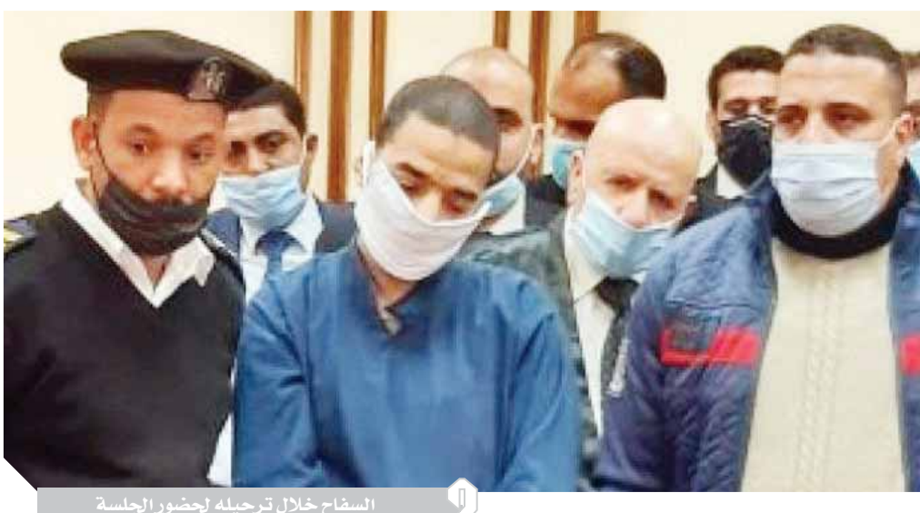
السفاح خلال ترحيله لحضور الجلسة

كتب: عبدالقادر إسماعيل ، أكدت وزارة المالية، عدم فرض ضريبة جديدة للتصرفات العقارية وأنه لا نية لزيادة الأعباء على المواطنين. كما أكدت أن ضريبة التصرفات العقارية تم إقرارها منذ عام ١٩٢٩، وتم خفضها اعتباراً من عام ١٩٩٦ من ٥٪ إلى ٢,٥٪ من قيمة التصرف في العقارات المبنية أو أراضي البناء سواء كان التصرف عليها بحالتها أو بعد إقامة المنشآت أو كان على العقار كله أو جزء منه أو وحدة سكنية منه أو غير ذلك. وأكدت وزارة المالية أن جميع العقارات والوحدات السكنية بالقرى وما يتبعها من كفور ونجوع وعربز مفعاة من ضريبة التصرفات العقارية، وكذلك تصرفات الوارث حتى ٢٥ يونيو ٢٠١٨، في العقارات التي آلت إليه من مورثه بحالتها عند الميراث، إضافة إلى العقار المقدم كحصة عينية في رأس مال