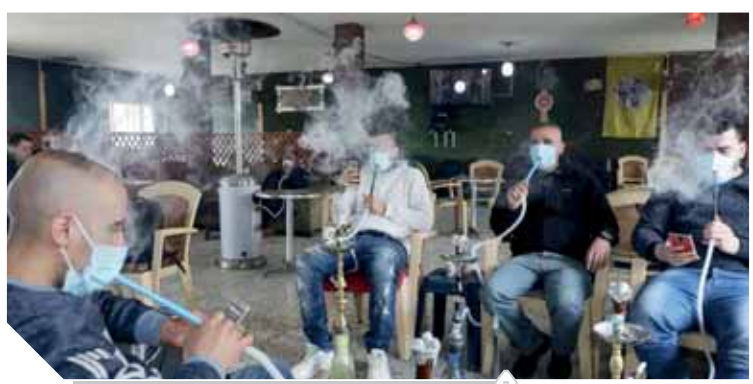
غرف سرية لتدخين الشيشة