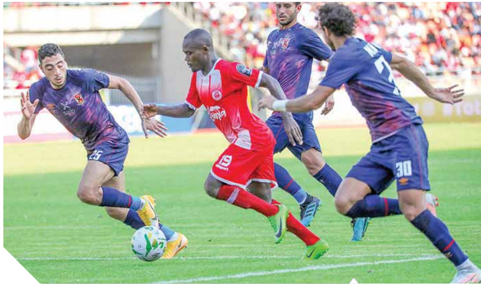
الأهلى خسر أمام سيمبا بدورى الأبطال

وأشار إلى أن الأهلى صادفه سوء حظ كبير فى مواجهة سيمبا ولم يستغل الفرص السهلة التي سنحت له وتحديداً فرصة بواليا وكهريا فى الشوط الثانى وبعض الفرص بالشوط الثانى، مؤكداً أن فرصة التأهل قائمة بقوة لأن الأهلى خاض مباراتين فقط من أصل ٦ مباريات فى دور المجموعات، ولاتزال هناك مباريات مهمة، عليه أن يقاتل فيها لتحقيق الفوز والتأهل.