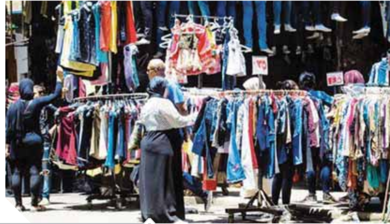
إقبال المواطنين على وكالة البليج

كما أن سعر البطانية وزن يبدأ من ٤ كيلو جرامات يصل سعرها إلى ٣٠٠ جنيه، وسعر بطاتيات غزل