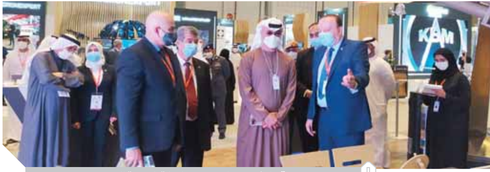
إقبال شديد على معرض الهيئة العربية للتصنيع