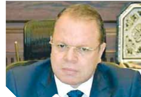
الصاوي بشهادتهم أو تقديم ما بحوزتهم من أدلة فنية تفيد فى كشف الحقيقة، فإن «النيابة العامة» ترى أن توافر هذا المقطع سيكون من شأنه الإسهام فى تحقيق العدالة بهذه الواقعة، ومن ثم فإنها تدعو الكافة إلى تفعيل دورهم المجتمعي الإيجابي، بالمبادرة بتقديم هذا المقطع إلى «النيابة العامة» إما بصورة مباشرة أو الإرسال عبر البريد الإلكتروني.

طلبت النيابة العامة من المواطنين الذين لديهم مقاطع فيديو مصورة لواقعة التعدي على فتاة بفندق فيرومونت نابل سيتي خلال عام ٢٠١٤، بسرعة تقديمها إلى النيابة، مؤكدة ضمان سرية بيانات الشهود ومقدمي هذه الأدلة وحمايتهم، إعمالاً لأحكام الدستور والقانون، وكشفت التحقيقات في الواقعة عن تواتر مشاهدة الكثير مقطعاً لتصوير واقعة التعدي على فتاة بفندق «فيرومونت نابل سيتي» خلال عام ٢٠١٤، وتلقى بعض ممن شاهدوه أو علموا بتفاصيله - وكانوا على صلة بالمتهمين أو المجنى عليها - تهديدات لإثباتهم عن الإدلاء بأقوالهم إلى جهة التحقيق أو تقديم المقطع إليها. وإزاء هذه المخاوف لجأ شخص بحوزته المقطع إلى إنشاء حساب بأحد مواقع التواصل الاجتماعي باسم مستعار، وأرسل عبره صوراً التقطها من المقطع إلى بعض الشهود، ثم أغلق الحساب خوفاً من البلش به، وقدم الشهود تلك الصور إلى «النيابة العامة». وإزاء هذا السلوك عن عدم إحاطة البعض بحقوقهم التي كفلها الدستور والقانون، بشأن ضمان سرية بيانات الشهود وحمايتهم، ومن ثم إجهادهم عن الإدلاء