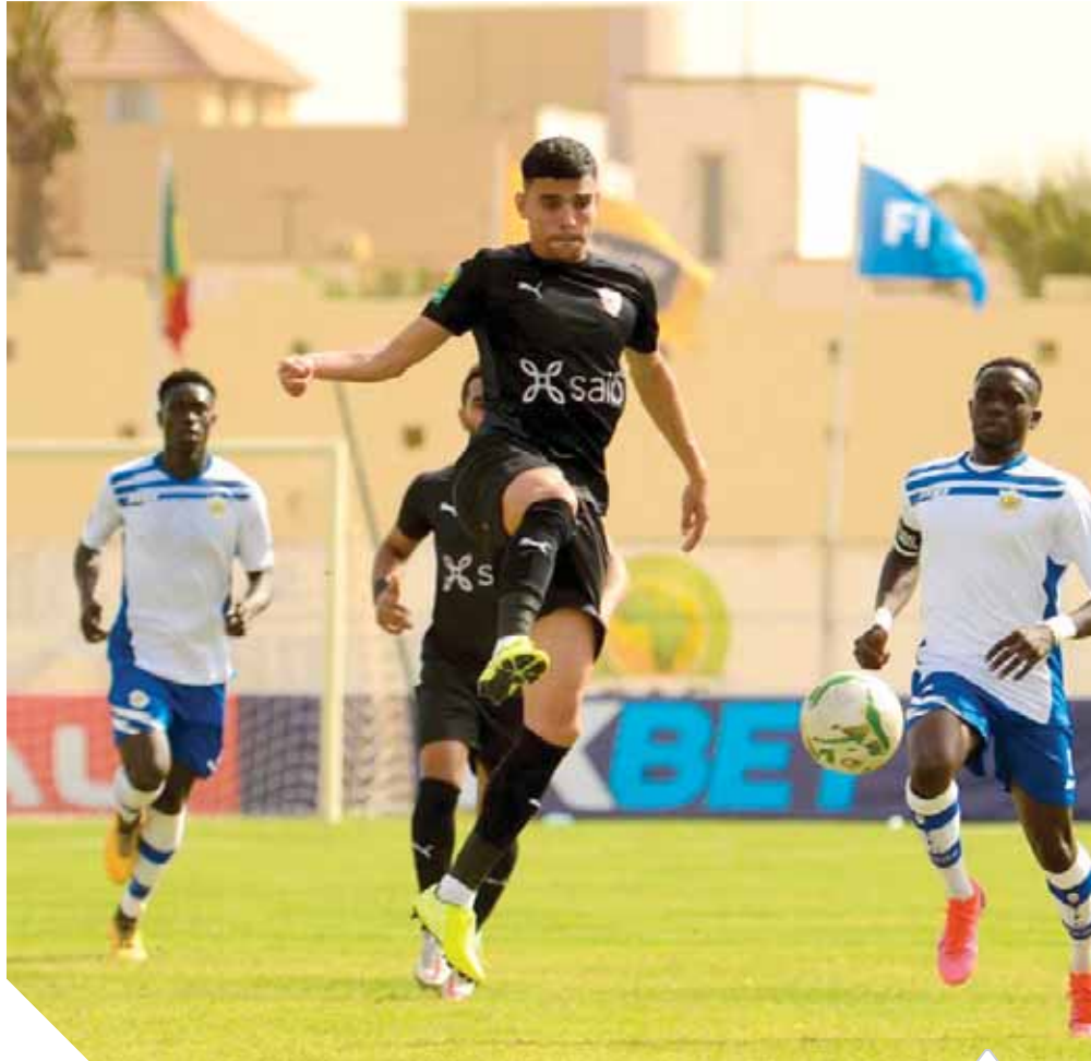
الزمالك قدم أداء جيدا أمام تونجيت رغم التعادل

وأكد المدير الفنى للزمالك أن الفريق عانى مشاكل فى رحلة الطيران، ولكنه قدم مجهودا جيدا فى اللقاء، وشدد على أن الفريق مطالب بالاستمرار فى مشواره نحو المنافسة، وسيلعب للفوز فى المباريات القادمة.