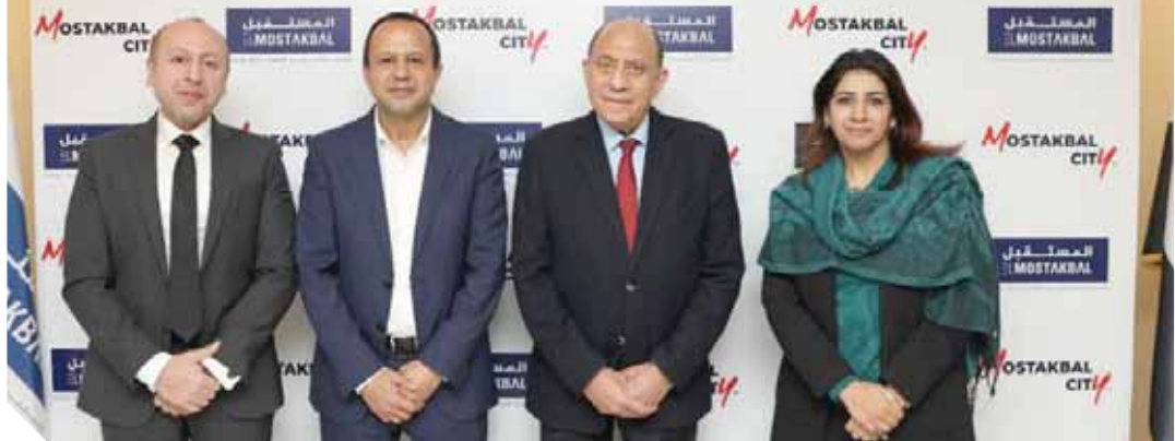
قيادات الشركتين بعد توقيع الاتفاقية

التعاون فى إعداد الدراسات السوقية الاستثمارية والاستثمارية لمشروع مركز خدمات المدينة فى نهاية العام الماضى ٢٠٢٠. ومن الجدير بالذكر، أن مشروع مستقبل سیتی يقدر إجمالى مساحته بـ ١١ ألف فدان تقريباً على خمس مراحل ويتضمن كل التخصصات (سكنى - تعليمى - طبي - تجارى - ترفيهى - إدارى - بنوك - محطات وقود)، ويحتل موقعاً إستراتيجياً بالقاهرة الجديدة حيث يحده شمالاً طريق القاهرة السويس، والطريق الدائرى الإقليمى شرقاً، والطريق الدائرى الأوسطى غرباً، وطريق جنوب المستقبل جنوباً بطول ١١ كيلو متراً وهو الطريق الفاصل بين مستقبل سیتی والعاصمة الإدارية ومحور محمد بن زايد.