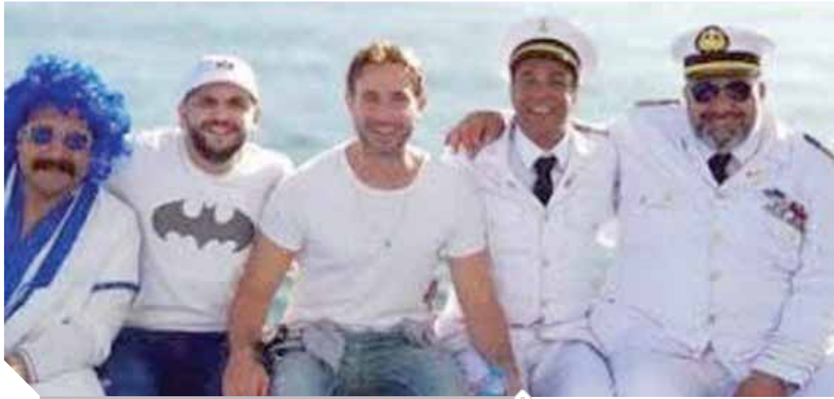
أبطال عمل تماسيح النيل

ليلى علوى تعود بـ «ماما حامل».. و«هنيدى» و«منة» يجتمعان من جديد فى «النمس» والإنس»