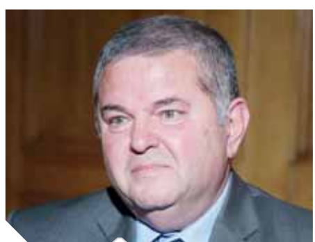
توفيق تقرر طرح فندق شبرد على المستثمرين لتطويره وإعادةه إلى فئة «٥ نجوم»، وأكدت وزارة قطاع الأعمال العام، أن الاتفاق مع مجموعة الشريف القابضة «السعودية»، أنهى العلاقة مع شركة الإدارة «روكفوري» بشكل ودى، وإنهاء القضايا التحكيمية، حيث قام المستثمر بالفعل بسداد مبلغ ٢ مليون دولار «الدفعة الأولى» وقدم شيكاً بمبلغ ٢ مليون دولار والتي تمثل باقى قيمة مبلغ التسوية. وأوضحت أن المستثمر قام بالتعاقد مع المكاتب الاستشارية المسؤولة التي تم الاتفاق عليها مع الشركة القابضة وشركة إيجوت لإدارة المشروع وإعداد التصميمات والرسومات التنفيذية والتصميم الداخلى، تمهيداً لتنفيذ فور صدور التراخيص اللازمة، فضلاً عن التزام المستثمر بتسليم الفندق لشركة إيجوت فى نهاية العقد وبجالة جيدة وفقاً لخطة الإحلال والتجديد المستمرة طوال مدة العقد. وأكدت فى بيان لها أنه توضحياً لما أثير مؤخراً بشأن مشروع تطوير فندق شبرد المملوك لشركة إيجوت

التطوير ثلاث مرات، وجاءت العروض المقدمة بأقل من قيمة التقييم، وفى الطرح الأخير تم الإسناد لمجموعة الشريف القابضة السعودية صاحبة أفضل العروض، وتم توقيع عقد يلتزم فيه المستثمر بتمويل كافة أعمال التطوير والتأثيث اللازمة للفندق ورفع مستوى نوميته إلى خمسة نجوم وفقاً لاشتراطات وزارة السياحة، وذلك فى مقابل توزيع صافى أرباح الفندق بعد خصم حصة شركة الإدارة «ماندرين أوريينثال» صاحبة العرض الأفضل بين شركات الإدارة المتقدمة بين شركة إيجوت والمستثمر، وذلك لمدة العقد ٢٥ عاماً، وتم احتسابها وفقاً للدراسات الاقتصادية التي تمت فى هذا الشأن ورد المستثمر لإلتفاق الاستثمارى بعد ١٧ عاماً من بداية التشغيل بالقيمة الحالية. ووفقاً لعقد المشاركة فإن مسؤولية تدبير التمويل تقع على عاتق المستثمر، ولا يوجد ما يمنع المستثمر من الحصول على اقتراض لتوفير التمويل المطلوب دون أدنى مسؤولية على شركة إيجوت، فالشركة غير مسئولة عن سداد القرض أو عوائده أو رهن أو ضمان لأصول وموجودات الفندق.