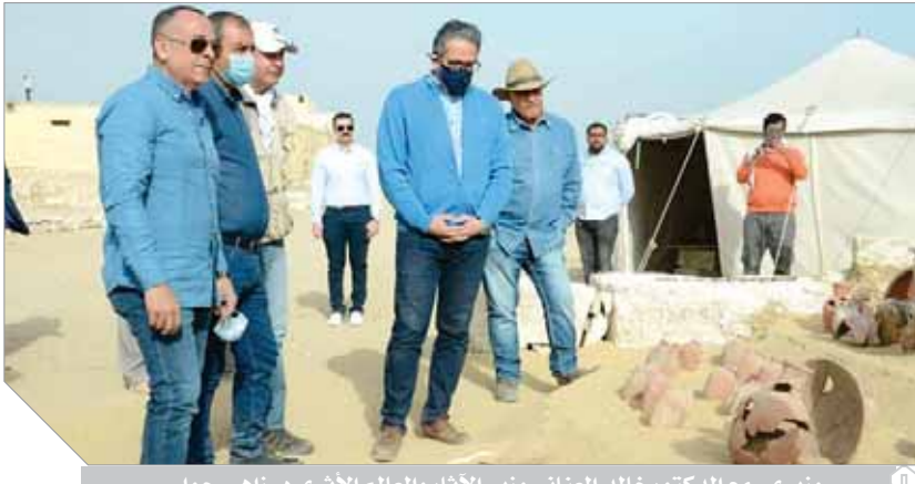
وزيرى مع الدكتور خالد العنانى وزير الآثار والعالم الأثرى د. زاهى حواس

أحد البعثات المصرية التى شرفت برئاستها هى «خبيئة العساسيف»، وهى بعثة مصرية والعساسيف، إحدى العجائب الموجودة فى البر الغربى مثل جبانة دراع ابوتلجا والظرف والحوزة، إلخ، وفرعى مرسى، والعساسيف، وأعلن اكتشافها فى ٢٠١٨، لبعض المقابر تم الكشف عنها عن طريق بعثتنا، وكان هناك ردم يصل إلى حوالى مترين ونقوم بالحفائر، حيث ظهرت مصيدة للبيبة والكهراء، بنزل الزائر منطقتا عامة «عربى، مصرى، ترجع إلى الأسرة ٢٢، والخبيئة تسمى أنها «مستخفية» والخبيئة التى تمت فى مصر قبل ذلك كانت مثل خبيئة الدير البحرى وخبيئة «بابا جوبو» وخبيئة معبد الكرنك ولكنها تم اكتشافها عن طريق البعثات الأجنبية، وهذه أول خبيئة بعد البعثات الأجنبية يتم اكتشافها بإياد مصرية وهى أول خبيئة لتوابيت أدمية كبيرة كمنذ نهاية القرن التاسع عشر عثرا عليها فى حالة جيدة من الحفظ، والحمد لله نقلت إلى قاعة أعيدت خصيصا فى المتحف المصرى الكبير تحت اسم «خبيئة العساسيف»، ومنذ عام ٢٠١٧ تعمل على توثيق ودراسة هذه الاكتشافات بالطرق العلمية السليمة ثم نعمل على نشرها على مستوى العالم، والآن نعمل على مستوى «خبيئة العساسيف» للتعرف على المدارس الفنية التى نعرف من خلالها الزمن الذى