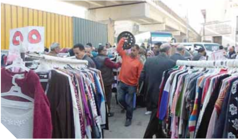
إقبال المواطنين على وكالة البليج

المحلة تبدأ من ٤٠٠ جنيه، وسعر بطانية قطنية طبقه واحدة فرو على التصنيع مستوردة يتراوح سعرها بين ٥٠٠ و ٦٠٠ جنيه حسب المقاس والوزن، وسعر بطانية تركي ٦٠٠ كيلو جرام بـ ٦٠٠ جنيه مقاس ٢٢٠×٢٢٠، وسعر بطانية كوري مستوردة وزن ٨ كيلو مقاس ٢٢٠×٢٢٠ يتراوح بين ٦٥٠ و ٨٥٠ جنيه، وسعر بطانية أكيريك طبقه واحدة مقاس ٢٢٠×٢٢٠ سم بـ ٧٠٠ جنيه، وسعر لحاف دفاية سيرير مايكروفايبر مقاس ٢٠٠×٢٠٠ سم يبدأ من ٤٥٠ ويصل ٦٠٠ جنيه حسب بلد الاستيراد، وبياتيه كوري وزن ٩ كيلو ومقاس وزن ٢٤٠×٢٢٠ تبدأ أسعارها من ٩٠٠ جنيه، والبطانية المصنوعة المحلية التصنيع فعادة ما تصنع في مدينة المحلة والشركات التابعة لغزل المحلة، وتختلف خامات تصنيعها، فمنها الناعم والخشن ومؤخرا ظهرت بطاطين مصرية بجودة عالية، كما أن هناك شراء بطاتين بسعر واحدة، أو عروض البطاطين في الهابيز ماركت، حيث يتم عمل تخفيضات على الأنواع المختلفة من حلول الشتاء سنويا بتخفيضات تصل إلى ٧٥٪.