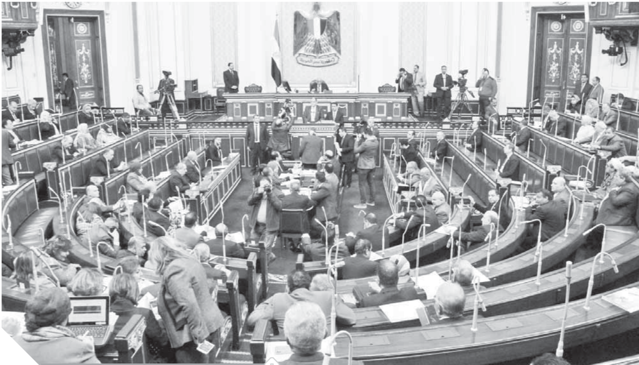
جانب من جلسة البرلمان