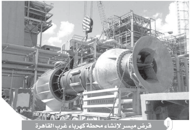
قرض ميسر لإنشاء محطة كهرباء غرب القاهرة

منحة لا ترد لتمويل مشروع المثلث الذهبي في منطقة سفاجا.. ومليار دولار جديدة مخصصات لمصر خلال 3 سنوات