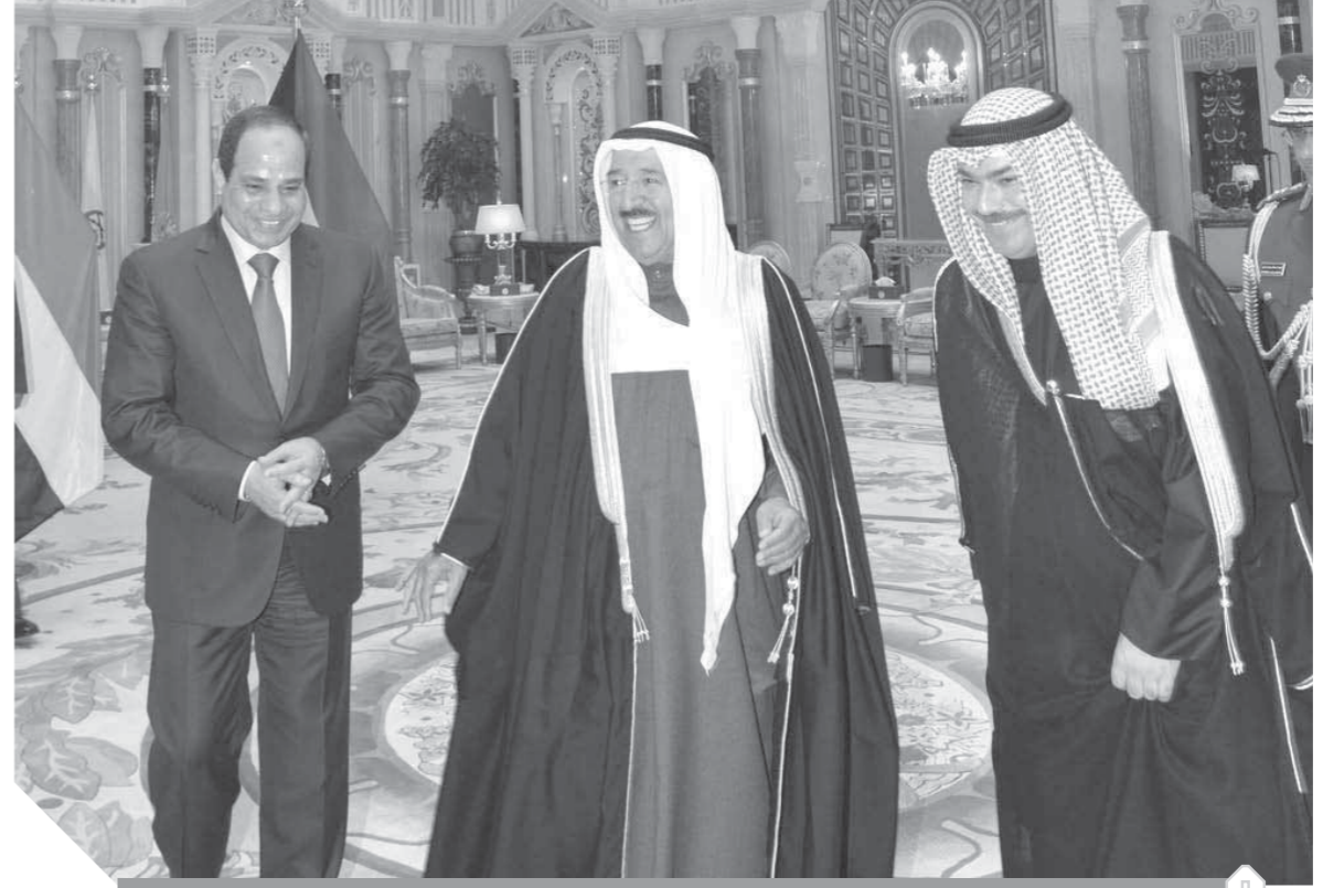
علاقة مميزة بين الرئيس السيسي وأمير الكويت