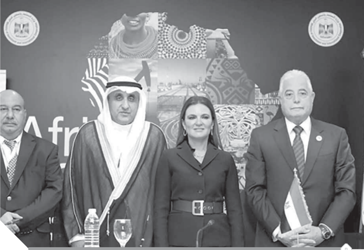
وزيرة الاستثمار ومحافظ جنوب سيناء ومدير عام الصندوق وسفير الكويت بالقاهرة خلال توقيع الاتفاقية